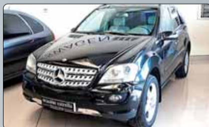
Mercedes ML 280 CDI 4 Matic Año 2007. 10 airbags. ABS. ESP. Climatizador bizona. Tempomat. Navegador. Faros bixenon. Cierre centralizado. Espejos abatibles. Barras en el techo. Cristales tintados.