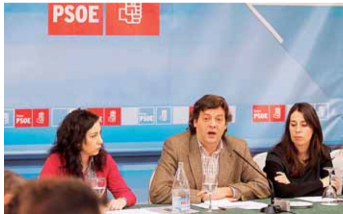
Los responsables socialistas, durante el balance del ejercicio 2010.