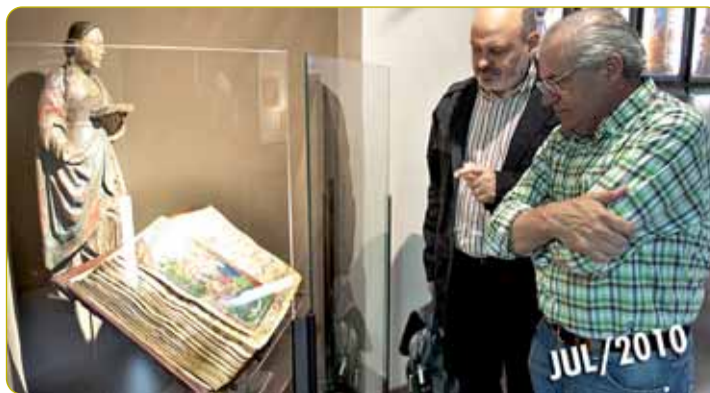
RECORRIDO POR LA EVOLUCIÓN DEL LIBRO DESDE SUS ORIGENES EN EL MUSEO DEL LIBRO FADRIQUE DE BASILEA. La editorial Siloé, arte y bibliofilia, inauguraba el 23 de julio el Museo del Libro Fadrique de Basilea, situado en la calle Travesía del Mercado, 3. Este nuevo espacio cultural permite al visitante conocer la evolución del libro, desde la tablilla de barro seco hasta la tableta electrónica.