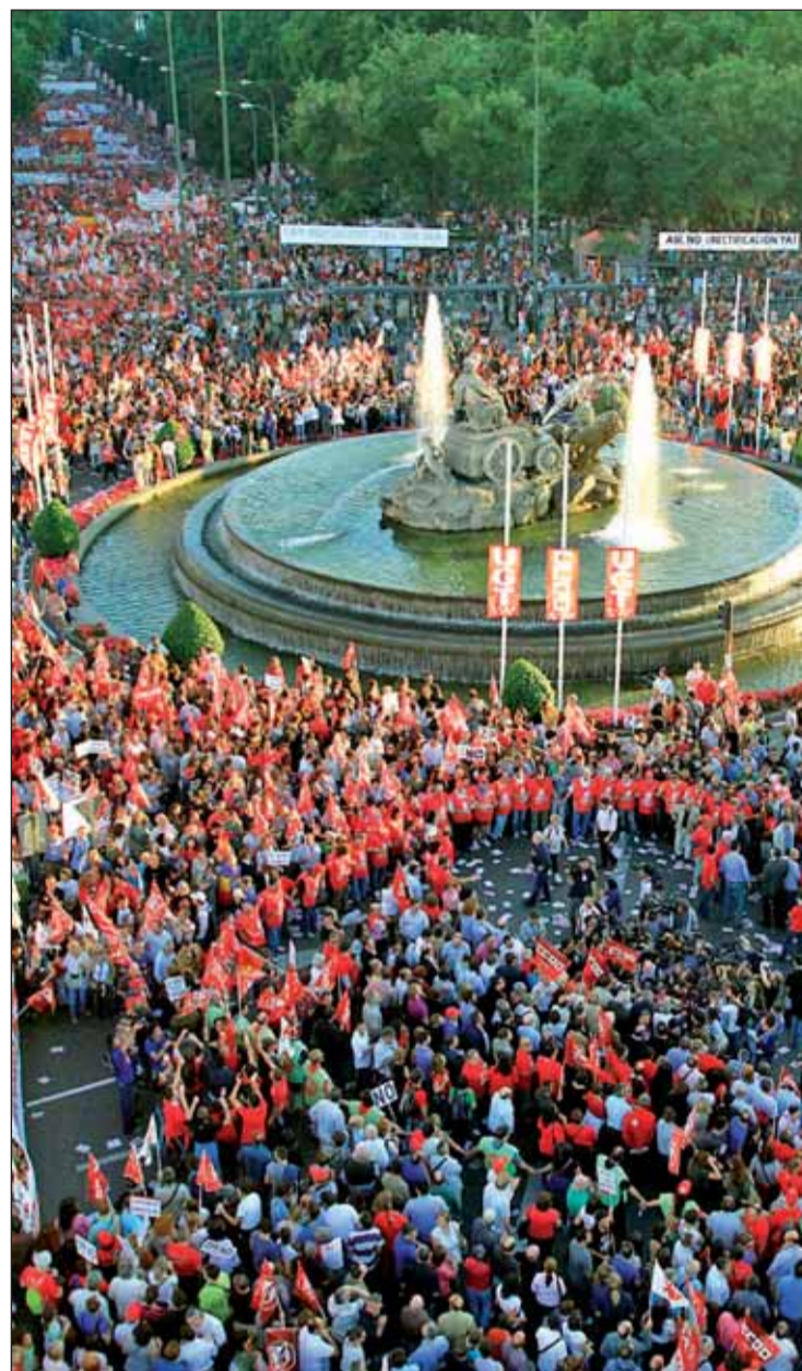
LA VOZ DISIDENTE La aprobación de la reforma laboral, mediante Real Decreto, quebró las conversaciones entre Gobierno y sindicatos, sacando a las calles de las principales ciudades a ciudadanos descontentos por la pérdida de derechos laborales. Muchas voces piden una segunda huelga.

Mientras, en aguas no menos revueltas, Díaz Ferrán intentaba evitar el naufragio de su mandato como presidente de la CEOE. Pero la oleada de denuncias por impago interpuestas por los trabajadores de sus empresas en quiebra, el embargo de sus bienes y su imputación por corrupción en el caso Mar Blau, ahogaron los días de Díaz Ferrán al mando de la patronal y originó una convocatoria anticipada de elecciones, que ha erigido como sucesor a Juan Rosell.