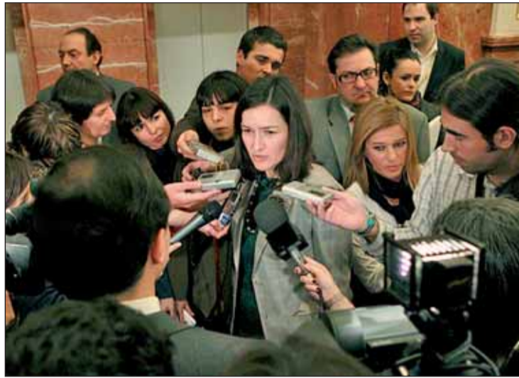
La ministra de Cultura, Ángeles González Sinde

El emplazamiento del nuevo Almacén Temporal Centralizado de Residuos Nucleares está resultando más difícil de lo previsto, ya que la ciudadanía no está dispuesta a aceptar los riesgos que conlleva un almacén de ese calibre y a donde irían a parar los residuos radiactivos de todas las centrales nucleares del país. La candidata con mayores posibilidades sería Ascó, en Tarragona. Otro de los temas controvertidos del año es la nueva Ley del Aborto, que se aprobó el 4 de