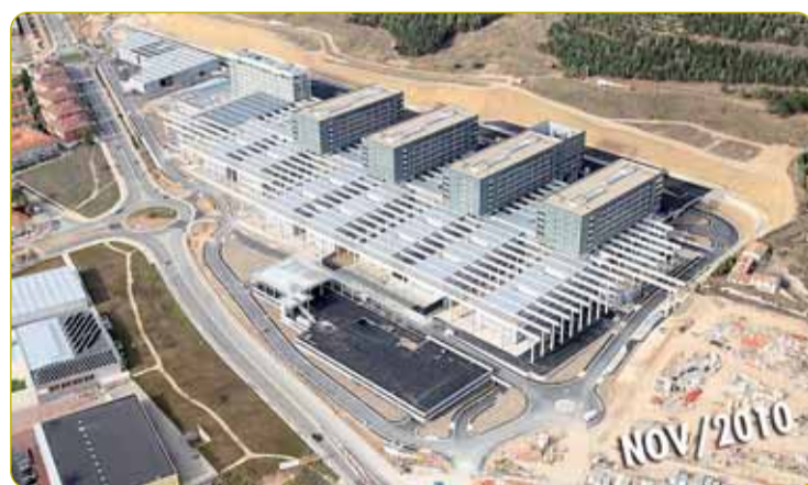
EL NUEVO HOSPITAL RECIBIRÁ A LOS PRIMEROS PACIENTES EN PRIMAVERA. La visita que los medios de comunicación realizaron el 25 de noviembre al nuevo Hospital Universitario de Burgos permitió conocer de primera mano las dimensiones del que será el centro sanitario más grande de Castilla y León. El equipamiento comenzará en enero y su entrada en funcionamiento está prevista para la próxima primavera.