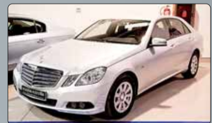
Mercedes Benz Clase E 250 CDI Año 2009. 10 airbags. ABS. ESP. Bass. Pre-safe. Asientos calefactados. Partronic con ayuda al aparcamiento. Cargador de CD's con MP3 y salida auxiliar. Climatizador bizona. Sensor de lluvia y de luz. Tempomat. 2 años de garantía.