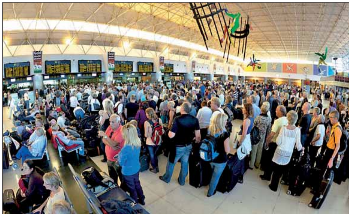
Centenares de afectados por el conflicto de los controladores aéreos EFE

El 2010 también ha sido un año convulso para el tráfico aéreo. Los temporales de nieve y frío de principios de año fueron sólo el comienzo de los retrasos y cancelaciones en los aeropuertos españoles, que tuvieron uno de sus momentos más complicados en abril y mayo. La nube de cenizas volcánicas suspendidas en la atmósfera europea tras la erupción el pasado 20 de marzo del Eyjafjallajökull en Islandia supuso la cancelación de cerca de cien mil vuelos que afectaron a 1,2 millones de viajeros del continente. El sector turístico español cifró en más de 250 millones de euros las pérdidas económicas ocasionadas por el volcán, mientras las aerolíneas aseguraron haber perdido más de 1.200 millones de euros. Pero las inclu-