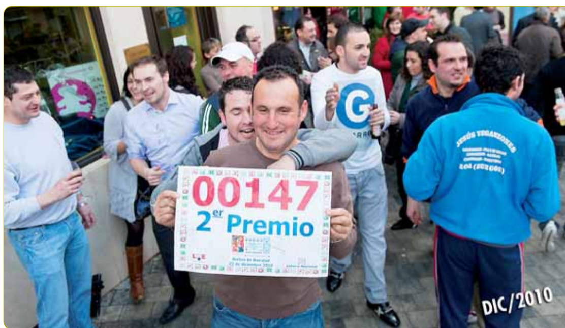
EL SORTEO DE NAVIDAD DEJÓ 58 MILLONES EN ROA. El Sorteo Extraordinario de Navidad hizo escala en la localidad ribereña de Roa y repartió entre sus habitantes 58 millones del segundo premio, el 00147.