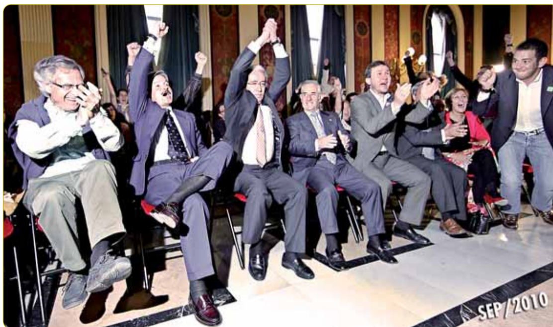
LA R-EVOLUCIÓN CONTINÚA. 30 de septiembre. El proyecto de Burgos 2016 resultó elegido por el jurado de selección de las ciudades candidatas a conseguir la Capitalidad de la Cultura Europea en 2016. Tendrá que competir con Córdoba, San Sebastián, Segovia, Las Palmas y Zaragoza. El nombre de la ganadora se conocerá en julio de 2011.