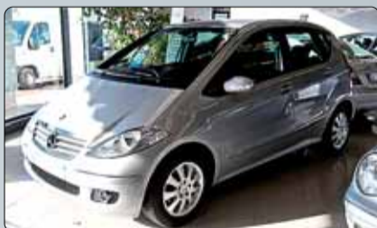
Mercedes Clase A 180 CDI Elegance Año 2005. 4 airbags. ABS. ESP. Climatizador. RadioCD. Espejos abatibles. Preinstalación de teléfono. Llantas de aleación.