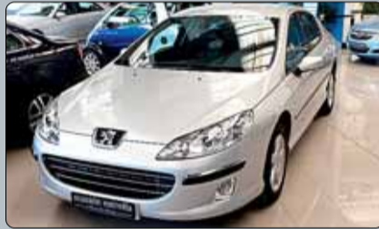
Peugeot 407 HDI 136 cv. Año 2007. 10 airbags. ABS. ESP. RadioCD con Mp3. Llantas de aleación. Control de velocidad de cruce. Pintura metalizada. Climatizador. Espejos eléctricos y calefactados.