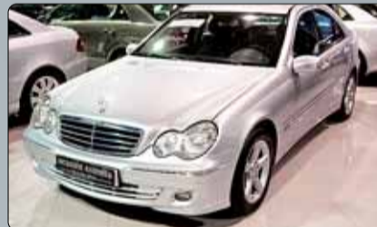
Mercedes Clase C 220 CDI Avangarde Año 2006. 8 airbags. Cambio automático. Navegador. Tapicería mixta tela-cuero. Climatizador bizona. Tempomat. Espejos abatibles. Elevalunas.