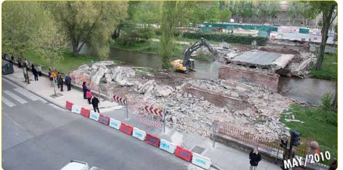
ADIÓS AL PUENTE GASSET. El lunes día 3 de mayo comenzaron los trabajos de demolición del puente Gasset. Tras siete meses de obras, el nuevo puente de la Evolución se restablecía al tráfico de forma provisional, con la apertura de un carril en cada sentido.