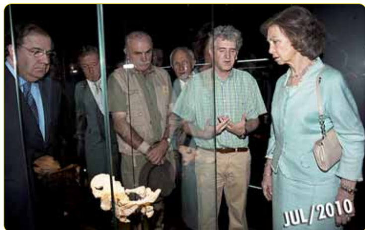
CIENCIA Y CULTURA EN EL MEH, UN MUSEO ÚNICO EN EL MUNDO. Su Majestad la Reina Doña Sofía fue la encargada de inaugurar el 13 de julio el Museo de la Evolución Humana. Amante y estudiosa de la arqueología, Doña Sofía se mostró sorprendida y maravillada y afirmó sentirse "parte del equipo".