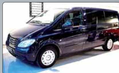
Mercedes Vito Combi L Año 2008. 2 airbags. ESP. ABS. Climatizador. Cristales tintados. RadioCD. 9 plazas. Paragolpes y molduras del mismo tono que la carrocería. 4 elevalunas. Cierre centralizado. 2 años de garantía.