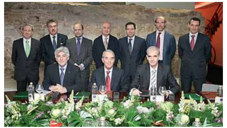
Integrantes del Consejo de Administración de Caja 3, que celebró el día 29 en Mérida su primera reunión.