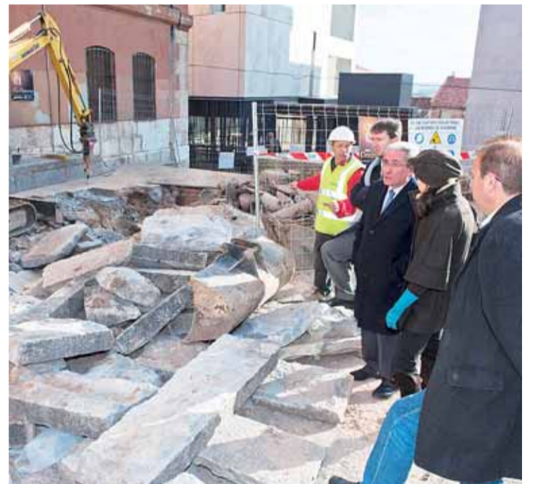
Las escaleras mecánicas en la subida de Saldaña estarán operativas en torno a Semana Santa.

Las obras, adjudicadas a la UTE CPA S.L.- Construcciones José Piedra, incluyen también el cambio y la mejora de las redes de saneamiento, abastecimiento, alumbrado, gas, electricidad y telecomunicaciones "para que sean comparables a las del resto de la ciudad" y la retirada del cableado aéreo. En la actualidad, ya se ha ejecutado un 10% del proyecto, cuyo ámbito de actuación se sitúa en la plaza de Pozo Seco, calles Alvar Fañez y Hospital de los Ciegos y entorno de la iglesia de San Esteban.