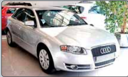
Audi A4 2.0 TDI Año 2007. 8 airbags. ABS. ESP. Climatizador. Dirección asistida. Cierre. Elevalunas. ESP. Volante multifuncional.