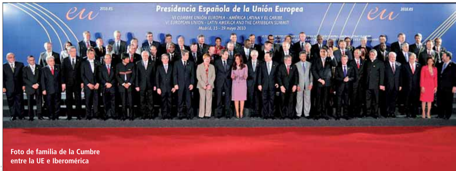
Foto de familia de la Cumbre entre la UE e Iberoamérica