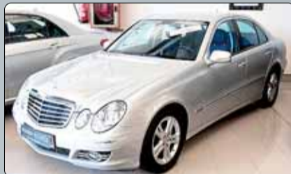
Mercedes E 220 CDI Avangarde 170 cv. Año 2006. 8 airbags. ABS. ES. Climatizador bizona. RadioCD. Cargador CD's. Cierre centralizado. Elevalunas. Faros bixenon. Preinstalación de teléfono. 2 años de garantía.