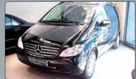
Mercedes Viano CDI Año 2010. Dirección asistida. Cierre. Elevalunas. Volante multifuncional. Bluetooth. Cuero. Climatizador. Llantas. Barras en techo. Sensor de luz. 2 años de garantía.