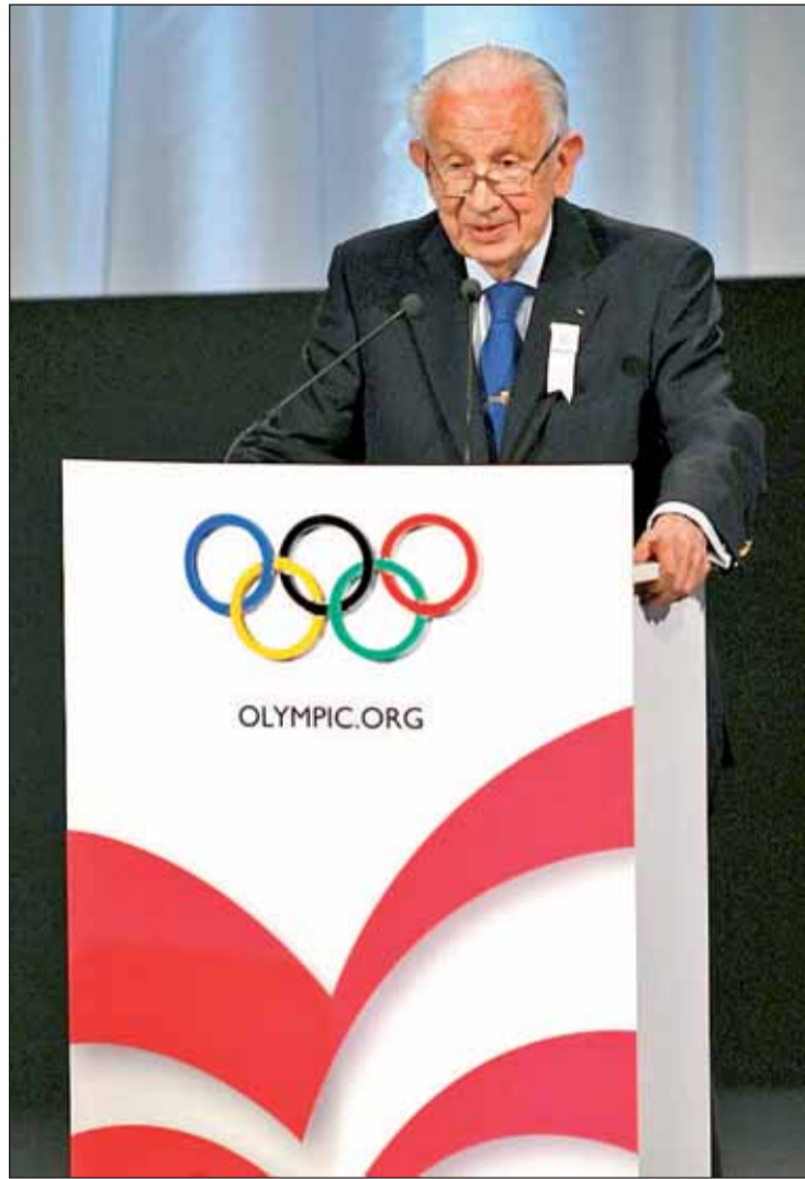
Juan Antonio Samaranch nos dejó el pasado mes de abril

Igualmente, 2010 se ha erigido como el año en el que cayó la imagen de un mito, el profesor Neira, quien sufrió una recaída de salud varios días después de que fuera hallado sin vida el