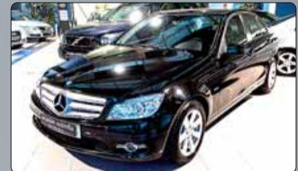
Mercedes C 220 CDI Año 2009. 10 airbags. ABS. ESP. Climatizador bizona. Navegador. Salida USB. Partronic. Cierre centralizado. Llantas de aleación. Pintura metalizada. RadioCD. Manos libres. 2 años de garantía.