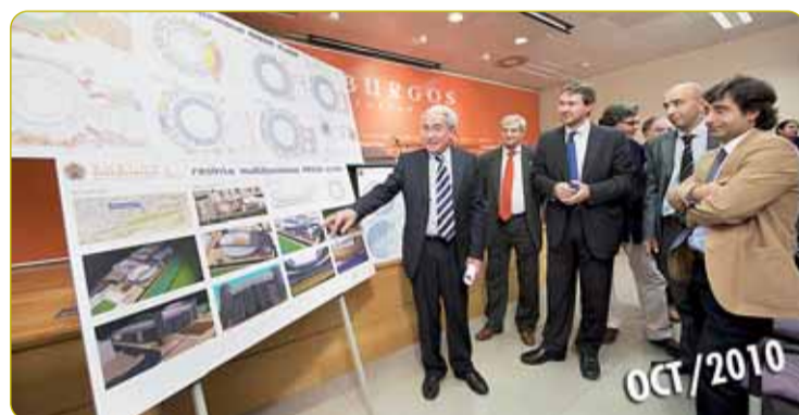
TOROS, MÚSICA Y DEPORTE EN EL 'ARENA PLAZA'. El 7 de octubre, el alcalde de Burgos, Juan Carlos Aparicio, presentaba el anteproyecto del pabellón 'Arena Plaza', un edificio multifuncional que costará 14 millones y tendrá un aforo de 11.000 localidades.