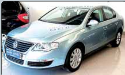
Volkswagen Passat 2.0 TDI Año 2006. 140 cv. 10 airbags. Navegador. Cargador CD's. Climatizador bizona. Elevalunas. Llantas aleación. Pintura metalizada. Espejos eléctricos y calefactados.