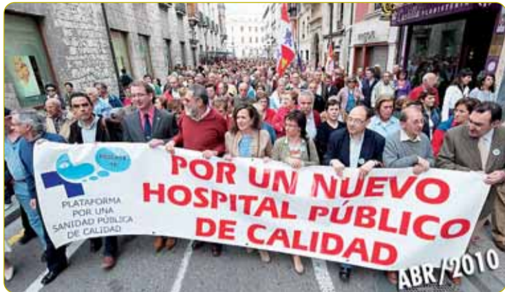
RECLAMAN MEJORAS EN EL SISTEMA SANITARIO. Más de 12.000 personas salieron a la calle el 29 de abril para reclamar una sanidad pública "de calidad" y el rescate de la gestión económica del nuevo hospital.