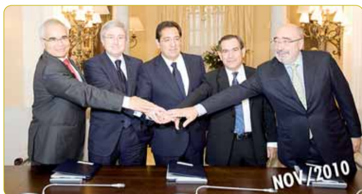
CAJASOL, TAMBIÉN EN BANCA CÍVICA. Los presidentes de Banca Cívica, constituida el pasado 7 de abril por Caja Navarra, Caja Canarias y Caja de Burgos, firmaron el 19 de noviembre en Sevilla un protocolo de integración con el presidente de Cajasol que sitúa a Banca Cívica en la 6ª posición del ranking de cajas.