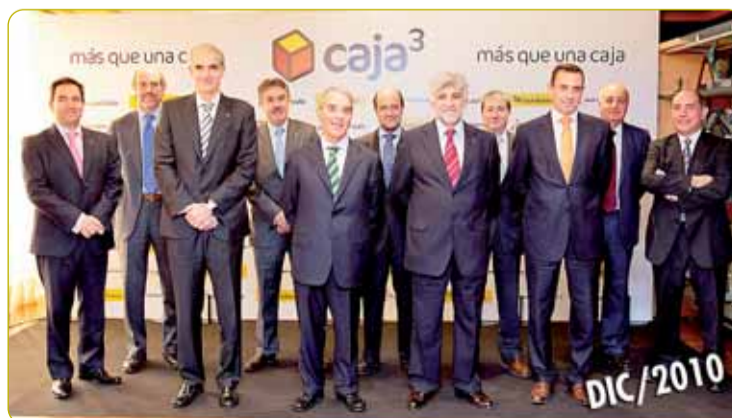
CAJACÍRCULO SE INTEGRA EN EL GRUPO CAJA 3. La sociedad central del Grupo Caja3, integrado por Caja Inmaculada, Cajacírculo y Caja Badajoz a través de un Sistema Institucional de Protección (SIP), quedó constituida formalmente el 22 de diciembre en Zaragoza. El nuevo Grupo Caja3 comenzará a operar el 1 de enero de 2011. Dispone de una red de 598 oficinas y una plantilla de 2.902 empleados.