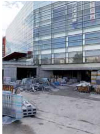
El Auditorio y Palacio de Congresos acapara la mayor partida inversora, 7,8 millones.

En declaraciones a Gente en Burgos, Ibáñez ha precisado que en la elaboración de los presupuestos de 2011, además del escenario de crisis en el que nos en-