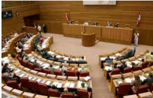
El Pleno de las Cortes se desarrolló durante el martes y el miércoles.

Durante el debate PP y PSOE se enzarzaron sobre quién tiene que convencer al Gobierno gallego de Alberto Núñez Feijoo para que retire un recurso que puede tirar por la borda el acuerdo alcanzado el pasado viernes entre el Ejecutivo central, los sindicatos, Carbounión y las empresas eléctricas, que finalmente