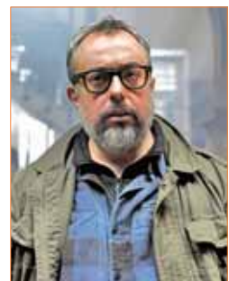
Álex de la Iglesia, genio y figura

Un dramático rodaje sobre la explotación de la corona española en territorios indígenas tras la llegada de Colón centra el argumento de este filme dirigido por Iciar Bollain, que posee 13 nominaciones. Entre ellas, la de Alberto Iglesias a mejor música original. Si se lleva el Goya, sería el noveno en su cuenta, un número inalcanzable.