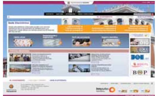
Página web donde se podrán hacer las gestiones.

Las acciones tendrán la misma validez que los documentos sellados en la sede física del registro municipal, ubicada en la plaza de