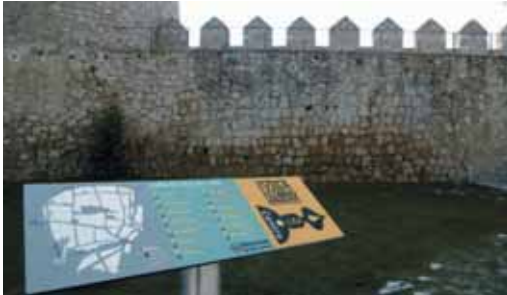
La Villa del Libro de Uruñea será uno de los centros promocionados.