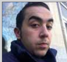
DISCOTECA KERALA