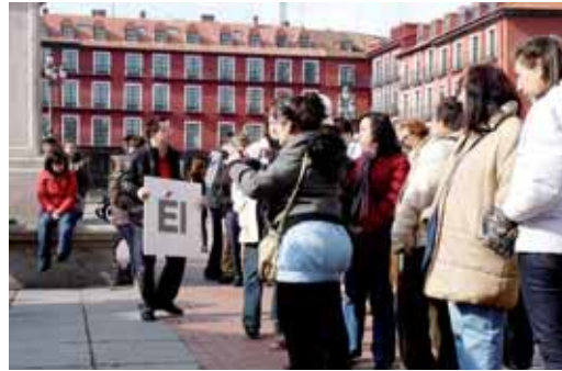
Más de 300 vallisoletanos participaron en el casting.

Numerosos vallisoletanos se acercaron hasta el lugar donde el fotógrafo realizaba las instantáneas.