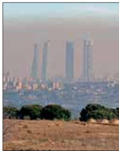
Polución en Madrid

La Fiscalía de Medio Ambiente ha iniciado su propia cruzada contra la contaminación del aire en las principales ciudades del Estado como Madrid o Barcelona, donde investigará dónde y cómo se realiza la medición, entre otros, de las tasas de dióxido de nitrógeno y el ozono. No obstante, estas urbes cuyos niveles de polución superan los máximos exigidos por la UE para garantizar la salud pública no serán las únicas donde la Fiscalía pida explica-