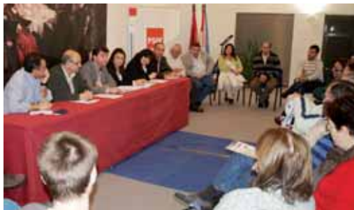
Momento de la reunión de trabajo mantenida en Medina del Campo.