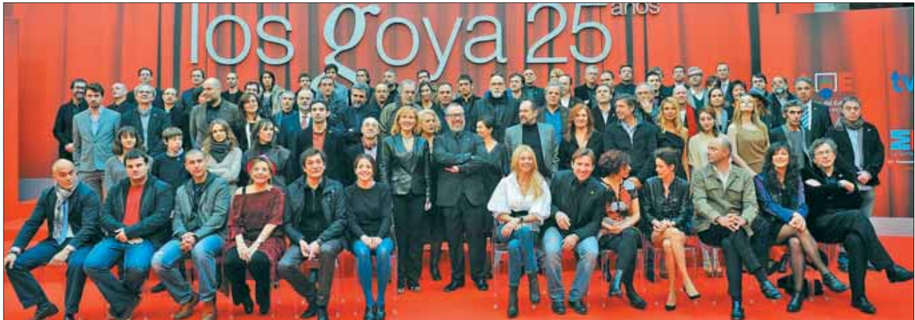
Gran parte de los nominados a esta edición de los Goya se reunieron a mediados de enero