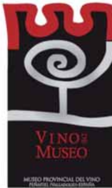
Logotipo del Premio.

Las bodegas podrán presentar cualquier tipo de vino: blancos, blancos con crianza, rosados, tintos, tintos con crianza, espumosos, dulces etc... Además del premio del vino ganador habrá dos accesit, que serán de los dos tipos de vinos diferentes al ganador.