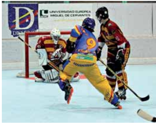
El jugador del CPLV durante un encuentro anterior.

Ocho equipos participarán en la competición masculina. El CPLV Dismevea se verá las caras en el cruce de los cuartos de final con el Finalista Copa de SAR El Príncipe (que se disputa este fin de semana) el sábado 19 a las 11.00 horas. El resto de los cruces son Calfer Solar Tres Cantos PC - Tenerife Guanches; Rubi Cent Patins - Las Palmas de Gran Canaria y Espanya HC contra el campeón Copa de SAR El Príncipe. Las semifinales se jugarán en la tarde del sábado (19.30 y 21.00 horas) y la gran final el domingo