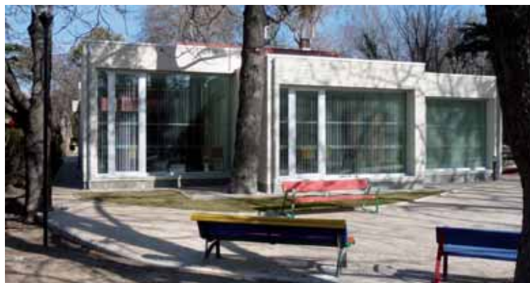
Vista panorámica del Centro de Mayores Delicias después de las reformas.

Además, las salas existentes se distribuyen entre vestíbulos,