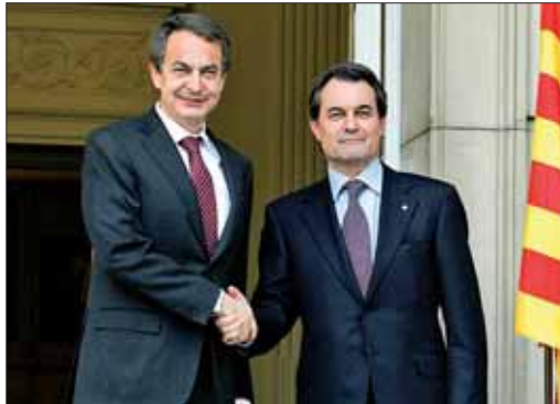
Rodríguez Zapatero con Artur Mas en la Moncloa

Así, todas las regiones que hayan superado el techo marcado de déficit por parte del Estado para 2010, fijado en el 2,4 por ciento, y precisen de nuevas líneas de crédito para refinanciar su deuda podrán acceder a nue-