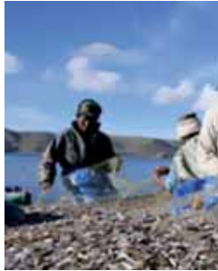
Detalle de la exposición.

■ La Fundación Codespa, una ONG que lleva 25 años trabajando en los países en vías de desarrollo, presenta la exposición 'La mujer como motor de desarrollo en América Latina'. La muestra, que estará abierta al público en el Centro de Igualdad de la Junta (plaza Tenerías, 11) hasta el 8 de marzo, Día Internacional de la Mujer, quiere mostrar a través de medio centenar de instantáneas el papel de las féminas en los países más desfavorecidos de América Latina.