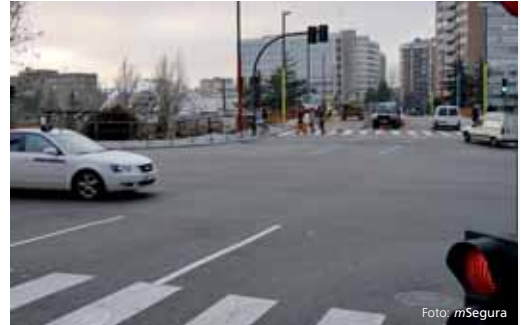
Paseos de peatones en el cruce del Paseo de Isabel la Católica.

Cuatro de cada diez conductores no respetan los pasos de peatones mientras cruza una persona, y uno de cada tres viandantes, a su vez, atraviesan la calle por lugares prohibidos en la capital vallisoletana. Tal y como se desprende de un estudio de la Organización de Consumidores y Usuarios (OCU) que visitó 36 ciu-