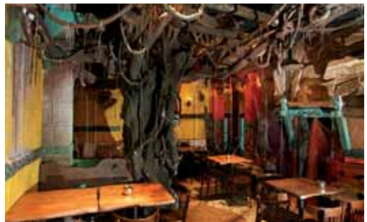
Interior del Restaurante 'El Desierto Rojo'.