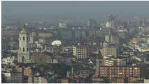
Los ecologistas han denunciado la situación del cielo vallisoletano.

Sin embargo, Ecologistas en Acción (EA) advirtió de que las cosas no se están