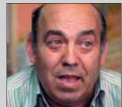
PAULINO TEJERO BAR EMBAJADORES

El Doctorado es el típico bar de estudiantes ideal para desayunar o almorzar. Enfrente de la Facultad de Medicina ha visto como los clientes que antes iban a fumarse el cigarro a su establecimiento ahora lo hacen en la puerta de la Facultad, "ya que les da lo mismo". "Se debería haber puesto en vigor en verano, no ahora, justo después de Navidades que es mala época y encima en plena crisis. Ves a mucha gente enfadada que ya ni quiere ir a los bares. Notó un bajón de un 25%".