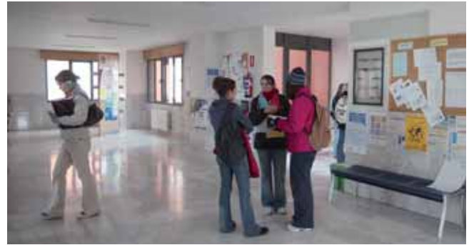
Varios jóvenes conversan en el aula de idiomas de la Universidad.

En la Escuela Oficial de Idiomas hay actualmente 444 alumnos en los tres cursos que se imparten