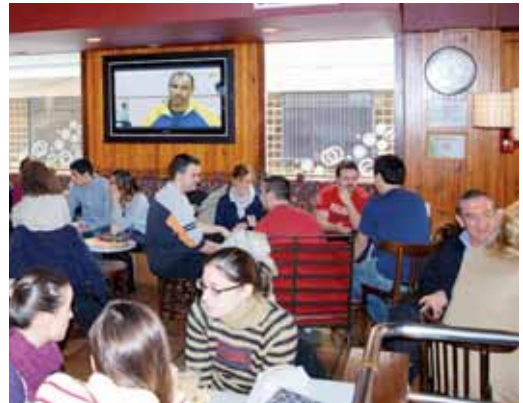
Clientes desayunan en el interior del bar El Doctorado.

Los bares de copas siguen siendo los que más acusan esta medida. "No quiero que la gente se tome 16 copas, pero es cierto que al salir a la calle a fumar, una