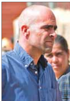
Tosar pugna por su cuarto Goya.

La situación adquiere tintes surrealistas, ya que Álex de la Iglesia acude a los Goya con la película que posee mayor número de nominaciones a estos galardones por 'Balada Triste de Trompeta' (15). 'Pa Negro', de