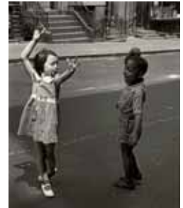
Imagen de la exposición.

■ La exposición 'Helen Levitt. Lírica Urbana', formada por más de un centenar de obras creadas por la mítica fotógrafa americana, ya se puede ver en la Sala Municipal de Exposiciones San Benito. Helen Levitt (Nueva York, 1913-2009) ha sido "quizá la última superviviente" de entre los grandes protagonistas del periodo inaugural de la fotografía moderna de antes de la II Guerra Mundial. Su trabajo arranca, a mitad de los años 30 y se prolonga durante todo el siglo.