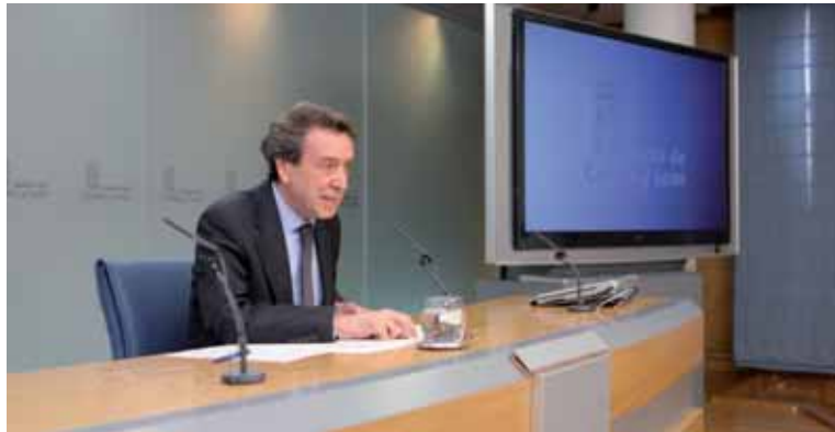
José Antonio de Santiago-Juárez durante la rueda de prensa posterior al Consejo de Gobierno.

"El Gobierno autonómico ha demostrado reiteradamente su apuesta por la mejora de las infraestructuras de la región. El anticipo de las inversiones previstas en este campo supone continuar con esta política", sentenció el consejero de la Presidencia y portavoz.