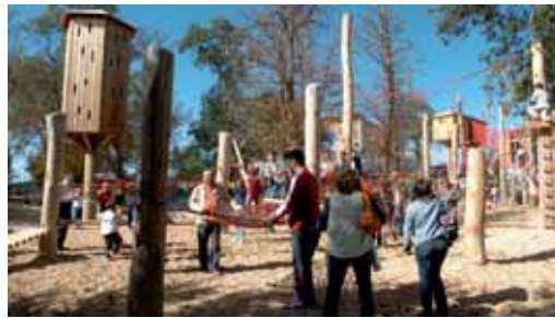
Niños y mayores disfrutan de varios de los juegos de cuerdas del parque.

Sin embargo, este año las actuaciones no se han limitado a la conservación del parque. La Diputación ha instalado una pista multideportiva, con un presupuesto de 40.000 euros y que estará finalizada en el mes de abril. Nueva instalación que se suma a las zonas de descanso y recreativas del parque y a los más de 60 juegos existentes, algunos de los que pueden utilizar personas con