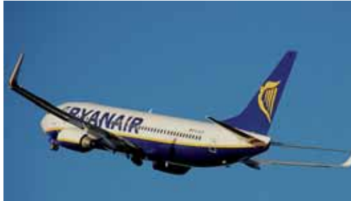
Avión de la compañía irlandesa Ryanair.

Las malas noticias llegarán para los vallisoletanos que viajaban directos a Alemania. Ya que la compañía irlandesa retirará el vuelo de Dusseldorf a partir del 26 de marzo. Una decisión que