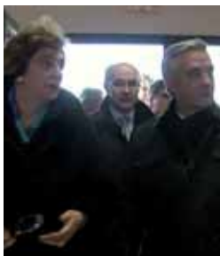
Momento de la inauguración.

Medina de Rioseco fue el lugar elegido para la firma del protocolo de colaboración entre la Junta, la Diputación, el Ayuntamiento riosecano y la Sociedad Pública de Medio Ambiente para la mejora del abastecimiento de agua potable desde la Estación de Tratamiento de Agua Potable (ETAP) de Medina de Rioseco hasta 14 municipios de la zona. Los municipios que se beneficiarán de este acuerdo son Barcial de la Loma, Berrueces, Cabrereros del Monte, Morales