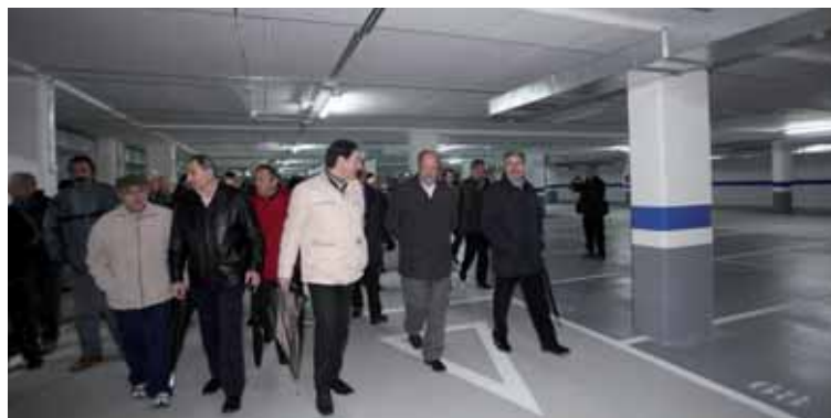
Momento de la inauguración del nuevo aparcamiento situado en el barrio de La Victoria.

La inauguración del último tuvo lugar en el barrio de La Victoria en la plaza de la Solidaridad y la calle de los Comuneros de Castilla, con 274 plazas distribuidas en tres sótanos. Del total, doce serán para minusválidos , y otras 14 para motocicletas, que se distribuyen en los sótanos segundo y tercero. En concreto, la planta primera alberga 91 plazas (cuatro de minusválidos); la segun-