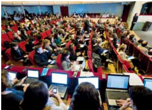
Aspecto que presentaba el patio de butacas del teatro durante el congreso.