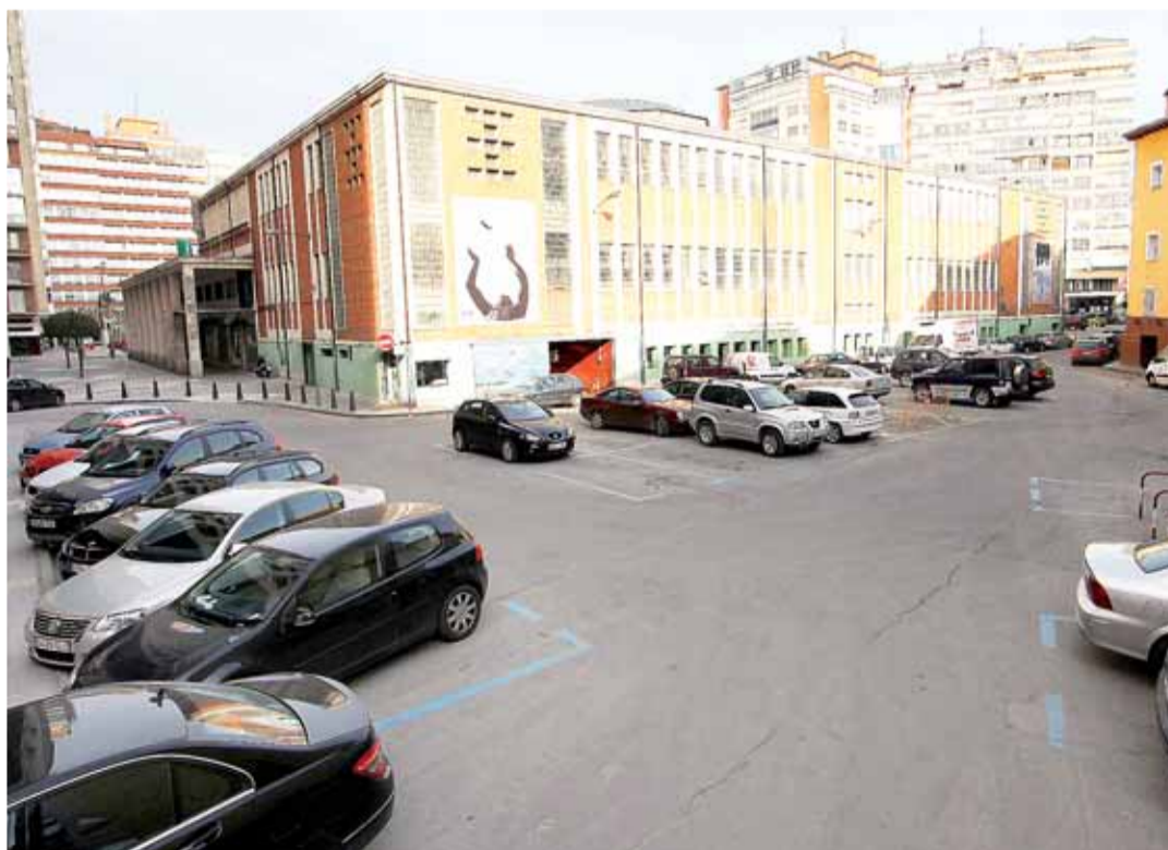
La calle Hortelanos cambiará de sentido el martes día 15. Se accederá por la calle San Lesmes y se saldrá a la Avenida del Cid.

La medida entrará en vigor el martes día 15 permitirá facilitar el tránsito en la zona y una mayor agilidad de tráfico. De esta forma, los conductores no tendrán que dar la vuelta por la calle Victoria, Avenida del Cid y calle Santander y el circuito a realizar será más breve. Aquellos automovilistas que quieran aparcar en la calle Hortelanos y no lo consigan en un primer intento podrán hacer un segundo con tan solo dar la vuelta por la Plaza España