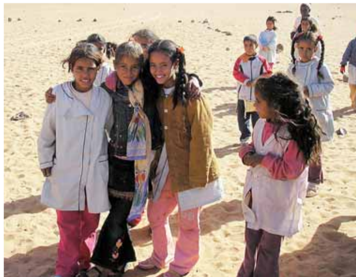
La población saharauí es una de las más necesitadas del planeta.

manifestó que en los últimos años se ha notado un incremento de trabajos relacionados con la mejora de las condiciones de vida de la mujer en distintos países. "La mujer es una pieza fundamental en la economía doméstica de todos los países del mundo. Hemos tenido casos de mujeres que con una rudimentaria máquina de coser han sido capaces de crear un taller y con ello un negocio familiar con el que viven el resto de sus familiares", indicó.