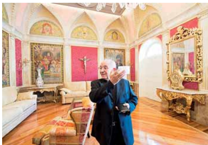
Se construyó en 1916 y ha sido rehabilitado en dos fases.

Los trabajos que se han ejecutado en el edificio se realizaron en dos fases, que han contado con un presupuesto de 2,4 millones de euros, de los cuales Caja de Burgos aportó 1,6 millones y el resto ha sido aportado por el Ayuntamiento, particulares y la propia Diócesis. En la primera se acometió la reforma de la cubierta y la fachada, para lo que se cambió el antiguo tejado árabe por una cubierta de