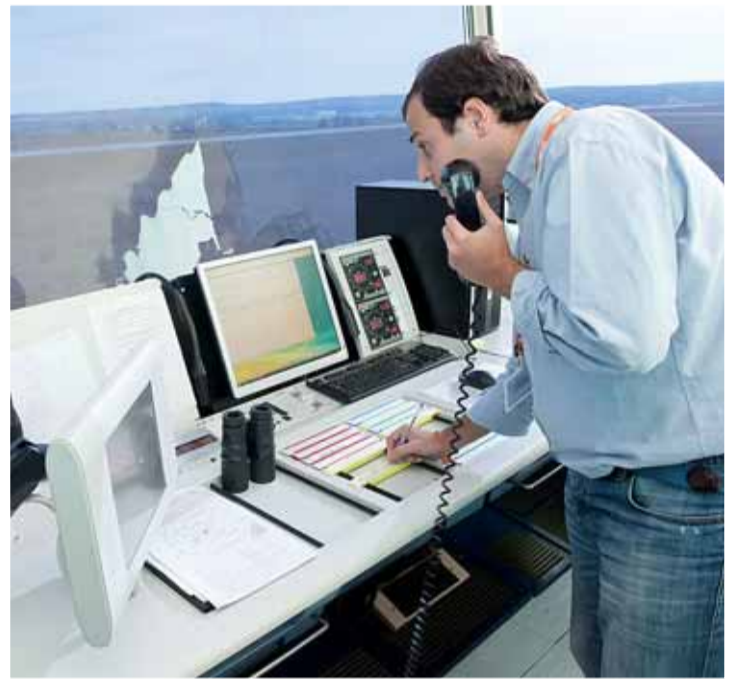
El vuelo 8716 es el primero que lo ha utilizado. En la imagen uno de los operadores AFIS trabajando en el aeropuerto de Burgos.

Desde ahora, el aeropuerto cuenta con un nuevo modelo que se basa en la implantación de un sistema de comunicación que conecta las órdenes de un aeropuerto externo, como Madrid o Vitoria, con el piloto de la nave. La labor del operario AFIS no es otra que la de ofrecer al piloto la información necesaria sobre las condiciones atmosféricas y otros factores externos para que el piloto tome la decisión de despegar o aterrizar. "La responsabilidad última es del piloto, nosotros somos meros transmisores de información",