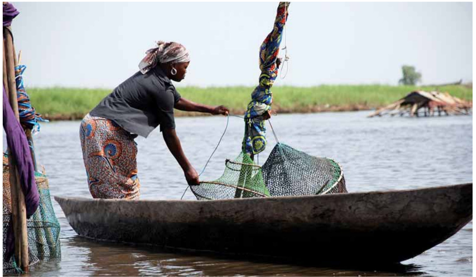
La Casa Grande de Benín es una de las ONGD's que más proyectos ha desarrollado en los últimos años para mejorar al vida del país africano.

El enlace que la organización tiene en el país en el que se acomete el proyecto es el encargado de contratar a las personas que van a llevar a cabo el mismo y de ir informando puntualmente a sus compañeros de Burgos para que