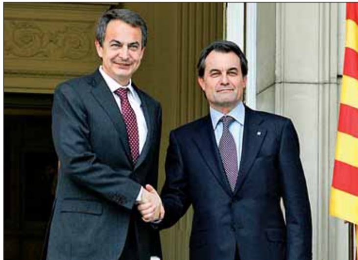
Rodríguez Zapatero con Artur Mas en la Moncloa

Así, todas las regiones que hayan superado el techo marcado de déficit por parte del Estado para 2010, fijado en el 2,4 por ciento, y precisen de nuevas líneas de crédito para refinanciar su deuda podrán acceder a