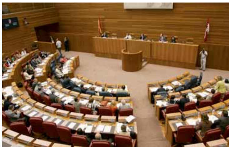
El Pleno de las Cortes se desarrolló durante el martes y el miércoles.

Durante el debate PP y PSOE se enzarzaron sobre quién tiene que convencer al Gobierno gallego de Alberto Núñez Feijoo para que retire un recurso que puede tirar por la borda el acuerdo alcanzado el pasado viernes entre el Ejecutivo central, los sindicatos, Carbounión y las empresas eléctricas, que finalmente