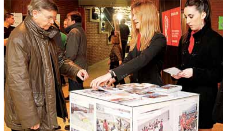
Aficionados recogen información de la ciudad con las azafatas del club.

Varios aficionados tuvieron la oportunidad de llevarse mediante sorteo previo lotes con productos típicos de la tierra. Morcillas de Burgos, caldos de Ribera, queso fresco de Burgos y pastas elaboradas por La Flor Burgalesa junto