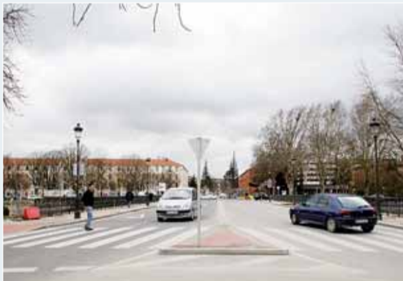
El puente Castilla, tras las recientes obras de ampliación.

vez que han ganado en diseño y seguridad. Asimismo, se ha procedido al acondicionamiento y limpieza de los materiales con los que fueron construidos. Un canto a la modernidad sin olvidar la preservación de la tradición.