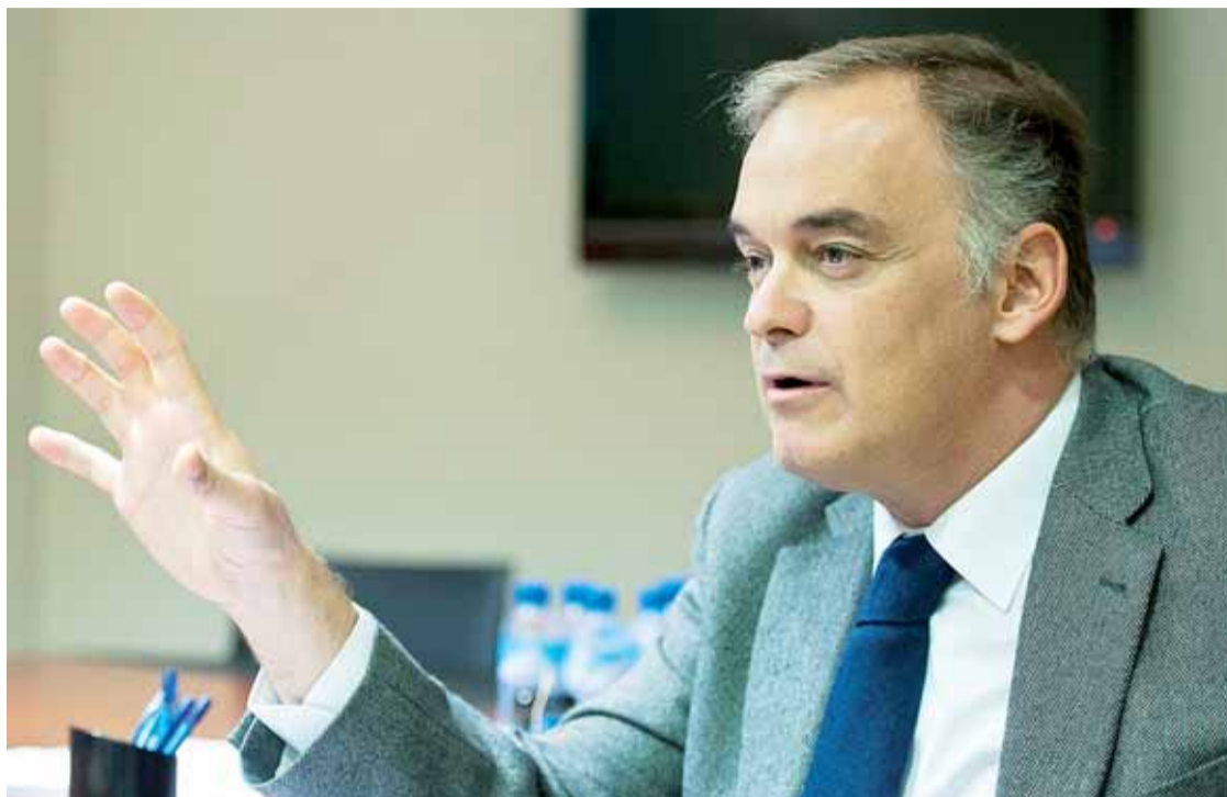
Esteban González Pons, durante la entrevista mantenida con el periódico Gente en la capital burgalesa el día 14.

No tiene dudas sobre un posible adelanto de elecciones generales tras el 22 de mayo. "Si los españoles, con nuestro voto, le decimos a Zapatero que queremos que se marche, se tendrá que ir". El vicesecretario general de Comunicación del PP vaticina que en los próximos comicios locales y autonómicos "va a ganar el cambio", porque los españoles "están cansados del paro y de la crisis económica". Contrario a vincular salarios y productividad y sí partidario de que las empresas negocien sus propios convenios colectivos, Esteban González Pons también se muestra favorable a "racionalizar" el Estado autonómico, aunque "sin quitar competencias a nadie"; poner límites de gasto y de endeudamiento a todas las administraciones; y reducir el número de políticos. "En España sobran políticos, burócratas, y no sobran funcionarios", afirma.