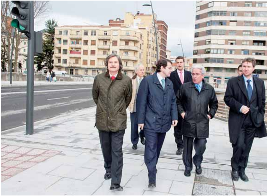
Autoridades locales y regionales inauguraron el lunes día 14 el nuevo puente de la Evolución, en el entorno del Complejo de la Evolución Humana.

con farolas con doble luminaria para garantizar la seguridad.