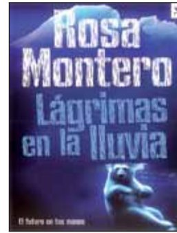
LÁGRIMAS EN LA LLUVIA Rosa Montero. Novela.

Luz y Vida Arco del Pilar, 8 (Lain Calvo)