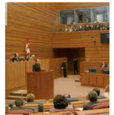
Uno de los instantes del Pleno.

Además, el PSOE instó a la Junta a que se posicione a favor de debates entre los candidatos a la Presidencia de la Junta en la "televisión privada financiada con fondos públicos".