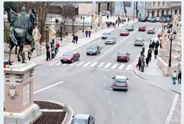
El puente de San Pablo también ha sido remodelado.