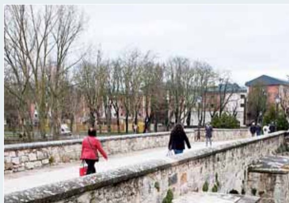
El puente Malatos, de origen medieval, también de estreno.