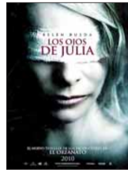
LOS OJOS DE JULIA Dir. Guillem Morales. Int. Belén Rueda, Lluís Homar. Terror.