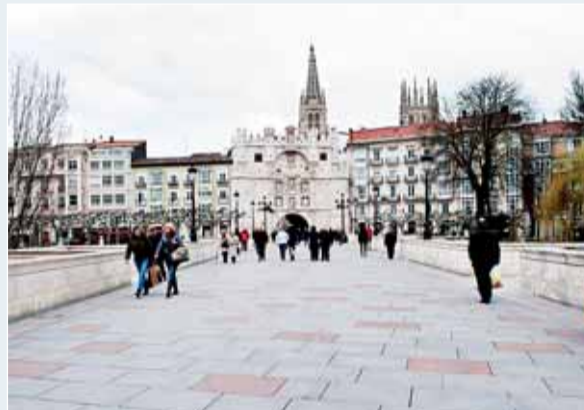
Hace años que el puente de Santa M a es sólo para peatones.