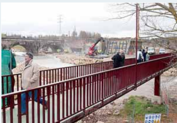
Las obras del bulevar incorporarán nuevas conexiones.