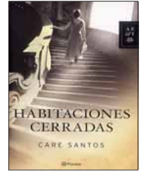
HABITACIONES CERRADAS Care Santos. Novela.