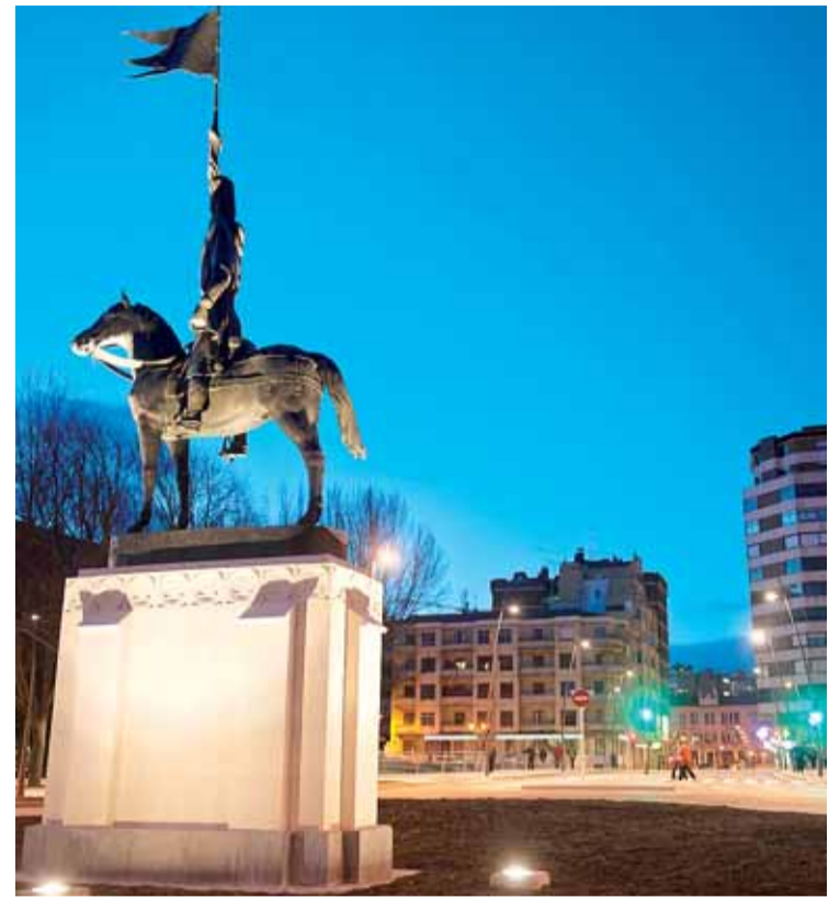
La estatua ecuestre de Diego Porcelos preside la nueva glorieta de Santa Teresa.

con dos carriles de cinco metros cada uno. Asimismo, se ha creado un jardín en su interior donde se ha instalado la figura ecuestre del fundador de la ciudad, Diego Porcelos, que se ha trasladado desde su anterior ubicación en la Plaza de San