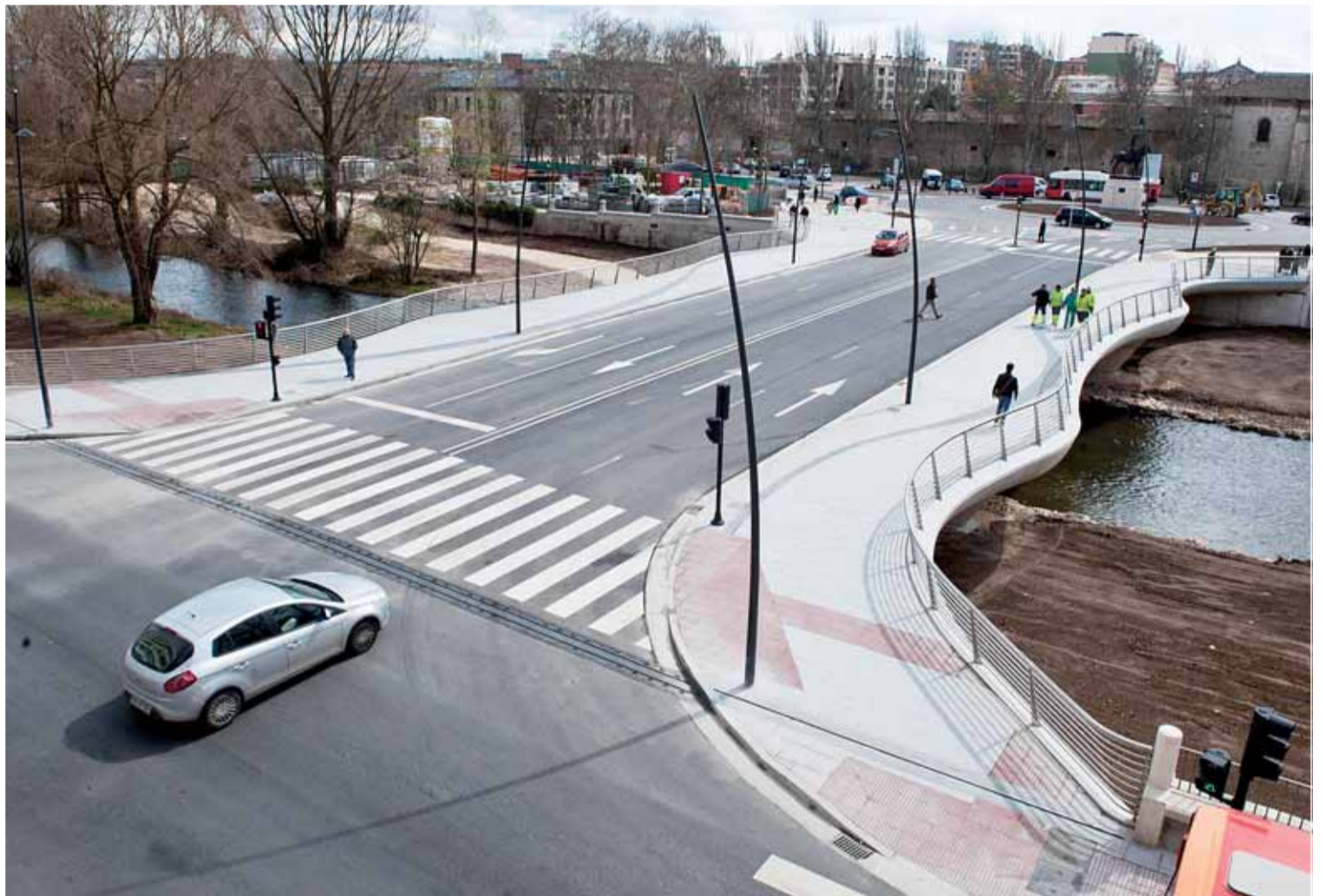
Vista general del nuevo puente de la Evolución sobre el río Arlanzón.

Muy distinto al antiguo puente de Gasset, que durante décadas unió las inmediaciones de la calle Vitoria con el Paseo de la Quinta, la nueva construcción se encuentra adaptada a las demandas del siglo XXI en cuanto a seguridad y estética. Más moderna, práctica y segura. Así es una infraestructura que ha sido posible gra-