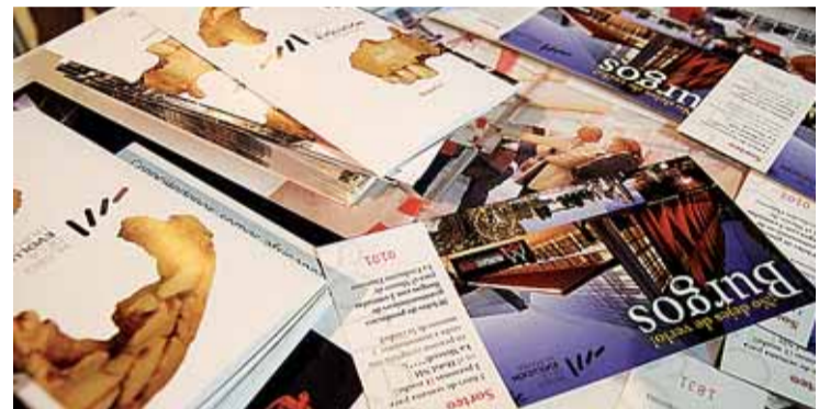
Información del Museo de la Evolución Humana, se repartió entre los asistentes.

Iniciativa pionera y única la de llevar productos y promoción turística con el basket