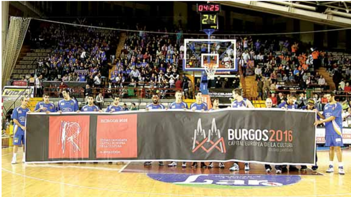
Los jugadores del Autocid muestran en el parqué la pancarta de apoyo a la candidatura de Burgos 2016.