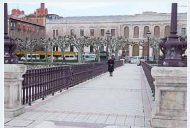
La pasarela de la Audiencia ha ganado amplitud.