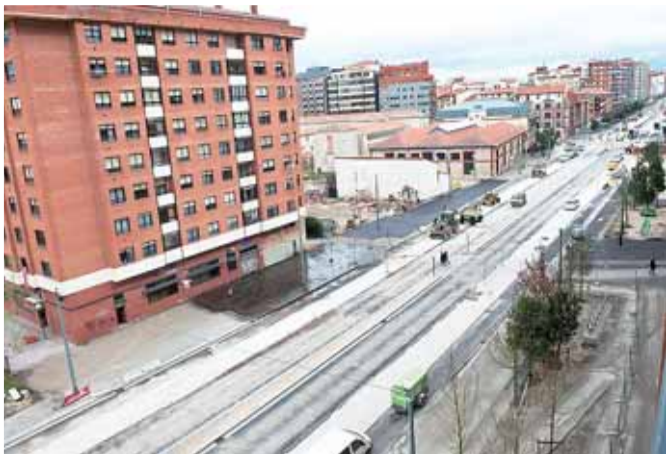
Aspecto que presentaba ayer el tramo más céntrico del bulevar entre la calle El Carmen y Casillas.