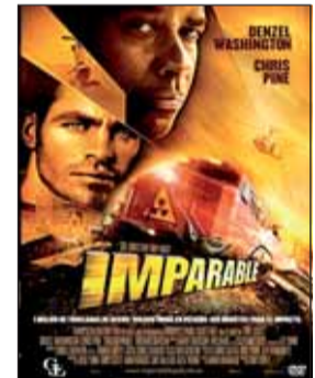
IMPARABLE Dir. Tony Scott. Int. Denzel Washington, Chris Pine. Acción/Thriller