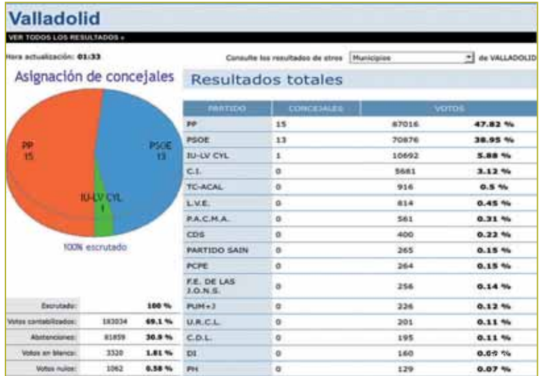
Resultados obtenidos en Valladolid durante las elecciones municipales de 2007.

Es el caso del Partido Humanista, (129 votos en 2007) cuyo programa electoral comienza afirmando: "Los partidos políticos tradicionales son de mentira. Han quedado reducidos a una estructura funcional". El Partido