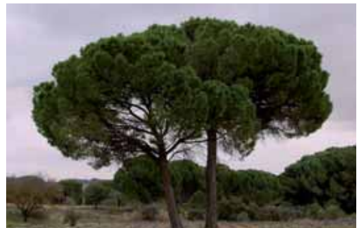
Imagen de Tierra de Pinares en la provincia de Valladolid

"La jornada es tan descarada que basta con ver el desembarco de dirigentes socialistas que utilizan su cargo institucional para hacer sectarismo político. Mucho más cuando está inaugurada por Oscar López, candidato del PSOE a presidir la Jun-