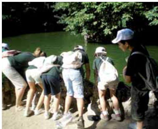
Niños participan en uno de los campamentos de verano.

Este año como novedad, la solicitud podrá formalizarse de forma presencial o telemática a través de un formulario que aparece en la página web www.fmdva.org . Tendrá que presentarse entre el 25 y el 30 de