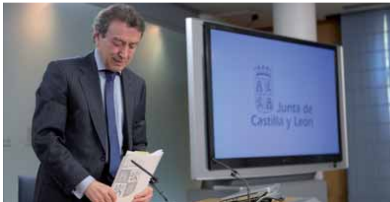
El consejero de la Presidencia y portavoz, José Antonio de Santiago-Juárez, durante la rueda de prensa.

El municipio de Torre del Bierzo cuenta en la actualidad con 2.588 habitantes, de los cuales 606 son mayores de 65 años de edad, lo que supone una tasa de envejecimiento del 23,4% de la población.