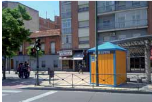
Casetas de la Marcha Asprona instalada en la Plaza del Carmen (Delicias).

Todos los participantes al inscribirse tendrán como regalo una 'Peonza' artesanal elaborada por Lince Talleres y una chapa de la 34 Marcha Asprona. Serán 28,5 kilómetros de recorrido para los participantes, desde la Feria de Muestras, entre las 7 y las 8 de la mañana, hasta llegar al Centro Comercial Vallsur de la capital vallisoletana, tras pasar por Zaratán, Ciguñuela, Simancas, el Pinar y la Cañada de Puente Duero.