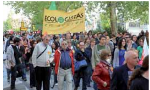
Momento de la manifestación.

ECOLOGÍA CONVOCADA POR ECOLOGISTAS EN ACCIÓN