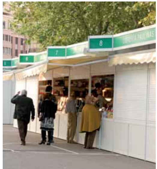
Los vallisoletanos se acercaron a contemplar las primeras casetas.

EXPOSICIONES. Por último, se podrán observar cuatro exposiciones: 'La hora del recreo', producida por Editorial Lunweg para Fundación Telefónica e instalada al aire libre; 'Francisco Umbral, libro a libro', una gran muestra fotográfica que estará instalada en el Pabellón de Autores; 'La Feria encuentada', con obras de la artista vallisoletana Rosana Largo Rodríguez en torno al cuento tradicional y que podrá visitarse en el Pabellón de Exposiciones, y una "sencilla pero entrañable muestra" que ocupará uno de los extremos del recibidor del Pabellón de Autores y que estará dedicada a la memoria de la pintora y escritora recientemente desaparecida Araceli Simón.