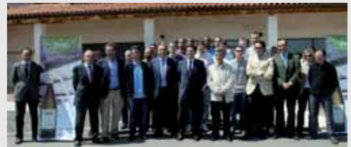
El club recibió el apoyo de Protos y de su patrocinador DO Rueda.

El Blancos de Rueda tiene la posibilidad de alcanzar el sueño del play off, pero para ello deberá resolver positivamente el choque ante el Baloncesto Fuenlabrada, que tendrá lugar en el Pisuerga el jueves 5 de mayo a las 21.30. Por ello, el club vallisoletano pone a la venta entradas al asequible precio de 2 euros cada una, en cualquier categoría y ubicación de las que estén disponibles en Pisuerga. Antes, el domingo los de Fisac se miden en Vitoria al Cajalaboral.