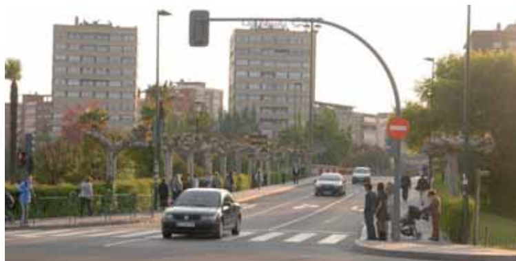
El Puente de Poniente ganará tres metros para los peatones y las aceras se cubrirán con marquesinas.

La actuación tiene mucha importancia ya que el puente es la entrada desde la Feria de Valladolid, junto a la que se instalará el futuro Palacio de Congresos, pero también porque se presta especial atención a los peatones y a los ciclistas y además porque se evitará el peligro que ahora corren las personas que caminan por el puente por la cercanía con el tráfico, de manera que se responde a la petición de las asociaciones. Con esta actuación, la Junta de Castilla y León tiene previsto invertir un total de 7,3 millo-