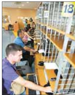
Usuarios de Internet

Internet aporta 23.400 millones de euros al PIB español. Así lo confirma un estudio de la consultora Boston Consulting Group (BCG) encargado por Google, con datos referidos a 2009, cuando la economía española se contrajo un 3,7% por la crisis. En concreto, la mayor incidencia de Internet en el PIB fue por el consumo privado de los hogares, al suponer 14.000 millones, seguido del comercio electrónico de los hogares, que aportó 8.900 millones de euros