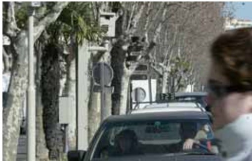
Uno de los radares instalados en Valladolid.

Más de siete meses de pruebas para su homologación han servido para poner en marcha estos sensores que están ubicados en la vía principal de acceso a Parquesol (la calle Doctor Villacián), la travesía que bordea Villa del Prado (Monasterio de San Lorenzo) y una de las vías principales de Covaresa (Cañada Real). Con ellos son ya doce los radares fijos de velocidad instalados en las distintas calles de la ciudad -los otros seis son de