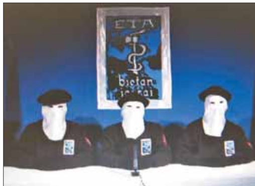
Terroristas de ETA leyendo uno de sus comunicados ante la cámara