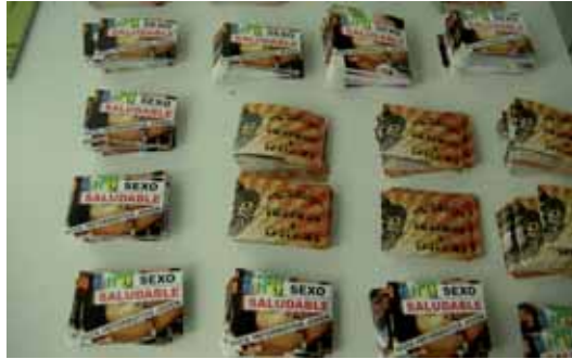
Guías editadas por el Ayuntamiento.

El diseño de estas guías se presenta en dos formatos: uno de nueve por nueve centímetros, destinado preferentemente a entidades juveniles e instituciones, y otro de seis por nueve, con la característica peculiar en su diseño, un formato de estética juvenil, fácil-