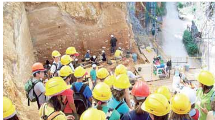
La campaña incluye un amplio programa de actividades al aire libre.

Por otro lado, Caja de Burgos editará una guía de plantas de los viveros de Castilla y León. La publicación será financiada con la recaudación obtenida en el reparto de 9.000 acebos en la red de Aulas de Medio Ambiente de Caja de Burgos en tres provincias.