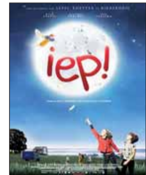
PÍO, PÍO (IEP!) Dir. Rita Horst. Int. Ties Dekker, Diederik Ebbinge. Fantástico.