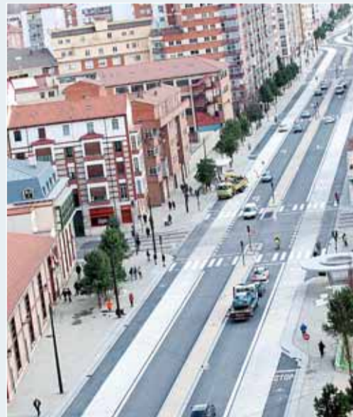
La puesta en servicio del Bulevar, entre los momentos de mayor satisfacción para el alcalde.

Otros momentos "muy gratos" son "ver la aceptación social que se puede producir de algunas actuaciones como la del Bulevar del Ferrocarril" y "cuando cualquier paisano se te acerca y te dice que le da mucha pena que usted se vaya; te está diciendo que parece que no lo estás haciendo tan mal".