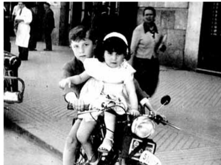
Dos niños se divierten subidos en una motocicleta Guzzi Hispania de 65cc frente a la estación de autobuses de Burgos. 1956.