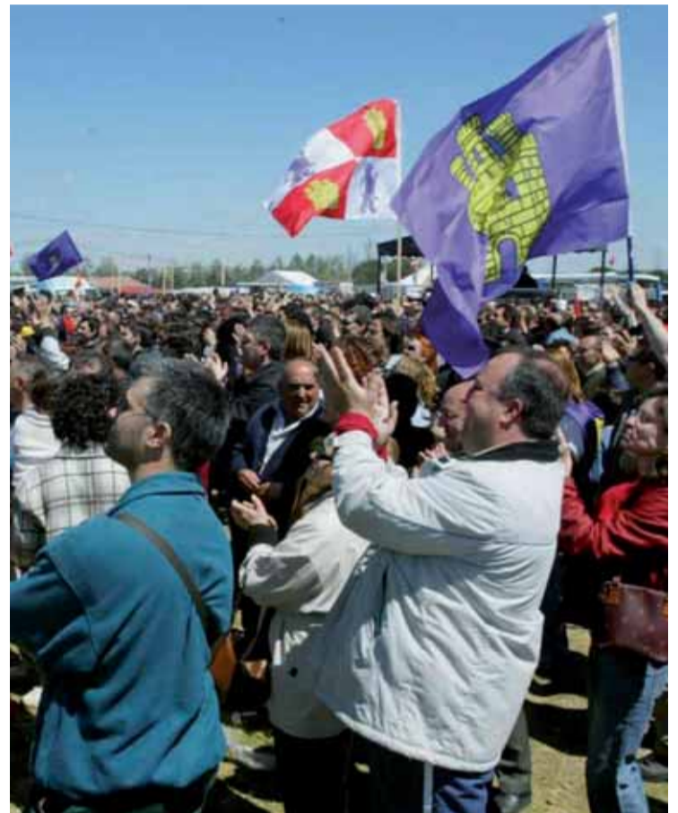
Multitud de castellanoleoneses se darán cita este año en la campa.

Por octavo año consecutivo se celebrará el Rally Fotográfico “Día de Villalar” cuyo tema versará sobre la propia celebración de la Fiesta de la Comunidad Autónoma de Castilla y León en Villalar de los Comuneros. La inscripción será gratuita y se realizará en la Carpa de la Fundación Villalar-Castilla y León el día 23 de abril de 10:00 a 20:00 horas.