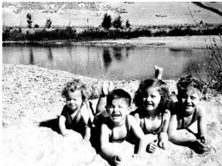
Varios niños juegan en la ribera del río Arlanza, en Retortillo, junto a Torrepadre, situado a 20 km de Lerma. 1946.