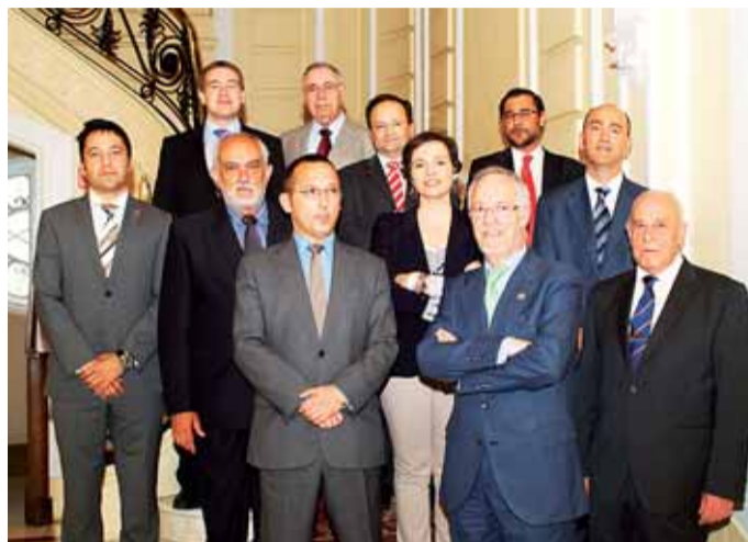
Foto de familia de la nueva Junta Directiva de la Asociación Española de Ingenieros de Telecomunicación.

Para el ingeniero burgalés, la asociación ha de afrontar durante estos años importantes retos debido a las dificultades del sector y a la actual coyuntura económica, que está obligando a mu-