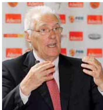
El ex-seleccionador nacional, Lolo Sainz, dió una conferencia.

En lo referente al importante partido en el polideportivo El Plantío, el conjunto gallego debe ganar