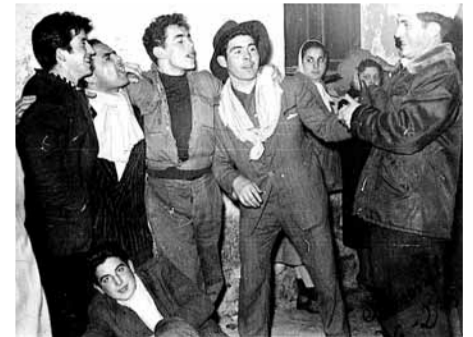
Varios jóvenes celebrando las Fiestas de San Antón en Gamonal. Este pueblo se integró a Burgos como barrio en 1955.