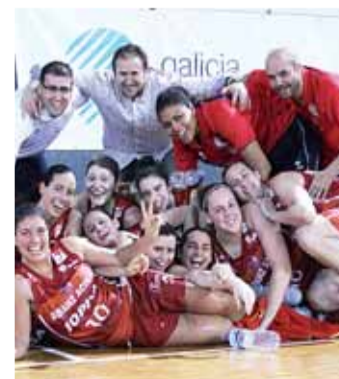
Las jugadoras del Arranz Jopisa celebrando la clasificación.