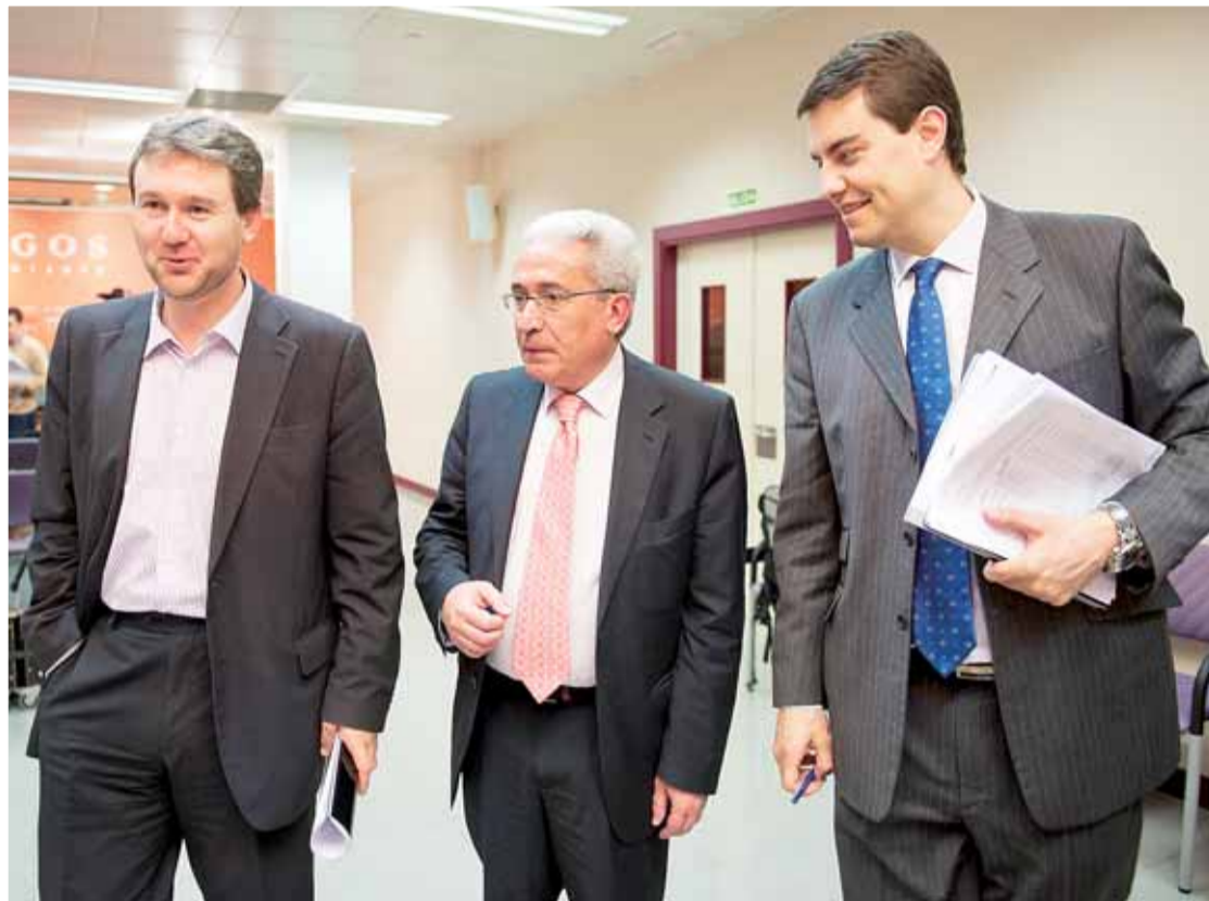
Juan Carlos Aparicio presentó el balance de legislatura acompañado por el portavoz del equipo de Gobierno y concejal de Fomento, Javier Lacalle, y el concejal de Hacienda, Ángel Ibáñez.

Aparicio, que compareció acompañado por el candidato popular a la Alcaldía y concejal de Fomento, Javier Lacalle, y el edil de Hacienda y número 3 de la candidatura del PP,