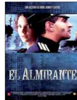
EL ALMIRANTE Dir. Andrey Kravchuk. Int. Konstantin Khabensky, Liza Boyarskaya. Drama.