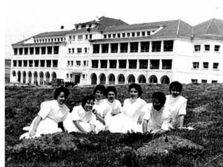
Una bonita imagen de varias enfermeras con el imponente hospital Fuente Bermeja al fondo.