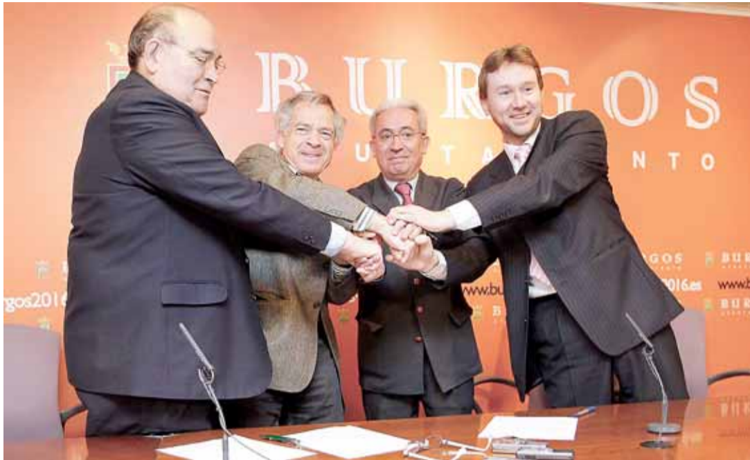
Foto para la historia la protagonizada el día 13 por el alcalde y los portavoces de los grupos políticos municipales, tras la firma de la carta de intenciones en apoyo a la candidatura de Burgos 2016.