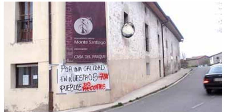
Pancarta de protesta colocada en Berberana.