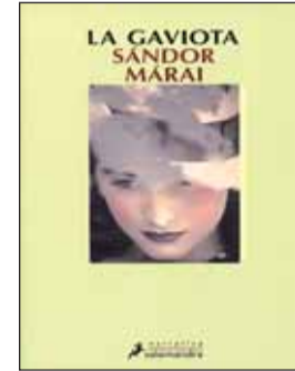
LA GAVIOTA Sándor Márai. Novela.