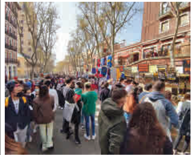
El tradicional mercadillo municipal de la capital

Toda la actualidad de los distritos de Madrid, en nuestra web