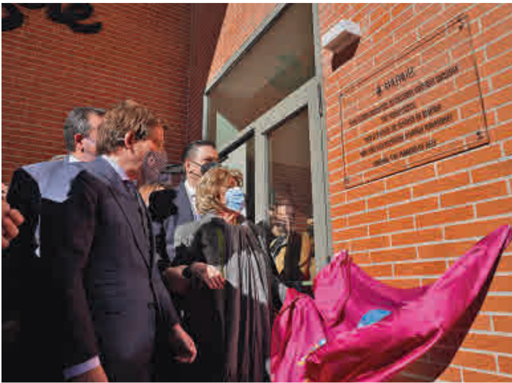
El alcalde descubrió una placa situada en la entrada del centro