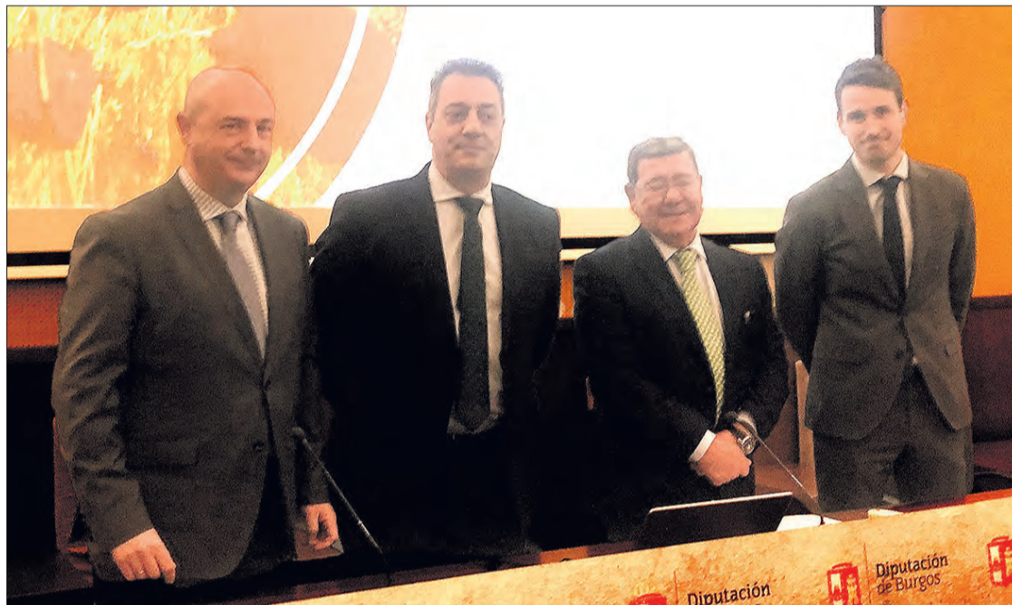
Presentación del proyecto Fotovoltaico Garoña 595MW, el miércoles 22.