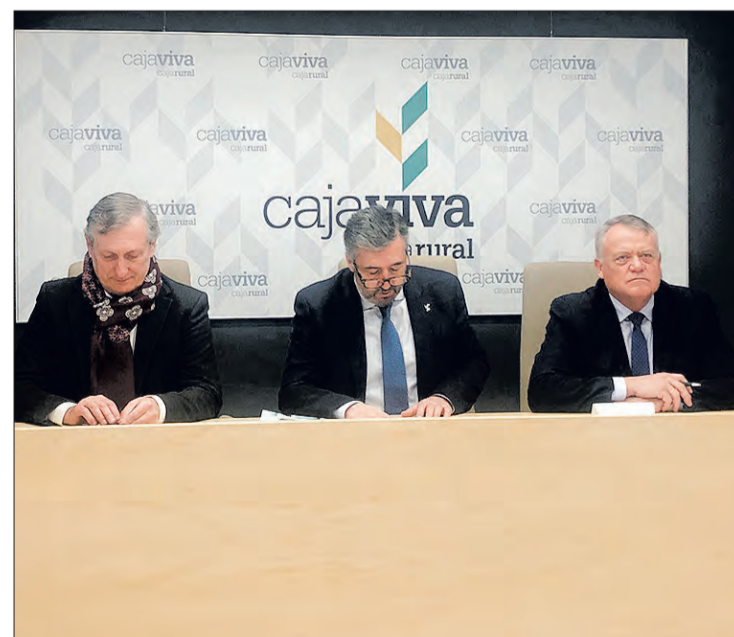
Firma del convenio entre las partes implicadas, el miércoles 22.

Del mismo modo, el responsable de la Fundación Caja Rural quiso hacer hincapié en que el pueblo es un "referente de concordia y respeto" y celebró el afán y empeño de la localidad burgalesa por dar a conocer su origen y promover la tolerancia entre los pueblos, "algo que es digno de elogio".