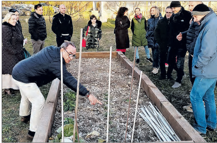
Jornada de puertas abiertas para conocer la experiencia del huerto colaborativo.

Con el apoyo del Ayuntamiento y en colaboración con esta entidad social, se puso en marcha la propuesta dentro del marco del proyecto Polígono Saludable en el que llevan trabajando en la asociación desde 2018. Dando la posibilidad a sus empresas asociadas de utilizar uno de los veinte huertos, pagando una cuota anual, que estará apadrinado por