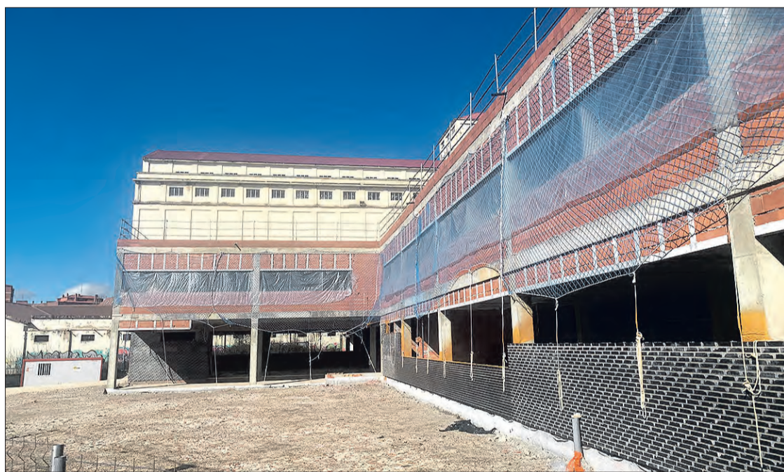
Exterior obras Centro de Salud ‘García Lorca’.