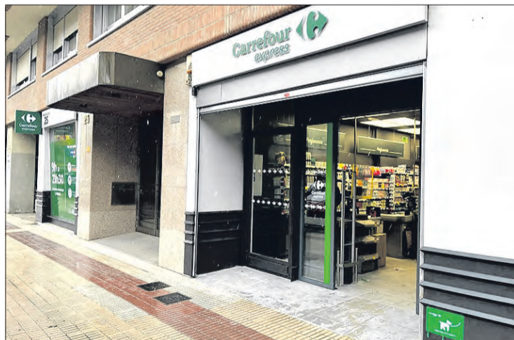
El establecimiento cuenta con una superficie de 213m 2 y emplea a siete personas.

Carrefour ofrece la posibilidad de explotar la marca y acompañar al franquiciado en su gestión diaria con el "know-how" comercial, apoyo logístico y ayudándole en la consecución de financiación.