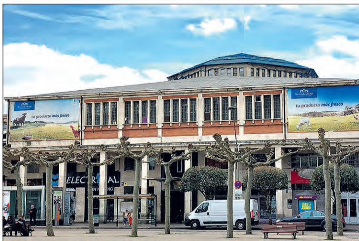
El Mercado Norte inició su actividad en diciembre del año 1966.

La Oficina Nacional de Evaluación (ONE) es un órgano colegiado integrado en la Oficina Independiente de Regulación y Supervisión de la Contratación (OIReScon), del Ministerio de Hacienda y Función Pública, que tiene como finalidad analizar la sostenibilidad financiera de los contratos de concesiones de