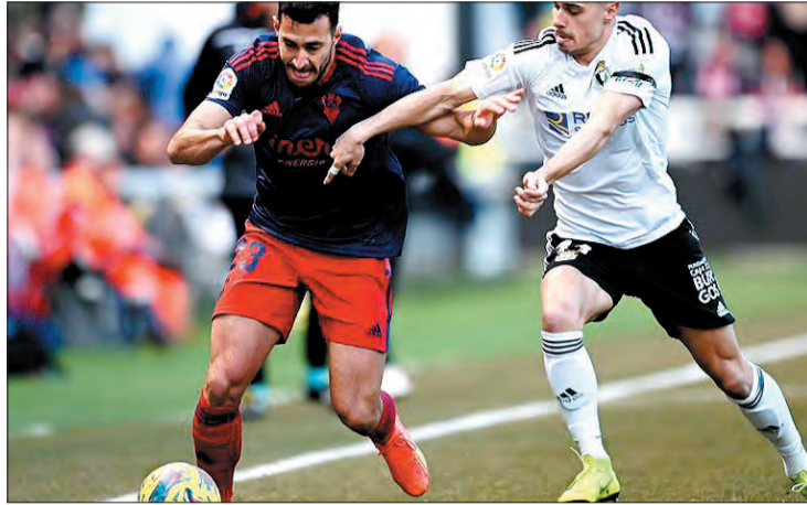
El conjunto burgalés llega al encuentro después de empatar en El Plantío.

Los blanquinegros llegan al choque tras empatar en El Plantío contra el Albacete en un duelo muy disputado. Mumo o Raúl Navarro parten como favoritos en el esquema de Calero para sustituir al sancionado Unai Elgezabal. El otro contratiempo para el técnico blanquinegro es la baja de Grego. El central fue