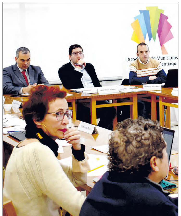
Reunión de la Junta Directiva de la Asociación de Municipios del Camino de Santiago Francés, celebrada el jueves 23 en Belorado.

La reunión se cerró con la presentación de un nuevo convenio de colaboración con ICOMOS España, que se firmará la próxima semana en el monasterio de Santa María la Real de Nájera. El acuerdo servirá como marco para la realización de futuras acciones conjuntas en el ámbito del Patrimonio Cultural que contribuirán a la conservación, gestión y valorización del Camino de Santiago Francés.