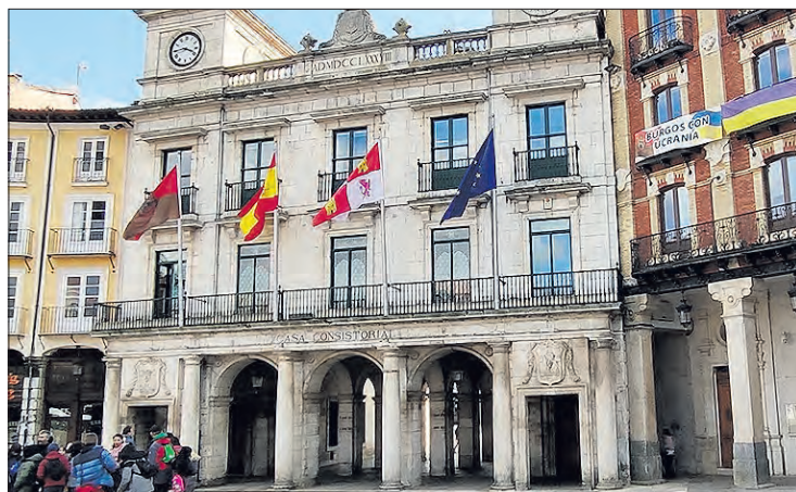
La modificación presupuestaria planteada se financia con el remanente de tesorería del Ayuntamiento generado de la liquidación del presupuesto de 2022, que fue de 71,7M€.

drá un protagonismo "relevante", con la incorporación de 3,9M€, si bien "la mayor parte" de la modificación va dirigida a actuaciones "allí donde vive la gente". "Más dotaciones, más infraestructuras, más servicios para los distritos, para los barrios", avanzó el alcalde, citando, entre otras, intervenciones en las calles Fernán González, Cabestros, Calzadas, Vitoria, Murallas, Francisco de Vitoria, José Luis Borges, Avenida Cantabria, Avenida del Cid, plaza de Roma, el molino de Capiscol, etc.; "una partida de proyectos que venían reclamándose desde hace mucho tiempo", subrayó De la Rosa a la vez que citó también la accesibilidad en la plaza de los Castaños, mejoras en los centros municipales de algunos barrios, la campaña de asfaltado, el parque Santiago, el centro cívico de Fuentesillas, la promoción de la ciudad,