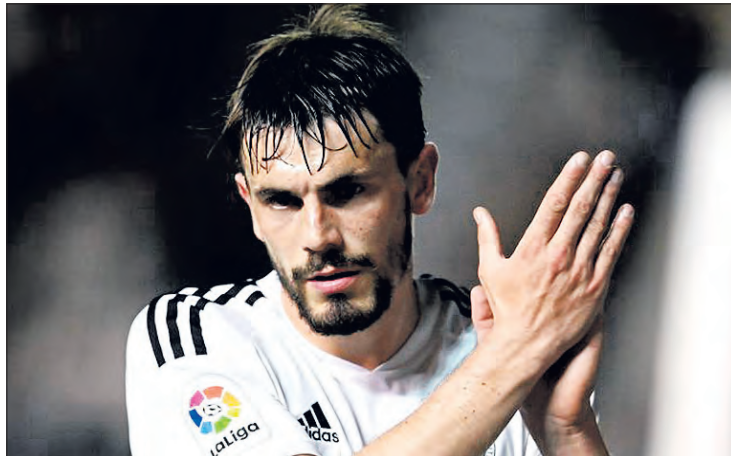
Las bajas de Atienza y Elgezabal obligan a Calero a modificar el esquema.

Los blanquinegros intentarán sumar los tres puntos para no descolgarse definitivamente de la lucha por el ascenso. Para el duelo del domingo contarán con las importantes bajas en el centro del campo de Atienza y Elgezabal.