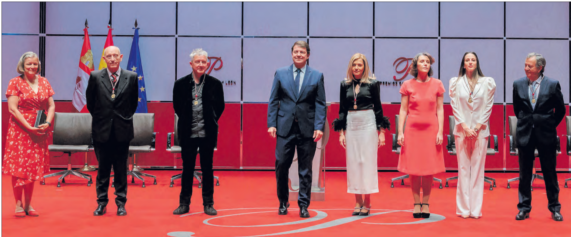
El presidente de la Junta, Alfonso Fernández Mañueco, con los galardonados con los Premios Castilla y León el pasado día 21 de abril.