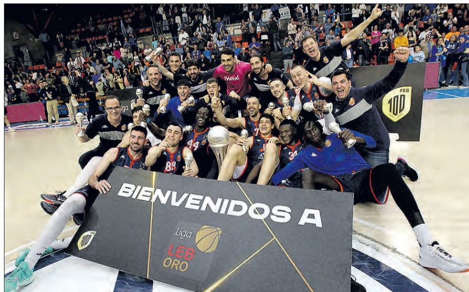
El Tizona Universidad de Burgos se proclamó campeón de la Liga LEB Plata tras superar al Club Básquet Prat.

hoy en día los equipos que merecen ascender deportivamente a la ACB lo pueden hacer sin cumplir unos requisitos económicos que nosotros no quisimos asumir", sentenció Benavente. El Tizona Universidad de Burgos logró proclamarse campeón de la Liga LEB Plata después de superar al Club Básquet Prat en el partido de vuelta de la final, disputado en el polideportivo El Plantío. Un encuentro que se llevaron los rivales por 88-90 gracias a un gran último cuarto, pero el amplio colchón cosechado por los burgaleses durante el choque de ida permitió que el equipo burgalés consiguiera el ansiado ascenso a la Liga LEB Oro. Diego Ocampo advirtió durante la semana que, pese a los dieciséis puntos de renta obtenidos en el partido de ida, la eliminatoria no estaba cerrada. El equipo dirigido por Albert Cañellas saltó al parque del Plantío en busca de la sorpresa. Un parcial inicial de 0-5 avisaba a los burgaleses que no podían relajarse y comenzaron a jugar arropados por más de 2.200 espectadores que llevaban en volandas al equipo.