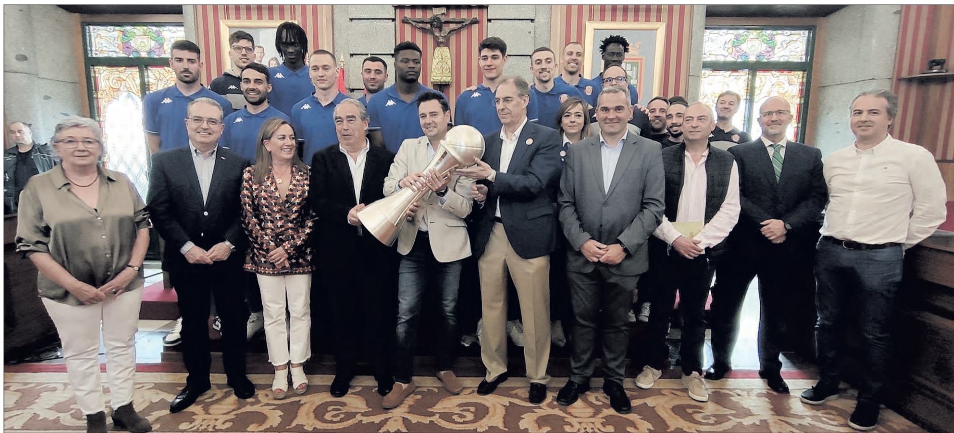
Alcalde y miembros de la corporación, directiva, cuerpo técnico y plantilla del cuadro azulón posan con la copa de campeón del UBU Tizona tras lograr el ascenso a la LEB Oro, en el salón de Plenos del Ayuntamiento de Burgos el jueves 27.