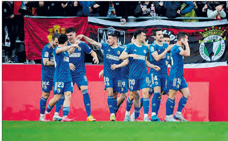
El máximo goleador blanquinegro, Curro, será baja ante el Villarreal B.

Los de Julián Calero buscarán sumar los tres puntos en el Plantío tras la derrota en el derbi del pasado domingo frente al CD Mirandés. Los burgaleses siguen en caída libre y la única buena noticia es la vuelta a los entrenamientos de Andy Rodríguez. Además,