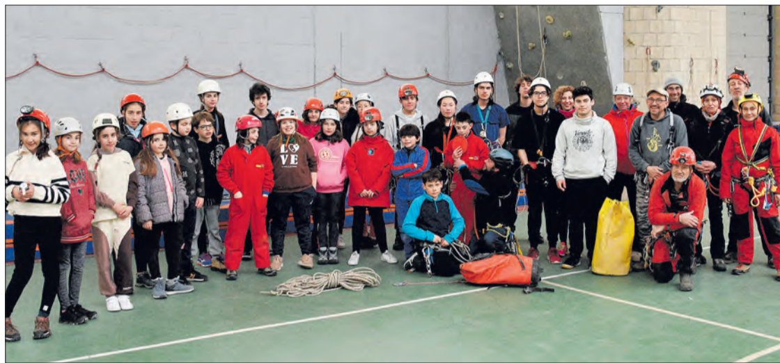
La promoción de la participación del público infantil y juvenil en la realización de actividades espeleológicas es uno de los objetivos.

El norte de Burgos, y en especial la comarca de las Merindades, acumula cerca de dos tercios de las cavidades de la provincia de Burgos y prácticamente la totalidad de las de mayor desarrollo y desnivel. También alberga un buen número de los principales yacimientos arqueológicos y "hotspots" de biodiversidad acuática subterránea que alberga el subsuelo burgalés. "Esta importante riqueza geológica, cultural y biológica constituye un extraordinario patrimonio que debe ser conocido, protegido y conservado", señala una nota de prensa del