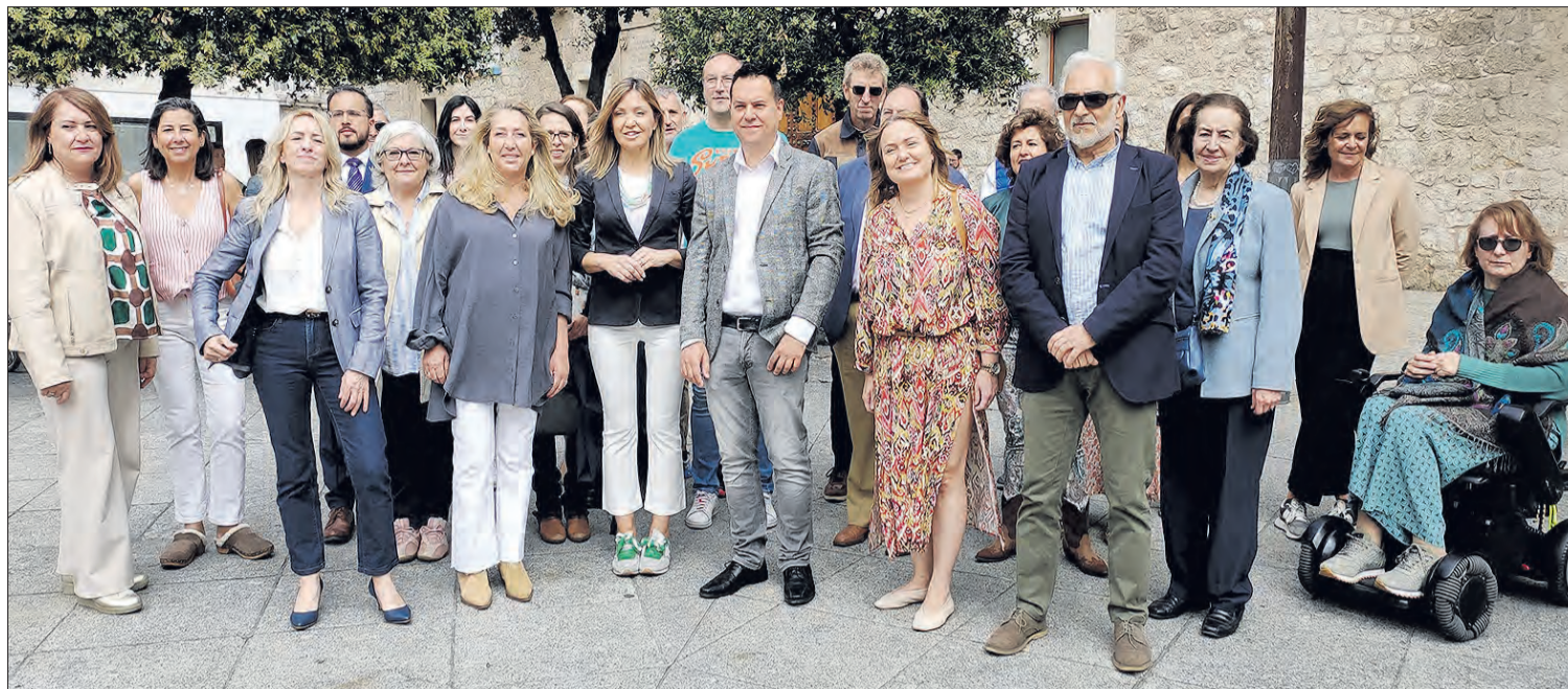
Presentación de la candidatura de Decide Burgos a las elecciones municipales del 28M el jueves 27 en la Plaza de la Libertad.