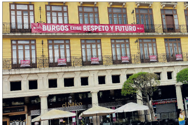
Bandera alusiva a la manifestación del 13 de junio en un edificio de la Plaza Mayor.