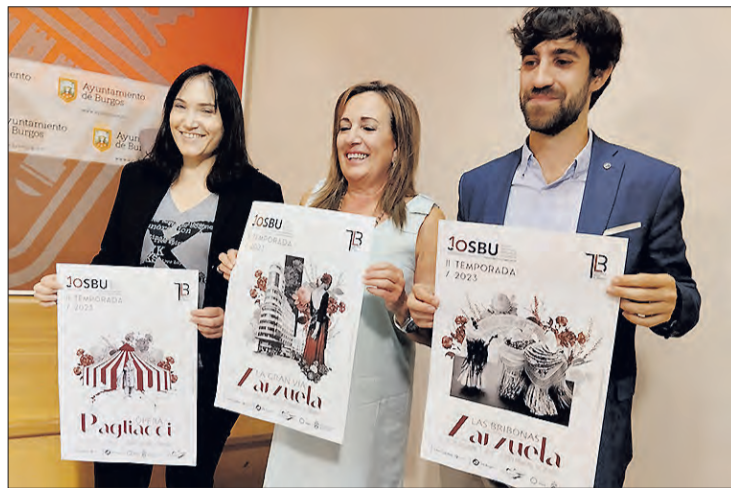
Presentación de la segunda edición de la iniciativa, el lunes 5.

El Teatro Principal acogerá también el domingo 1 de octubre