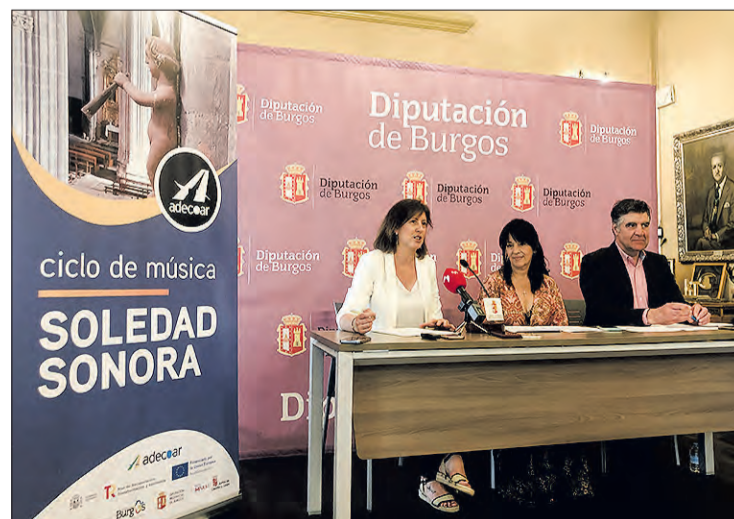
Presentación de la ampliación de la oferta, el lunes 5.