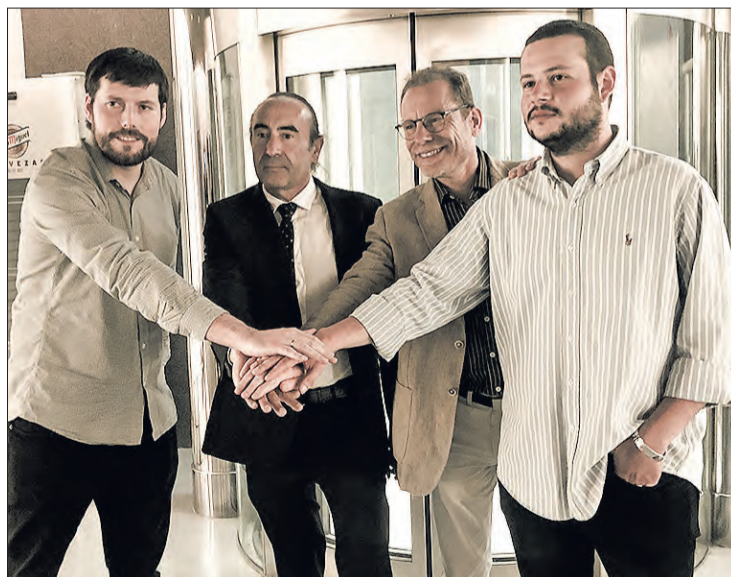
Integrantes del proyecto, en su primer encuentro, el miércoles 7.

Se trata de un proyecto impulsado desde el programa Horizon