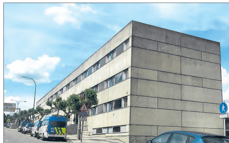
El edificio de Policía Bomberos será objeto de una rehabilitación por importe de 5M€.

Finalmente, explicó ante los medios de comunicación que lo que hace el proyecto es “renovar toda la envolvente”, pero manteniendo el aspecto exterior porque se entendió que el edificio que existe tiene “valor” y “no se trataba de alterar su imagen”.