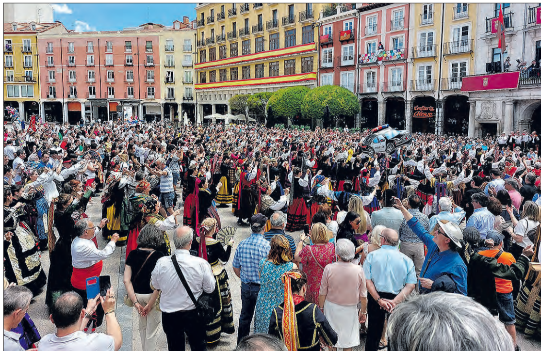
Homenaje a la Jota en la Plaza Mayor en los Sampedros 2022.

Entrando en materia, la concejala de Festejos resaltó que “van a ser unos buenos Sampedros, va a haber calidad, conciertos de altura y, sobre todo, una programación que no es tanto cronológica sino que plantea varios espacios de actividades, de música, de propuestas escénicas simultáneas, en el mismo horario, para que la gente pueda ir eligiendo a donde quiere ir en función de sus preferencias”. Es una programación, añadió, “que está prevista para todos los gustos y en la que vamos a tener