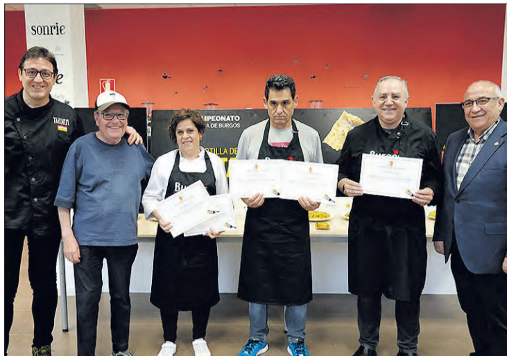
Clasificados en la final comarcal de Las Merindades celebrada el día 7 en Villarcayo.

de clasificados en las anteriores fases comarcales durante el certamen del próximo lunes 12 de junio en la localidad de Arcos de la Llana.