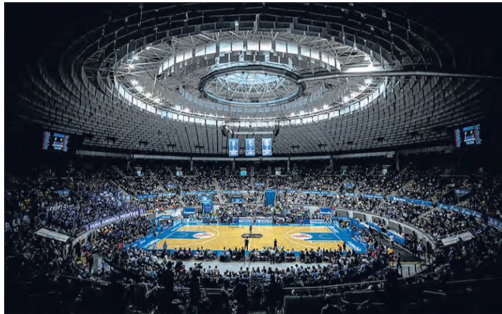
El Coliseum tiene una capacidad superior a los 9.000 espectadores.

Un evento que enfrentará al Zunder Palencia y el UEMC Real Valladolid en su primera semifinal el sábado 17, así como al anfitrión Hereda San Pablo Burgos con el Guuk Gipuzkoa en la segunda. Los dos conjuntos