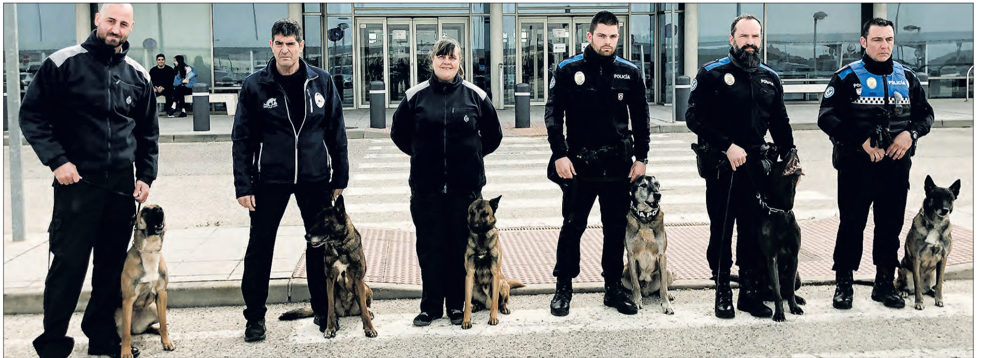
Foto de familia de un grupo de agentes guía de la Policía Local de Burgos, funcionarios del Centro Penitenciario y alumnos que se han formado en el curso desarrollado en Burgos.