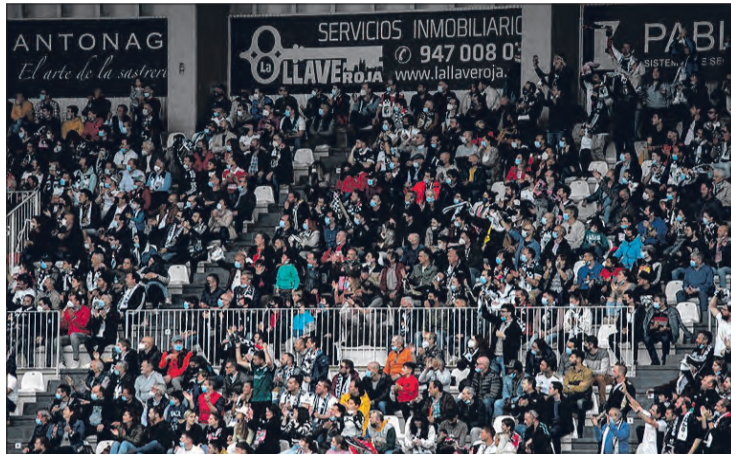
El conjunto blanquinegro comenzará la pretemporada el 3 de julio.

La Real Federación de Fútbol ha publicado el calendario oficial de los 462 partidos de la categoría de plata. Una competición que, al