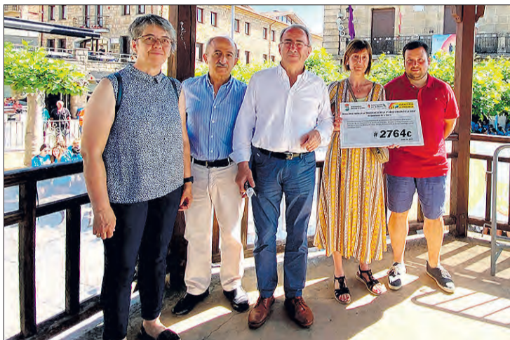
Entrega del cheque a la entidad Fundación Virgen de la Guía.

escalada, artes marciales o kick boxing, entre otras muchas. Al mediodía todos los jóvenes se desplazaron hasta la ribera del río Arlanza para seguir disfrutando en las piscinas municipales y otros eventos como la discoteca móvil y la fiesta Holi.