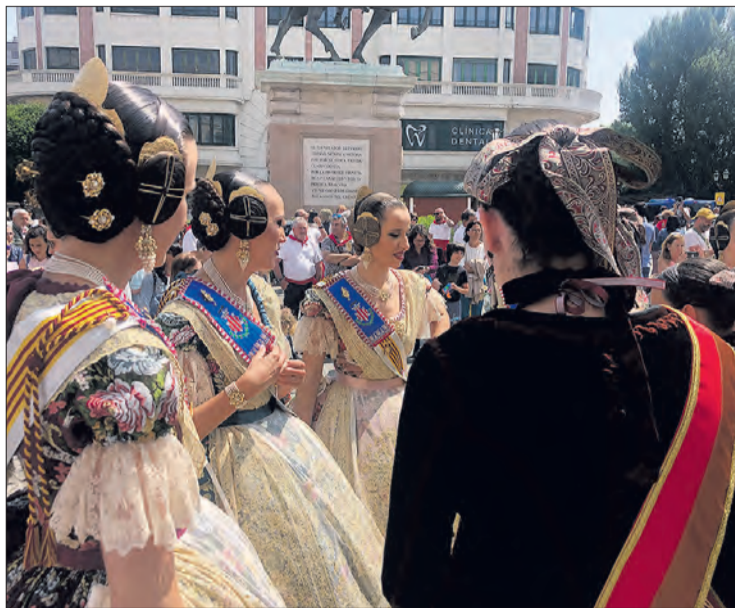
Reinas y falleras minutos antes de que comenzase la ofrenda floral.