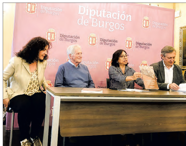
Presentación del libro, en la Diputación Provincial, el jueves 22.

Por su parte, Palomino manifestó que Tejuela es un "buen patrimonio" y "muy relevante", constituyendo una de las necrópolis más grandes de toda la Península Ibérica. Además, dijo, tiene un elemento diferenciador, que es un peñasco, una roca enorme que está trabajada y que es el elemento más identificativo de este lugar. "Lo convierte en un yacimiento