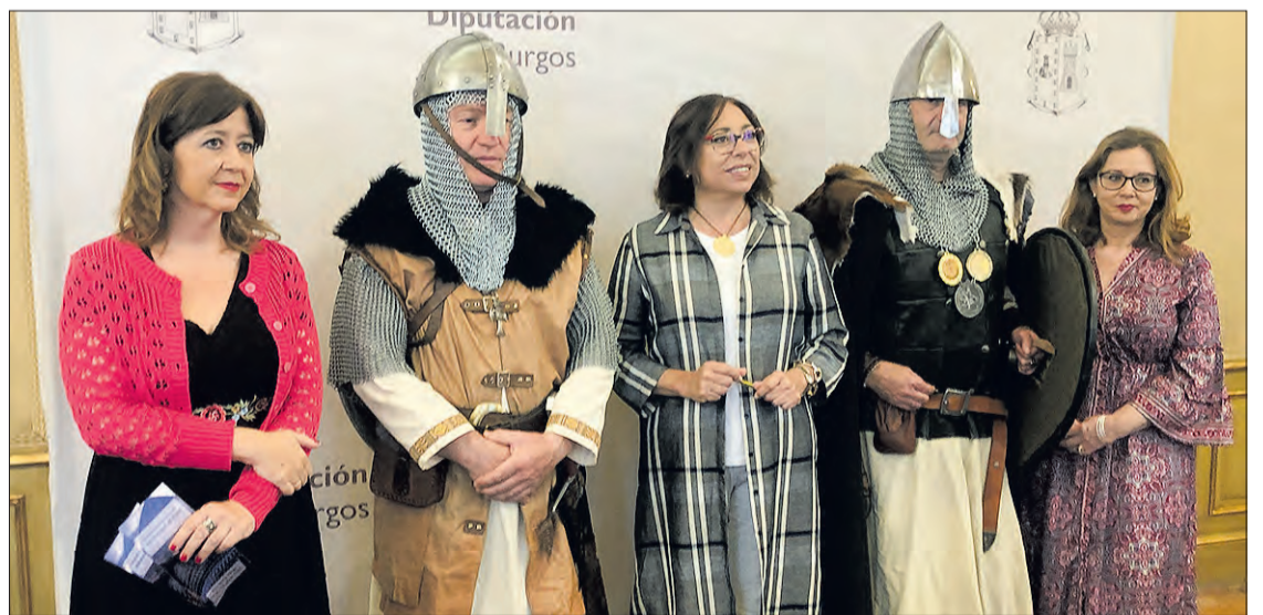
Presentación de las jornadas, en la Diputación Provincial, el miércoles 28.

Las fiestas continuarán el sábado 8, cuando se vuelve a la localidad de Vivar del Cid y donde habrá actividades para todo el público y los más pe-