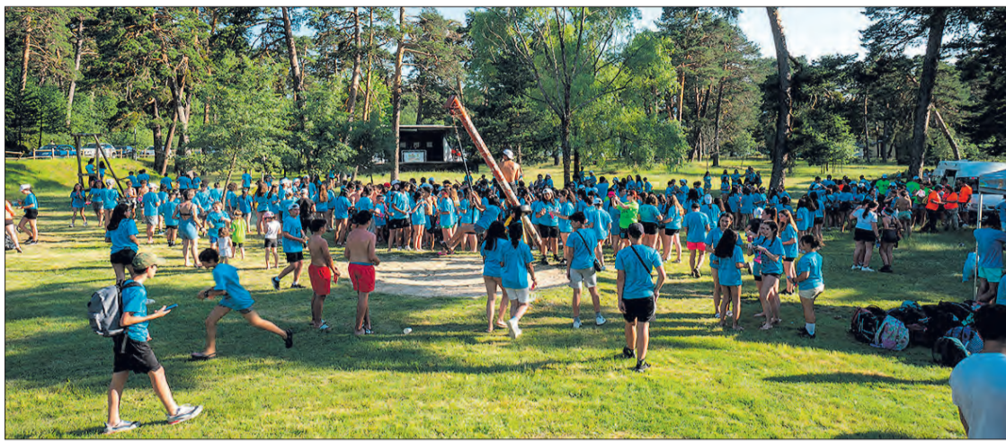
En el encuentro se organizaron más de 40 actividades bajo el lema 'Jóvenes en la naturaleza: respetemos el entorno'.

La mañana se desarrolló en el centro de Quintanar de la Sierra con diversas actividades como elaboración de manualidades,