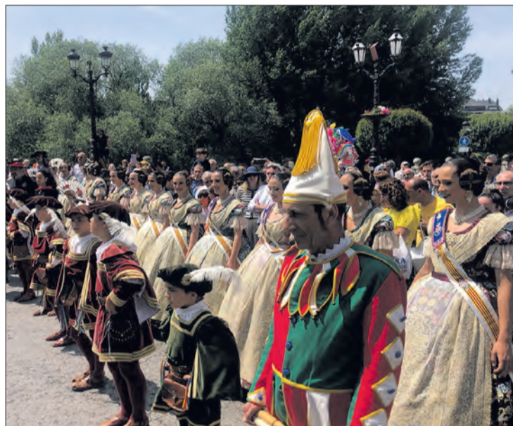
Danzantes, tetines y las delegaciones de Valencia y Murcia durante el acto de homenaje.