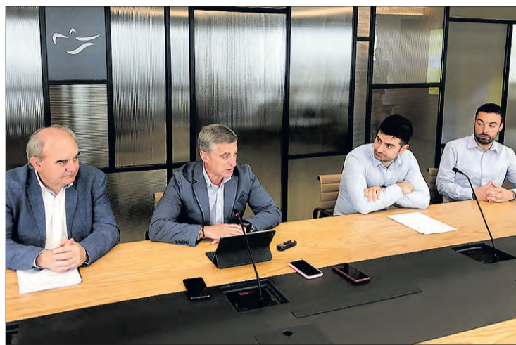
Rueda de prensa ante los medios de comunicación, el martes 27.

Asimismo, la rueda de prensa sirvió para presentar el proyecto ganador de Desafío Industrial, una iniciativa que promueve