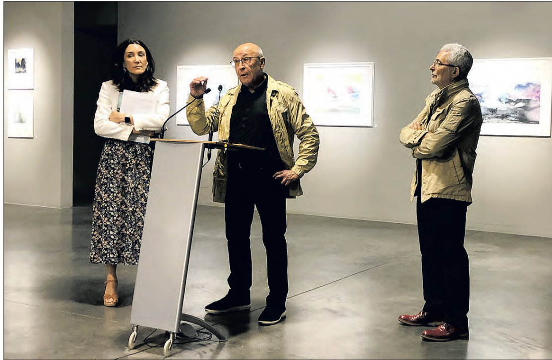
Inauguración de la muestra, en la sala Pedro Torrecilla, el martes 27.

El artista, en un giro drástico a su obra, realiza un homenaje a su tierra gallega. Indagando, experimentando con una técnica especial en la que mezcla la acuarela con la tinta china, unas veces aplicando un fijador y otras aguándola, consigue los efectos que él busca, según puso de manifiesto la directora general de la Fundación