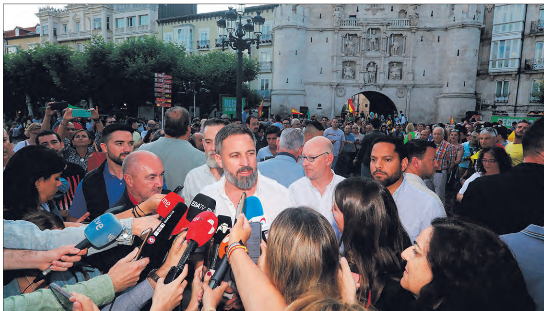
Santiago Abascal, minutos antes del acto de precampaña que organizó Vox en Burgos el lunes día 3.

El presidente nacional de Vox recordó los compromisos de su partido durante esta campaña: derogar y reconstruir. "Nuestro compromiso es el de derogar todas aquellas leyes que destruyen y que dividen; que ponen en riesgo" la prosperidad, la libertad y la