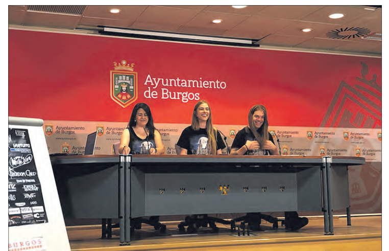
Presentación de la nueva edición del festival, el martes 4.

Finalmente, la edil deseó que el festival siga avanzando y ganando seguidores año tras año por todo lo que supone para la ciudad. En la pasada edición pusieron el listón muy alto, reuniendo a cerca de 7.000 espectadores.