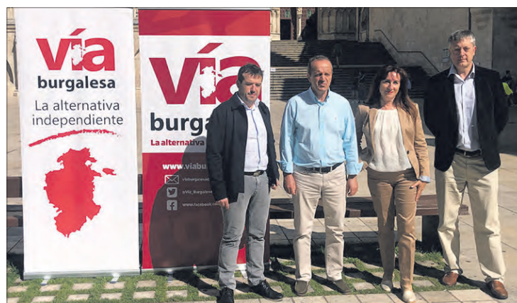
Presentación de la candidatura de Vía Burgalesa, el día 3.

que a los burgaleses hay que darles otra opción, más allá del binomio político actual. “Queremos luchar por nuestra provincia y por las telecomunicaciones”, manifestó, tras lo que sostuvo: “Los burgaleses se están alzando”. “Nosotros somos esa alternativa, queremos estar luchando por los intereses de Burgos”, concluyó.