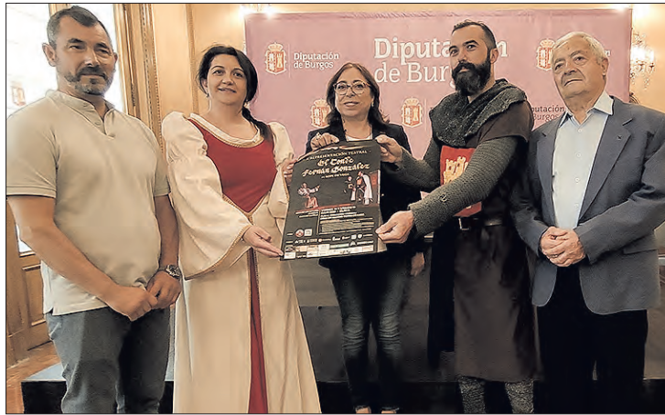
Presentación de la representación teatral 'El Conde Fernán González' el día 5 en Diputación.