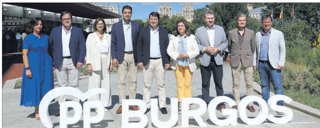
Presentación de la candidatura del PP de Burgos de cara a las elecciones generales, el sábado 1.