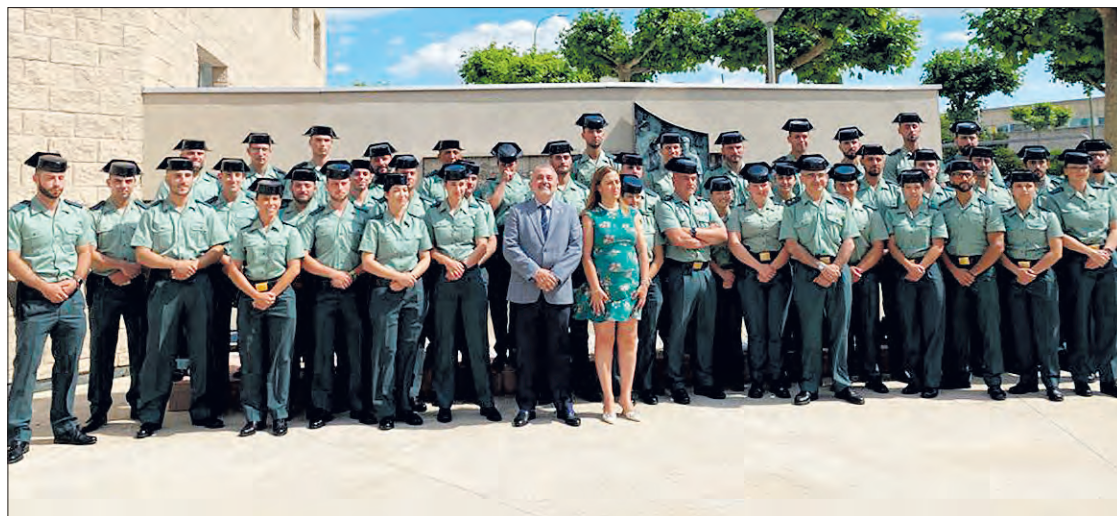
La delegada del Gobierno en Castilla y León, Virginia Barcones, junto a los guardias civiles, el lunes 3.