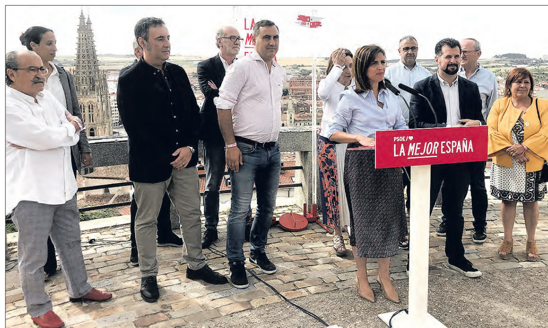
Presentación de los candidatos del PSOE por Burgos al Congreso y al Senado en las elecciones generales, el miércoles 5.

ña ilusionante". Una candidatura, dijo, que nace del consenso y que más allá de representar al PSOE "va a dar la cara" por todos los vecinos. Un equipo de burgaleses, prosiguió la secretaria provincial del PSOE de Burgos, "orgulloso de su tierra, comprometido con la provincia y con un proyecto bien trabajado". "Lo mejor que le puede pasar a España es que siga habiendo un gobierno socialista", sostuvo Peña. Comienza así una campaña con "ilusión y fuerza" y con unos "buenos datos" que avalan al PSOE. En este sentido,