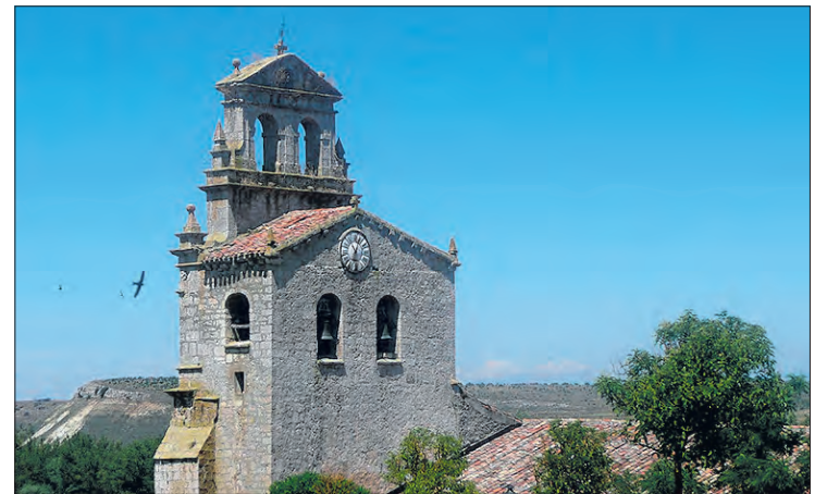
La vida en Masa siempre ha estado alrededor de la iglesia, todo un emblema para los vecinos.

La Asociación Hispania Nostra recuerda en una nota de prensa que el objetivo óptimo de los vecinos está situado en los 55.000€ y que "están convencidos" de que lo van a alcanzar antes del 25 de julio, que es cuando finaliza la campaña. Hasta el momento, los donativos han procedido de 151 donantes, lo que supone una media de casi 160€ por bienhechor. Las ayudas han llegado incluso desde Canadá.