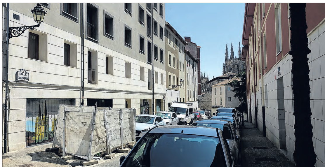
Con el proyecto de renovación de urbanización de la c/ Fernán González desde la iglesia de San Nicolás hasta la c/ Doña Jimena y subida a la c/ Cabestros se eliminaban 78 plazas de aparcamiento.