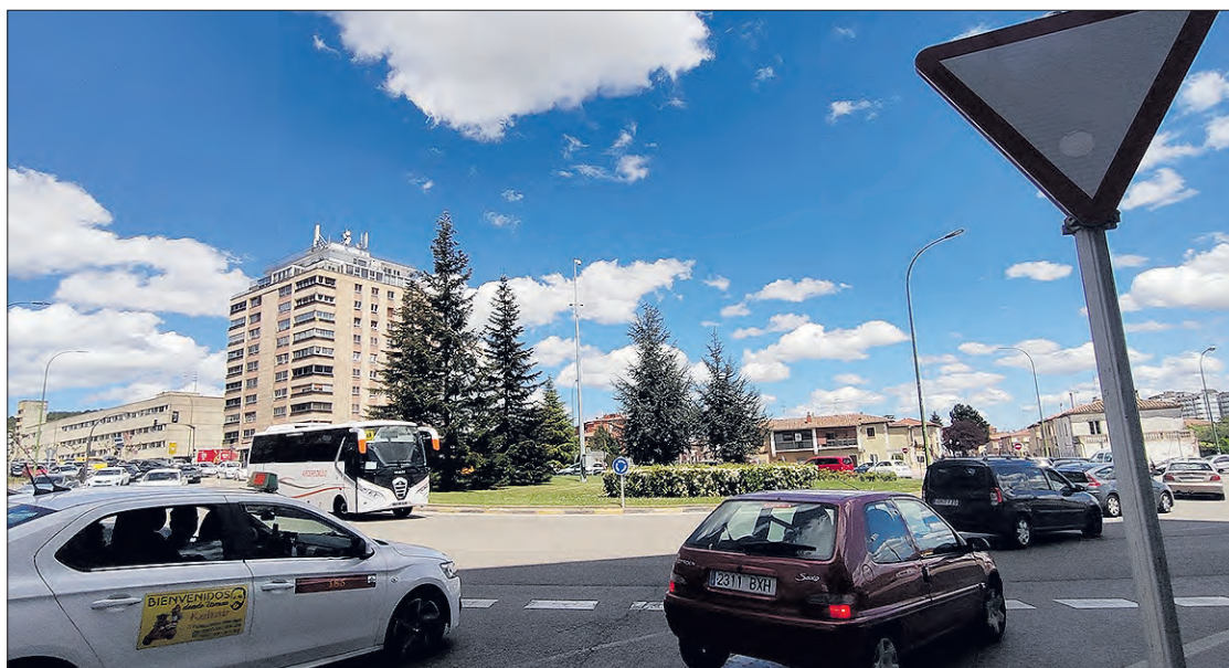
Al proyecto de acondicionamiento de la glorieta Jorge Luis Borges se presentaron cinco ofertas.