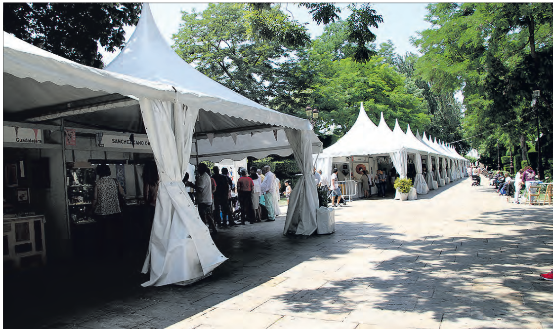
Imagen de archivo de algunos talleres artesanos instalados en el Paseo del Espolón en pasadas ediciones de la feria Coarte.