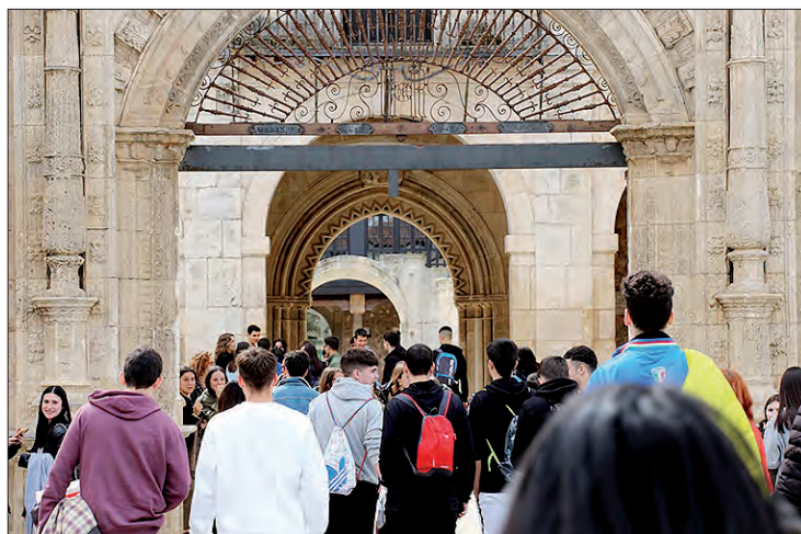
El curso académico 23/24 en la UBU se iniciará el 11 de septiembre.

El año pasado, el número de alumnos preinscritos fue de 19.406 alumnos que seleccionaron a la Universidad de Burgos como opción para comenzar sus estudios superiores en la UBU, lo