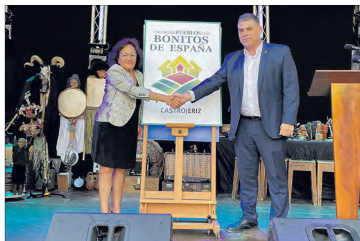
Acto celebrado en Covarrubias, el sábado 8.

Castrojeriz ya ha visto cómo ha crecido la afluencia de viajeros en estos primeros meses del año tras su inclusión en la red en enero de 2023, un aumento especialmente importante al ser prioritario para la red la desestacionalización del turismo y fomentar una actividad sostenible en el corto y largo plazo, que permita cuidar el patrimonio y el entorno de los pueblos, y que favorezca el aumento de población y riqueza en el municipio.