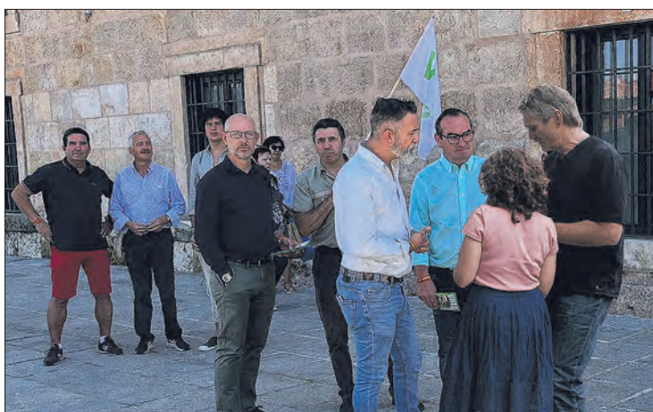
Los candidatos de Vox han mantenido encuentros con agricultores y ganaderos locales.

Durante estas reuniones, los candidatos tuvieron la oportunidad de escuchar las inquietudes y necesidades de los agricultores y ganaderos locales. Se abordaron temas como el acceso a recursos, el apoyo a la modernización del sector y la protección de los intereses agrícolas y ganaderos.