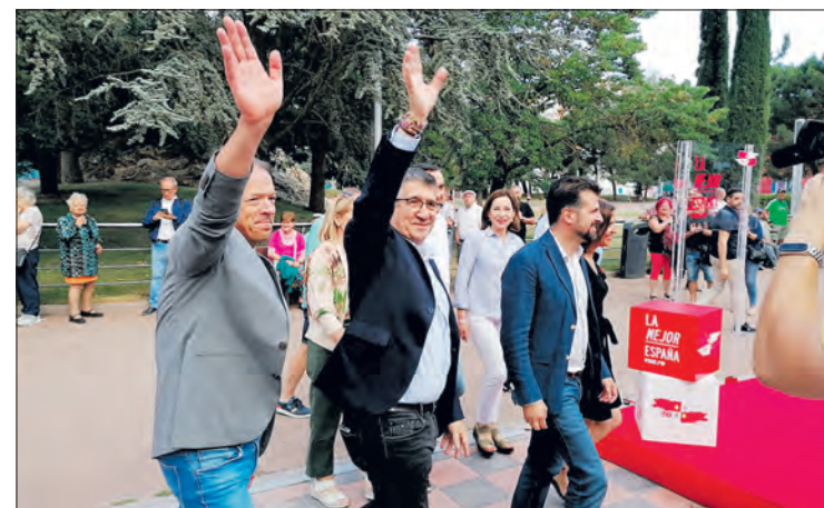
Patxi López, con los candidatos por Burgos al Congreso y al Senado el día 12.