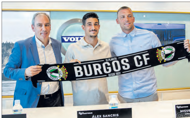
Sancris fue presentado en las instalaciones del concesionario GJ Automotive.

El equipo burgalés regresó al trabajo tras el fin de semana y se ejercitó en La Deportiva para preparar el partido del sábado 15 de julio, contra el Real Racing Club, que se disputará en Villarcayo a las 19.30 horas.