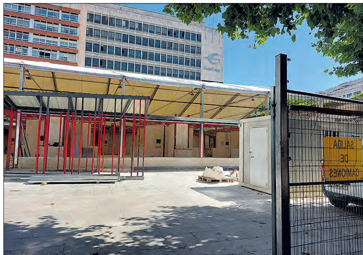
Imagen de las obras del mercado provisional, en Plaza de España.

Así lo manifestó tras las declaraciones de la alcaldesa de Burgos, Cristina Ayala, el viernes 7, quien responsabilizó al PSOE de "perder cuatro años" en la construcción del nuevo Mercado Norte, tras confirmar que tiene un coste cercano a los 30 millones, por lo que aseguró que es "inviable" y confirmó que está "sobredimensionado". "Es el monumento a la incompetencia", destacó Ayala, quien aseguró que la gestión realizada en el anterior mandato por el PSOE y Cs obliga a retrotraer el proyecto al momento en el que lo dejó el Partido Popu-