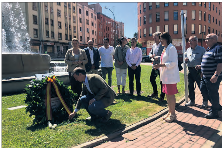
Acto de conmemoración, el jueves 13.

"Ningún día os borrará de la memoria del tiempo", manifestó la alcaldesa de Burgos, quien subrayó en sus declaraciones que "nuestro país tiene una larga y triste historia terrorista. "Es imprescindible que lo sigamos recordando cada año", señaló en relación al aniversario del asesinato de Miguel Ángel Blanco a manos de la banda terrorista ETA.