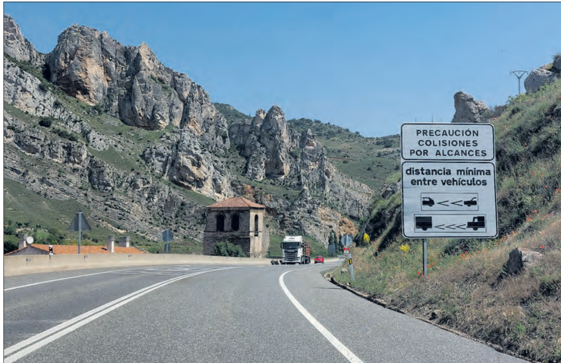
Imagen de la antigua N-I a su paso por la provincia de Burgos, concretamente por el municipio de Pancorbo.

Para ello, se han analizado los períodos vacacionales de verano, Semana Santa, el puente de la Constitución y Navidad, siendo el primero de ellos el motivo del lanzamiento del informe al tratarse de la época más compli-