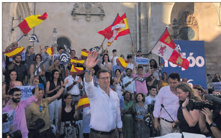
Acto central de campaña del PP de Burgos, el jueves 13, con la presencia de Núñez Feijóo.