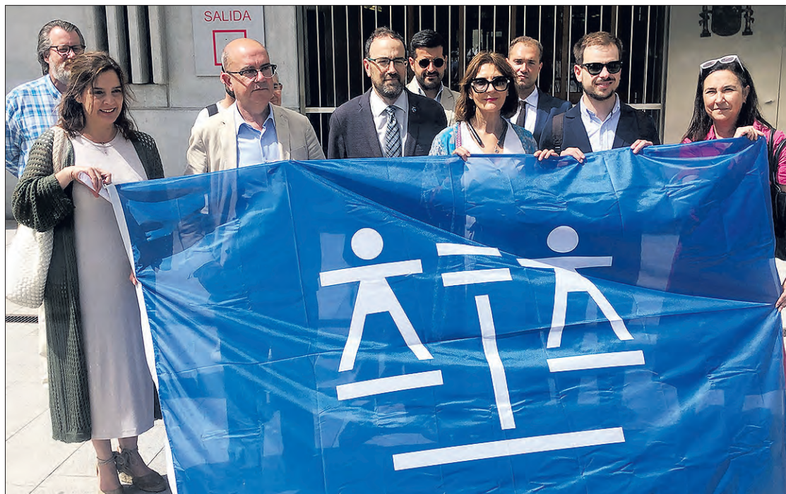
Miembros del Colegio de Abogados, frente a los Juzgados, el jueves 13.

"La reforma de la ley de Justicia Gratuita de 1996 ha dejado de ser una necesidad para convertirse en una urgencia nacional que el Parlamento debe abordar sin la más mínima dilación. La reforma de leyes para proteger a los colectivos más vulnerables