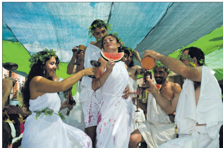
El vino y la comida darán rienda suelta a la Fiesta Romana en Honor a Baco.

Declarada Fiesta de Interés Turístico de Castilla y León en 2020, la XXIII Fiesta Romana en Honor al dios Baco de Baños de Valdearados es la mejor oportunidad para vivir de primera mano cómo eran las auténticas fiestas romanas.