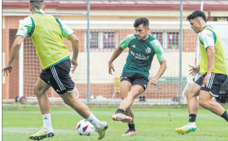
El Burgos CF continúa preparando el amistoso contra la SD Amorebieta.

El Burgos CF continúa preparando en La Deportiva su segundo encuentro de pretemporada