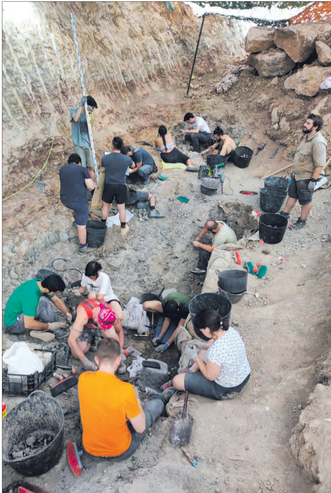
La campaña de excavaciones está promovida por el Ayuntamiento de Torrelara y cuenta con el patrocinio de la Diputación de Burgos.

Pero no solo hay un número alto de hallazgos. La diversidad de dinosaurios y otros vertebrados, así como de plantas fosilizadas,