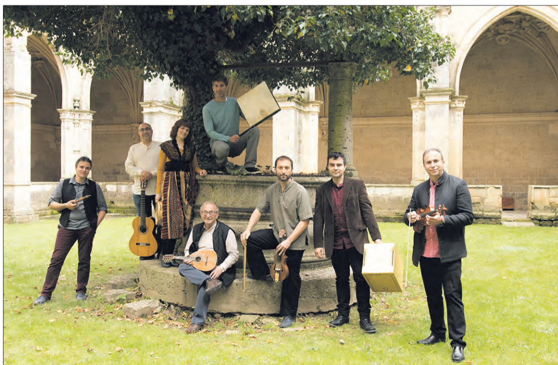
El Grupo Carrión está actualmente formado por ocho componentes.

Con este objetivo, el grupo Carrión visitará el 25 de julio Palacios de la Sierra, donde ofrecerá un concierto vermú a las 14.00 horas. Además de escuchar temas de toda Castilla y León, el público podrá también disfrutar de un recorrido por canciones de su trayectoria y sus discos, como 'Enramada', 'Sube al Árbol' y 'Tradiciones vivas'.