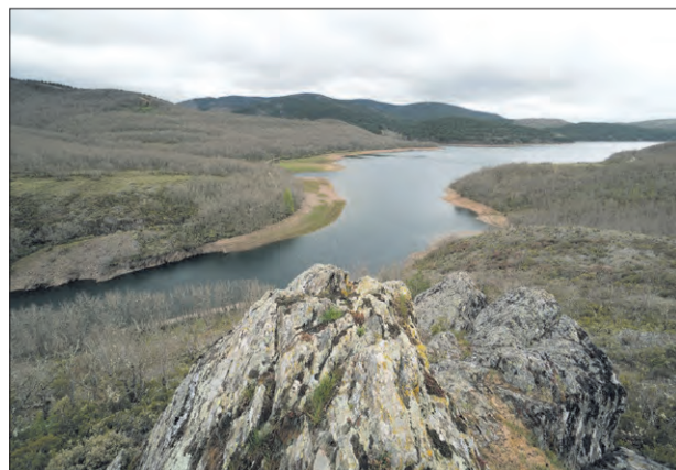
Pantano del Arlanzón, costa fluvial para tomar el sol y refrescarse.

Y a la lista se suma otro "must" cuando uno va en verano: un chapuzón en las piscinas naturales de La Presa. Un remanso de felicidad estival a base de aguas limpias y césped para un reponedor baño de sol de montaña. Con zonas verdes, merenderos, un bar-asador, aparcamiento y a solo diez minutos del centro, el plan no puede sonar mejor.