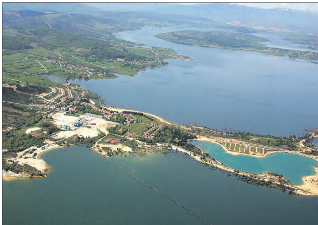
Arija, un verdadero mar interior de agua dulce, ubicado en la orilla sur del Embalse del Ebro.

Arena, deportes acuáticos y hasta chiringuitos. Entre paisajes verdes y naturaleza en estado puro se encuentran las 'playas' de Burgos