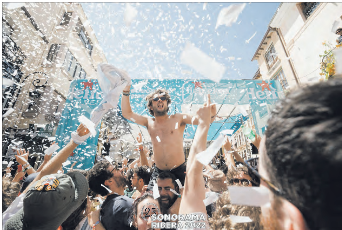
La mejor música indie nacional e internacional se dará cita en Aranda de Duero en agosto.

Esta edición cuenta con un cartel de altura, ya que el público podrá vibrar con las actuaciones en directo de grupos como: Ve-