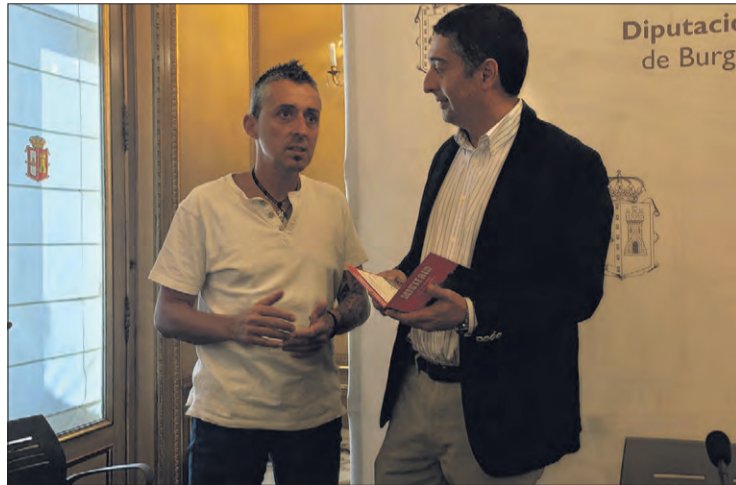
Presentación de las I Jornadas de Misterio de Pancorbo el día 19 en la Diputación.

En cuanto a la programación, destacó que se ha diseñado par-