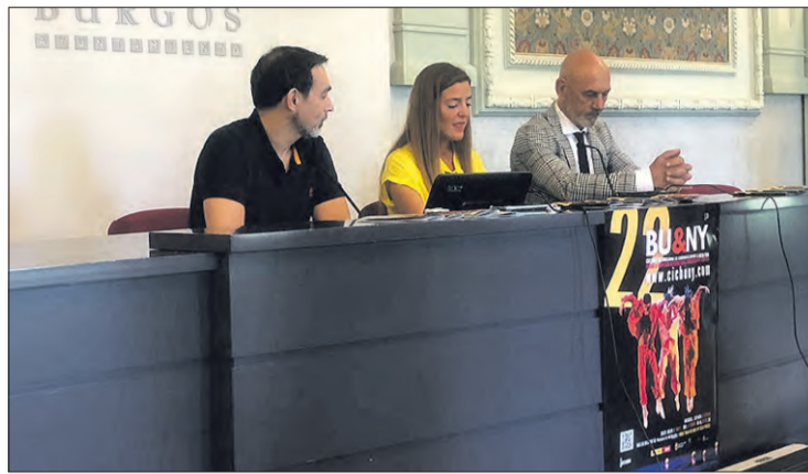
Presentación del evento, el miércoles 19.