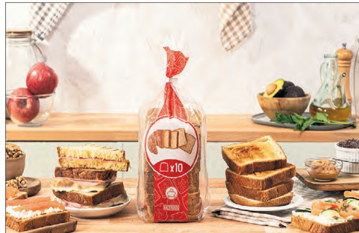
El nuevo pan de molde con masa de Croissant de Mercadona.

Este producto es elaborado por el Proveedor Dulce del Campo en sus instalaciones de la localidad vallisoletana de Medina del Campo.