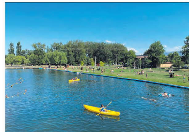
'La joya turística de Villarcayo' a orillas del río Nela.