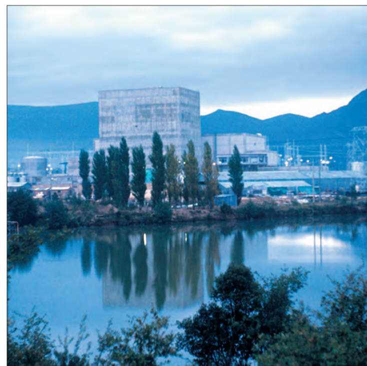
Imagen de la central nuclear de Santa María de Garoña.

financiar 12 proyectos municipales. Garoña tenía una potencia instalada de 466 MW, se inauguró en 1971 y se desconectó de la red eléctrica en diciembre de 2012, cuando Nuclenor comunicó al Ministerio su decisión de no seguir explotándola. En 2013 se declaró el cese definitivo, Nuclenor presentó una solicitud de renovación de la autorización en 2014 y en 2017 esta solicitud fue denegada por el Ministerio de Energía, Turismo y Agenda Digital.