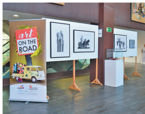
Exposición con obras participantes en la pasada edición

Este certamen está dirigido a jóvenes artistas de entre 16 y 30 años, los cuales pueden presentar sus obras en siete categorías: artes escénicas y cinematografía, pintura, letras jóvenes, música, gastronomía, diseño de moda y otras modalidades de artes