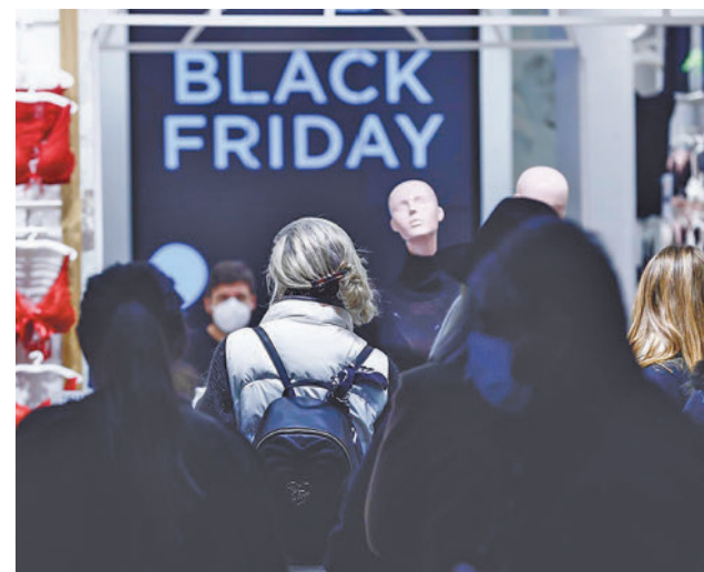
Compras en el Black Friday