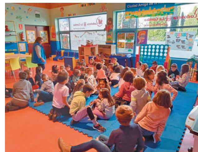
Una de las actividades de anteriores ediciones AYTO LOGROÑO

El plazo de solicitud finalizará el 21 de noviembre. Una vez atendidas las familias en situaciones consideradas prioritarias, en caso de quedar plazas vacantes, podrán acceder el resto.