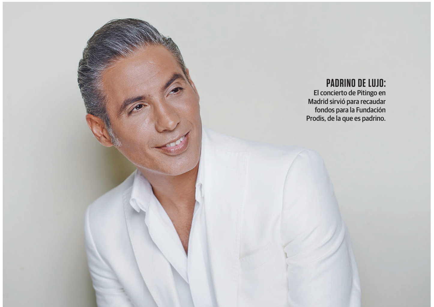
PADRINO DE LUJO: El concierto de Pitingo en Madrid sirvió para recaudar fondos para la Fundación Prodis, de la que es padrino.