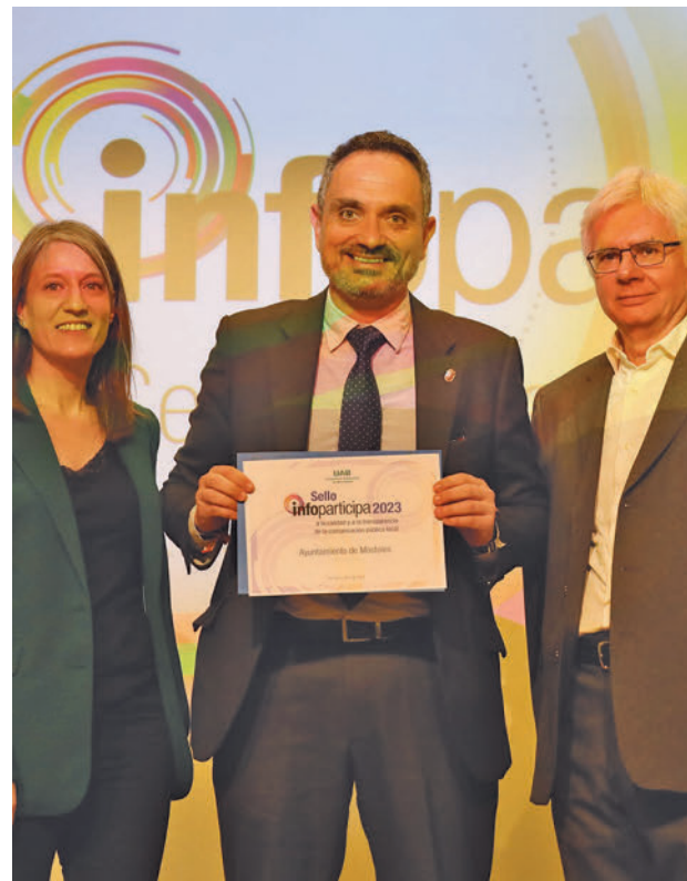
El alcalde y la regidora de San Lorenzo de El Escorial

“Es un orgullo para Móstoles saber que, entre los 179