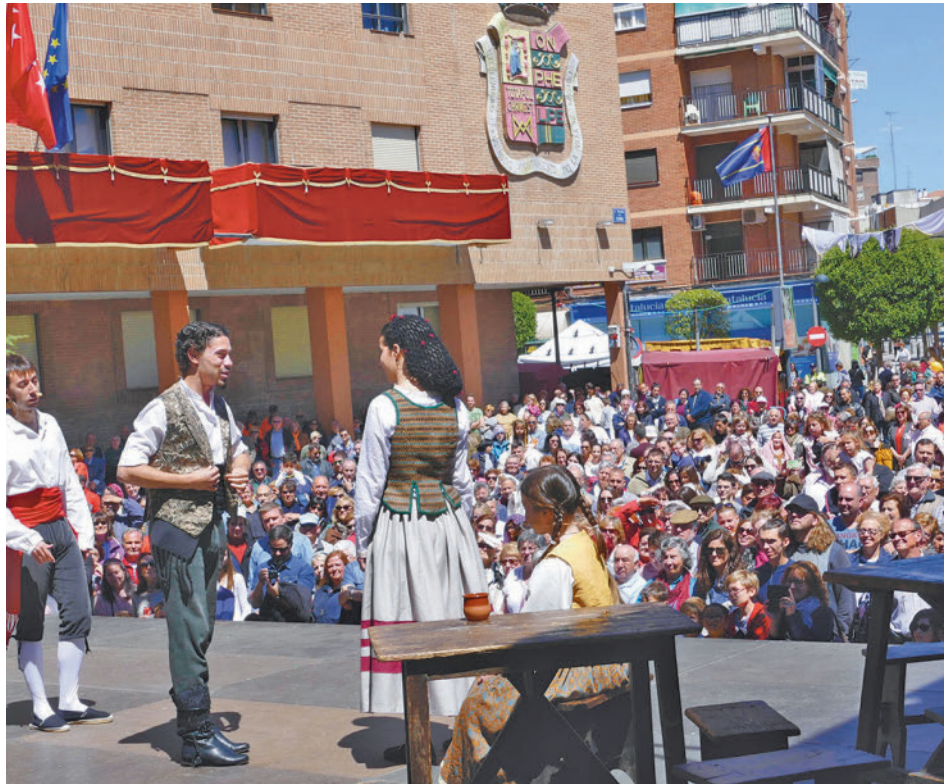
Tradicional representación de los hechos históricos del 2 de mayo de 1808

EL 42º CONCURSO DE CARROZAS DE LOS COLECTIVOS SE CELEBRARÁ EL 1 DE MAYO