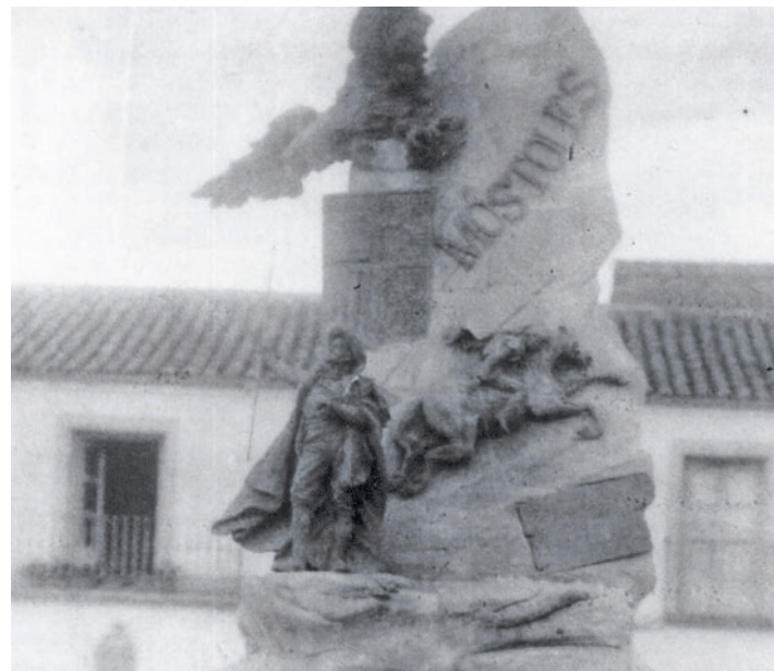
El monumento a Andrés Torrejón, célebre alcalde de Móstoles AHIMOS

Por otro lado, el domingo 28 de abril a las 12 horas el investigador histórico, escritor y conferenciante, Jesús Fuen-