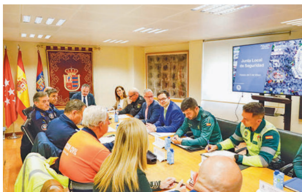
La Junta Local de Seguridad se reunió en el Ayuntamiento

Un total de 900 policías nacionales y 803 policías municipales formarán parte de un amplio despliegue para garantizar la seguridad de los