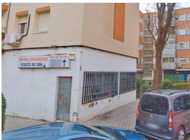
La iglesia evangelista Fuente de Vida, en Móstoles