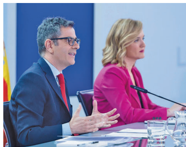
Rueda de prensa tras el Consejo de Ministros

El objetivo de esta reforma es tener “un control efectivo y periódico de los antecedentes por delitos sexuales o de trata”, señaló el ministro de Presidencia, Justicia y Relaciones con las Cortes, Félix Bolaños. “Hemos detectado casos de personas que después de estar trabajando con menores, y haber aportado el certificado, cometían delitos de esta naturaleza”, ha admitido Bolaños, quien ha resaltado que con estos cambios “se previene con mucha más eficacia que haya personas, delincuentes sexuales, que pue-