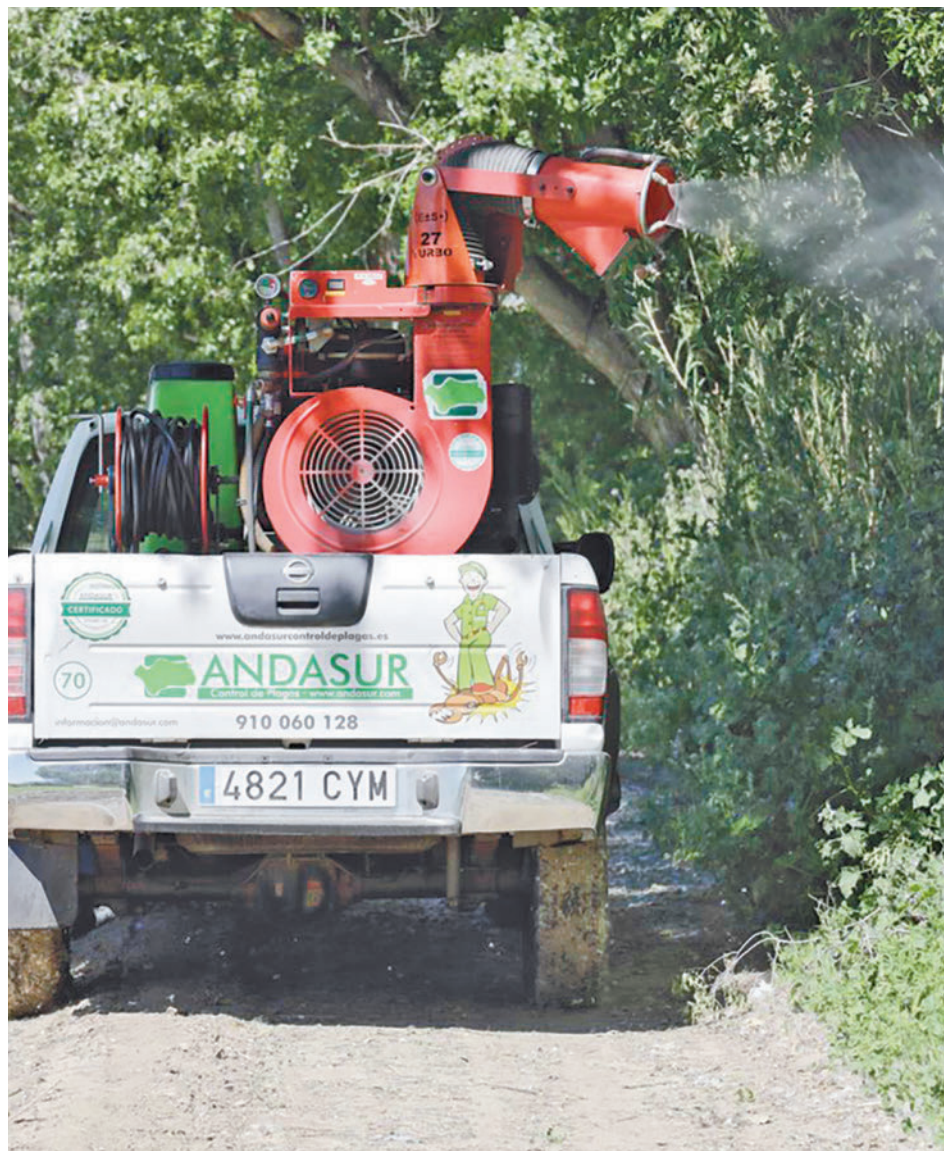
Los operarios trabajan donde habitualmente se desarrollan las larvas

En el caso de Getafe, desde principios de año se han realizado diversas prospecciones para determinar los tratamientos larvicidas más efectivos, haciendo para ello un seguimiento constante de su desarrollo, según han informado desde el Ayuntamiento de la localidad. Desde hace unos días, además, ya han se iniciado los trabajos preventivos en las zonas de los barrios de Perales del Río y Los Molinos donde podría haber algún tipo de problema con el desarrollo tanto de las larvas de los mosquitos como