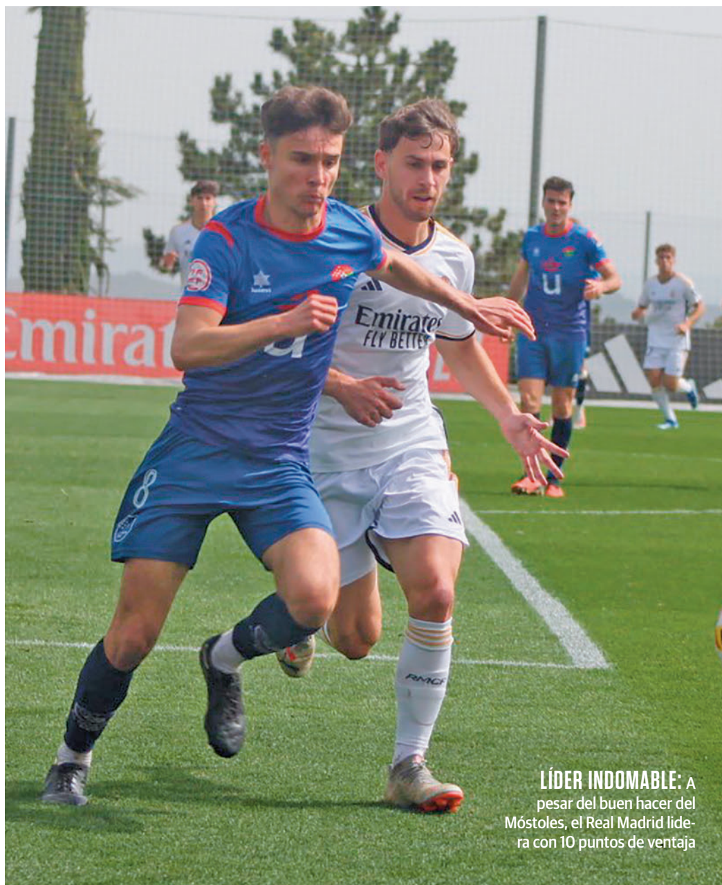
LÍDER INDOMABLE: A pesar del buen hacer del Móstoles, el Real Madrid lidera con 10 puntos de ventaja

Con el Móstoles (o el Real Madrid C) ya clasificado, los otros tres billetes para la promoción de ascenso tienen varios pretendientes. El que mejor lo tiene es el Leganés B, tercer clasificado con 9 puntos de ventaja cuando solo quedan 12 en juego. Más méritos deberán hacer cuarto y quinto clasificados, Tres Cantos y Las Rozas, ante la pujanza de Alcalá, Alcorcón B y Moscardó. Este domingo, dos enfrentamientos directos: Tres Cantos-Las Rozas y Alcorcón B-Alcalá. Un poco más abajo aparecen dos equipos, Galapagar y Paracuellos MX, que tienen la quinta plaza a tres y cuatro puntos, respectivamente, pero que tampoco