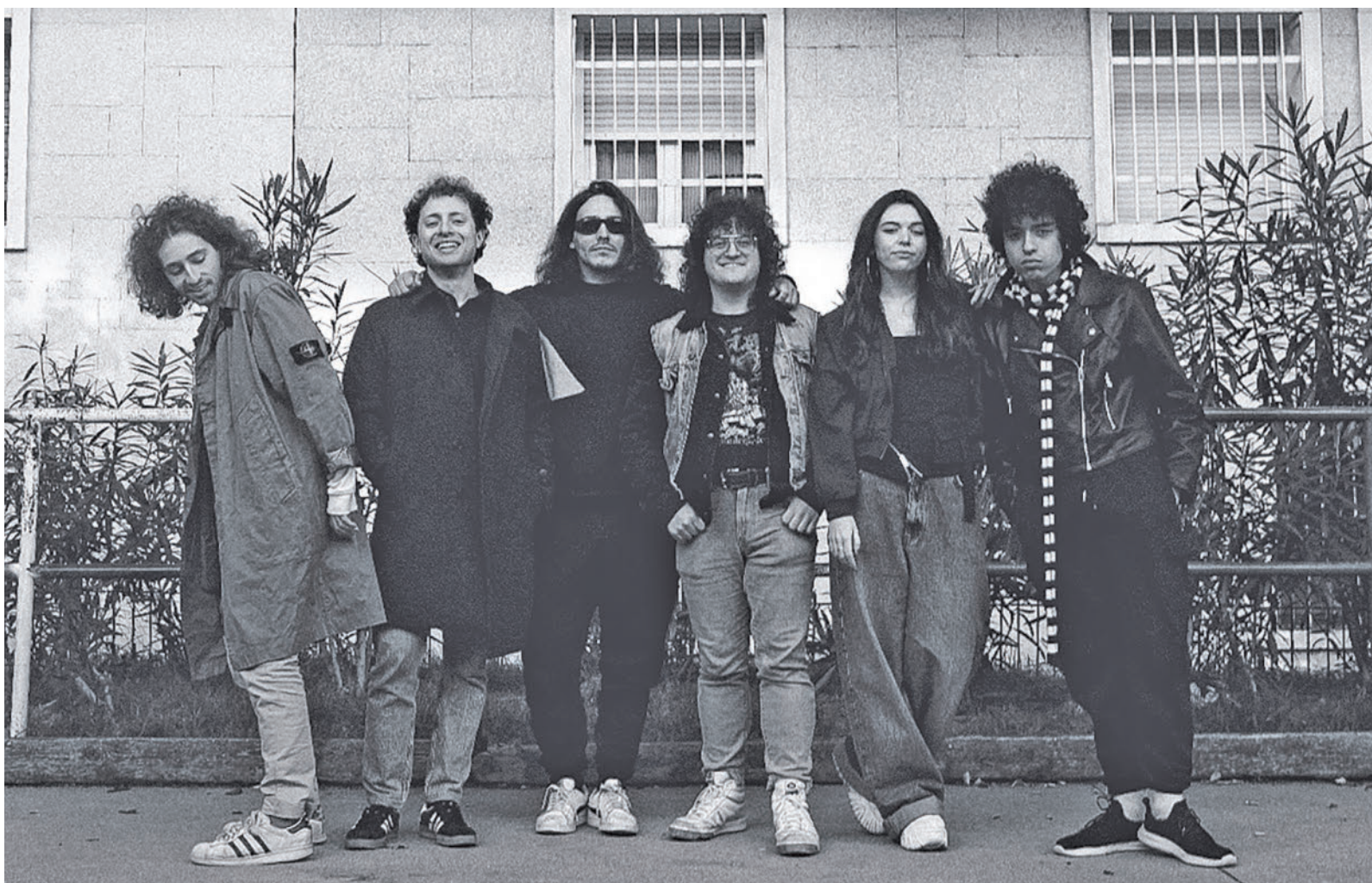
Foto de la formación actual de la banda madrileña