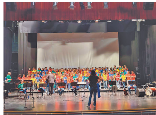
625 chicos son los que participan de este proyecto educativo

gentedigital.es Toda la actualidad de Getafe, en nuestra página web.