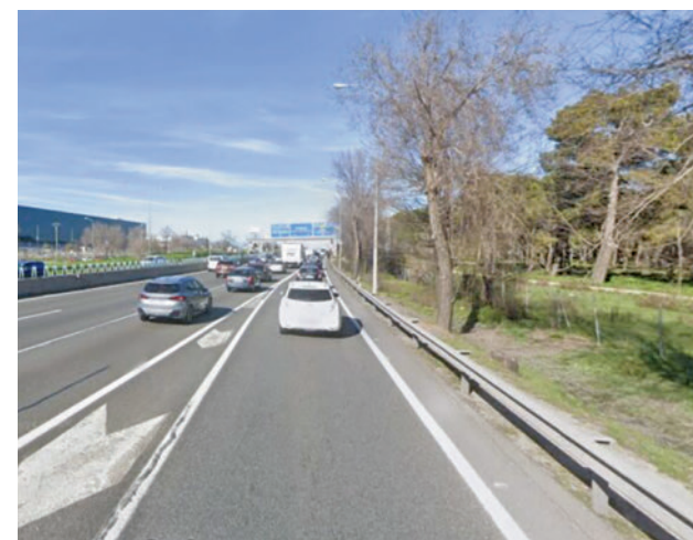
Este año se licitará la obra para mejorar los accesos de la A-4

de Los Ángeles, San Marcos, Carpetania, Los Olivos I y II, y Los Gavilanes, principalmente. En lo que respecta a la movilidad peatonal, la actual pasarela de acceso al Cerro de los Ángeles será sustituida por una más moderna y más accesible. A ello, se incorporará un nuevo paso elevado situado frente al área de San Marcos, como alternativa al antiguo paso subterráneo que se clausuró por no cumplir con las condiciones adecuadas y para facilitar el acceso de trabajadores que utilizan el transporte público.