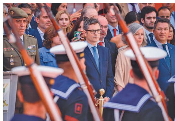
Félix Bolaños, durante el pasado 2 de mayo