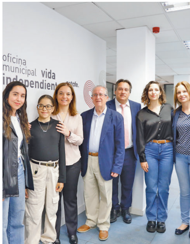
La OVI se ubica en la calle Daoiz, nº16 AYUNTAMIENTO DE GETAFE

Fomentar la autonomía personal, la inclusión y el ejercicio de los derechos de las personas con discapacidad intelectual, "en igualdad de condiciones que el resto de vecinos", es el objetivo que persigue la Oficina Municipal de Vida Independiente (OVI) (calle Daoiz, 16) que esta semana ha abierto sus puertas por primera vez. No se trata, por tanto, de un ser-