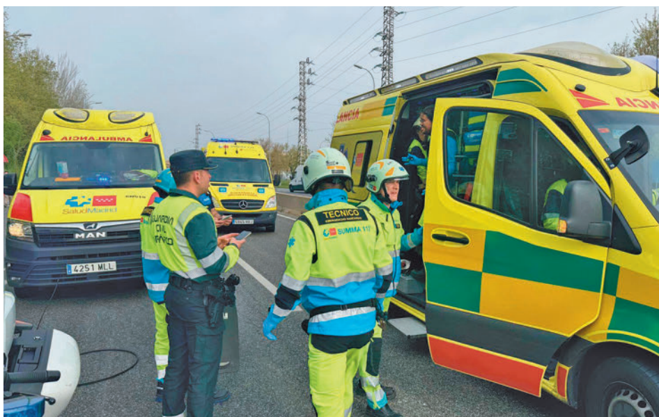
Intervención de Guardia Civil y SUMMA en un accidente reciente