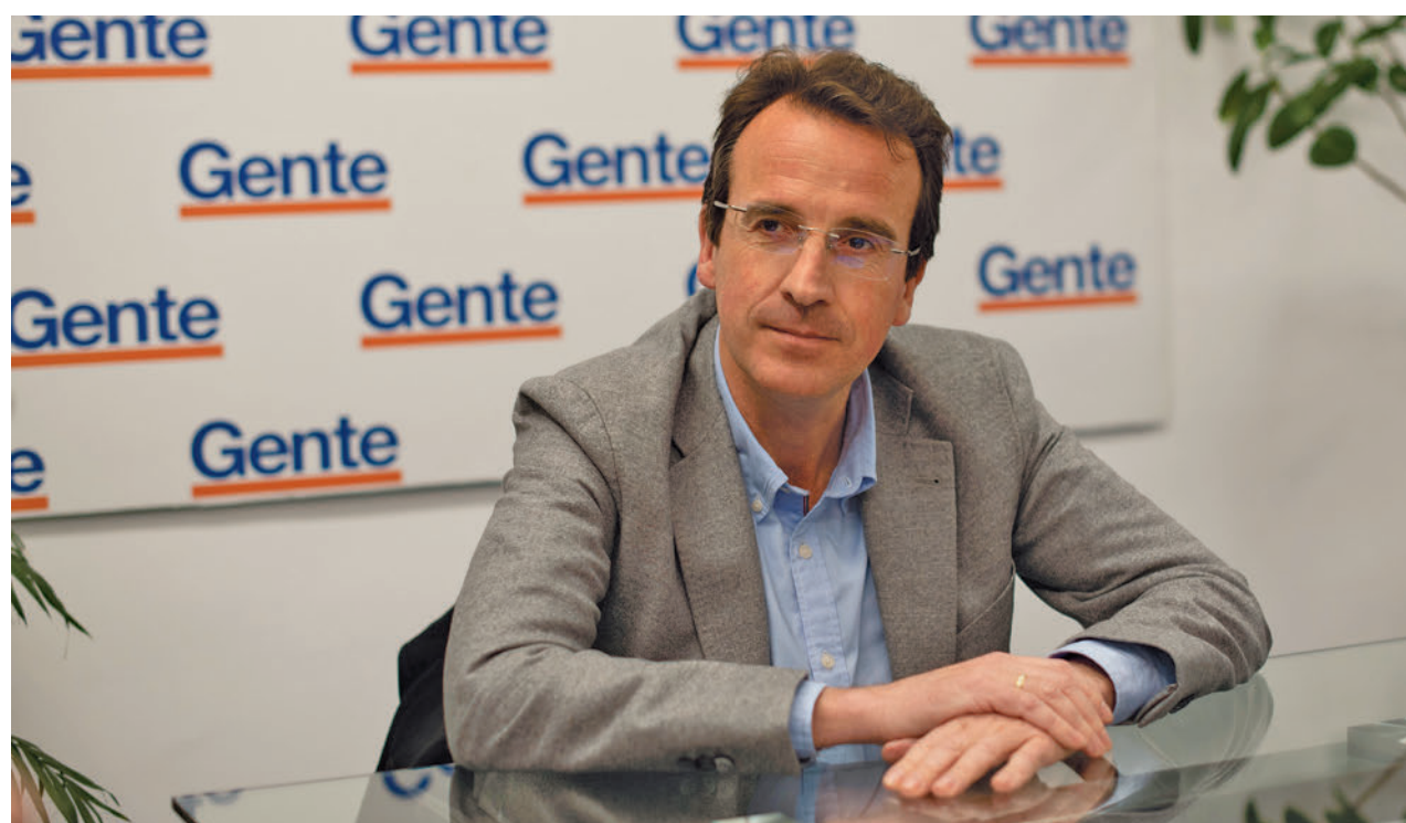
CARLA FLECHA / GENTE