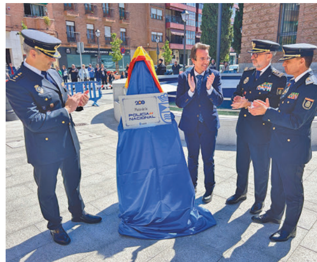
Inauguración de la nueva plaza