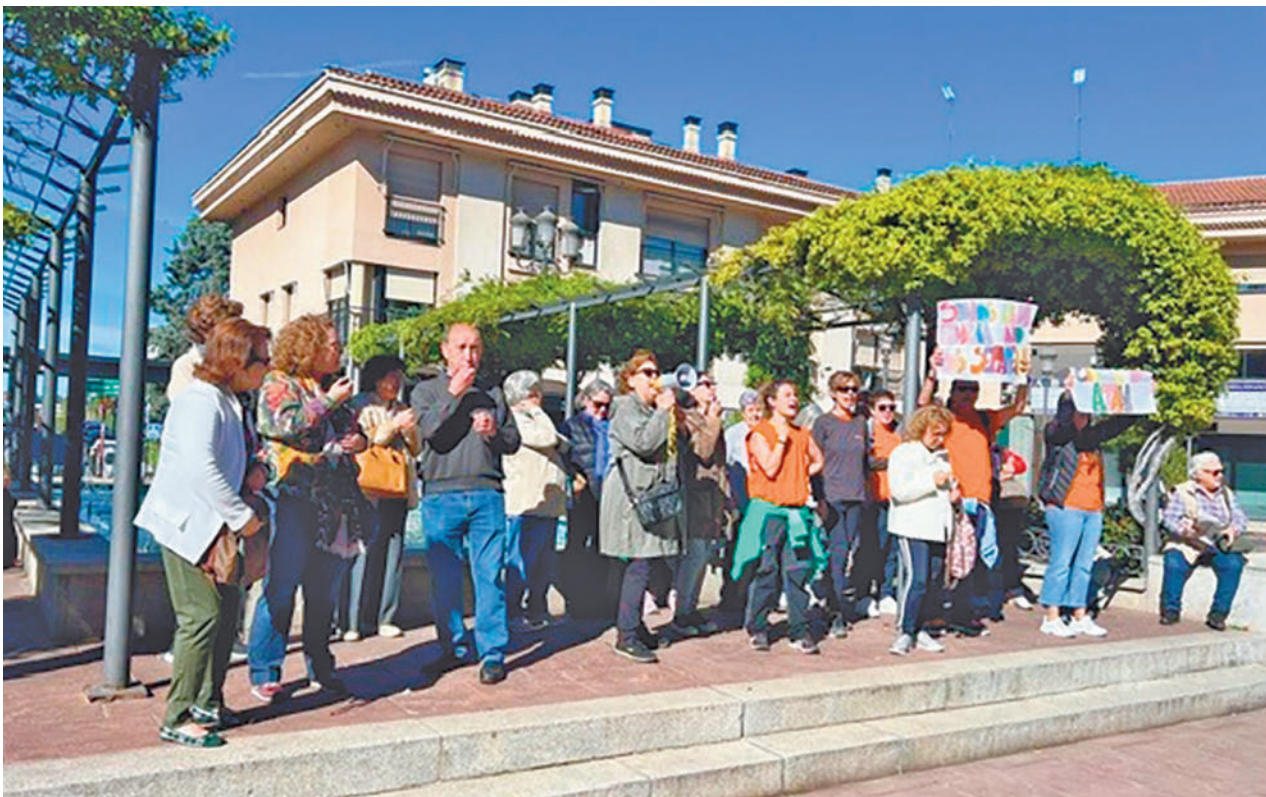
Protesta de familiares de los usuarios