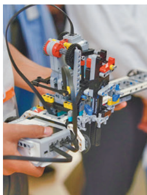
Una de las creaciones

En la prueba del Robotón los ganadores fueron los proyectos ‘San José’ y ‘LogosBot’, del colegio Logos, mientras que en Maqueta 3D, resultaron vencedoras las creaciones ‘Vicente Aleixandre’ y ‘Cristo Rey - Fundación José