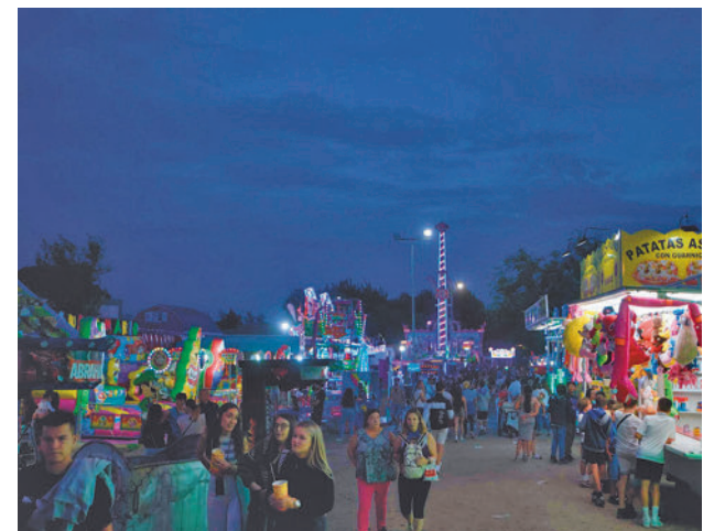
Recinto Ferial de Las Rozas