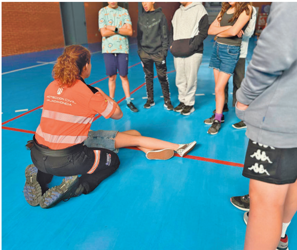
Una voluntaria muestra la posición lateral de seguridad a los alumnos