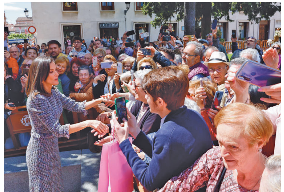
La Reina Letizia saluda a los vecinos que se congregaron

EL PREMIADO ENSALZÓ LA OBRA DE CERVANTES EN SU DISCURSO