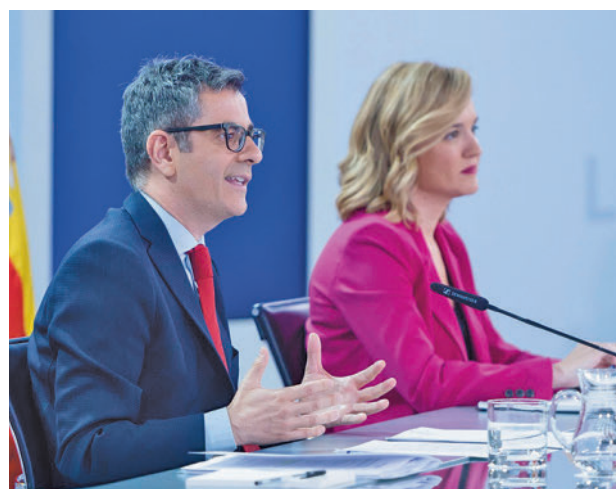
Rueda de prensa tras el Consejo de Ministros

El objetivo de esta reforma es tener “un control efectivo y periódico de los antecedentes por delitos sexuales o de trata”, señaló el ministro de Presidencia, Justicia y Relaciones con las Cortes, Félix Bolaños. “Hemos detectado casos de personas que después de estar trabajando con menores, y haber aportado el certificado, cometían delitos de esta naturaleza”, ha admitido Bolaños, quien ha resaltado que con estos cambios “se previene con mucha más eficacia que haya personas, delincuentes sexuales, que pue-