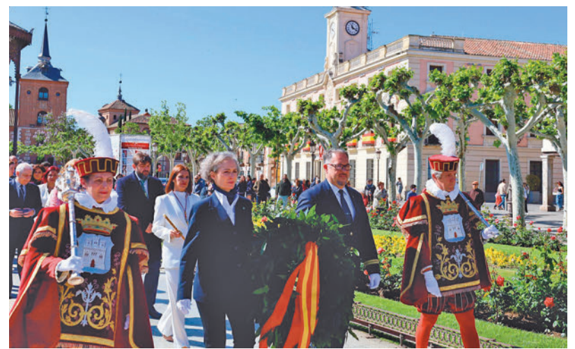
Homenaje a Cervantes: El Ayuntamiento de Alcalá de Henares, encabezado por su alcaldesa Judith Piquet, rindió el martes 23 de abril el tradicional homenaje a la figura de Miguel de Cervantes. La Corporación colocó una corona de flores en la estatua que el escritor del 'Quijote' tiene en el centro de la plaza que lleva su nombre.