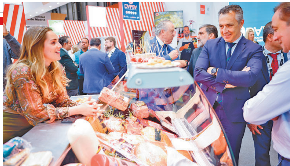
Novillo contempla algunos de los productos madrileños

El Ayuntamiento de Madrid, por su parte, aprovechó el evento para dar a conocer los productos de sus mercados municipales. “Madrid está,