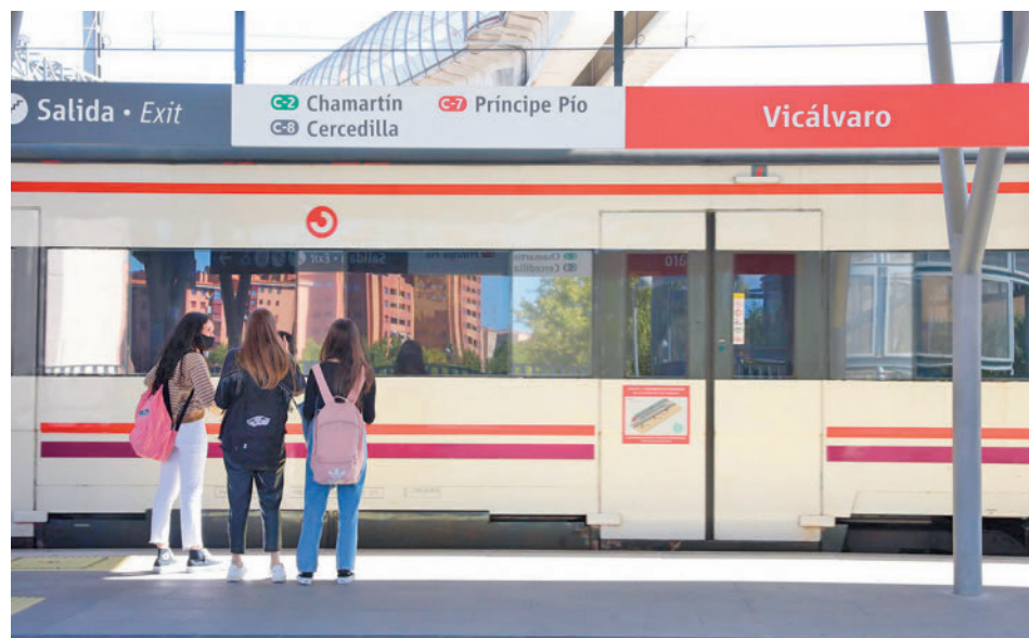
Estación de Cercanías de Vicalvaro

A lo largo de la línea de separación de carriles central e izquierdo se colocarán balizas luminosas embebidas y enrasadas en el firme, que indicarán, en color rojo, los tramos en los que no es posible acceder al carril reservado, y, en color verde, los tramos habilitados para ello.