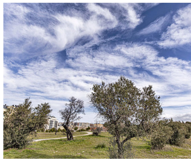
Zona verde de Rivas E.P.

Toda la información de la zona Este, en nuestra página web.