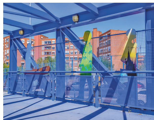
Una de las obras presentadas

Estas obras buscan embellecer la ciudad con estilos diferentes y son 'Te quiero libre 1' y 'Te quiero libre 2', situadas en la avenida de la Constitu-