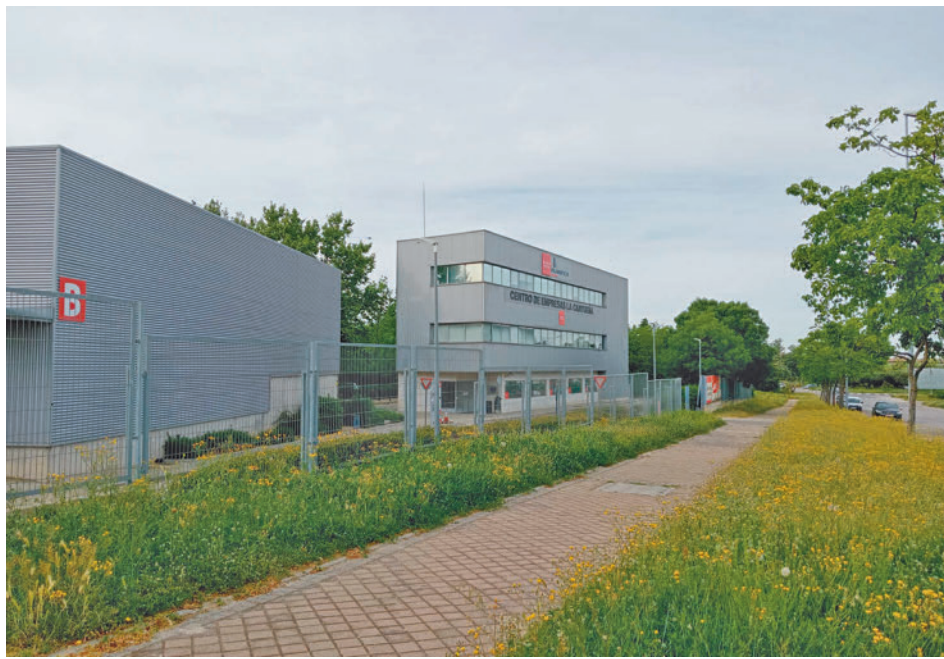
Serán 4.000 metros cuadrados distribuidos en tres plantas con zonas comunes GENTE

Se trata de 4.000 metros cuadrados distribuidos en tres plantas con zonas comunes, como las de formación, consigna, comedor o enfermería, así como dormitorios, zonas de baño y espacios para los educadores donde pue-