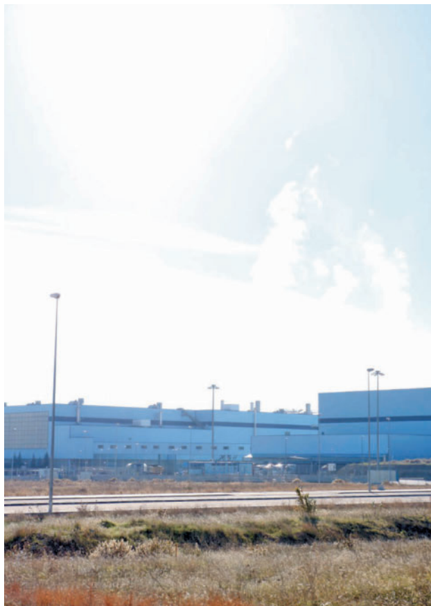
Parcelas ya urbanizadas y que disponen de todos los servicios

SE VALORARÁ LA CUANTÍA DE LA INVERSIÓN PRIVADA PREVISTA