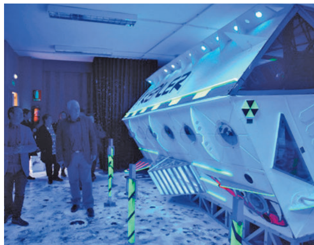
El proyecto fue puesto en marcha en los años 90

el Ayuntamiento y la Comunidad de Madrid, y desde entonces "no ha parado de crecer hasta convertirse en un equipamiento único y referente en la región". Quienes acuden a sus instalaciones tienen la posibilidad de conocer la bóveda celeste, ponerse a los mandos de una nave espacial o realizar maquetas de los movimientos de traslación y rotación de los satélites.