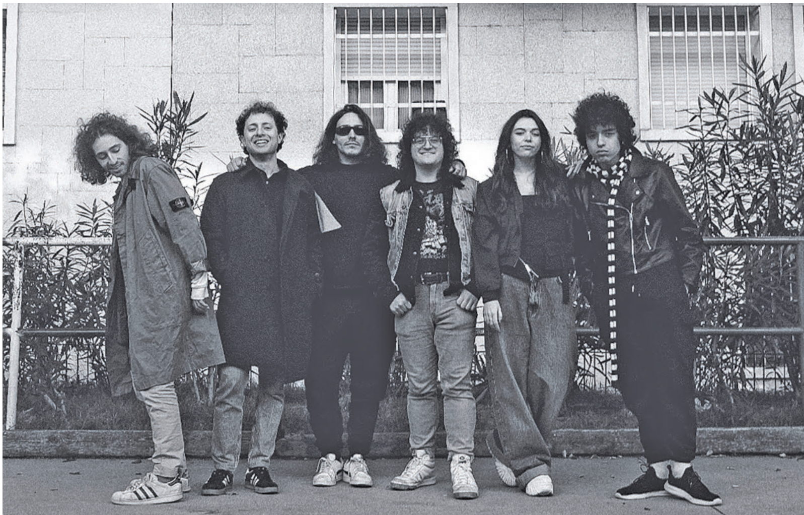
Foto de la formación actual de la banda madrileña