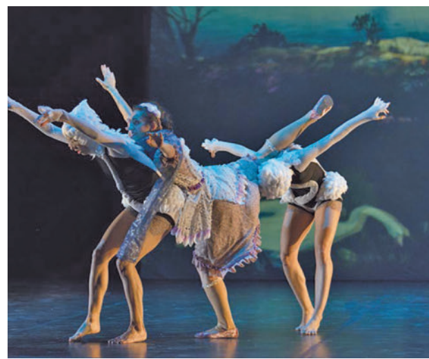
'El Lago de los cisnes en 3D' AYUNTAMIENTO DE FUENLABRADA

Toda la actualidad de Fuenlabrada, en nuestra página web.