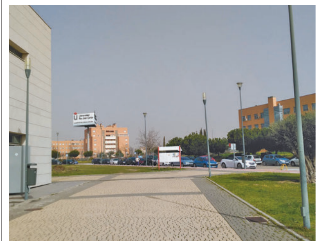
Pretende unir a la comunidad universitaria

En este punto, el regidor ha abogado por que haya una "coordinación", aunque ha afeado que aún no exista la "fluidez" necesaria con el Gobierno de la región. "En un momento de tanta crispación política, nos interesa desbloquear los asuntos pendientes con la Comunidad", ha precisado al respecto. La integración de la plantilla de profesionales y de las instalaciones en la red de la Comunidad de Madrid fue aprobada en pleno en 2022.