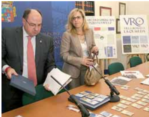
Momento de la presentación del programa de actos.

"No conozco ninguna obra pública que haya tardado tanto en llevarse a cabo salvo la del