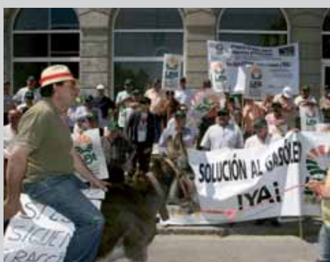
Imagen de la protesta pacífica ante la Subdelegación del Gobierno.

Tras concentrarse en la Subdelegación del Gobierno medio centenar de agricultores acompañados por varios burros recorrieron la Calle Mayor