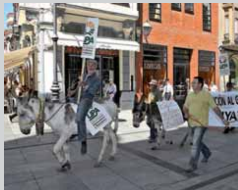
Acompañados por varios burros recorrieron la Calle Mayor.