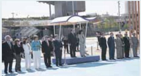
Imagen de los representantes regionales desplazados a Zaragoza.