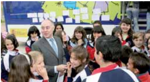
Unos 200 niños pasaron por la Caravana Proniño durante la jornada.

El programa Proniño, trabaja en 13 países de Latinoamérica a través de 1.429 centros educativos, llegando a beneficiar hasta 65.951 niños. Y es que en números absolutos, el índice más alto de niños trabajadores se encuentra en la región de Asia y Pacífico, con 122 millones de niños trabajadores, de entre 5 y 14 años de edad.