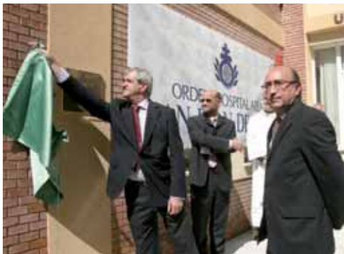
El consejero de Sanidad de la Junta durante la inauguración.

El equipo de personal sanitario en la nueva Unidad Rehabilitadora de Psiquiatría San Isidro estará integrado por un médico psiquiatra, un médico generalista, un psicólogo, ATS, monitores y auxiliar de enfermería, para prestar atención a un total de 42 pacientes.