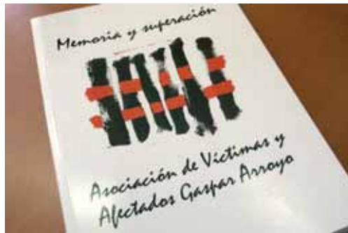
Imagen de la Memoria de la Asociación de Víctimas y Afectados.

La edición pretende que siga vivo en la memoria a falta de la reconstrucción