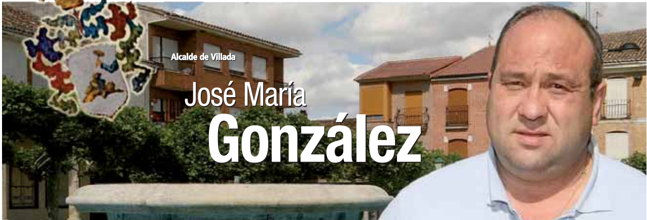
Alcalde de Villada