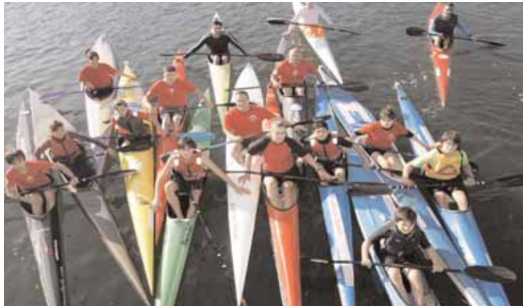
Un grupo de piragüistas del club entrenan en el Barrio Pesquero.