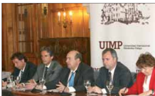
Imagen de la presentación de las actividades culturales de la UIMP.