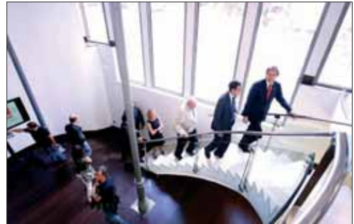
Un momento de la visita de las autoridades al centro con motivo de su inauguración.

El edificio cuenta con un espacio diáfano en la parte baja y con 24 puntos informáticos en un segundo