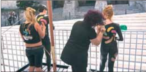
Éxito absoluto de la anterior actividad, Santander Body Painting.