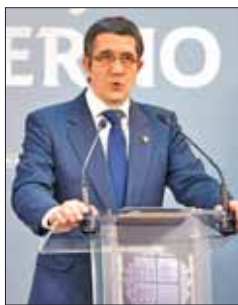
El lehendakari Patxi López

El alto el fuego de ETA ha obtenido una fría acogida en la clase política y la ciudadanía, pese a que a lo largo de toda la semana la posible legalización o no de Batasuna ha centrado la actualidad política. Patxi López, lehendakari socialista, visitó en la Moncloa al presidente del Gobierno para abordar el asunto. López asegura que no le importaría perder el Gobierno si "Euskadi avanza hacia la paz y Batasuna da todos los pasos. "Estamos mejor porque ETA ha inte-