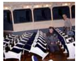
Imagen del inicio de las obras.

El proyecto de remodelación del edificio incluye actuaciones de acondicionamiento y mejora en la cubierta del edificio, en la fachada, en el patio de butacas y escenario, además de las medidas de mejora de la accesibilidad y dotación de nuevos sistemas de calefacción, aire acondicionado y ventilación.