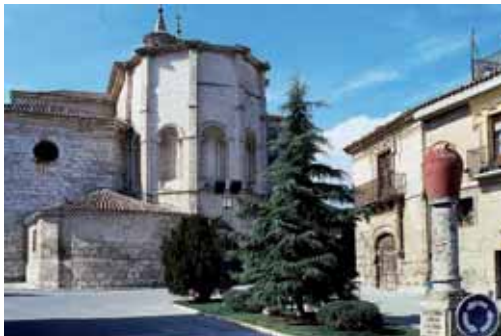
Imagen de archivo del municipio palentino de Dueñas.

Constituye uno de las obras más sobresalientes del renacimiento en Castilla y León y aúna el flamenco con la herencia italiana.