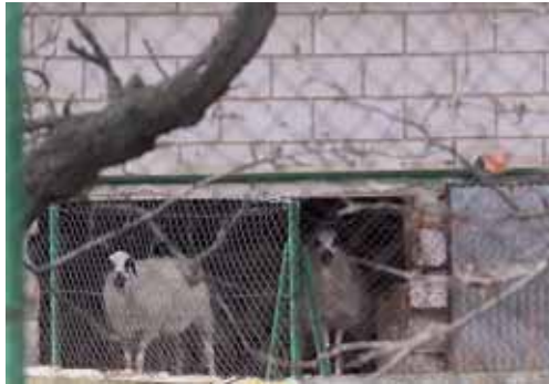
Imagen de archivo de las instalaciones de la granja de Allende el Río.

La Institución Provincial también aportará para un segundo