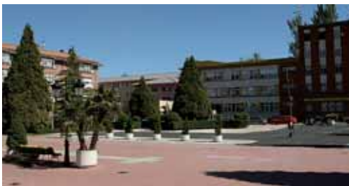
Imagen de archivo del municipio palentino de Guardo.

En este sentido, hay que recordar que la Consejería de Medio Ambiente, que informó en su día de forma favorable la Declaración de Impacto Ambiental del Estudio Informativo de la variante estudiada, Sur 1 frente a la segunda alternativa estudiada, Sur 2. Los argumentos para desechar la segunda opción se resumen en que en ésta dominan las afecciones de carácter moderado, lo que supondría una mayor afección a la superficie forestal y un mayor volumen de obra, mientras que la Sur 1 ocasiona impactos calificados en su mayoría como compatibles. La alternativa finalmente seleccionada discurre al sur de la localidad de Guardo y cuenta con una longitud de 4,6 km. La variante deja al sur la línea de ferrocarril de vía estrecha FEVE, la futura zona residencial de La Albariza y el Polígono Industrial de Campondón.