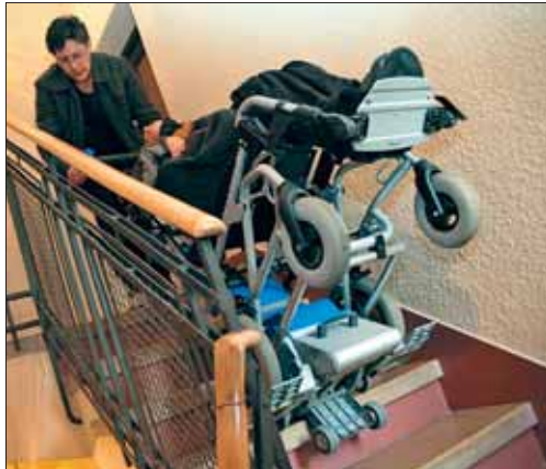
Una persona dependiente y su cuidadora en su casa.

Por primera vez, el número de personas que tienen derecho a beneficiarse de la Ley de Dependencia supera el millón. Concretamente, son 1.035.812 ciudadanos en toda España. Este incremento se origina, sobre todo, debido a la entrada en el sistema, el pasado 1 de enero, de los dependientes moderados. No obstante, tener reconocido el derecho como receptor de prestaciones o servicios no es sinónimo de recibir dichas 'ayudas'. Más de 231.000 personas catalogadas con una dependencia severa o gran dependencia -de las casi 900.000 reconocidas- no están siendo atendidas como sus derechos deberían garantizar. La cifra se