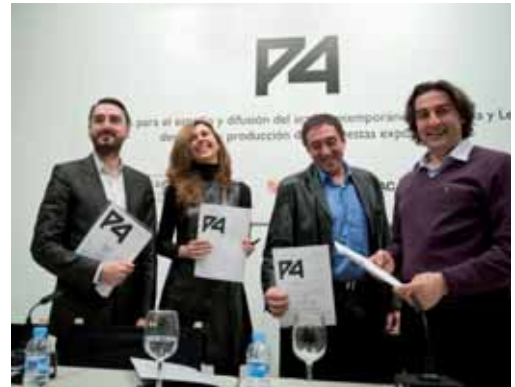
Los cuatro directores tras la rueda de prensa de presentación en Burgos.

La plataforma P4 simboliza la intención de las cuatro entidades de estrechar sus relaciones interinstitucionales para tratar de dar un paso "más allá" en beneficio del contexto artístico en el que se insertan. Distintas actividades materializarán los objetivos de este proyecto que, entre otros, contempla una convocatoria de proyectos de artistas nacidos o residentes en Castilla y León, para el desarrollo y la producción de cuatro proyectos artísticos inéditos, por un importe máximo de 5.000 euros. El objetivo es estimular y promocionar la creación artística.