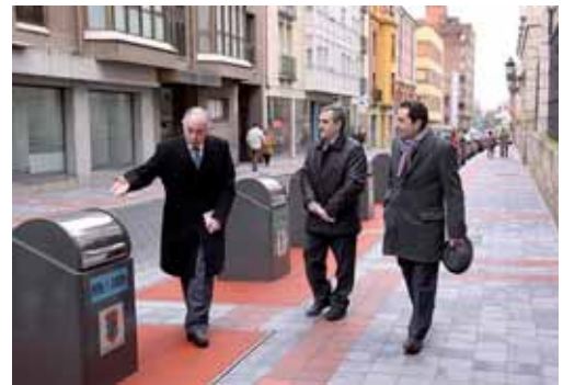
Un momento de la visita a la finalización de las obras en Cardenal Almaraz.

El alcalde de Palencia realizó un balance "positivo" del Fondo Estatal señalando que "estamos muy satisfechos, el 92% de las obras en la ciudad de Palencia ya han finalizado o lo harán en los próximos días, como es la adecuación de un tramo de cinco kilómetros de la ribera del río Carrión, de la que faltaban algunos