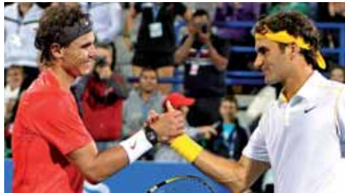
Nadal y Federer se vieron las caras en la final del torneo de exhibición de Abu Dhabi

Con calor o sin él, lo único cierto es que Rafa Nadal afronta el primer gran campeonato del año con el conocimiento de que una buena actuación puede servirle para ampliar su diferencia al frente del ranking de la ATP. El número uno del mundo sólo pudo llegar en la edición de 2010 hasta los cuartos de final, una