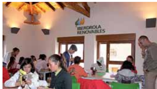
Imagen del Aula de la Energía de la localidad de Astudillo.

Iberdrola ha informado asimismo de que a lo largo de este segundo trimestre del curso escolar 2010-2011 continuará la actividad del aula didáctica, "la primera de estas características puesta en marcha en Castilla y León que tiene como objetivo mostrar a los centros educativos y asociaciones de la región las