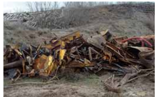
Los dos vecinos de Valladolid fueron detenidos en Tariego de Cerrato.