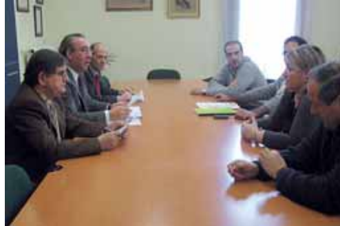
Un momento de la reunión celebrada en el Palacio Provincial.

El desacuerdo tenía que ver con la ubicación de los contenedores y con la recogida de los