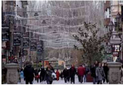
Imagen de archivo de la ciudad de Palencia.

La Comisión Informativa de Bienestar Social dictaminó favorablemente la renovación del convenio de colaboración entre el Ayuntamiento de Palencia y el Consejo de la Juventud para la puesta en marcha de este programa, por el que se ofrecerá un servicio básico de orientación laboral, con bases de datos actualizadas de las ofertas de empleo en la ciudad de Palencia, que presta también asesoramiento personalizado para el autoempleo y la creación de empresas o proyectos emprendedores; además de la realización de itinerarios personali-