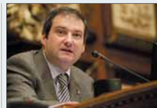
JORDI HEREU ALCALDE DE BARCELONA 109.939

En el ranking de los alcaldes mejor pagados Barcelona encabeza el listado. Su actual alcalde, Jordi Hereu, se ha bajado el sueldo recientemente un 5 por ciento, pero con todo recibe al año el bruto más elevado