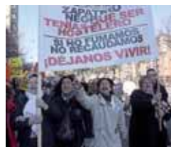
Un momento de la manifestación.

"Los hosteleros venimos diciendo desde hace año y medio que esto sería la ruina del sector y así ha ocurrido" manifiestan a la vez que apuntan que habrá más movilizaciones. Piden que se modifique la Ley ya que si no traerá "una pérdida de empresas y puestos de trabajo".