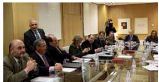
Reunión de los órganos fiscalizadores de las administraciones.

Tras revisar el estado de cuentas en los últimos tres años, en este ejercicio se nota "un crecimiento muy notable", a pesar de que, como afirmó el responsable de Entidades Locales, "algunas