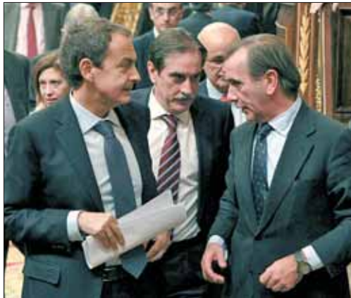
Zapatero, Alonso y Valeriano Gómez, ministro de Trabajo

Los sindicatos y el Gobierno han alcanzado este pacto tan sólo un día antes de que el Consejo de Gobierno del viernes 28 de enero apruebe el anteproyecto de Ley de la reforma sobre el sistema vigente. Los cambios aplicados incluyen además el alargamiento de la edad legal de jubilación a los 67 años, con 37 de cotización para percibir