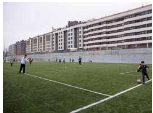
La empresa 'Enricar' ha ejecutado las obras en los últimos dos meses.

El Ayuntamiento ha ejecutado con cargo al Fondo Estatal otros seis proyectos deportivos por diferentes barrios de la ciudad, que suman 1,2 millones de