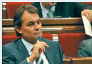
ARTUR MAS PRESIDENT DE LA GENERALITAT CATALANA 144.030

El president catalán es el cargo mejor remunerado de España. El bruto anual que recibe es de 144.030 euros pese a que su predecesor se lo bajara hasta un 15%. Mas ha prometido rebajarse otra vez el sueldo.