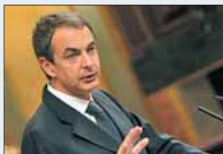
JOSÉ LUIS RODRÍGUEZ ZAPATERO PRESIDENTE DEL GOBIERNO 78.185

José Luis Rodríguez Zapatero cobrará en 2011 un 15 por ciento menos que lo que le correspondía en 2010 tras el recorte en su salario, pero cuando deje de ser presidente recibirá 80.000 euros al año vitalicios