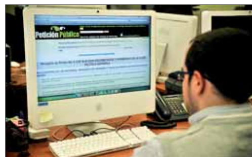
La recogida de firmas está en noalossueldosdelospoliticos.blogspot.com

los 35 exigidos para otros trabajadores; y por último mostrar la diferencia salarial con el resto de empleos ya que "según dietas y complementos un diputado puede alcanzar los 6.500 euros mensuales". La iniciativa que ha corrido como la pólvora en internet propone un sueldo único contra "el agravio socioeconómico" existente.