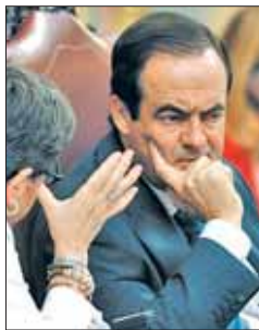
José Bono en el Congreso

Esta semana, José Bono, presidente del Congreso, ha remitido una carta a todos los parlamentarios en la que les emplaza a brindar dentro de una semana propuestas para el futuro del complemento de pensiones, que ha saltado al debate público tras ser calificado como "privilegio" por parte de Rajoy, pese a que tan solo 81 de los 3.600 diputados electos en Democracia se haya beneficiado de él. En su misiva, Bono incide además en otras cuestio-