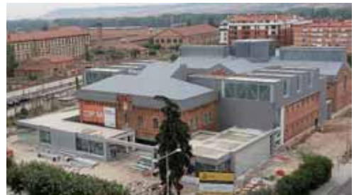
Imagen de archivo de la rehabilitación de la antigua prisión provincial.