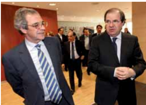
Juan Vicente Herrera y César Alierta a su llegada al acto.

en Castilla y León más de 900 millones de euros gracias a una administración electrónica, sin papeles, en la que han participado todos los municipios".