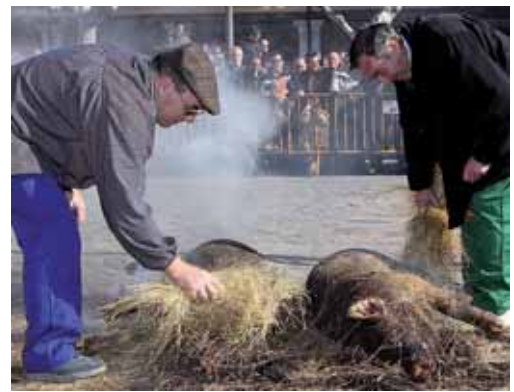
Imágenes de archivo de la celebración del día de la patrona palentina.