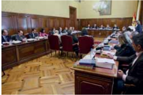
Un instante de la sesión plenaria celebrada el miércoles 26 de enero.