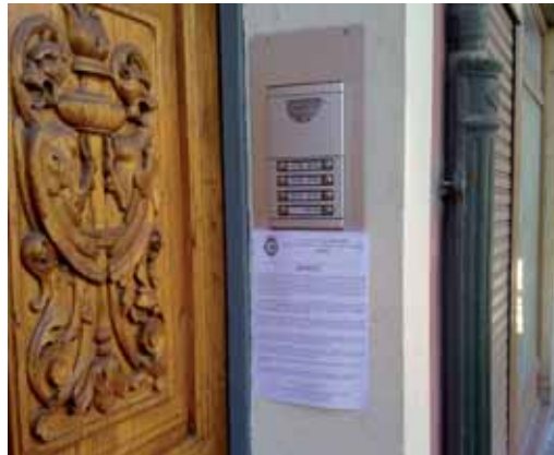
Bando del Ayuntamiento que avisa de las reformas.

Actualmente, se está dando un plazo de tres o cuatro meses a las comunidades que no han aprobado el examen para que acometan la obra y es que no entregar la certificación antes del 31 de diciembre de este año puede llevar aparejada una multa de entre 1.000 y 10.000 euros.