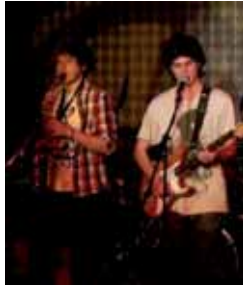
El grupo Pilgrims.

Los grupos locales 'Pilgrims' y 'El culo que silba' fueron los encargados de abrir la V Edición del festival Fonorama, organizado por la Escuela Superior de Imagen y Sonido. La entrada es gratuita, y todos los conciertos del concurso tendrán lugar a las 18.00 horas durante los jueves del mes de febrero y hasta el 3 de marzo cuando se dispute la final. 'Anphismind', 'Balder', 'Algo parecido', 'Nada original', 'Raul Fraile', 'Luz Azul', 'Asiria' y 'Lacrima' son los grupos participantes.