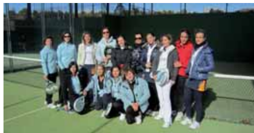
Varias jugadoras de la segunda edición de la Liga Autonómica.

■ La II Liga Autonómica Interclubes de pádel, competición por equipos que reúne a un total de 826 jugadores enrolados en 55 equipos de 27 clubes diferentes de Castilla y León, avanza viento en popa con el desarrollo de la primera fase. Una primera fase con dos divisiones tanto en categoría masculina como femenina, Primera y Segunda, en la que cada equipo tiene asegurado bajo el sistema de liguilla a una sola vuelta siete confrontaciones. En total se programarán durante el desarrollo de la Liga, entre los meses de enero y abril, más de 1.000 partidos, una cifra sin precedentes en una competición de pádel en España. La competición derivará el próximo mes de abril en una Final Four que se celebrará en Valladolid. La Liga, puesta en escena por Sport Premium, cuenta con la tutela de la Federación regional y de múltiples patrocinadores. Sin duda, es el mejor pádel regional.