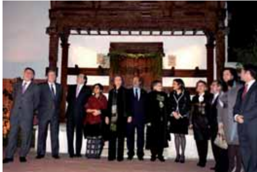
La Reina contempla, junto a las autoridades, la exposición.

Uno de los momentos más emotivos fue el encendido por parte de Doña Sofía de uno de los cinco cabos de una lámpara hin-