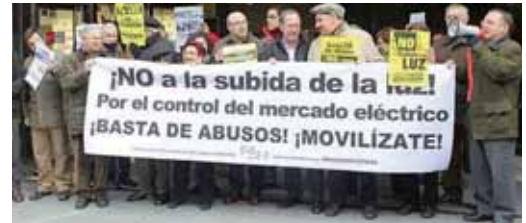
Protesta en Valladolid por la subida de la luz.

50 personas se concentran ante las eléctricas. El 15 de febrero hay planeado un apagón de cinco minutos