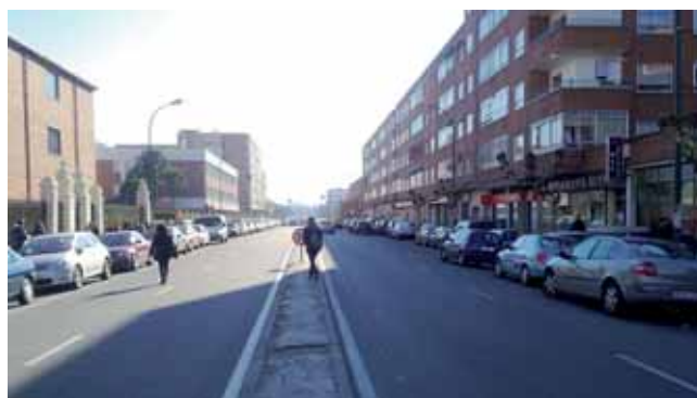
La Avenida de Segovia verá renovada su red de abastecimiento de agua.

Habrà tres tipos de intervenciones: urbanización, rehabilitación de las redes acuíferas y pavimentación