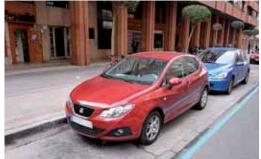
Zona azul señalizada en la calle Estadio.

De esta manera, la Zona Azul estará delimitada entre Juan Altisent, el paseo de Juan de Austria, el Paseo de Zorrilla y la plaza del Doctor Quemada. La Zona de residentes, que se diferencian porque están pintadas de verde, incluye las calles Serrano, Chueca y Esteban Daza. Aquí solo podrán aparcar quienes tengan la tarjeta de residentes, es decir que vivan en esa zona y hayan solicitado su tarjeta, cuya cuota anual es de 32,45 euros.