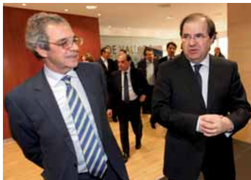
Juan Vicente Herrera y César Alierta a su llegada al acto.

en Castilla y León más de 900 millones de euros gracias a una administración electrónica, sin papeles, en la que han participado todos los municipios".