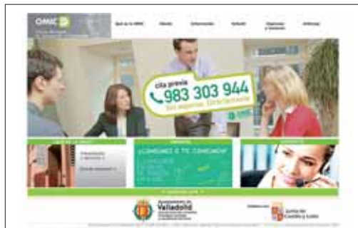
Nueva página de la Oficina del Consumidor.

A la telefonía le siguen las consultas sobre seguros (coberturas de las pólizas, incrementos de precio...) con el 7%. Después se situarían bancos (comisiones, créditos, préstamos hipotecarios...) con el 6% y los servicios de suministros (gas, electricidad y agua) con el 12%. La crisis inmo-