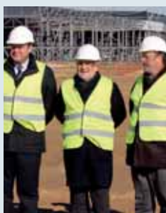
Las autoridades visitan las obras.