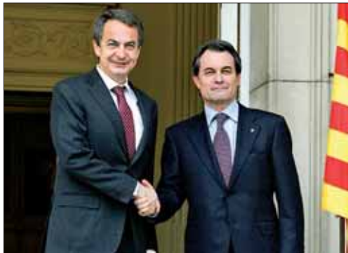
Rodríguez Zapatero con Artur Mas en la Moncloa.

Así, todas las regiones que hayan superado el techo marcado de déficit por parte del Estado para 2010, fijado en el 2,4 por ciento, y precisen de nuevas líneas de crédito para refinar su deuda podrán acceder a