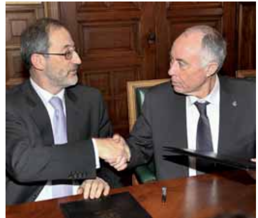
Un momento de la firma del convenio de colaboración.

A lo largo del presente año y con una inversión superior a un millón de euros, Red Eléctrica modificará el acceso a la cuestación de Palencia de las dos líneas de 220 kv que abastecen de energía eléctrica a la ciudad y que están integradas en los ejes Villalbilla-Villalcampo, y Villalcampo-Vallejera, creando una entrada y una salida a la subestación independientes (se desdoblaron las dos líneas dando lugar a cuatro), lo que permitirá reforzar la seguridad del sistema eléctrico de Palencia y mejorar la calidad del suministro, al poder aislar cualquier incidencia que se produzca