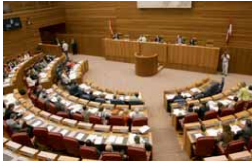
El Pleno de las Cortes se desarrolló durante el martes y el miércoles.

Durante el debate PP y PSOE se enzarzaron sobre quién tiene que convencer al Gobierno gallego de Alberto Núñez Feijóo para que retire un recurso que puede tirar por la borda el acuerdo alcanzado el pasado viernes entre el Ejecutivo central, los sindicatos, Carboión y las empresas eléctricas, que finalmente