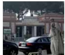
Imagen de archivo del centro.

Tras un seguimiento por parte de la patrulla de la Guardia Civil, y haber hecho caso omiso los ocupantes del vehículo en varias ocasiones de las señales de alto de los agentes, en la ronda de esta capital VA-20, tras sal-