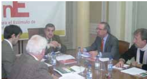
Un momento de la Comisión Provincial de Seguimiento.

En total, la gestión del Fondo Estatal para el Empleo y la Sostenibilidad Local 2010 (FEESL) en Palencia supondrá una inversión cuando finalice su ejecución, de 18.750.151,67 euros. Por otro lado, cabe señalar que el FEESL ha generado en la provincia de Palencia 1.322 nuevos puestos de trabajo; un 33,40% más de los previstos en un principio por los Ayuntamientos.