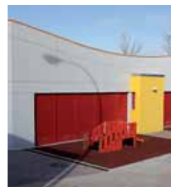
Imagen de archivo del centro.

Por otro lado, la comisión dio luz verde al convenio de colaboración con la Asociación Cultural Universitaria (ACUP),