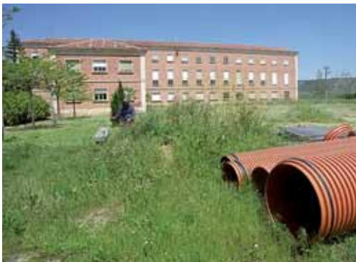
El Consistorio no tendrá que pagar indemnización alguna.

Asimismo, la sentencia del Tribunal Supremo condena a la Asociación Colegio de Huérfanos Ferroviarios a proceder al deslinde de la finca registral 12.494, (previa segregación de la finca 13.712 y según la forma descrita por el perito judicial), así como a reintegrar al Ayuntamiento los terrenos que le fueron cedidos mediante escritura (de fecha 12 de marzo de 1945- finca registral 12.494), con derecho de adquisición del Ayuntamiento a las edificaciones construidas en la referida finca, sin tener que indemnizar al Colegio de Huérfanos Ferroviarios. Por último, condena a la Asociación de Colegio de Huérfanos Ferroviarios a inscribir a favor del Ayuntamiento de Palencia la finca que resulte del deslinde, procediendo en su caso a la cancelación de las inscripciones y asientos registrales contradictorios con los pronunciamientos de la sentencia.