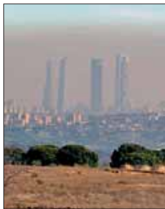
Polución en Madrid.

La Fiscalía de Medio Ambiente ha iniciado su propia cruzada contra la contaminación del aire en las principales ciudades del Estado como Madrid o Barcelona, donde investigará dónde y cómo se realiza la medición, entre otros, de las tasas de dióxido de nitrógeno y el ozono. No obstante, estas urbes cuyos niveles de polución superan los máximos exigidos por la UE para garantizar la salud pública no serán las únicas donde la Fiscalía pida explica-