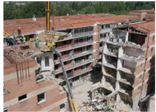
Imagen de archivo de la explosión ocurrida en la calle Gaspar Arroyo.