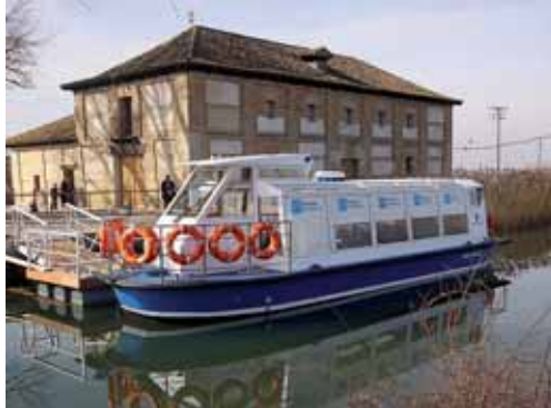
Con él, se conseguirá una mayor difusión del Museo del Canal de Castilla.

Esta nueva embarcación surcará las aguas del Canal de Castilla en su tramo comprendido entre Villaumbrales y Becerril de Campos, realizando un recorrido de unos 5 kilómetros, ida y vuelta, con una duración aproximada de