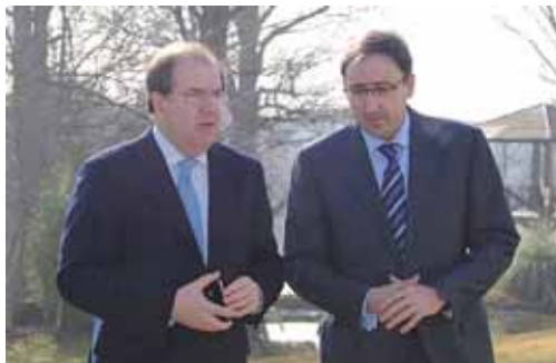
Herrera conversa con el candidato del PP a la Alcaldía de Palencia.

por el que se le concede una ayuda municipal de 26.545 euros para contribuir en los gastos de financiación del servicio de transporte universitario Palencia-Valladolid, la oficina de jóvenes emprendedores y oficina de defensa laboral de la juventud, así como el desarrollo de actividades culturales o talleres formativos que fomenten el interés formativo de la juventud. Por último, la comisión dictaminó también favorablemente las convocatorias de diferentes líneas de subvenciones y ayudas en materia de servicios sociales o de interculturalidad e integración social en población joven.