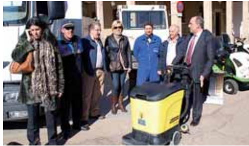
El delegado territorial y el alcalde de Cervera supervisan la maquinaria.

Asimismo, ésta Consejería destinará el próximo año más de 121 millones de euros a la cooperación con las entidades locales, con me-