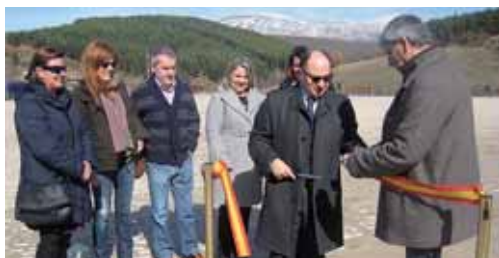
En la imagen, un momento de la inauguración de la nueva plaza.

Los vecinos de Guardo podrán disfrutar ahora de unas increíbles vistas panorámicas, ya que gracias a los trabajos que se han llevado a cabo se ha conseguido crear una amplia y diáfana plaza de más de 3.000 metros cuadrados sobre la que bordea un paseo en todo su perímetro. Además, se han solucionado los graves problemas de desplazamiento que existían al construir un muro de contención de piedra a lo largo del perímetro de la ladera.