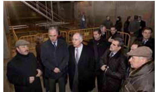
El presidente de la CHD y Gallego inauguraron el tanque de tormentas.

El tanque de tormentas situado a 2,5 kilómetros de la EDAR de la capital junto al Puente del Obispo Nicolás Castellanos tiene una superficie de más de 4.200 metros cuadrados dividida en tres cámaras comunicadas entre sí. Está equipado con un doble sistema de lavado y con un sistema de control de llenado y vaciado electrónico desde las oficinas de la EDAR. Los trabajos se han completado con la modificación y mejora del trazado de los colectores generales de la ciudad.