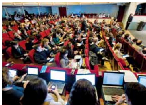
Aspecto que presentaba el patio de butacas del teatro durante el congreso.