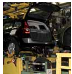
Imagen de archivo de Renault.

El programa Óptima , en el que Renault España ha participado, es una iniciativa de la Consejería de Familia e Igualdad de Oportunidades de la Junta de Castilla y León, cofinanciada por el Fondo Social Europeo, cuyo objetivo es promover acciones positivas de