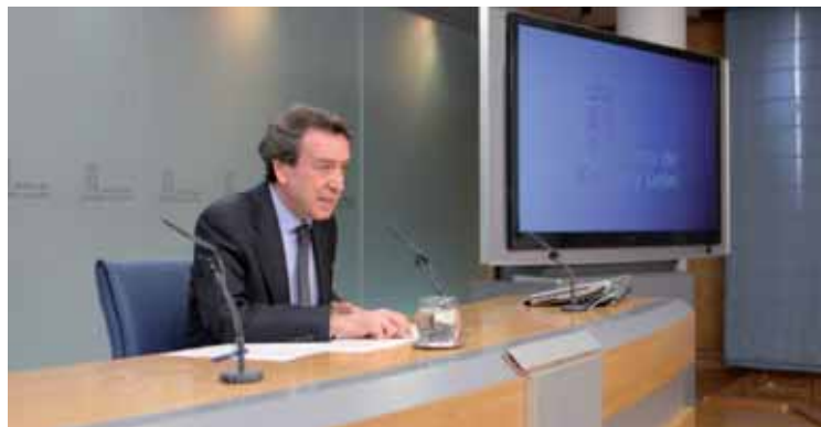
José Antonio de Santiago-Juárez durante la rueda de prensa posterior al Consejo de Gobierno.

"El Gobierno autonómico ha demostrado reiteradamente su apuesta por la mejora de las infraestructuras de la región. El anticipo de las inversiones previstas en este campo supone continuar con esta política", sentenció el consejero de la Presidencia y portavoz.