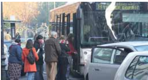
Estas modificaciones han supuesto un coste de 10.214 euros.

La Red Autonómica de Carreteras de la provincia de Palencia cuenta con 1.552,40 kilómetros de longitud. Las que presentan mayores problemas de vialidad invernal son las situadas al norte de Saldaña, donde se encuentran los puertos de Piedrasluengas, el Alto de los Portillos, la subida a Brañosa y el eje subcantábrico, así como las salidas de Herrera de Pisuergra y de Saldaña.