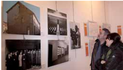
En la imagen, un momento de la inauguración de la muestra.

El Archivo Histórico de Palencia, Aruz Ediciones y la Muestra de Cine Internacional de Palencia firman un trabajo de recopilación que pone en valor la función lúdica y social del cine durante sus primeros años de vida. Esta labor ha permitido rescatar imágenes tomadas durante los años cuarenta y cincuenta, además de otras fotografías más recientes que