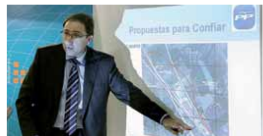
Polanco confía en que a mediados de marzo este confeccionada la lista.

A juicio de Polanco, con estas tres propuestas de acceso "desde fuera arreglamos lo de dentro. Con ellas, más una solución al tema de los aparcamientos y