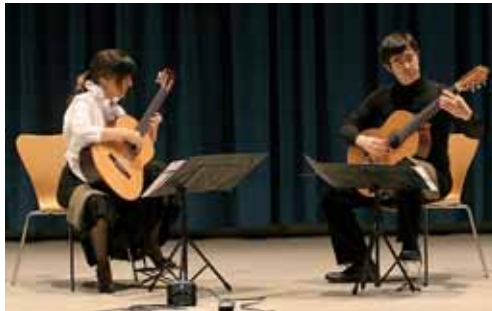
Imagen de archivo de un espectáculo llevado a cabo en la capital.

ciadas con cargo al Fondo Estatal para el Empleo y la Sostenibilidad