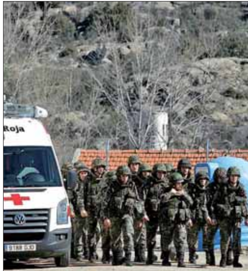
Una ambulancia y militares en el acceso al lugar del accidente mortal

Nada más conocerse el trágico accidente, Carme Chacón, ministra de Defensa, se trasladó hasta Hoyo de Manzanares des-