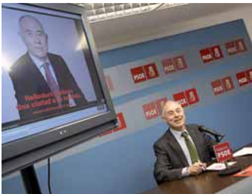
El candidato socialista dijo que está ultimando el programa electoral.

Por otro lado, en su visita Trinidad Jiménez aseveró que España está jugando un papel "absolutamente fundamental" en el conflicto bélico estallado en Libia, pues desde el primer momento apoyó las "manifestaciones" de los ciudadanos y "hemos condenado la actuación que ha llevado a cabo Gadafi".