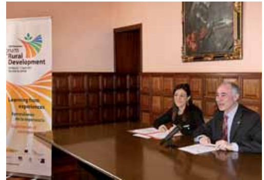
El foro se centrará en la lucha contra el hambre y la pobreza.

"Este foro impulsará nuestra imagen como ciudad, y supone una importante inyección económica con centenares de plazas