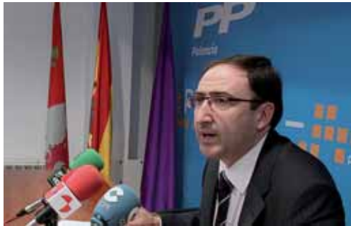
El proyecto podría suponer un desembolso de entre 4 y 8 millones.

A juicio de Polanco, "se contribuirá a configurar la ciudad en un momento en que solo se mira hacia el ferrocarril y el soterramiento, con el que nos enfrentamos con pequeños trámites y grandes visitas, pero del que no se ha hecho nada. Los ciudadanos están pagando esa falta de planifi-