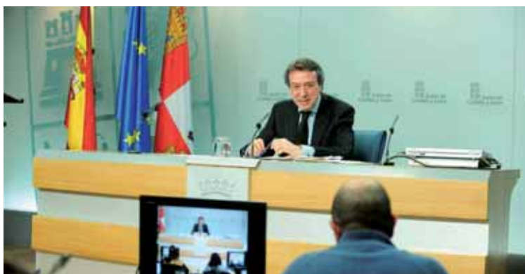
José Antonio de Santiago-Juárez durante la rueda de prensa posterior al Consejo de Gobierno.

Entre las prioridades del Plan destaca "la necesidad de preparar al sector para los retos que se plantearán como consecuencia de la política regional en el nuevo marco 2014-2020 y para afrontar la nueva situación económica que ha generado importantes cambios en los hábitos de consumo, en los formatos y modelos comerciales y en los recursos económicos públicos y privados", concluyó De Santiago-Juárez.