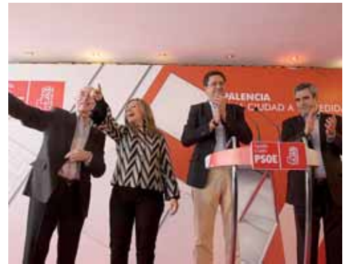
Jiménez aseguró que afrontan las elecciones con pasión e ilusión.

La ministra de Asuntos Exteriores arrojó en Palencia a los candidatos socialistas