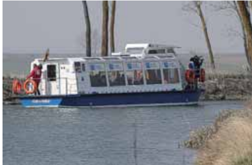
La Diputación ha adjudicado a 'Eulen' el servicio de atención al público.

una serie de servicios que hacen más cómodo y agradable el paseo a bordo del barco, como hilo musical, vídeo y televisión, iluminación ambiental para poder disfrutar de bellos atardeceres y aire acondicionado, entre otros.