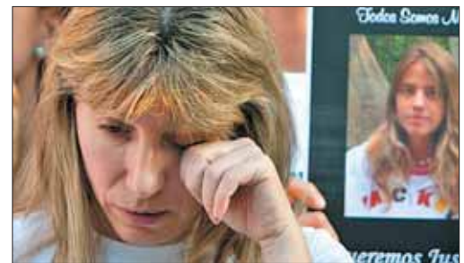
La madre de Marta del Castillo en una foto de archivo.

La sentencia ha sido un "jarro de agua helada" para la familia de la menor quien ha anunciado que recurrirá esta decisión al igual que la fiscalía. "Solo confiamos ya en la justicia carcelera", confesaba la madre de Marta rota por la decepción de este fallo judicial.