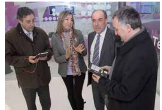
Blasco visitó las instalaciones cuyas obras han finalizado recientemente.

Impulsado por la Consejería de Fomento de la Junta está ubicado en la Calle San Marcos, 1