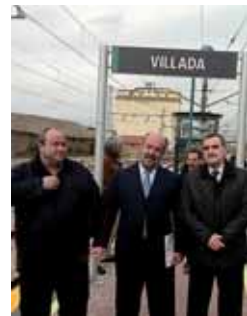
Un momento de la visita.

En el caso de Villada las mejoras realizadas se centran en la construcción de un paso inferior peatonal entre andenes adaptado a personas con discapacidad, con acceso mediante