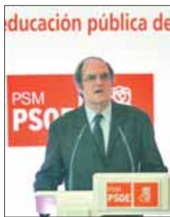
El ministro Ángel Gabilondo.

Educación sí aportará los 510 millones que asumió como compromiso, pero la otra mitad queda sumergida en un limbo supeditado a lo que decida ca-