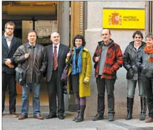
Promotores de la formación ilegalizada Sortu.

No obstante, tres de los 16 magistrados han anunciado que presentarán votos particulares por estar en contra del fallo de