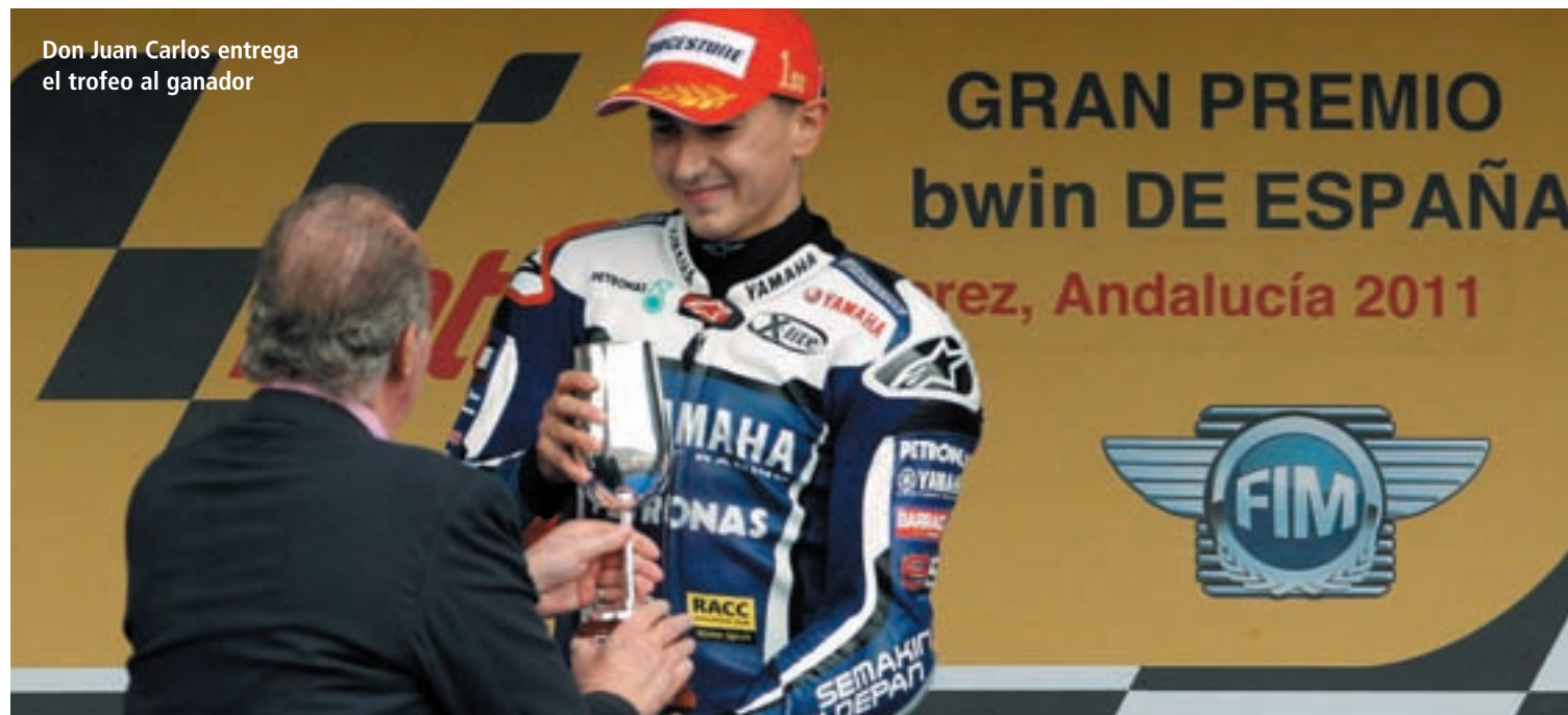
Don Juan Carlos entrega el trofeo al ganador

GRAN PREMIO bwin DE ESPAÑA Jerez, Andalucía 2011