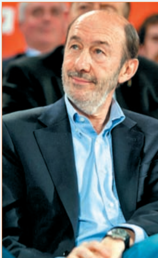
ALFREDO PÉREZ RUBALCABA