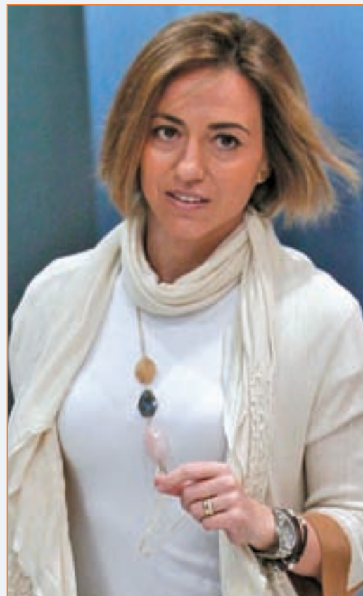
CARME CHACÓN PIQUERAS

Alfredo Pérez Rubalcaba tiene 59 años. Nació en Solares, Cantabria, el 28 de julio de 1951. Es licenciado en Ciencias Químicas por la Universidad Complutense de Madrid. Ingresó en el PSOE en el año 1974. Su primer cargo de responsabilidad llegó de la mano de Felipe González. Bajo su mandato fue ministro de Educación y Ciencia (1992-1993) y ministro de la Presidencia (1993-1996). Desde abril de 2006 es ministro del Interior. El 21 de octubre de 2010 tomó posesión como vicepresidente primero y portavoz del Gobierno. Es uno de los políticos mejor valorados. Arrastra el pasado de los últimos tiempos de González.