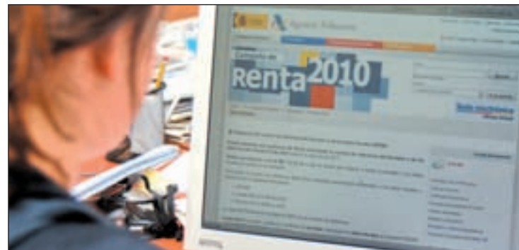
Una contribuyente consultando la web de Hacienda

Otra novedad viene dada por la deducción por obras de mejora en la vivienda. La rebaja será de un 10% sobre la cuota estatal.