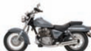
Suzuki Marauder 125. Precio anual orientativo con bonificación.

PROMOCIÓN ESPECIAL PARA LECTORES DE Gente