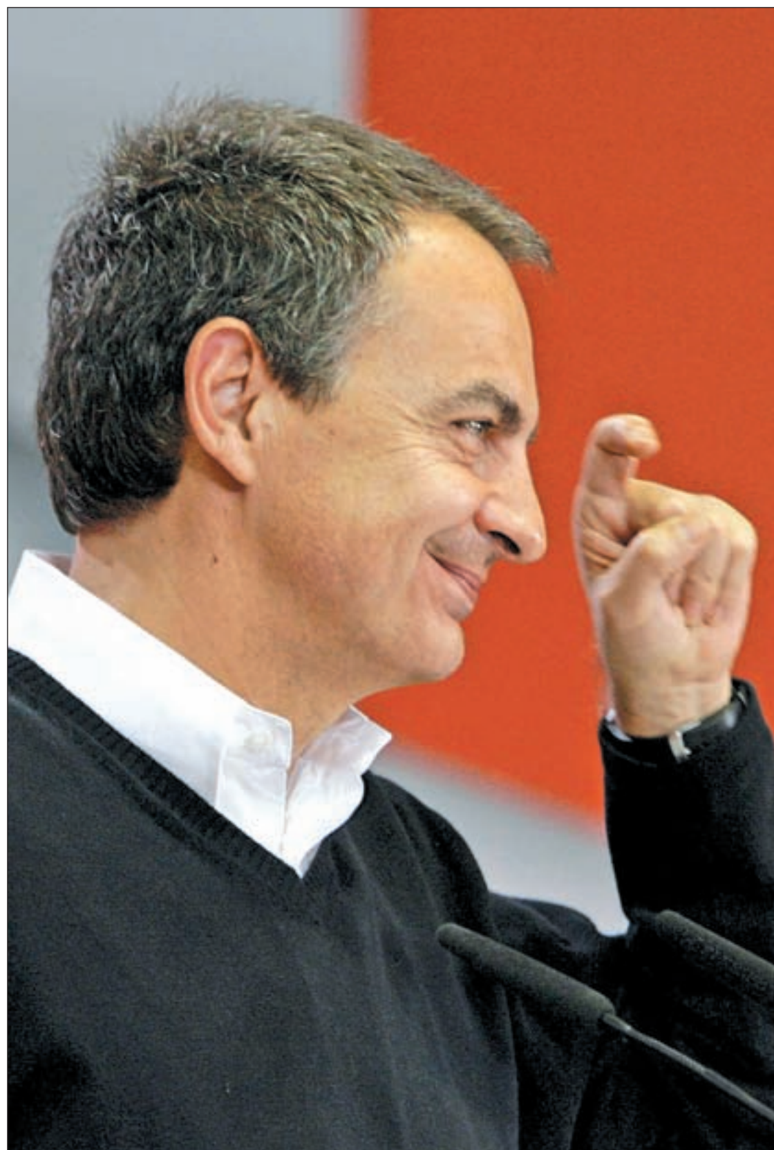
José Luis Rodríguez Zapatero, en el Congreso Federal del PSOE