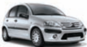
Citroën C3 1.1 AHD. Precio anual orientativo con bonificación.