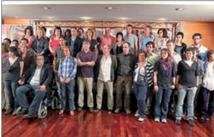
Bildu presenta sus candidaturas en San Sebastián y Guipúzcoa

El TS dispondrá hasta última hora del sábado 30 de abril para resolver la petición de las impugnaciones. Después, le tocará al TC, si, en caso de que se produjere