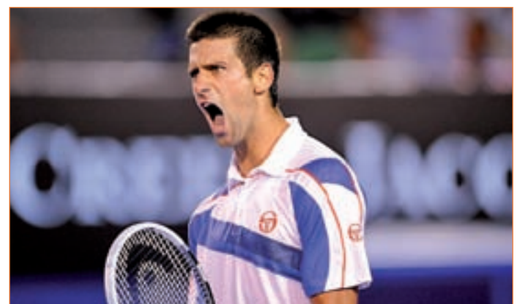
El serbio ha ascendido hasta la segunda posición del ranking ATP

polvo de ladrillo. En este Masters 1000, Djokovic nunca ha llegado a la final, firmando su mejor participación en el 2009, año en el que disputó una histórica semifinal ante Rafa Nadal que duró más de cuatro horas y en la que el serbio desperdició tres bolas de partido. El año pasado, 'Nole' renunció a jugar este torneo por problemas de alergia.