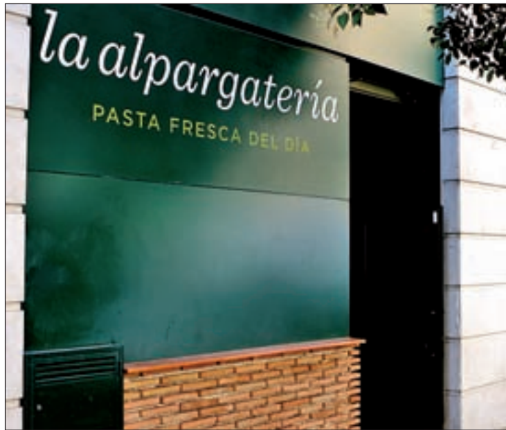
La Alpargatería comenzó su expansión en franquicia en 2010

La Alpargatería abrió su primer establecimiento en 1992 y desde entonces ha crecido hasta alcanzar los 17 establecimientos y ser un referente en la capital de la