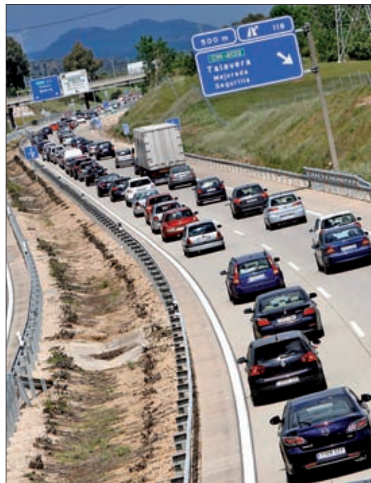
Uno de los atascos que tuvieron lugar durante la operación retorno

Sin embargo, pese a los operativos especiales de tráfico tan frecuentes en fechas como estas, la situación en las carreteras ha sido en algunos momentos complicada. Desde las 12:00 horas