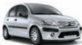
Citroën C3 1.1 Autódromo. Precio anual orientativo con bonificación.