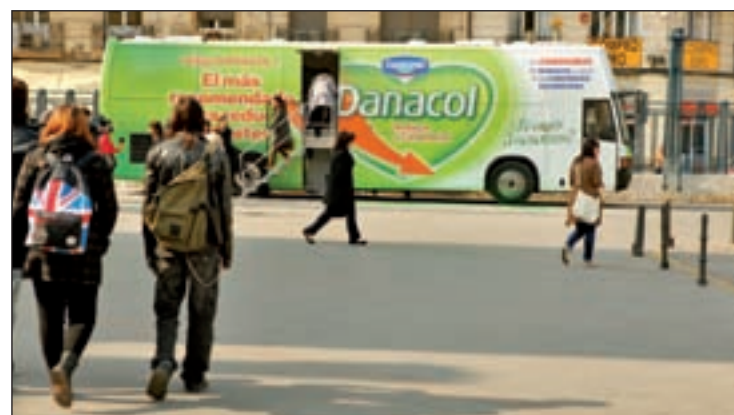
Ciudadanos accediendo al Cardiobus

Alertar sobre los riesgos para la salud que puede entrañar no cuidar los índices de colesterol es el principal objetivo del Cardiobus, así como animar a los ciudadanos a llevar una vida sana cuidando los hábitos y la alimentación.