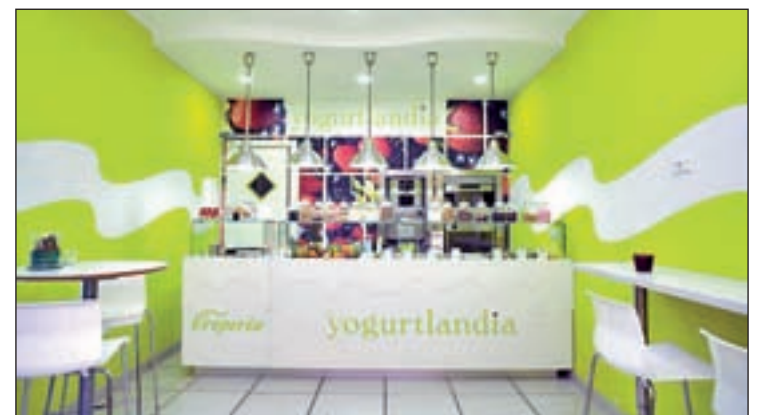
Yogurtlandia cuenta con un centenar de locales en Francia

El nuevo local de Yogurtlandia ofrecerá el yogur helado de la marca, un producto exclusivo de gran calidad que el cliente puede personalizar a su gusto con infinidad de toppings, fruta natural y chocolates. La salud es una de las claves del proyecto. "El yogur helado es un producto original, sano, rico en fermentos lácteos con numerosas propiedades", señalan los promotores.