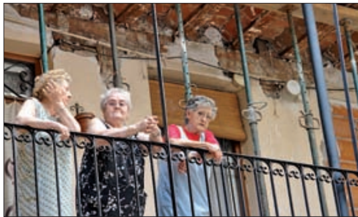
Tres mujeres de un edificio apuntalado por obras

PRETENDE POTENCIAR LA ACTIVIDAD DEL SECTOR Y EL EMPLEO