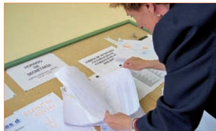
Una mujer comprueba su nombre en el censo de un colegio electoral

Mancha, la Comunidad Valenciana, Extremadura, Madrid, Murcia y Navarra, además de las Asambleas de Ceuta y Melilla. En estos comicios podrán participar un total de 19.328.936 electores. De ellos, 18.629.554 personas residen en España, mientras 699.382 son nacionales españoles que residen en el extranjero y pueden escoger a sus ejecutivos autonómicos.