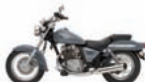
Suzuki Marauder 125. Precio anual orientativo con bonificación.

PROMOCIÓN ESPECIAL PARA LECTORES DE Gente