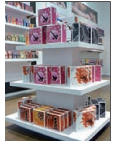
Interior de una tienda Sensualove

Además, animada por el incremento de ventas y consciente de las necesidades de los inversores, acude a esta feria presentando las mejores condiciones para abrir una tienda Sensualove. Actualmente, requiere una inversión de 45.000 euros (con canon de entrada de 12.000 euros incluido) sin variar en absoluto el concepto inicial de negocio. También pone a disposición de los nuevos franquiciados parte de la financiación así como la posibilidad de trabajar con las entidades financieras con las