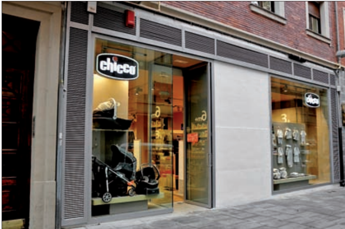
Fachada de una de las franquicias de Chicco