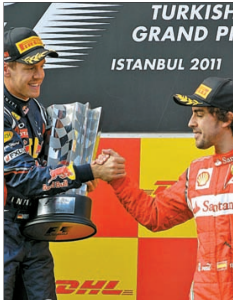
Vettel ha salido desde la primera posición en todas las carreras

Pese a las mejoras de Ferrari, la vitola de favorito volverá a recaer una vez más en Sebastian Vettel y Mark Webber. La victoria del año pasado en Montmeló del piloto australiano y el hecho de que ningún coche haya sido capaz de hacerles sombra en las tandas de clasificación dejan a los miembros de Red Bull como unos de los líderes en la quiniela de aspirantes al triunfo. En los días previos, Vettel ha asegurado que conocen el trazado barcelonés a la perfección y que sus condiciones se adaptan a la per-