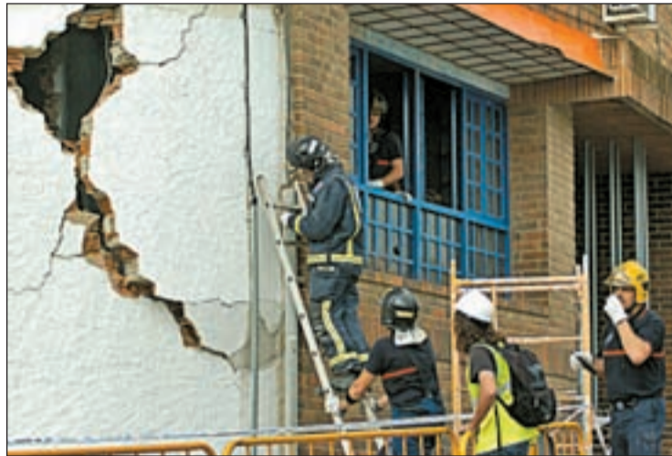
Operarios evaluando la situación de un edificio en Lorca

En él se establece que se financiarán el 100% de las reconstrucciones. Las ayudas serán especialmente cuantiosas para las familias con viviendas destruidas, a las que se les dará hasta 106.000 euros. Aquellas que hayan sufrido algún daño en sus domicilios accederán a una