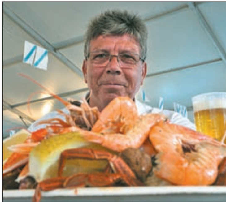
Un hombre ante un suculento plato de comida