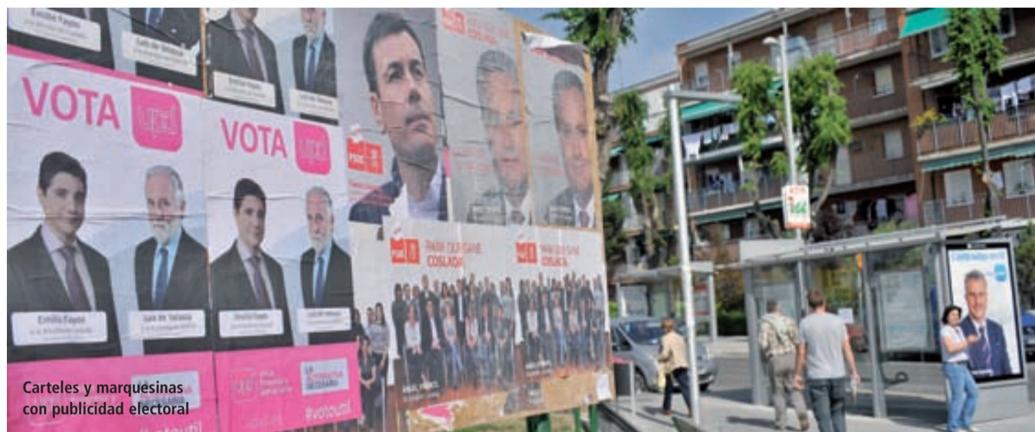
Carteles y marquesinas con publicidad electoral