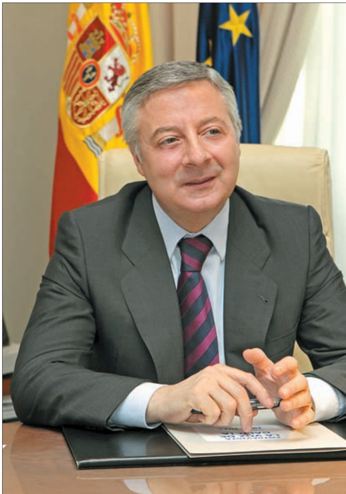
José Blanco, ministro de Fomento en su despacho

José Blanco confía en recuperar la confianza del electorado • El AVE y la nueva gestión aeroportuaria son alguna de sus prioridades