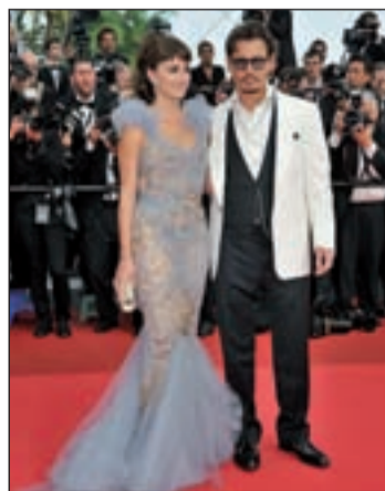
Penélope Cruz y Johnny Depp

Tras el tradicional paseo, ambos atendieron a la prensa, donde 'Pe' recordó que "siempre seré una actriz española, trabaje allí o en cualquier sitio".