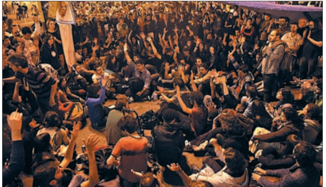
Una de las comisiones de trabajo de la acampada en Madrid el pasado día 17

Muchos son jóvenes, pero el grupo es heterogéneo. Conscientes de la importancia de sus