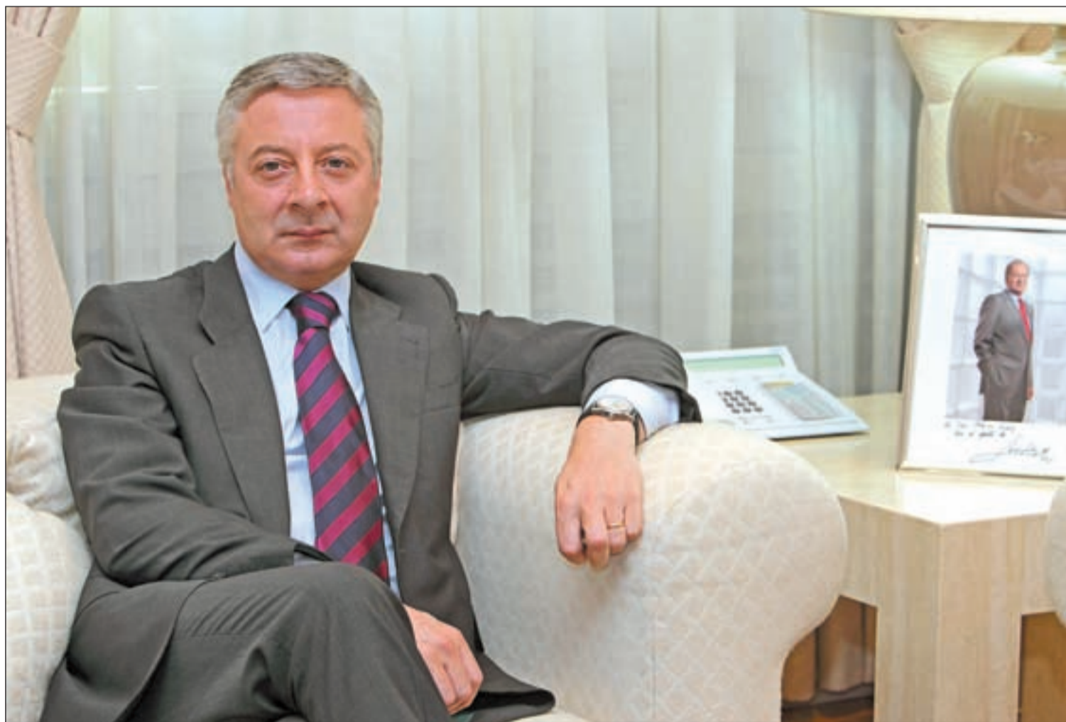
José Blanco se muestra confiado en que haya sorpresas en las urnas, en contra de los pronósticos de las encuestas

En materia ferroviaria, la máxima prioridad es avanzar significativamente en los proyectos de alta velocidad y en impulsar el transporte ferroviario de mercancías; en carreteras, trataremos de dar el impulso definitivo a varias autovías vertebradoras del territorio, como la autovía A-8, la llamada Trascantábrica, y la A-7, del Mediterráneo; en aeropuertos, continuaremos la reforma del sistema aeroportuario con la consolidación de Aena Aeropuertos y la puesta en marcha de las previstas concesiones y la liberalización de las torres de control. En cuanto a vivienda, seguiremos incidiendo en facilitar a los ciudadanos el acceso a la vivienda, a través de las políticas de vivienda protegida y fomento del alquiler y la rehabilitación, y en acompañar al sector en su normalización, para que contribuya a generar empleo y a la salida de la crisis sin caer en problemas del pasado.