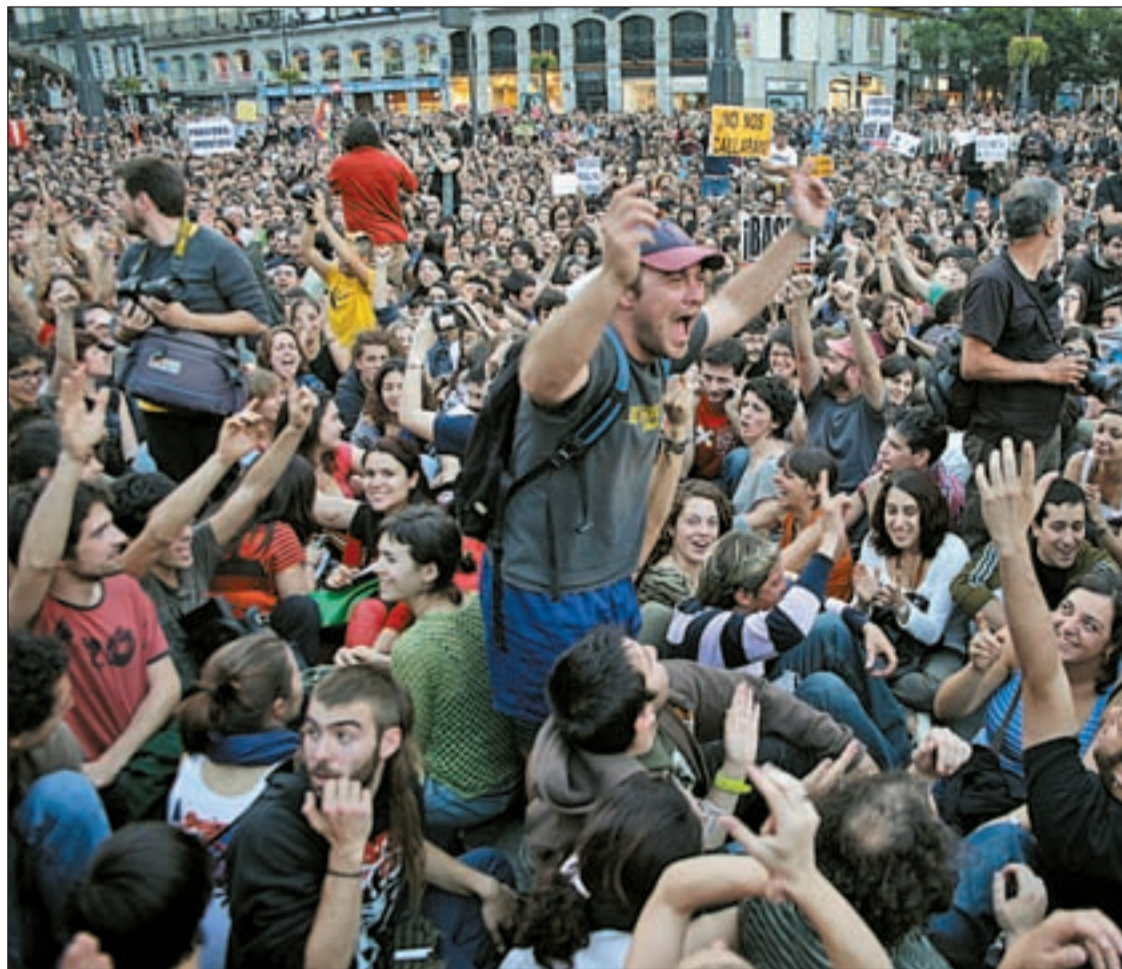
Jóvenes con pancartas reivindicativas en la Puerta del Sol de Madrid

Las concentraciones en la Puerta del Sol de Madrid contagian a 29 ciudades donde se han instalado acampadas con similares demandas Pág. 5