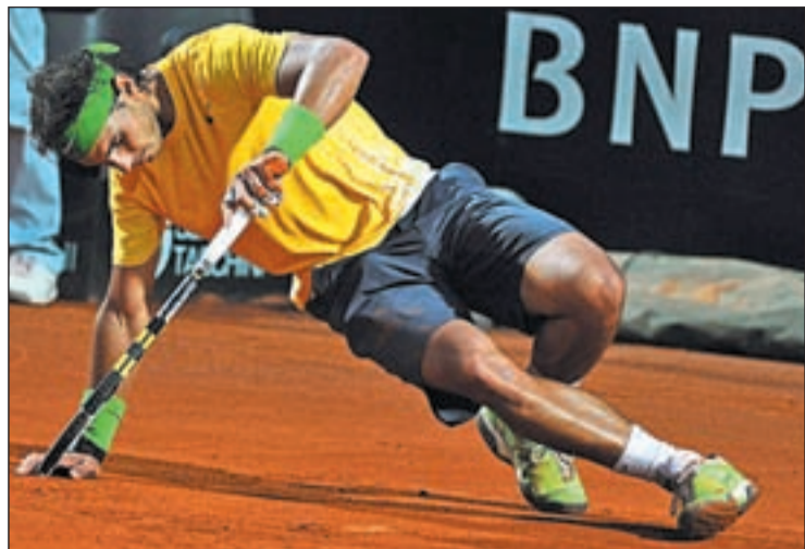
El número uno deberá recuperarse del golpe moral sufrido en Roma

EL SEGUNDO GRAND SLAM COMIENZA EL DOMINGO