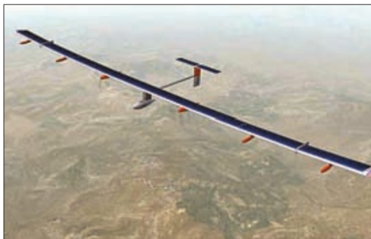
El Solar Impulse HB-SIA en pleno vuelo

Una de las mayores preocupaciones del hito era conseguir mejorar la ruta en función de las condiciones meteorológicas, el control del tráfico aéreo y los pa-