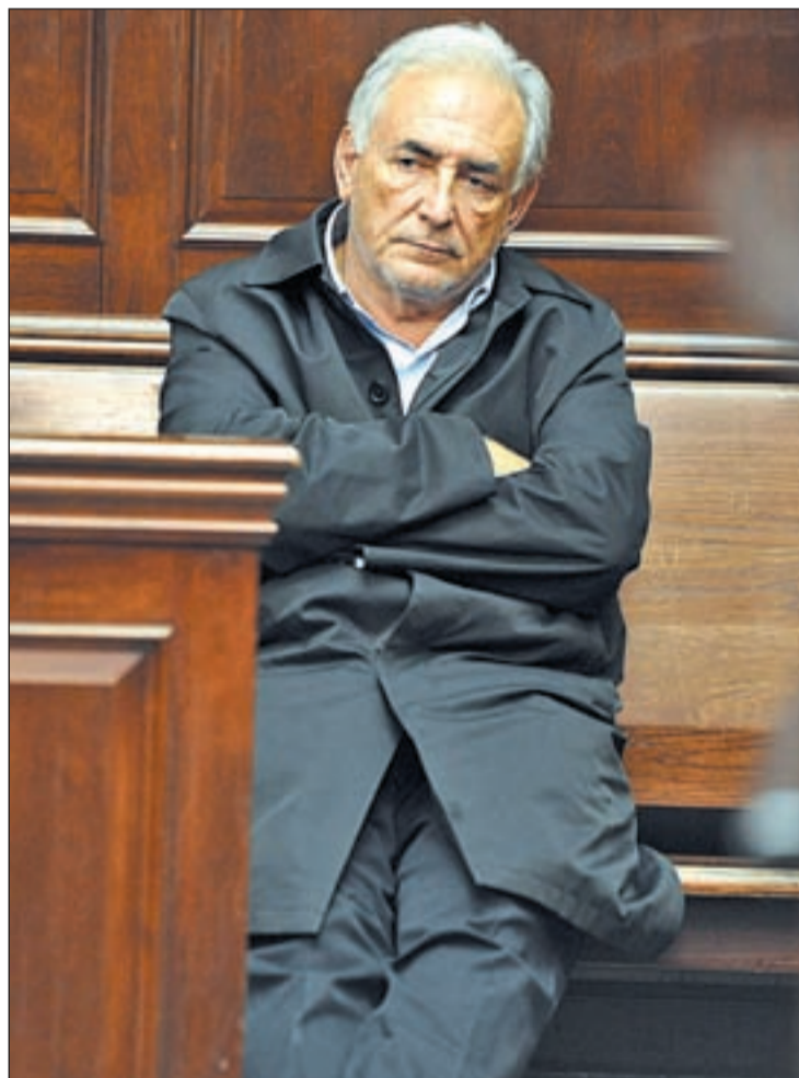
Strauss-Kahn a la espera de su comparecencia ante la jueza

ministra francesa de Economía, Christine Lagarde aglutina el mayor respaldo junto a Gordon Brown o el alemán Strinbrück. Mientras, fuera de las fronteras de la UE sobresalen el ex ministro turco Dervis, el israelita Stanley Fisher o el sudafricano Trevor Manuel. Hasta el nombramiento oficial, el número dos del FMI, John Lipsky, se ha hecho provisionalmente con las riendas hasta agosto.