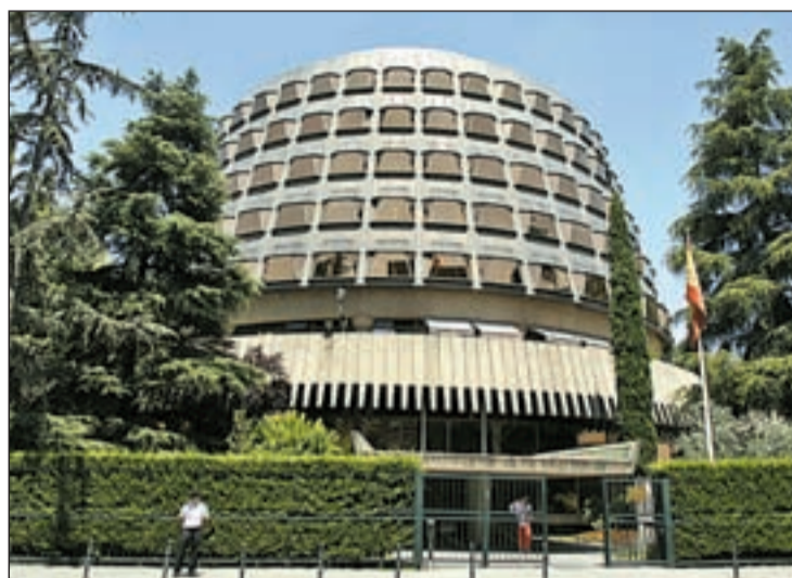
Imagen del edificio del Tribunal Constitucional

El Alto Tribunal debe resolver en los próximos meses los recursos que presentaron 25 etarras en el 2007 contra la liquidación de condenas hecha por la Audiencia Nacional, que hizo uso de la doctrina Parot. El Tribunal que preside Pascual Sala precisó que resolverá "caso por caso" por lo que no habrá un único pronunciamiento que avale o re-