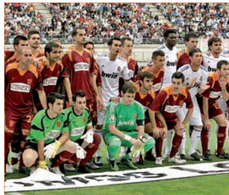
La plantilla blanca posa junto al combinado murciano con una pancarta

no se volcó desde primera hora de la mañana con la expedición madridista, que visitó el Ayuntamiento, enviando palabras de ánimo a los cientos de aficionados que se encontraban en la Plaza de España. Tras la recepción en el consistorio, Cristiano Ronaldo, Sergio Ramos y el capitán, Iker Casillas, visitaron el hospital Virgen de la Arrixaca para arropar a los damnificados que siguen en el centro. En los prolegómenos del partido, ambos equipos, junto al trío arbitral, posaron con una pancarta que rezaba ‘Todos somos Lorca’.