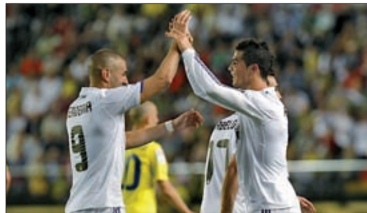
El portugués marcó por partida doble ante el Villarreal

tro años después. El principal aliciente del encuentro será comprobar si Cristiano Ronaldo continúa engordando su récord goleador personal. El portugués suma 38 ó 39 tantos, según la fuente que se consulte, y tiene la oportunidad de superar un récord que compartían Telmo Zarra y Hugo Sánchez. En las últimas tres jornadas, CR7 ha anotado la friolera de nueve goles, justo el mismo número de tantos que ha firmado todo el Almería en estas diez últimas jornadas.