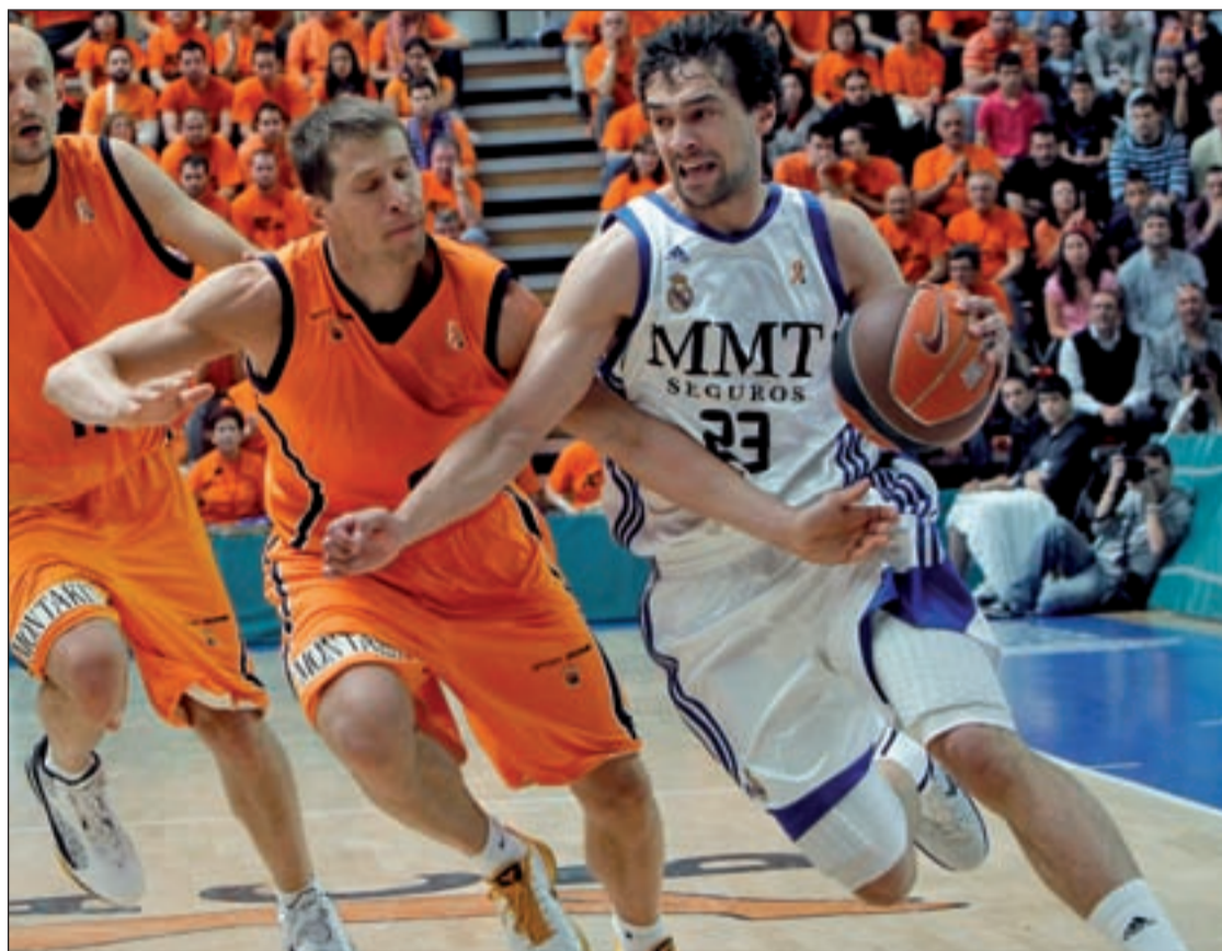
Los blancos ya cayeron derrotados en el Fernando Martín en el partido de vuelta de la fase regular