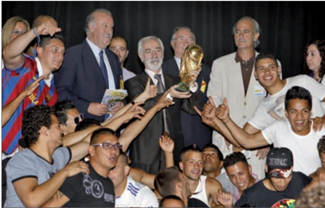
Del Bosque, junto a varios directivos y los reclusos del centro penitenciario Madrid II