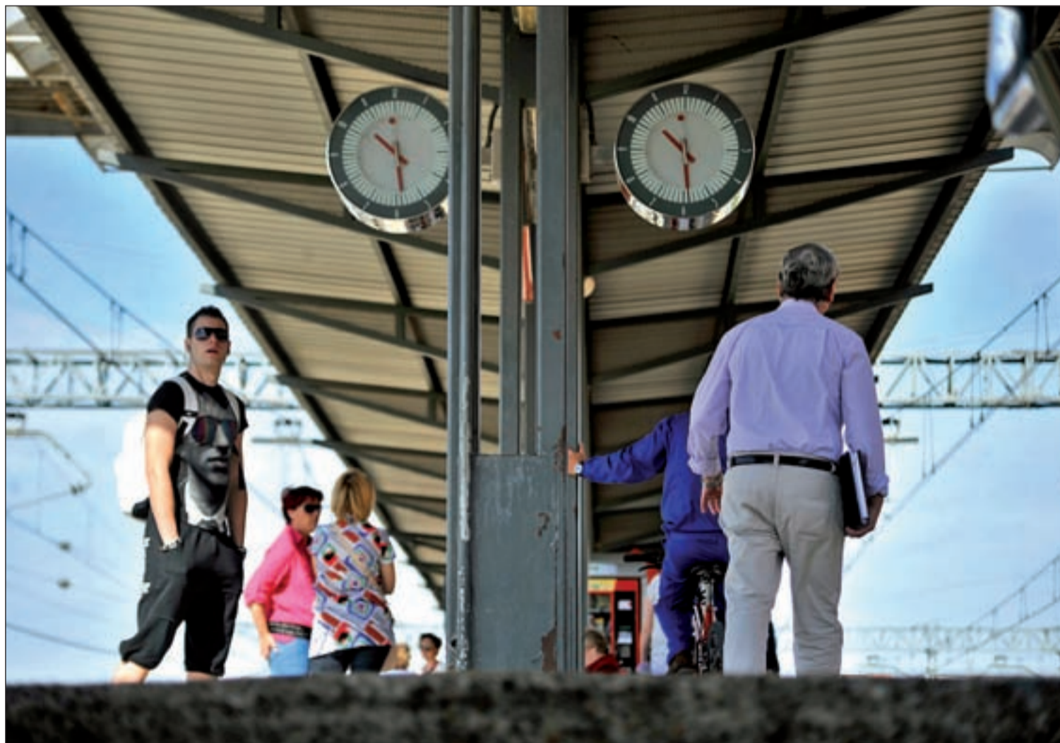
La estación de tren de Torrejón de Ardoz

Los empleos son demandados por las empresas de limpieza y cafetería