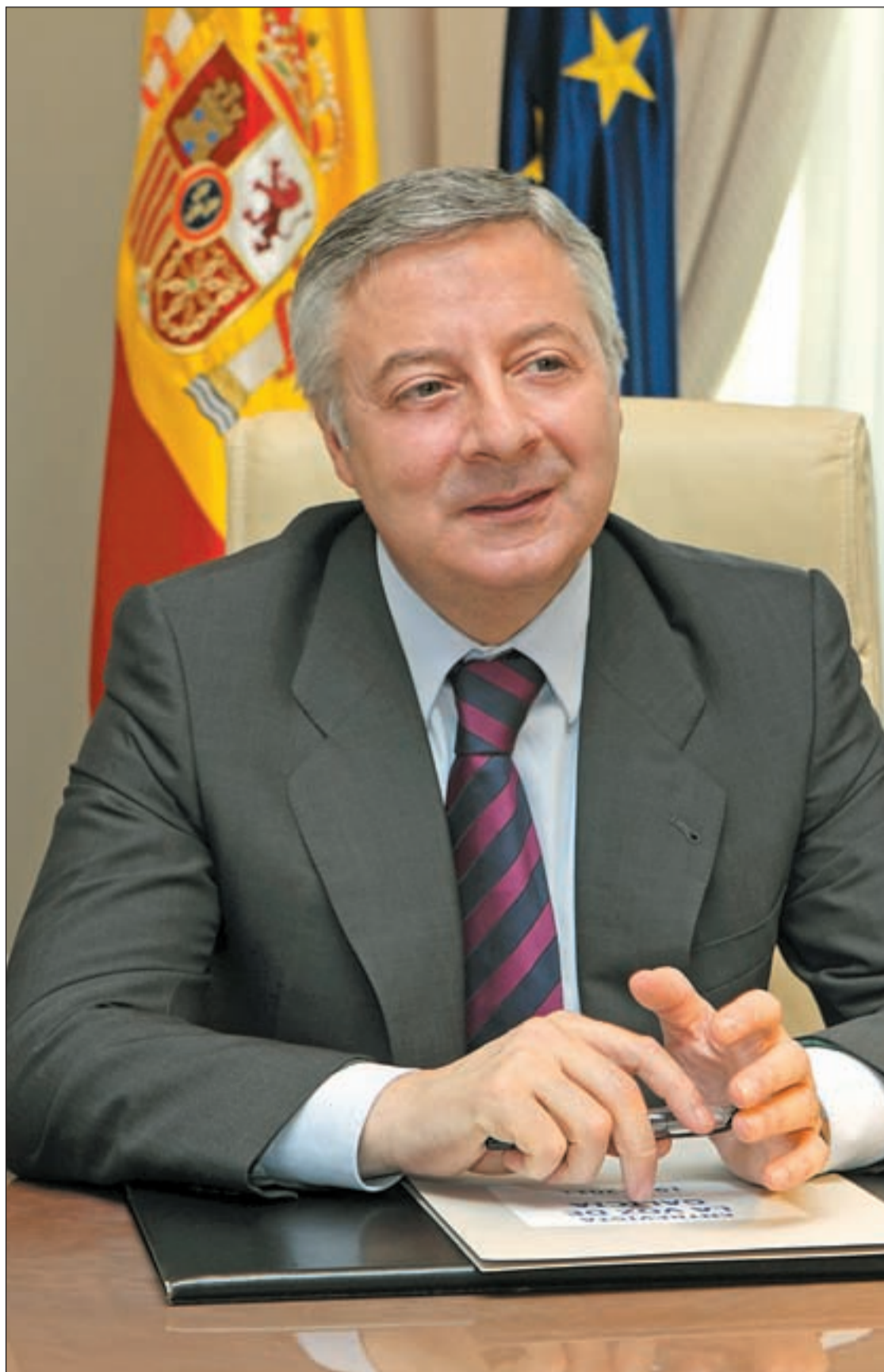
José Blanco, ministro de Fomento en su despacho

José Blanco confía en recuperar la confianza del electorado • El AVE y la nueva gestión aeroportuaria son alguna de sus prioridades