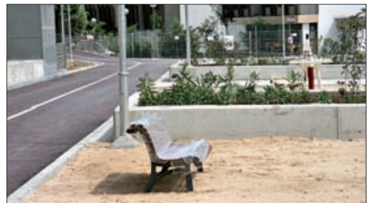
El área estancial del aparcamiento Miguel Hernández

Idiomas de Coslada, la UNED y el centro base de Servicios Sociales. En total, han construido 396 plazas para residentes, cuya inversión asciende a 6,5 millones de euros. "Esta actuación no solo solucionará parte del problema, sino que los vecinos disfrutarán de un espacio verde", señaló el regidor cosladeño.