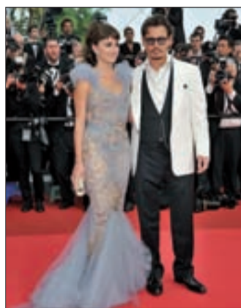
Penélope Cruz y Johnny Depp

Tras el tradicional paseo, ambos atendieron a la prensa, donde 'Pe' recordó que "siempre seré una actriz española, trabaje allí o en cualquier sitio".