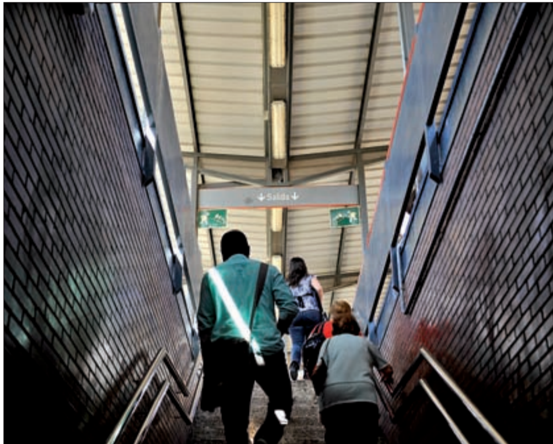
Uno de los accesos a los andenes de la estación de cercanías de Torrejón de Ardoz

Los populares de Torrejón prometen la llegada del Metro a la ciudad. Una promesa que ya se inició en esta legislatura a través de un convenio con la Comunidad de Madrid y cuyos trabajos de construcción de la primera fase de esta alternativa