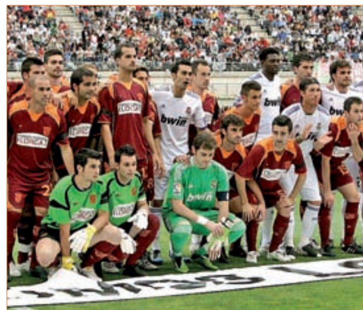
La plantilla blanca posa junto al combinado murciano con una pancarta

no se volcó desde primera hora de la mañana con la expedición madridista, que visitó el Ayuntamiento, enviando palabras de ánimo a los cientos de aficionados que se encontraban en la Plaza de España. Tras la recepción en el consistorio, Cristiano Ronaldo, Sergio Ramos y el capitán, Iker Casillas, visitaron el hospital Virgen de la Arrixaca para arropar a los damnificados que siguen en el centro. En los prolegómenos del partido, ambos equipos, junto al trío arbitral, posaron con una pancarta que rezaba ‘Todos somos Lorca’.