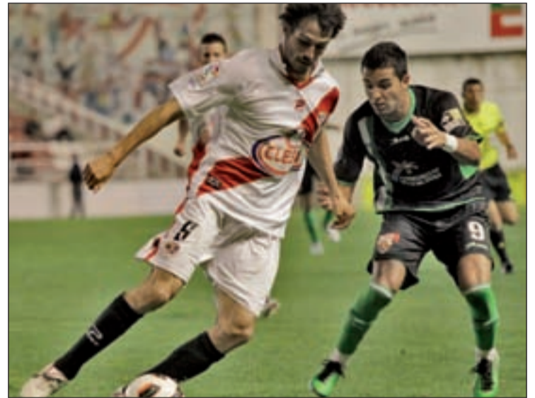
Los rayistas pueden lograr el objetivo ante su afición

Por tanto, todo está preparado en Vallecas para vivir una fiesta que se espera sea mayor que la de 2008 cuando el equipo dejó el pozo de la Segunda B. Sin embargo, ha habido otros equipos que han alzado la voz ante