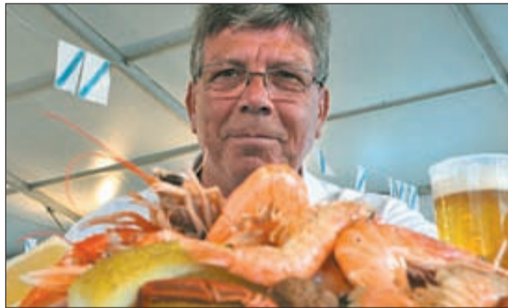
Un hombre ante un succulento plato de comida

anotar la cantidad de veces que pensaban en comida o en sexo a lo largo del día. El informe asegura que los resultados observados se deben a que existen más mecanismos que activan eficazmente el interés por la comida, como los sentidos de la vista o el olfato, que disparadores de pensamientos sexuales. El promedio masculino se fija en 18 ideas eróticas al día, y el femenino en 10.