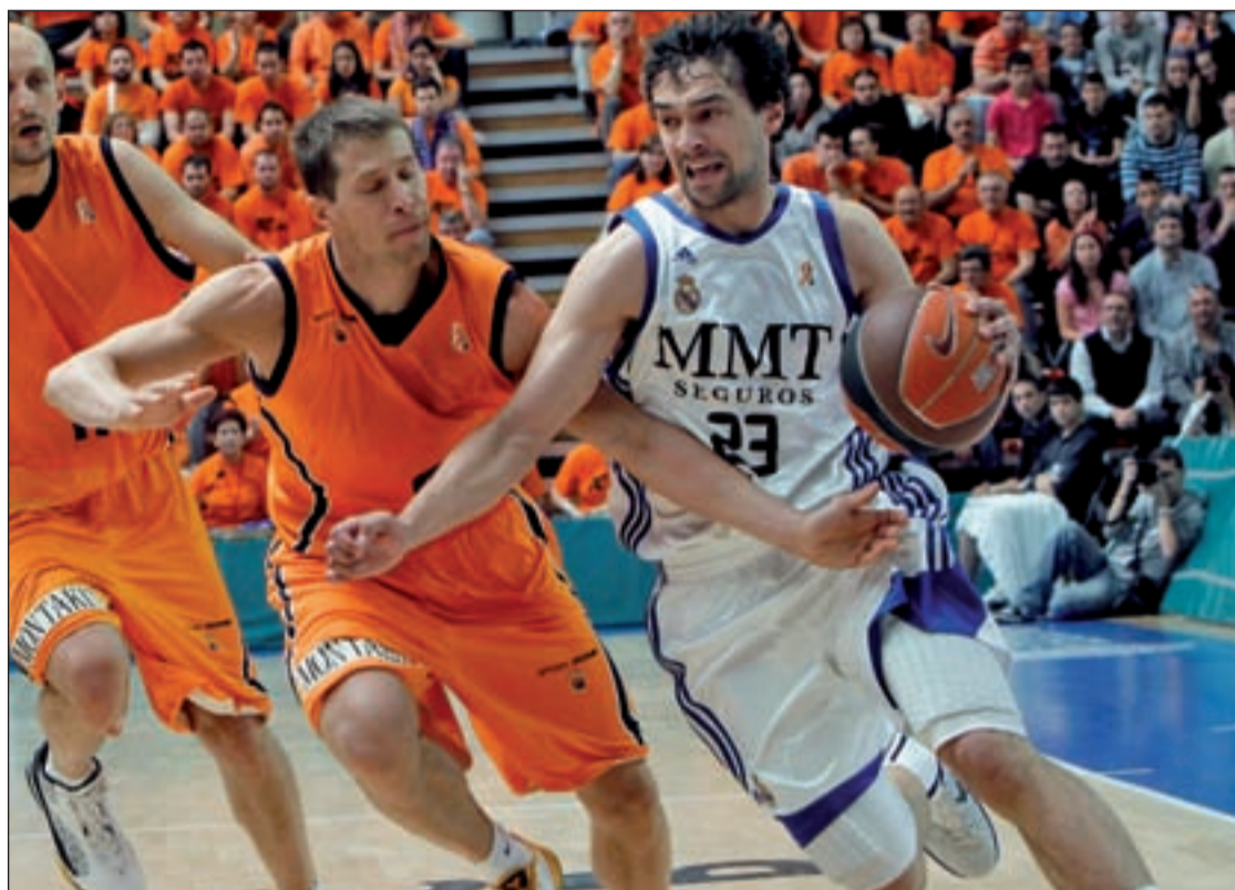
Los blancos ya cayeron derrotados en el Fernando Martín en el partido de vuelta de la fase regular