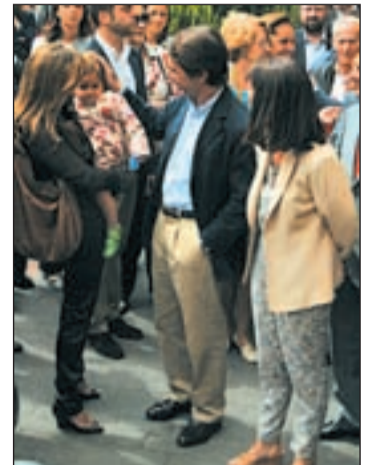
Aznar y Adrados en Pozuelo

Después del paseo, Aznar mantuvo un encuentro con afiliados