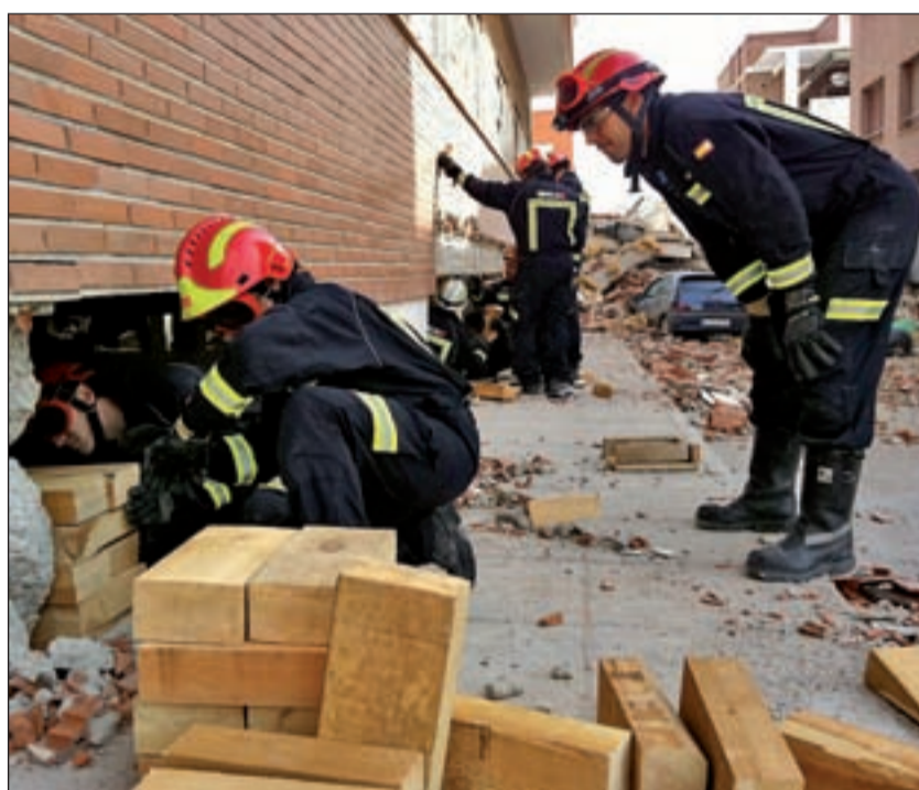
Bomberos del ERICAM trabajan en Lorca

Toda España se volcó con las víctimas del temblor y la Comunidad de Madrid no se quedó atrás. Minutos después del seísmo, más de doscientos bomberos madrileños libres de servicio se ofrecieron voluntaria y desinteresadamente para acudir a la Región de Murcia y poner su experiencia en catástrofes al servicio de los murcianos.