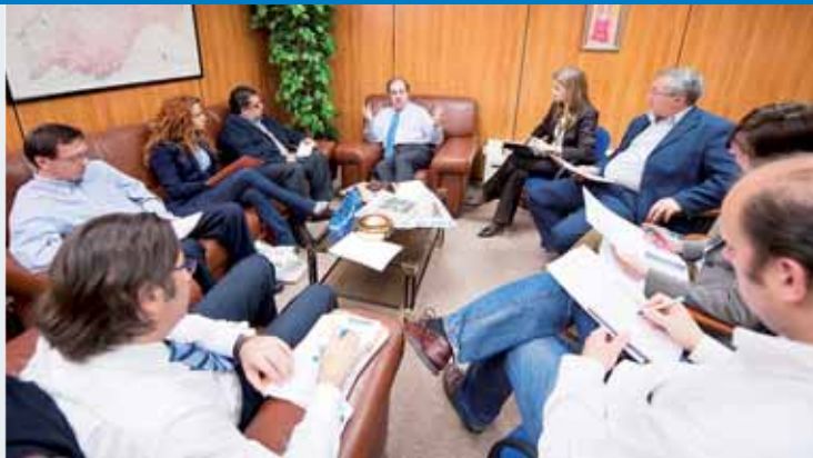
Herrera respondió a las preguntas de los directores de las seis cabeceras de Gente en Castilla y León.

¿Algún vicio o manía confesable? Que soy rutinario.