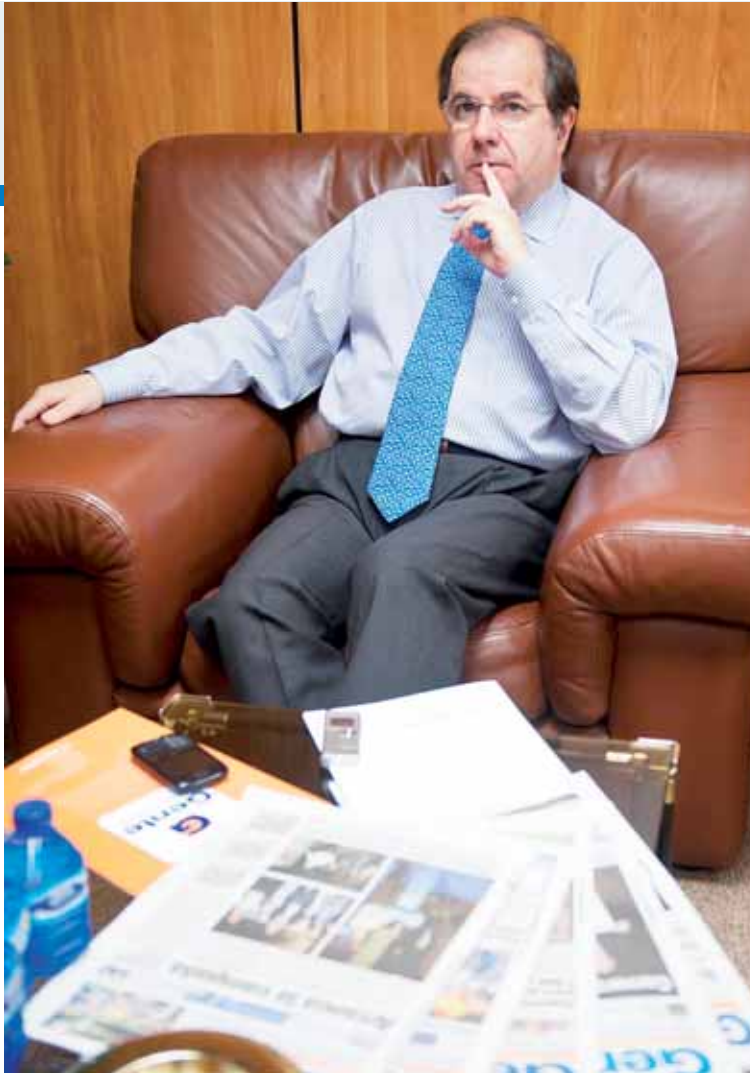
Juan Vicente Herrera desgranó para el Grupo Gente las claves de su programa electoral.

Eso es engañoso porque las manifestaciones más numerosas y significativas han sido las de los colectivos agrarios y han sido contra todos. No podemos tirar balones fuera. Es verdad que las políticas agrarias y ganaderas siempre están sujetas a incertidumbres. En esta legislatura comenzó la crisis de los topillos. Esta Comunidad tiene que seguir comprometida con la agricultura y con la ganadería en clave de modernización, en clave de competitividad, de mecaniza-