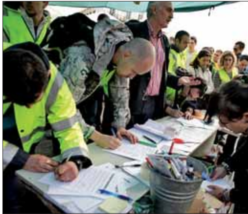
Decenas de personas esperan para firmar en apoyo del 15-M. M. VADILLO

Los ciudadanos 'indignados' con la gestión política y económica de la crisis y la falta de expectativas de futuro han tomado las plazas de más de 60 ciudades en toda España. El movimiento de protestas cívicas iniciado en la Puerta de Sol de Madrid tras la manifestación, que congregó a más de 25.000 personas el 15-M, también se propaga por el extranjero, donde ciudades como México, París, Berlín, Buenos Aires o Viena han organizado concentraciones frente a la embajada española a lo largo de los próximos días. Al cierre de esta edición es imposible valorar aún la decisión de la Junta Electoral Central sobre la legalidad de las concentraciones en cam-