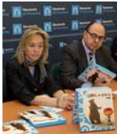
Un momento de la presentación.

ejemplares, que se repartirán por todos los colegios de infantil y primaria de la Comunidad, así como por agencias de viajes, revistas especializadas en turismo familiar y por todas las televisiones locales de España. Además de en librerías de todo el país, gracias a la colaboración alcanzada con la editorial Everest.