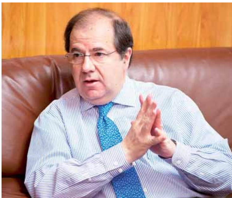
Herrera se presenta a la reelección como presidente de la Junta, cargo que ocupa desde marzo de 2001.

Pues no lo entiendo. Sacando conclusiones de las múltiples encuestas que se están publicando estos días, lo que esos nuevos votantes expresaban era la lógica del sentido común. Esto pone de manifiesto que las políticas con sentido común, que estamos impulsando desde la Junta y desde el PP de Castilla y León, en concreto las políticas sociales, las de creación de empleo -con una base tan rica como es el proceso de diálogo social, es decir, sobre la base del consenso,