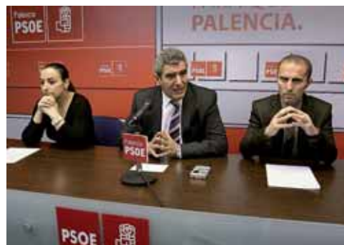
Un momento de la rueda de prensa ofrecida en la sede del PSOE.

Cabe recordar que la votación comenzará a las 9.00 h y terminará a las 20.00 h, aunque los colegios estarán abiertos antes para que los miembros de las mesas electorales puedan presentarse, verificar que no hay problemas con el material electoral (urnas, cabinas, mesas, sobres, papeletas, etc.) y constituyan la mesa propiamente dicha.