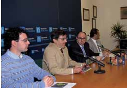
Un momento de la presentación del CD en la Diputación de Palencia.

"El CD será de gran interés y utilidad para los aficionados a salir