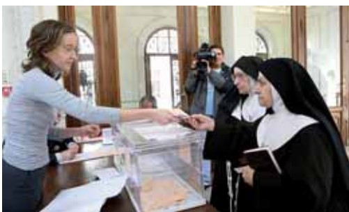
Imagen de archivo de unas religiosas votando en la capital.

Los palentinos y residentes extranjeros en la provincia elegirán a 1.043 concejales que les representarán en los gobiernos municipales