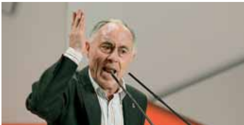
Gallego dijo que la campaña electoral está siendo "ruin y mezquina".

El Ayuntamiento ha invertido en los últimos años en el barrio más de 8 millones de euros, fundamentalmente a través del Plan Urban, cofinanciado con Fondos Feder de la UE.