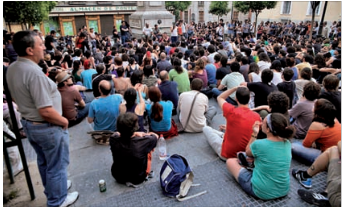
Una de las asambleas donde se dialoga sobre las aspiraciones del movimiento

Tras conocerse los resultados electorales y ante el cruce de informaciones la plataforma Democracia Real Ya emitió un comunicado en el que aclaraba