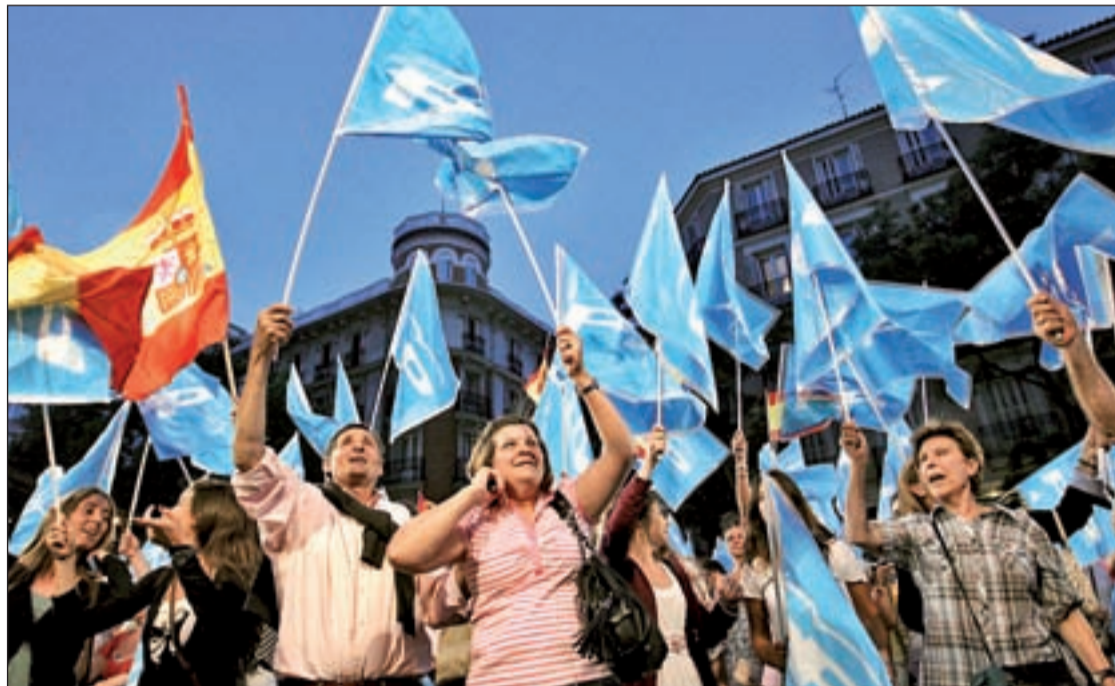
Simpatizantes del Partido Popular celebran los resultados electorales en la sede del partido de Génova

El castigo al PSOE se ha materializado con la pérdida de Castilla-