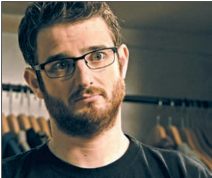
Gorka Otxoa en un fotograma de su última película '¿Estás ahí?'

La carcajada tiene nombre. Gorka Otxoa. Un actor que ha ido apuntalando su carrera a base de humor y sellándola con el apoyo del público. Desde sus inicios hizo de la comicidad su sello indiscutible. Su carta de presentación sin réplica. Tras la muerte trágica de su personaje debut por intoxicación cárnica en la serie 'Goenkale', resucitó con sobredosis de humor en 'Vaya Semanita'. Gorka no olvida su aventura con 'la cuadrilla' en la ETB. "Gracias a un humor inteligente, de personaje y situación se consiguió que personalidades tan dispares como militantes del PP o Arnaldo Otegui pasasen por el plató del programa", cuenta el actor a GENTE. Sin embargo,