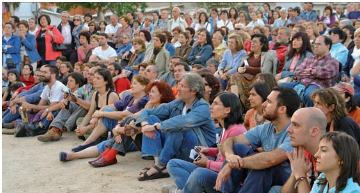
Asamblea de la Iglesia de San Carlos Borromeo, pionera en España del movimiento católico de base