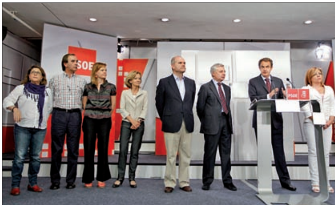
Rodríguez Zapatero y otros dirigentes del PSOE tras conocer los resultados electorales

Pese a que todos los pronósticos vaticinaban una derrota del PSOE en los comicios de 2011, la caída en las urnas ha sido de tal envergadura que el partido socialista cierra filas y ha activado sus mecanismos internos para reconducir la estructura interna en busca de un nueva conexión con su electorado y militantes. Rodríguez Zapatero, aún secretario general del PSOE, ha ratificado que la voluntad de la cúpula de Ferraz es la realización de un proceso de Primarias para encontrar el líder del partido y su candidato cara a las próximas elecciones generales de 2012. Una decisión que todos los hombres fuertes del PSOE no comparten, como ha quedado patente en la petición del lehendakari vasco, Patxi López, de realizar un congreso extraordinario, así como en declaraciones de destacados miembros de la ejecutiva como el histórico Alfonso Guerra o Guillermo Fernández