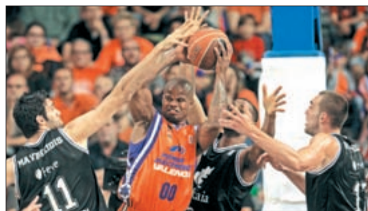
El equipo de Katsikaris dio la sorpresa ante el PE Valencia

Por el otro lado del cuadro, Regal Barcelona y el Caja Laboral reeditarán la final de los dos últimos años en una eliminatoria que arranca en la Ciudad Cordal este viernes. Los culés aspiran a tomarse la revancha del 3-0 del año pasado que les dejó sin título de campeón de Liga.