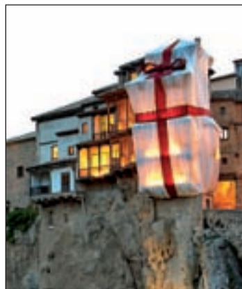
Las Casa Colgantes

Jeanne-Claude, que en 1995 forraron el Reichstag de Berlín. Después se retirará el montaje que será destinado a la Facultad de Bellas Artes del Campus de Cuenca. Todo forma parte de la campaña promocional "Quédate con Cuenca", que impulsa la Fundación de Turismo y financia la Diputación provincial.