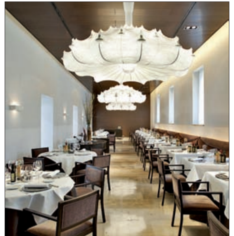
Imagen del Parador de Alcalá de Henares

Para Paradores "innovar también es recuperar lo tradicional", por lo que la cadena hotelera pública ha elaborado un menú con recetas de "toda la vida" que incluyen productos típicos y significativos de cada zona.