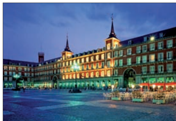
La Plaza Mayor de Madrid

En ámbito nacional, las tres principales comunidades por volumen de turistas en Madrid experimentan crecimientos: Andalucía un 9,6%, Cataluña un 10,6% y Valencia apenas un 0,6%. En el primer cuatrimestre del año, han visitado Madrid