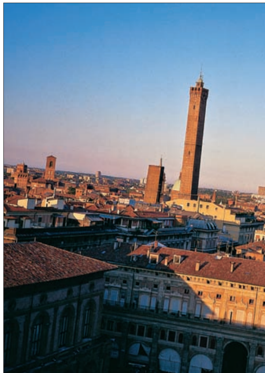
Esta región italiana se caracteriza por su riqueza artística y cultural

También la Unesco ha sido conquistada por la belleza histórica de Módena. En el centro se pueden admirar tres obras de arte: