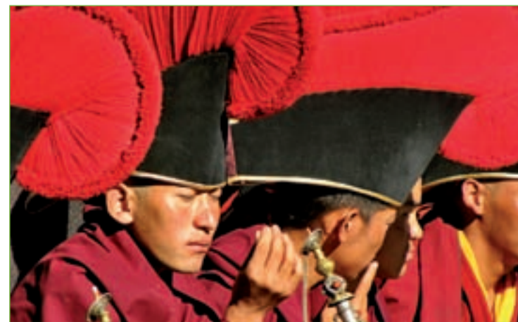
Hay un antes y un después cuando viajas al Tíbet A. ARIAS

entrada en tres desde Beijing, que dura dos días y en la que se pueden disfrutar de unos espectaculares paisajes. El riesgo de acceder al Tíbet sin los permisos necesarios es que la autoridades chinas hagan un control. Entonces, además de una multa, mandarán al viajero de vuelta a la ciudad china desde donde ha iniciado el viaje.