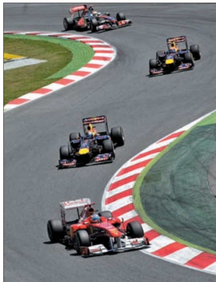
El piloto español lideró la carrera de Montmeló durante unas vueltas

En el seno de Ferrari esperan que se resuelvan los problemas de aerodinámica, el punto central de todas las remoras que impiden a Alonso y a Massa estar entre los mejores. Al parecer, los neumáticos de Pirelli no alcanzan su temperatura óptima, por lo que el F150 no encuentra al ritmo de carrera deseado, una situación que se agrava cuando se montan los neumáticos duros. Domenicali y el resto de respon-