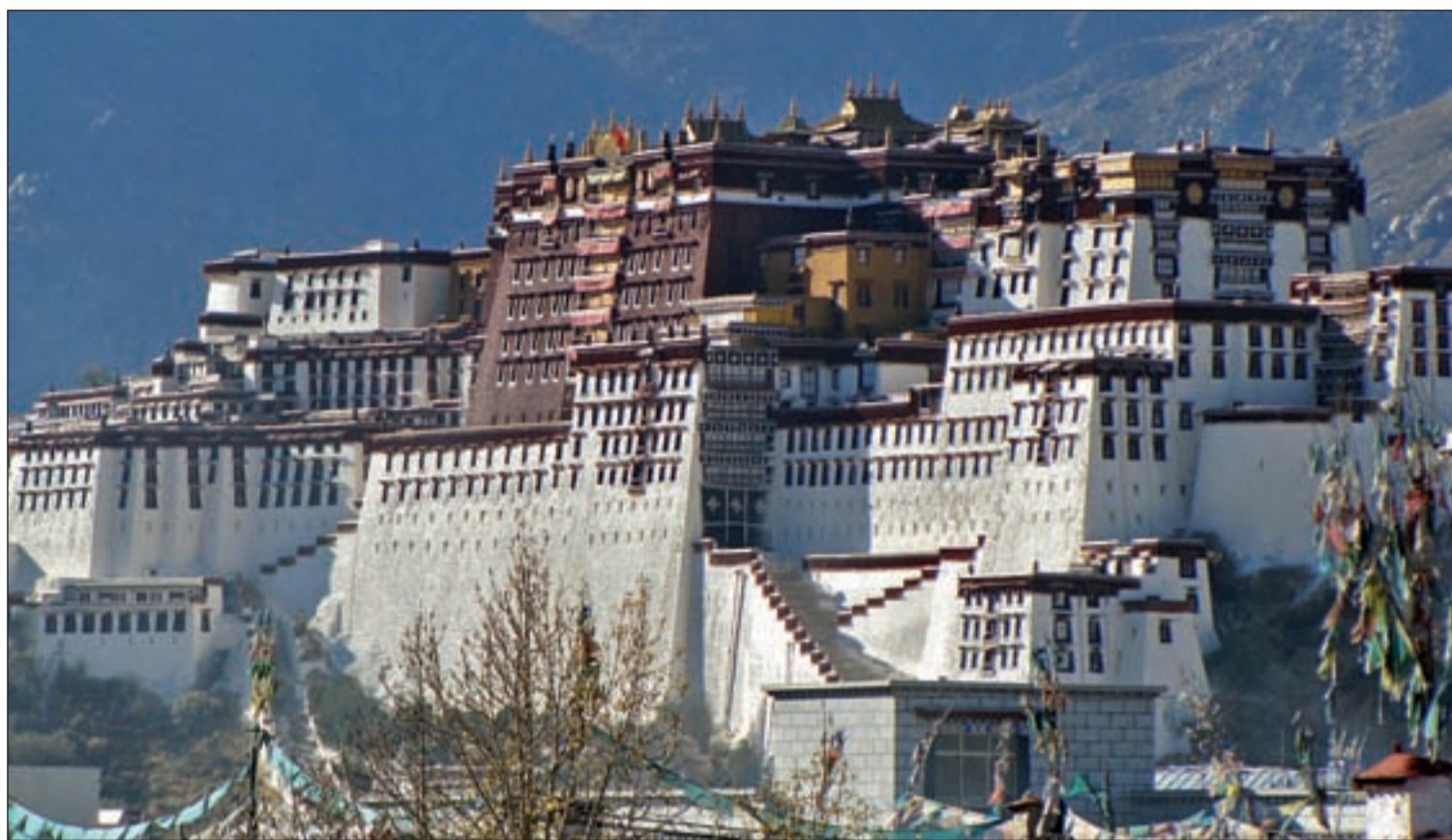
Palacio de Potala ALBERTO ARIAS