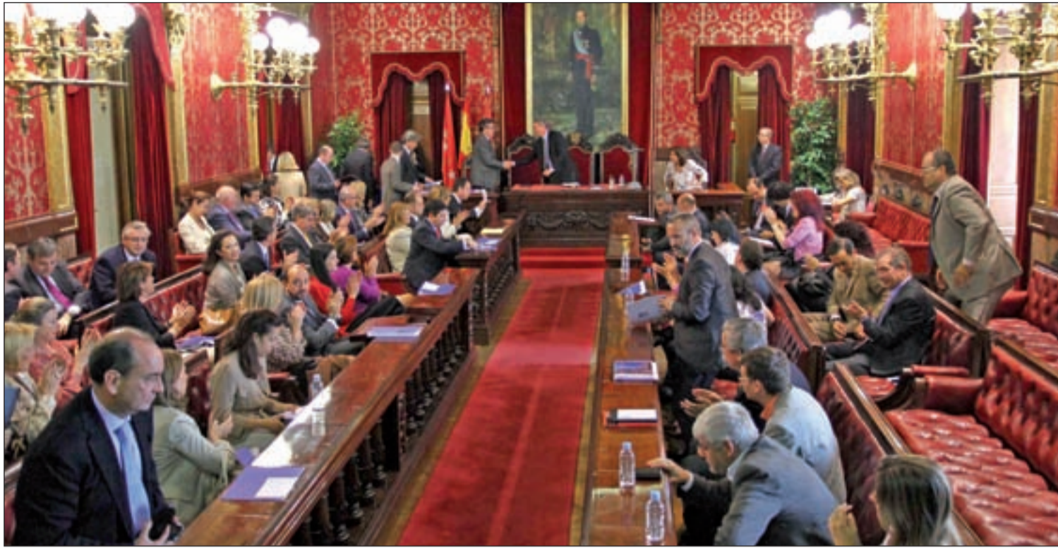
Vista de la bancada del pleno municipal de Madrid