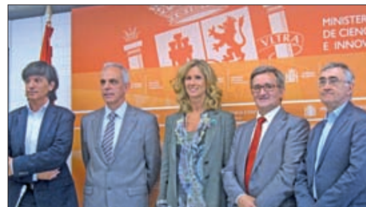
Garmendia (centro), junto a los investigadores

del Cáncer, un proyecto con el que se pretenden secuenciar los 50 tipos de cáncer más importantes. Para la ministra de Ciencia e Innovación, Cristina Garmendia, el objetivo es “dotar presupuestos específicos para que este triunfo científico pueda llevarse con la mayor brevedad posible a la práctica clínica”.