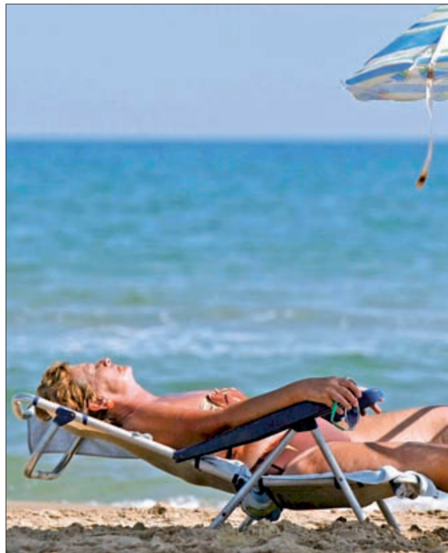
Los expertos alertan de los riesgos de las largas exposiciones directas al sol

La idea de estar bronceado antes de iniciar las vacaciones es