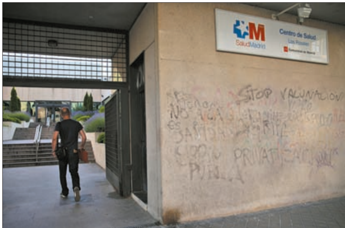
Aspecto exterior de Los Rosales, el centro de salud de referencia para los vecinos de Butarque

Para firmar, los ciudadanos interesados pueden imprimir la hoja que aparece en sus páginas web. Posteriormente, deberán entregarla en cualquiera de las asociaciones de vecinos de la Coordinadora.