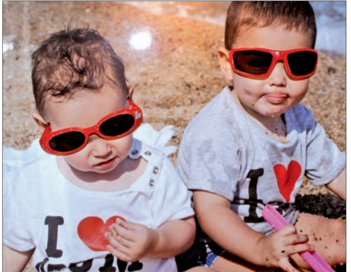
Los niños deben llevar unas gafas de sol debidamente homologadas y garantizadas

Los ópticos insisten en la importancia de que los padres tomen medidas fundamentalmente porque el ojo del niño es más sensible que el del adulto. Su cristalino, que ejerce de filtro, aún no está funcionando a la perfección. Antes del primer año de vida, el cristalino deja pasar el 90% de la radiación UVA y el 50% de la UVB, llegando directamente a la retina, lo cual puede provocar daños a corto y largo plazo en el niño. Las consecuencias pueden ir desde una queratitis (quemaduras que se manifiestan con dolor y enrojecimiento del