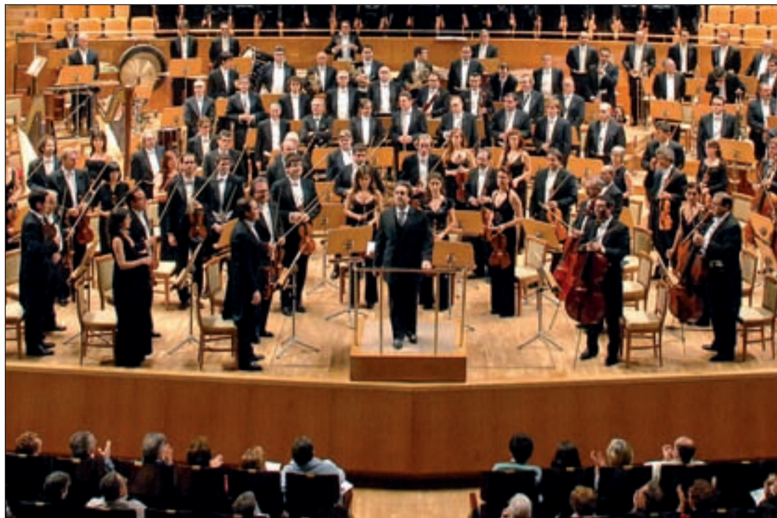
Orquesta Nacional de España en el Auditorio

La música será la encargada de impulsar el proyecto Infancia Hospitalizada de Cruz Roja en el Hospital Niño Jesús. El próximo día 17 el Auditorio Nacional de Música acoge la XI Gran Gala de Zarzuela, destinada a recaudar fondos para Fundación Inocente. En esta gala promovida por Fundación Sinfónica y Radio Sol XXI, se darán cita más de 200 artistas en escena. Obras como 'La Rosa del Azafrán', 'Doña Francisquita', 'Bohemios', 'El amigo Melquiades', 'La Chulapona', 'La Revoltosa', 'La Gran Vía' y 'El Divó' harán las delicias del público.