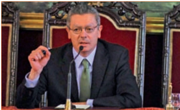
TOMARÁ POSESIÓN EL 11 DE JUNIO El sábado a las 11:00 horas, Alberto Ruiz Gallardón jurará en la Casa de la Villa su cargo como alcalde en la que será su tercera legislatura al frente del Consistorio de la capital madrileña.

En defensa precisamente de su labor, Alberto Ruiz Gallardón ha querido romper una lanza y ha señalado que "la política local es el trabajo más extraordinario que nunca haya podido hacer, al ser el más cercano a los ciudadanos". Del mismo modo, el alcalde en funciones ha tenido palabras de afecto para los ediles que