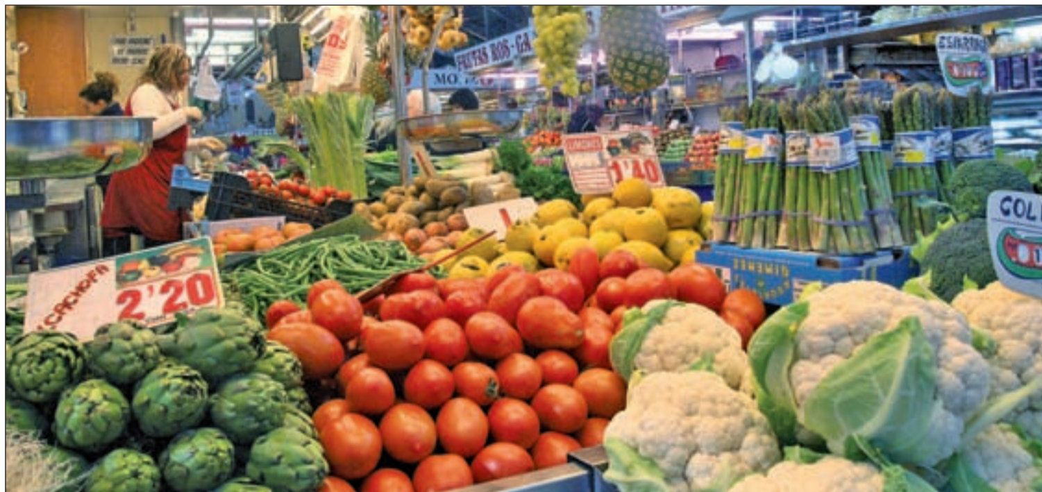
La grasa prima en nuestras dietas, carentes de frutas y verduras