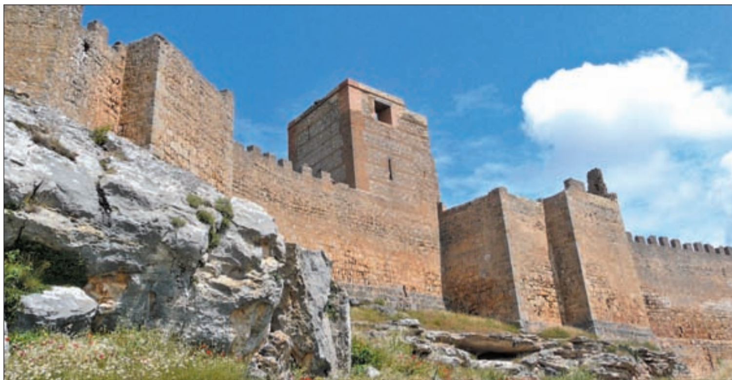
Fortaleza Califal de Gormaz

El 8 de junio de 1969 Brian Jones, componente de The Rolling Stones y uno de sus fundadores, dejaba el grupo.