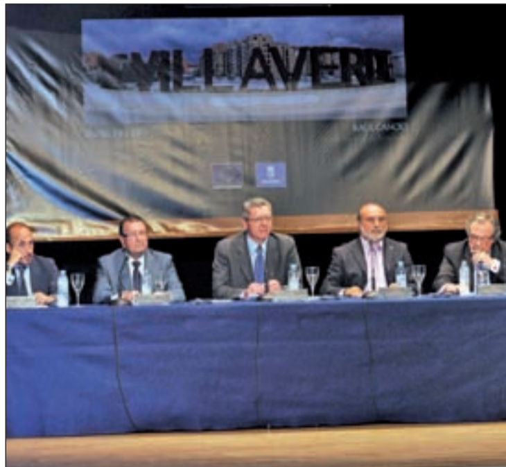
Cerca de 100 vecinos fueron a la presentación en el C.C. Santa Petronila

"En los últimos años, Villaverde ha dejado de ser un distrito periférico para adquirir un renovado protagonismo dentro de una de las metrópolis más dinámicas de Europa", indicó Alberto Ruiz-Gallardón, alcalde en funciones y presente en el acto. Esto ha sido posible gracias a iniciativas como Plan 18.000 Usera-Villaverde, al Plan Especial de Inversión Territorial del distrito o a los Planes de Barrio, así como a las inversiones por valor de 7,7 millones de euros procedentes de los fondos Urban-FEDER de la Unión Europea para favorecer el progreso social y económico y la regeneración urbana y ambiental. En el distrito se han construido nuevos equipamientos educativos, culturales, sociales y de-