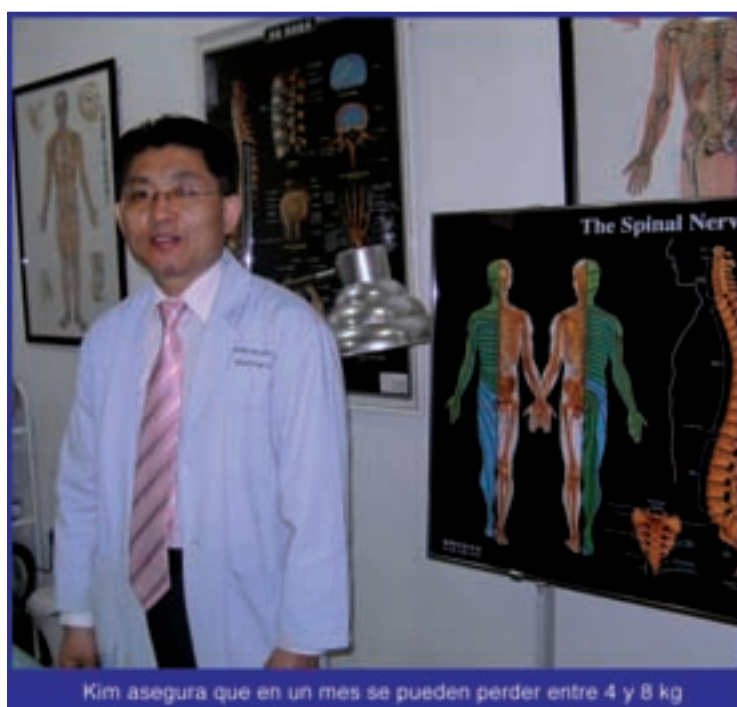
Kim asegura que en un mes se pueden perder entre 4 y 8 kg

Este tipo de cambios en los hábitos de vida, así como el aumento de la exposición al sol, son factores que están elevando la incidencia del melanoma en Espa-