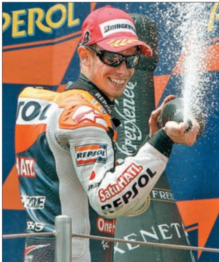
Ningún piloto pudo seguir el ritmo impuesto por el australiano

Sin apenas margen para analizar lo sucedido en el Gran Premio de Cataluña, todos los miembros de la parrilla han tenido que preparar la prueba que se disputará este fin de semana en Silverstone.