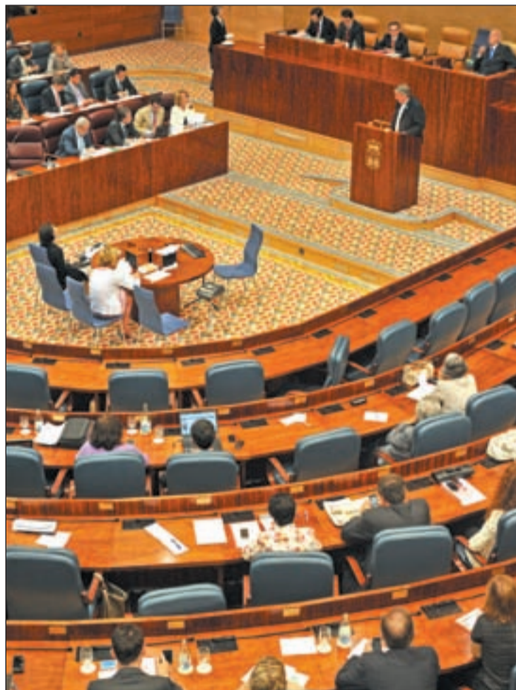
Pleno de la Asamblea en el debate de investidura

"Nos parece bien y nos parecerá mejor si además de duplicidades aborda la financiación de competencias impropias", recaló Gómez al tiempo que citó la carta que ha remitido a los gru-