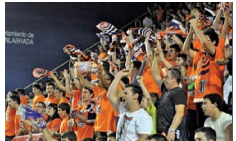
Seguidores del Fuenlabrada animan al equipo en el Fernando Martín

Todo hace prever que en el próximo curso el Fernando Martín seguirá rozando el lleno permanente ya que cerca del 85 por ciento de los abonados han renovado ya su carnet. En este sentido, el club recordó que a partir del lunes 20 de junio aquellos asientos que no hayan sido renovados quedarán liberados y a disposición del resto de seguidores no abonados.