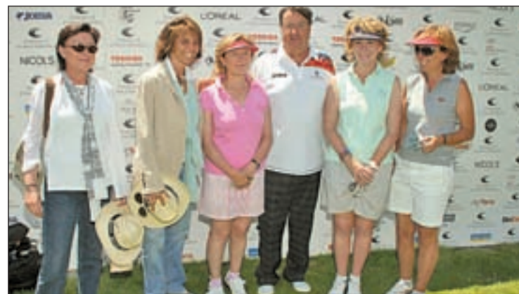
Esperanza Aguirre estuvo presente en este torneo de golf