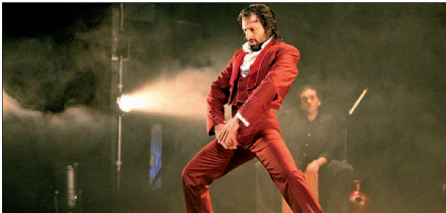
El bailar Rafael Amargo representará su espectáculo en Matadero Madrid