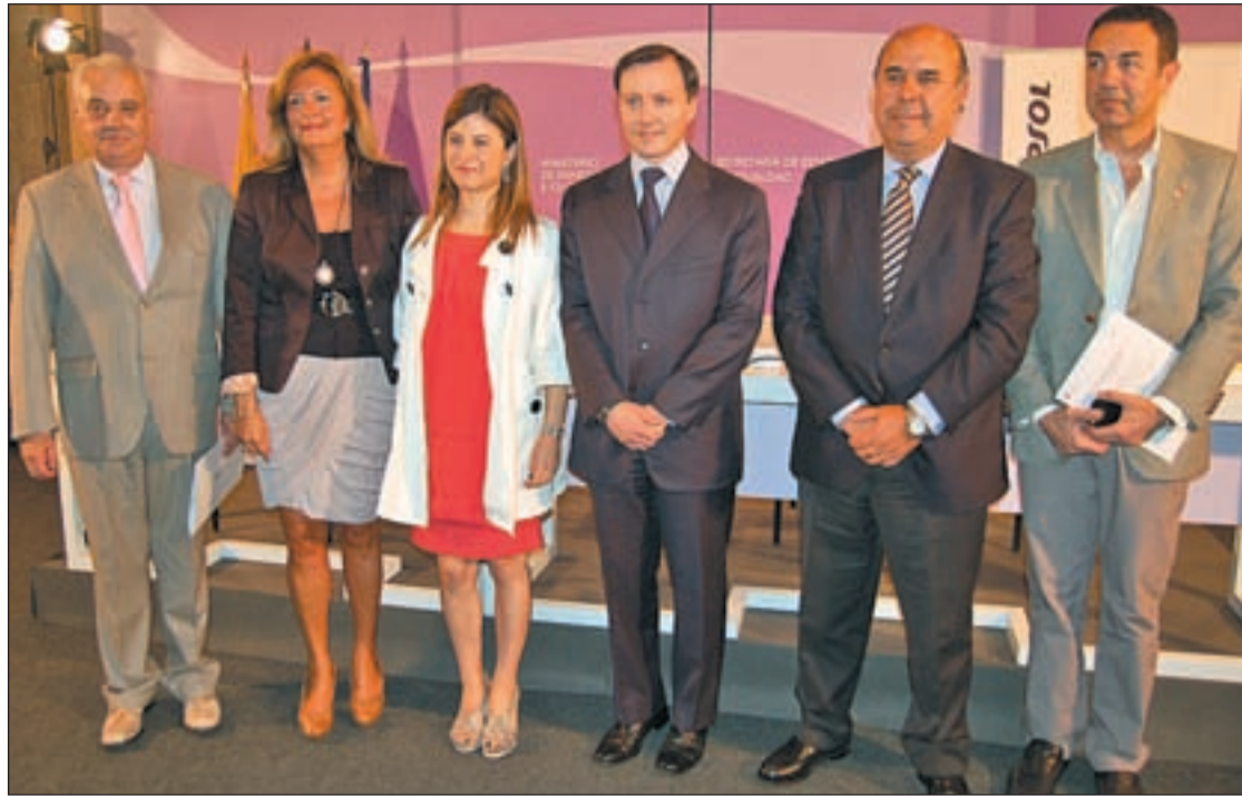
Rueda de prensa de presentación del proyecto de prevención