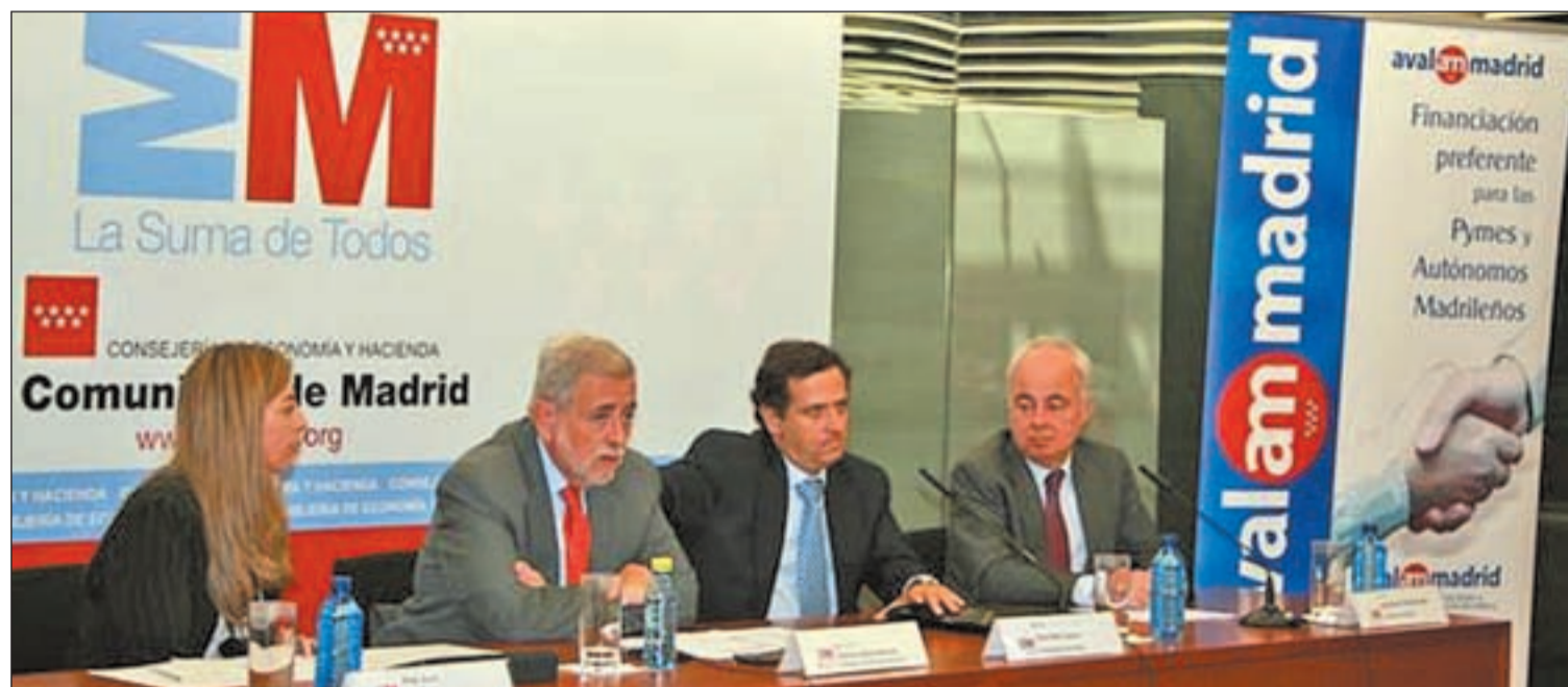
Firma de uno de los acuerdos liderados por Avalmadrid para impulsar el espíritu emprendedor y empresarial en el suelo de la Comunidad