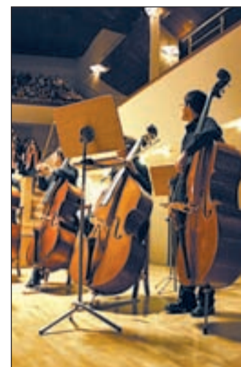
Orquesta de la JMJ JMJMADRID2011