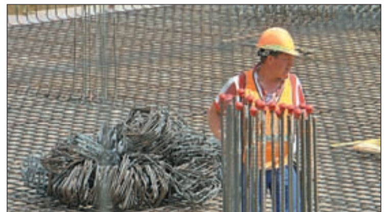
Un trabajador de la Comunidad de Madrid

Los sindicatos criticaron el número de víctimas mortales. UGT-Madrid exigió que el empresariado cumpla la Ley de Prevención de Riesgos Laborales para evitar más muertes, mientras que Comisiones Obreras de Madrid aseguró que las cifras de víctimas tienen como primera causa de origen la no aplicación de las medidas preventivas durante el desarrollo de la actividad laboral.