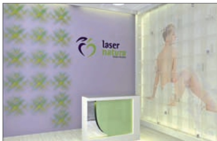
Laser Natura, primer centro de salud estética integral

fórmula de la franquicia, con el fin de llevar su modelo de negocio tanto a las principales ciudades de España como de fuera del país, es Laser Natura.