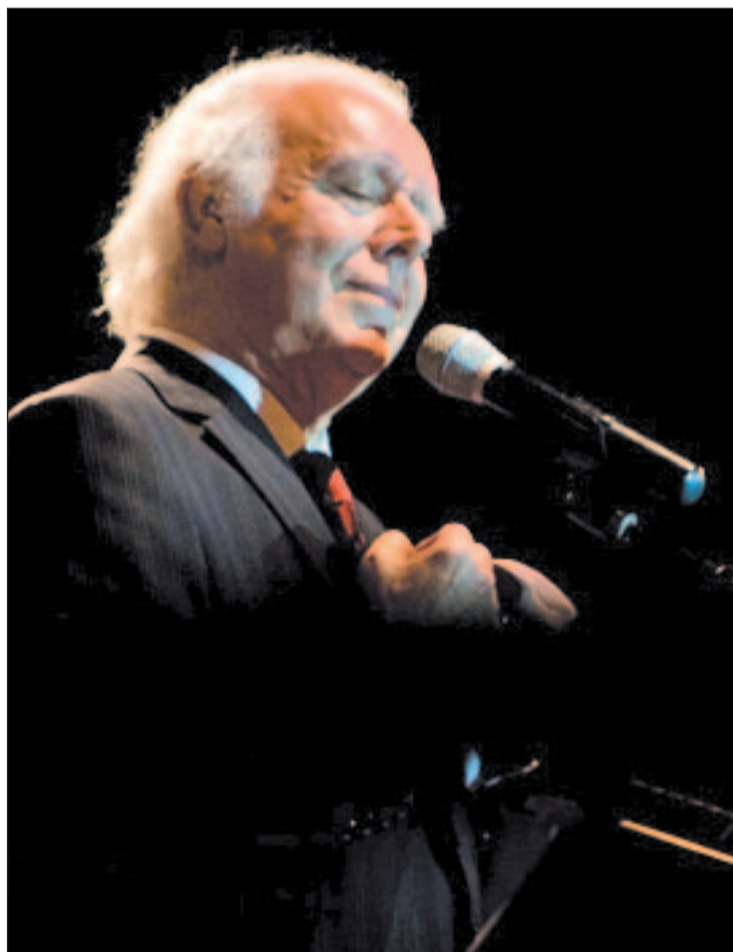
Una actuación de Carlos do Carmo

El Festival finaliza el domingo 19 de junio con un concierto a cargo de Carlos do Carmo. Hijo de una consagrada fadista (Lucilia do Carmo), dicen que el tiempo le ha convertido en un maes-