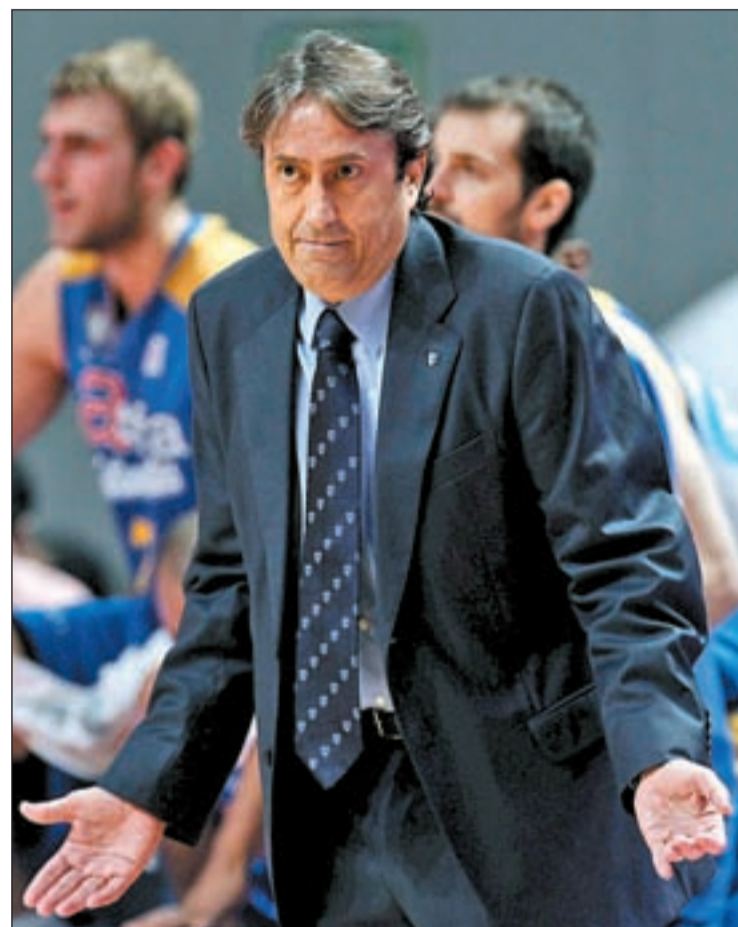
Casimiro ha completado tres temporadas con el equipo colegial

La situación de Tyrone Ellis es uno de los casos más llamativos. El internacional georgiano llegó el pasado verano al equipo del Ramiro de Maeztu con la esperanza de que aportara su experiencia a un puesto tan decisivo como el de base. A pesar de haber sido uno de los hombres de confianza de Casimiro y de haber formado parte del quinteto inicial en bastantes partidos, sus 7'4 puntos para 4'1 de valoración media no parecen ser aval suficiente para continuar al menos un año más. En unos números parecidos ha estado Jiri Welsch. El checo estaba llamado a ser un jugador importante en el aspec-