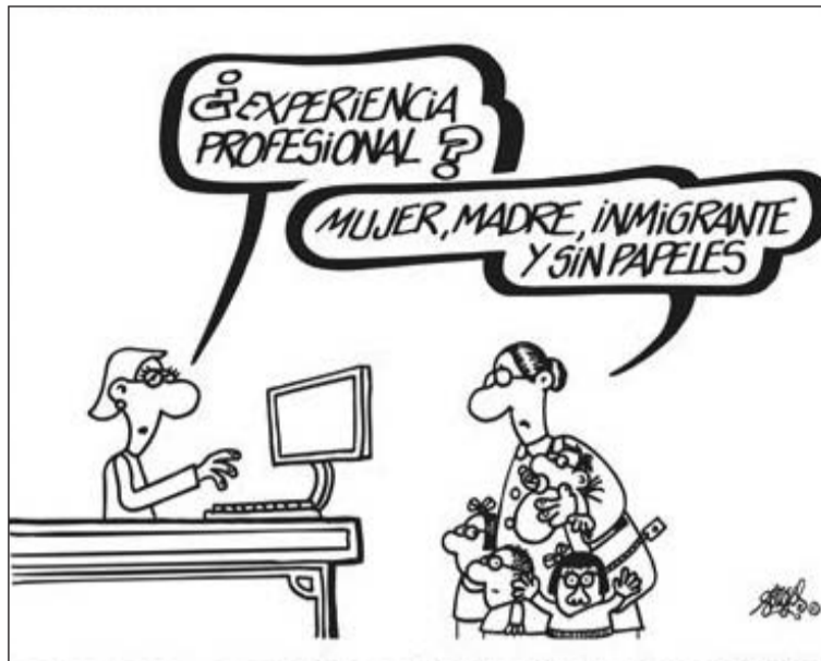
Viñetas de Forges y Mingote