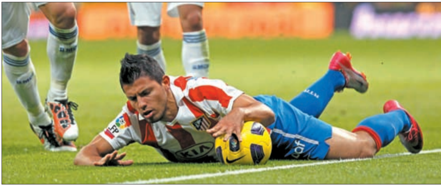
El delantero ha manifestado su intención de cambiar de equipo para la próxima temporada

EL POSIBLE FICHAJE DE AGÜERO PODRÍA ENFRENTAR A LAS DIRECTIVAS DE REAL Y ATLÉTICO