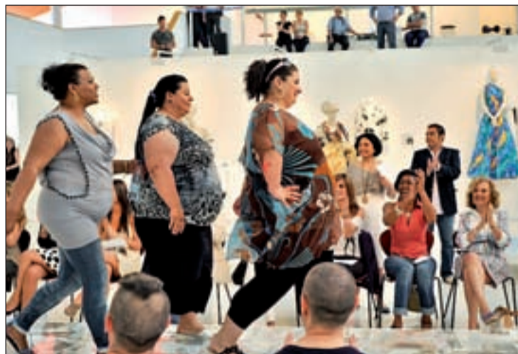
Mujeres gitanas desfila en la exposición Fashion Art

El taller concluyó con el desfile de clausura en el que modelos