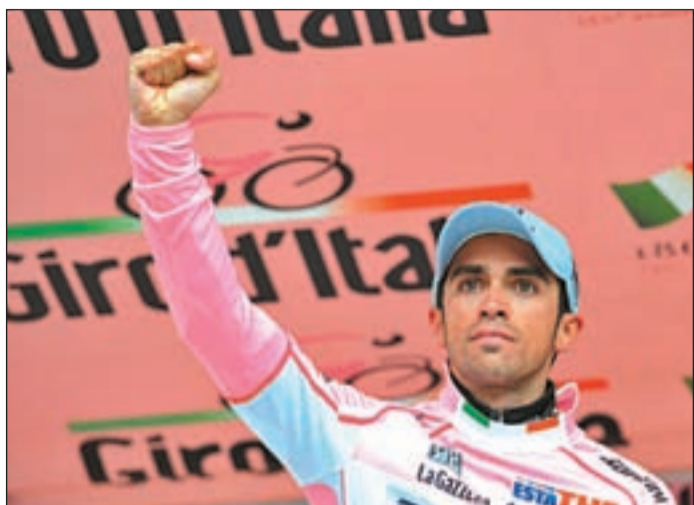
El ciclista del Saxo Bank, dispuesto a seguir haciendo historia

TOUR EL PINTIÑO SÍ ESTARÁ EN LA RONDA FRANCESA