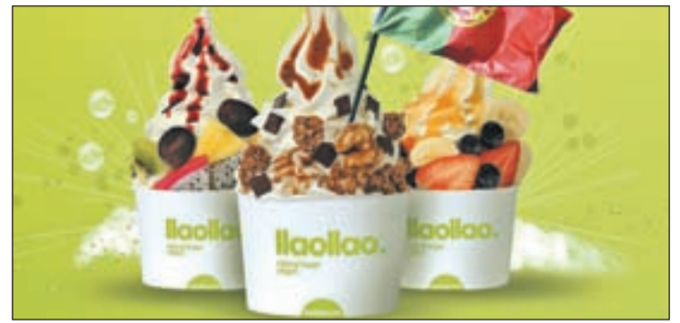
Frozen yogurt de llaollao

Hay que destacar que llaollao es un producto para todos los públicos, muy recomendado para niños, embarazadas y personas mayores.