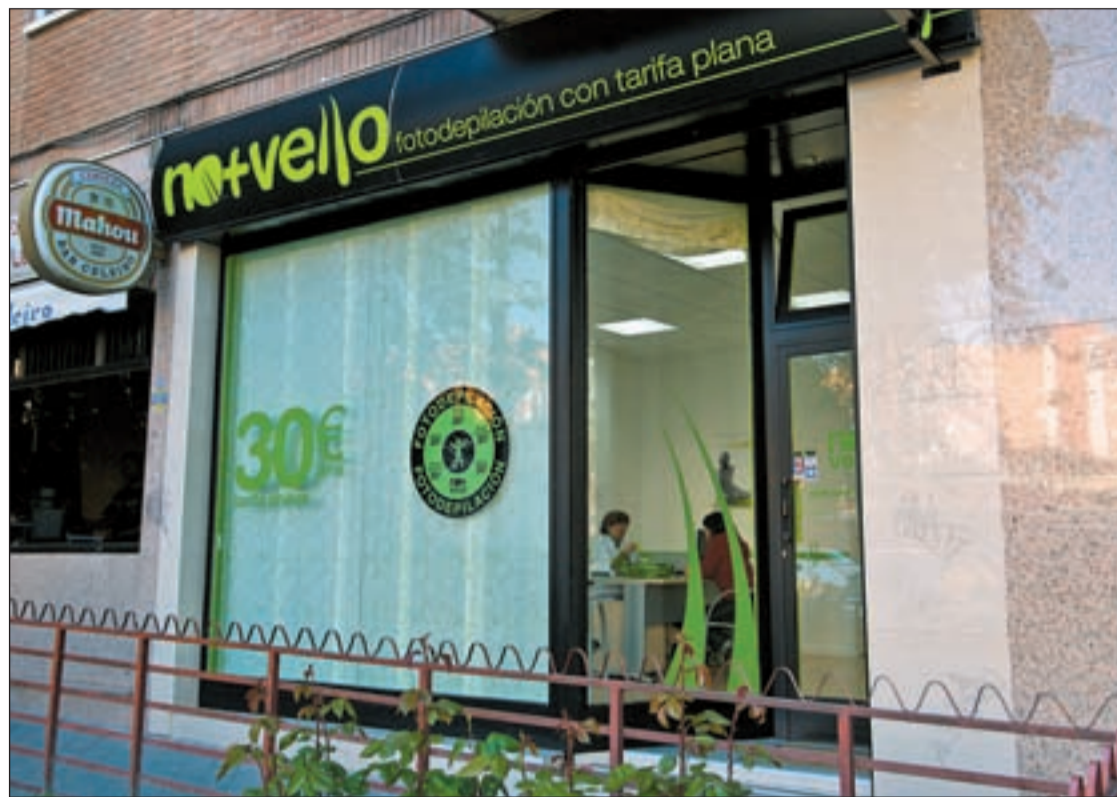
No+Vello, cadena líder en fotodepilación

Otra firma especializada en belleza y estética que se suma a la