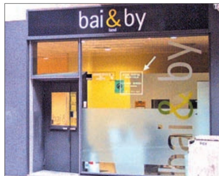
bai&by, línea de enseñanza online, comienza su expansión en franquicia con un modelo de negocio rentable y fácil de gestionar que supone una alternativa profesional en el sector de la educación.

bai&by busca franquiciados con habilidades comerciales que quieran desarrollar su propio negocio aunque no dispongan de conocimientos de inglés.