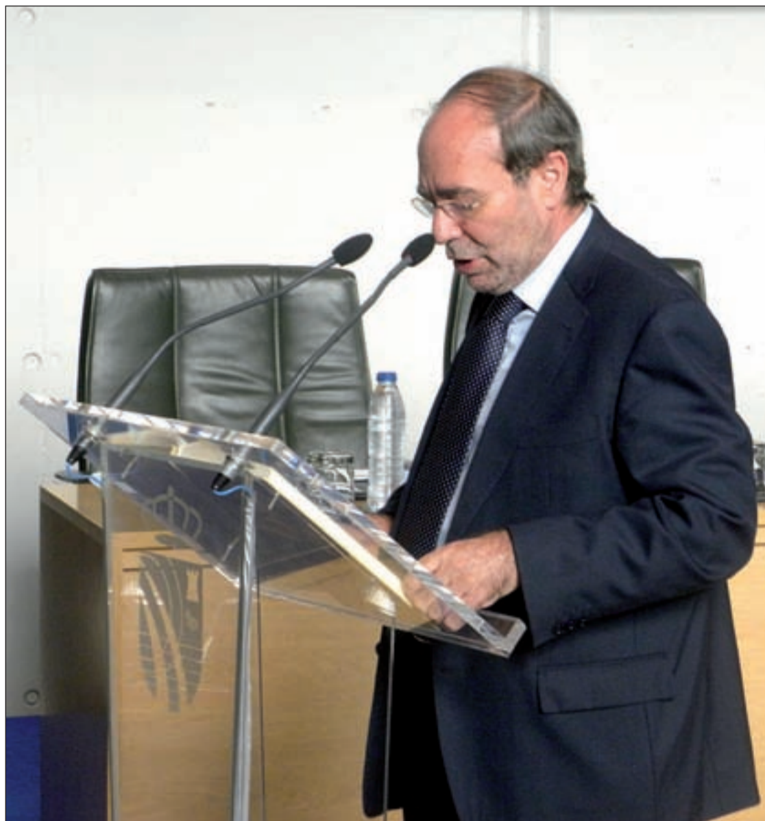
El alcalde, Manuel Robles, durante su intervención en el Plano de Investidura

Y como a la puerta del consistorio cerca de un centenar de personas del movimiento 15-M hacían sonar las cacerolas, el alcalde también tuvo palabras para ellos y les ofreció diálogo.