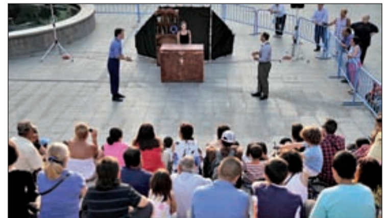
La plaza de la Constitución vuelve a llenarse de música y teatro

variadas de distintos estilos. El día 25 el Teatro Circo de la compañía Muchas Noches y Buenas Gracias interpreta La Caravana. Una troupe compuesta por el payaso, el malabarista, el mago, la bailarina que ofrecen un espectáculo que tiene como protagonista a la vida cotidiana. El primer sábado de julio traerá La Magia de Thot, una representación que nos adentrará en un mundo lleno de seres mágicos, fantásticos y divertidos que realizan proezas asombrosas.