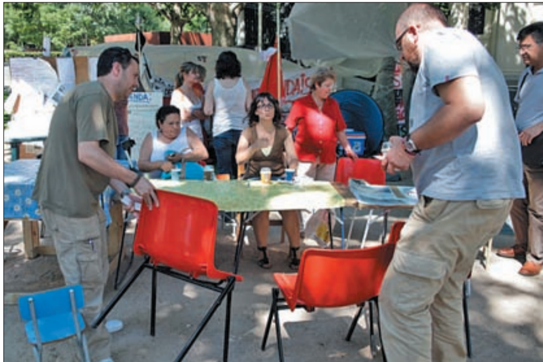
Algunos de los cooperativistas del Sureste acampados en Moyano

"Antes de firmar cualquier papel me informé bien", cuenta Sandra, de 30 años, "fui al registro, leí bien la letra pequeña, hice todo lo que se supone que hay que hacer". Pese a ello, ahora no tiene casa, ni tiene ahorros. La Asociación de Cooperativistas afectados del Sureste de Madrid es la entidad que aglutina las denuncias en diferentes casos, con di-