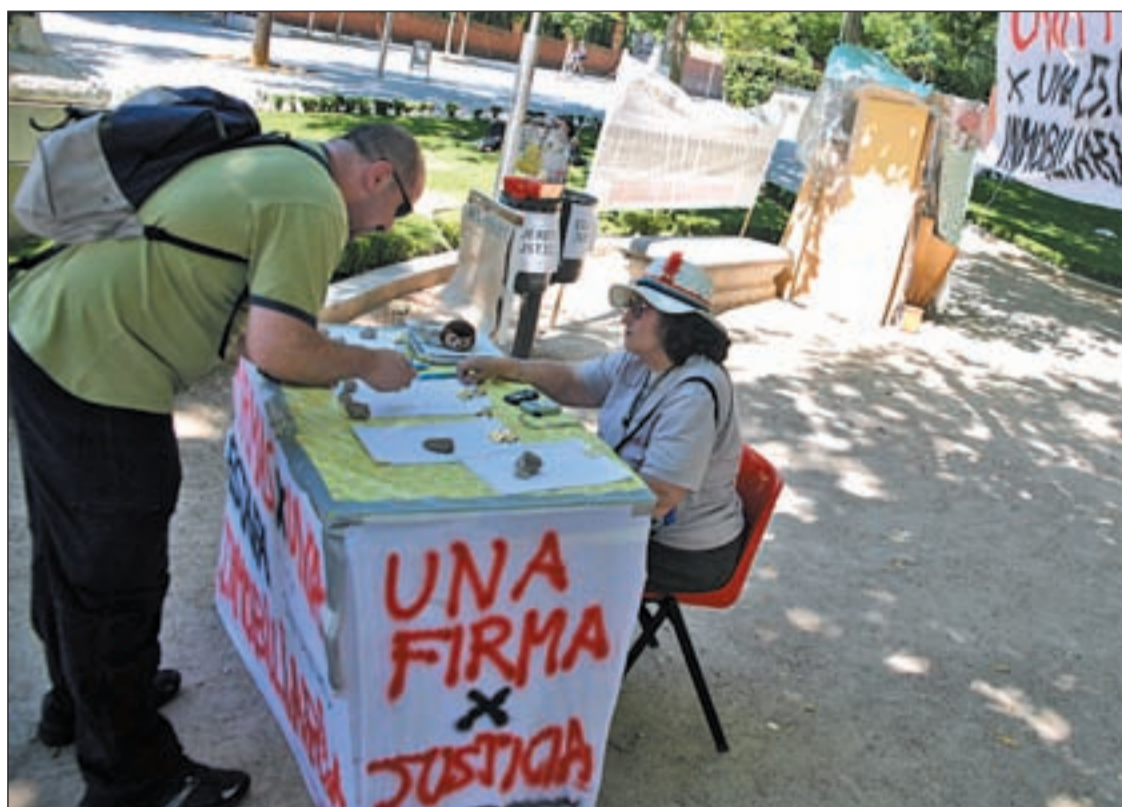
Los afectados se turnan en su campamento de la Cuesta de Moyano, junto a Atocha

Cerca de quince mil familias dieron entre 40.000 y 70.000 euros a distintas cooperativas que iban a construir cuatro desarrollos en Vicálvaro Pág. 5