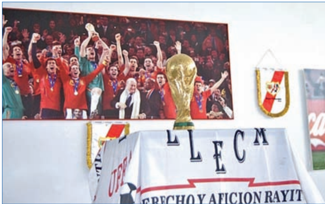
PEÑAS RAYO VALLECANO

Abusar de la autoridad que confiere una placa policial y un arma reglamentaria puede salirle muy caro a un policía. El fiscal pide cinco años de cárcel para él y otros cuatro para su hijo por unos hechos que ocurrieron en 2006 en las inmediaciones del Metro de Vicálvaro. Los cargos son robo a mano armada. Según la instrucción del caso, el policía, suspendido de empleo y sueldo desde esa fecha, abordó identificándose como policía a un joven que había vendido un GPS a su hijo para obligarle a devolverle el dinero llegando a ejercer coacción al mostrarle su arma.