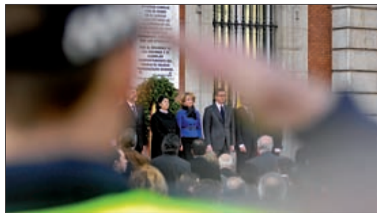
Gallardón en foto de archivo con sus escoltas

Estas actuaciones se suman a las efectuadas el pasado 25 de mayo también por el Ayuntamiento de Madrid cuando derribaron dos chabolas situadas en la parcela 211, entre la carretera de Vicálvaro a Mejorada y la M-45, y en la parcela 38 PB, entre la carretera de Vicálvaro a Rivas y la M-50.