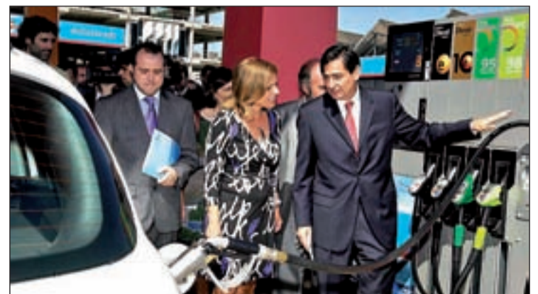
Ana Botella junto a uno de los surtidores de Repsol

En 2007 la red de combustibles alternativos en la ciudad de Madrid sumaba 11 estaciones; en la actualidad son ya 31, además de 280 puntos de recarga eléctrica. En el caso del autogás, se ha pasado de 2 a 10 puntos de suministro en los últimos 4 años.