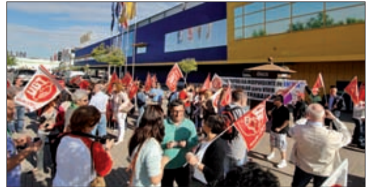
Movilización contra la decisión de la multinacional

La Gerencia del centro recoge además en su comunicado que las pruebas a los pacientes ambulatorios serán asumidas por los centros de especialidades de 'Federica Montseny' y 'Vicente Soldevilla'. Esta modificación a juicio del SAS supone un problema para "quienes residen en Villa de Vallecas, tienen la movilidad más reducida y tendrá que ir al otro lado de la M-40 para hacerse una simple radiografía". El sindicato también denuncia que algunos equipos como el mamógrafo o el telemando serán trasladados a otros centros sanitarios privando de recursos a los pacientes del Hospital.