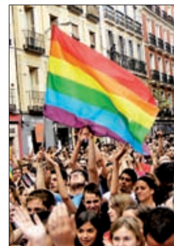
Celebración del Orgullo en 2010

Después del acoso que sufrió el alcalde mientras paseaba a su perro junto a su domicilio y la condena unánime al hecho de las organizaciones de Gays y Lesbianas, el Consistorio abre la puerta al diálogo. Alberto Ruiz-Gallardón recibirá finalmente a los organizadores del Orgullo Gay el próximo martes, día 21, en el Palacio de Cibeles para abordar la problemática surgida al ser suprimidos los espectáculos musicales en la plaza de Chueca porque serían contrarios a la normativa antirruido.