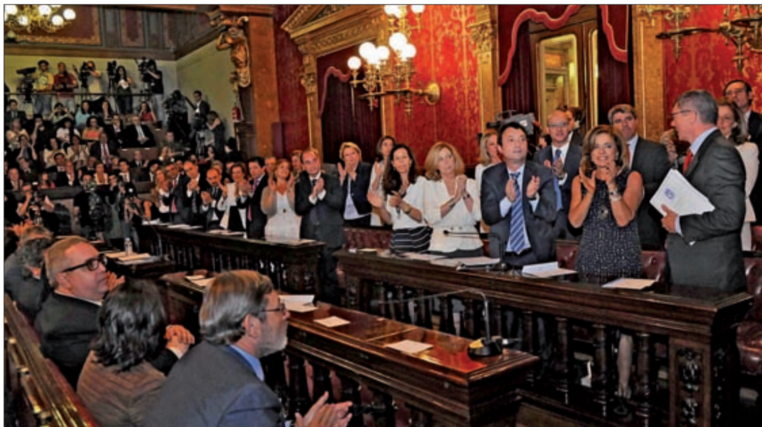
Los concejales electos del pleno de Madrid aplauden a Gallardón tras su investidura como alcalde de la capital