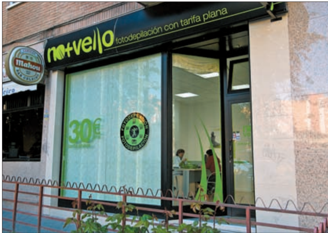
No+Vello, cadena líder en fotodepilación

Otra firma especializada en belleza y estética que se suma a la