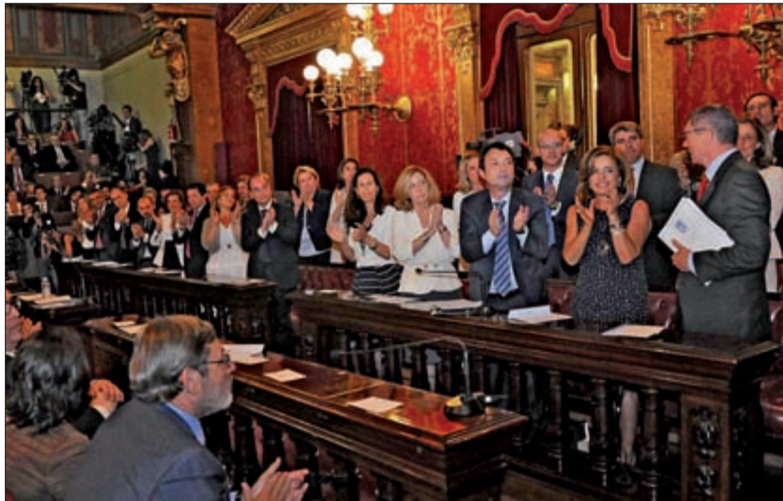
Los concejales electos del pleno de Madrid aplauden a Gallardón tras su investidura

Por otro lado, en la nueva composición del Gobierno municipal son pocos los cambios y pocas las caras nuevas en los puestos de responsabilidad en el tercer mandato de Alberto Ruiz-Gallardón como alcalde. La principal novedad será la austeridad que impondrá siguiendo las directrices de Génova. Desde su primer día en activo Gallardón ha comenzado un proceso de revisión de toda la estructura municipal a niveles administrativos para "racionalizarla" y "reducir el soporte administrativo". En esta línea, las áreas de Gobierno pasarán de nueve a ocho al fusionarse varias. Ana Botella, quien seguirá siendo segunda