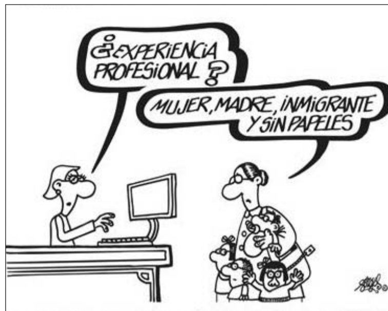
Viñetas de Forges y Mingote