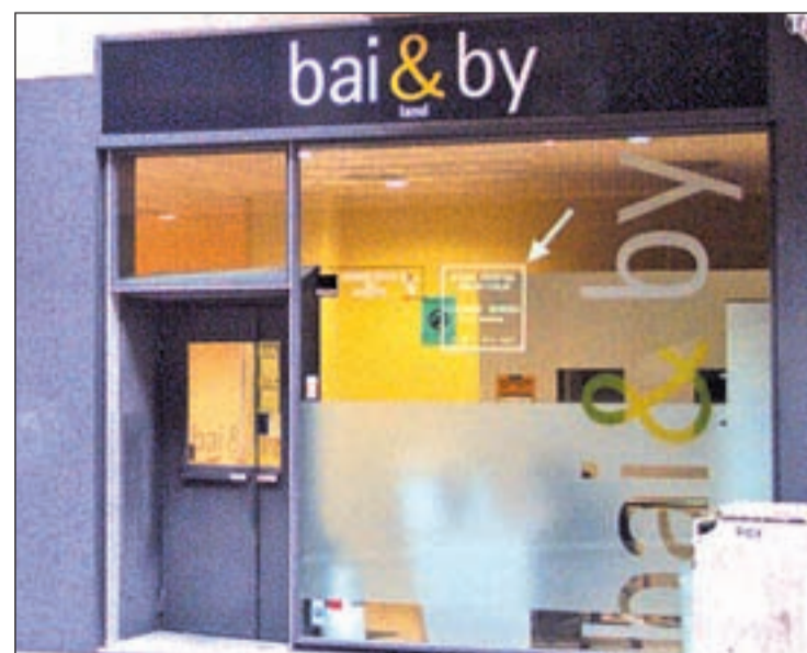
bai&by, línea de enseñanza online, comienza su expansión en franquicia con un modelo de negocio rentable y fácil de gestionar que supone una alternativa profesional en el sector de la educación.

bai&by busca franquiciados con habilidades comerciales que quieran desarrollar su propio negocio aunque no dispongan de conocimientos de inglés.