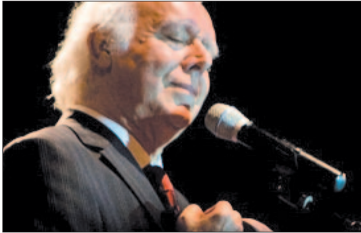
Una actuación de Carlos do Carmo

Tres grandes figuras del género, como Carmo Carminho Rebelo de Andrade, Cuca Roseta y Carlos do Carmo, ofrecerán tres conciertos exclusivos durante los días 17, 18 y 19 de junio. Las jornadas, que estarán dedicadas por entero a la promoción de la música y la cultura portuguesas, también incluirán conferencias, proyección de películas, una muestra representativa del fado y de la célebre fadista Amália Rodrigues y un espacio dedicado a la gastronomía típica.