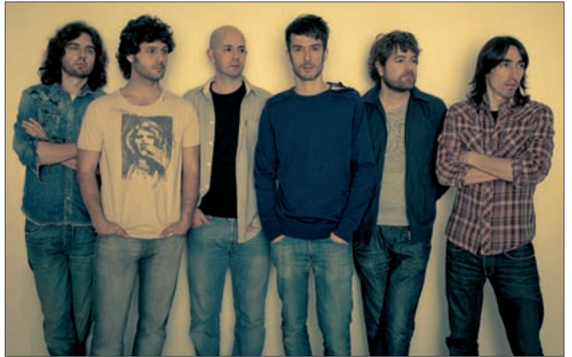
El notable funcionamiento colectivo en el plano artístico y personal define su trayectoria

El directo supone la prueba de fuego para los grupos, a Vetusta Morla le distingue una bue-