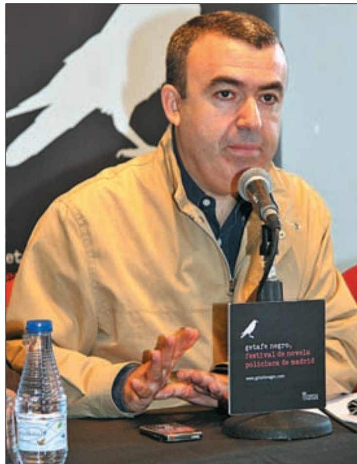
El comisario del Festival Getafe Negro, Lorenzo Silva