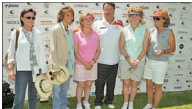
Esperanza Aguirre estuvo presente en este torneo de golf