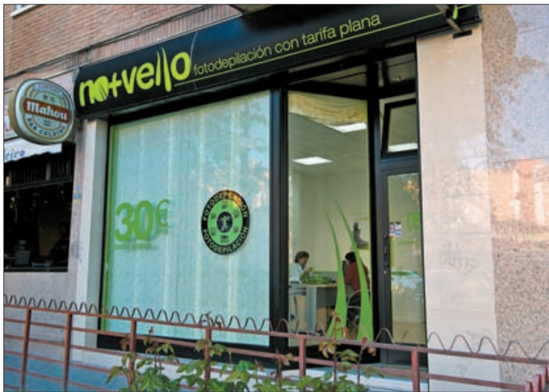
No+Vello, cadena líder en fotodepilación

Otra firma especializada en belleza y estética que se suma a la