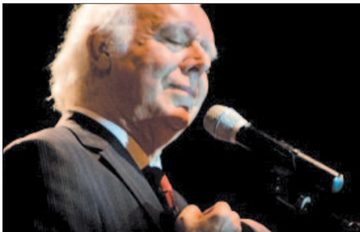
Una actuación de Carlos do Carmo

Tres grandes figuras del género, como Carmo Carminho Rebelo de Andrade, Cuca Roseta y Carlos do Carmo, ofrecerán tres conciertos exclusivos durante los días 17, 18 y 19 de junio. Las jornadas, que estarán dedicadas por entero a la promoción de la música y la cultura portuguesas, también incluirán conferencias, proyección de películas, una muestra representativa del fado y de la célebre fadista Amália Rodrigues y un espacio dedicado a la gastronomía típica.