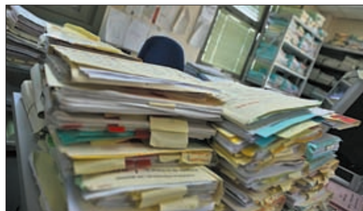
Imagen de la sobrecarga de informes en los juzgados en el Sector III