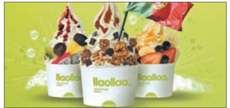
Frozen yogurt de llaollao

Hay que destacar que llaollao es un producto para todos los públicos, muy recomendado para niños, embarazadas y personas mayores.