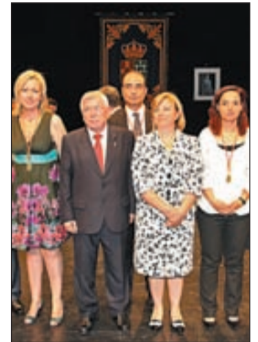
Castro con el grupo Socialista

El ya ex alcalde anunció que hará una oposición "responsable y participativa", defendiendo