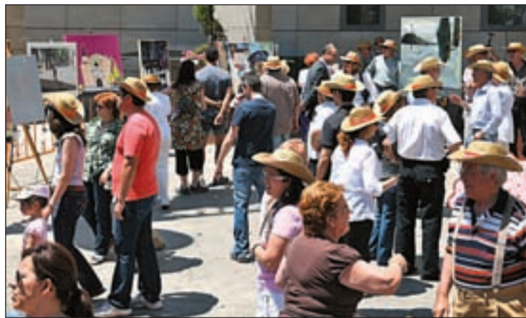
Numeroso público se acercó a presenciar el certamen de pintura

LAS OBRAS SE EXPONEN EN LA SALA GADES HASTA EL DÍA 24