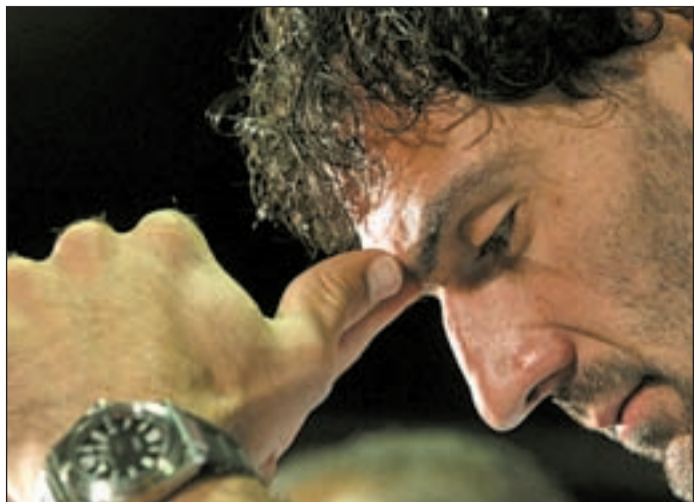
El jugador madrileño, durante su comparecencia

BALONCESTO "ES EL DÍA QUE NO QUERÍA VIVIR NUNCA"