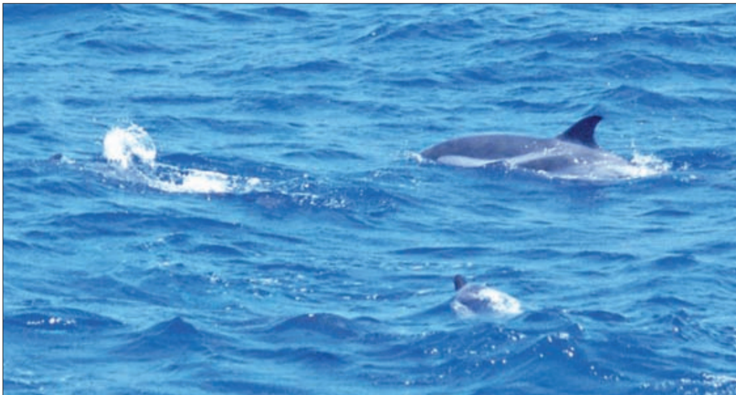
Cetáceos en las aguas del Estrecho de Gibraltar