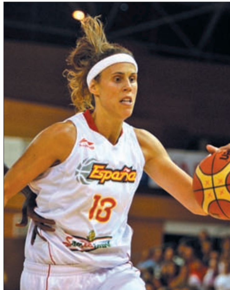
Amaya Valdemoro, una de las estrellas de la selección española

Para continuar esta senda del éxito, Hernández ha decidido seguir con su apuesta de mezclar jugadoras expertas como Amaya Valdemoro y Elisa Aguilar, con otras más jóvenes pero cuya valía ya quedado patente. En este grupo destacan la pívot Laura Nicholls, pero sobre todo la alero del Perfumerías Avenida Alba Torrens, una jugadora que parece haber explotado definitivamente esta temporada ayudando