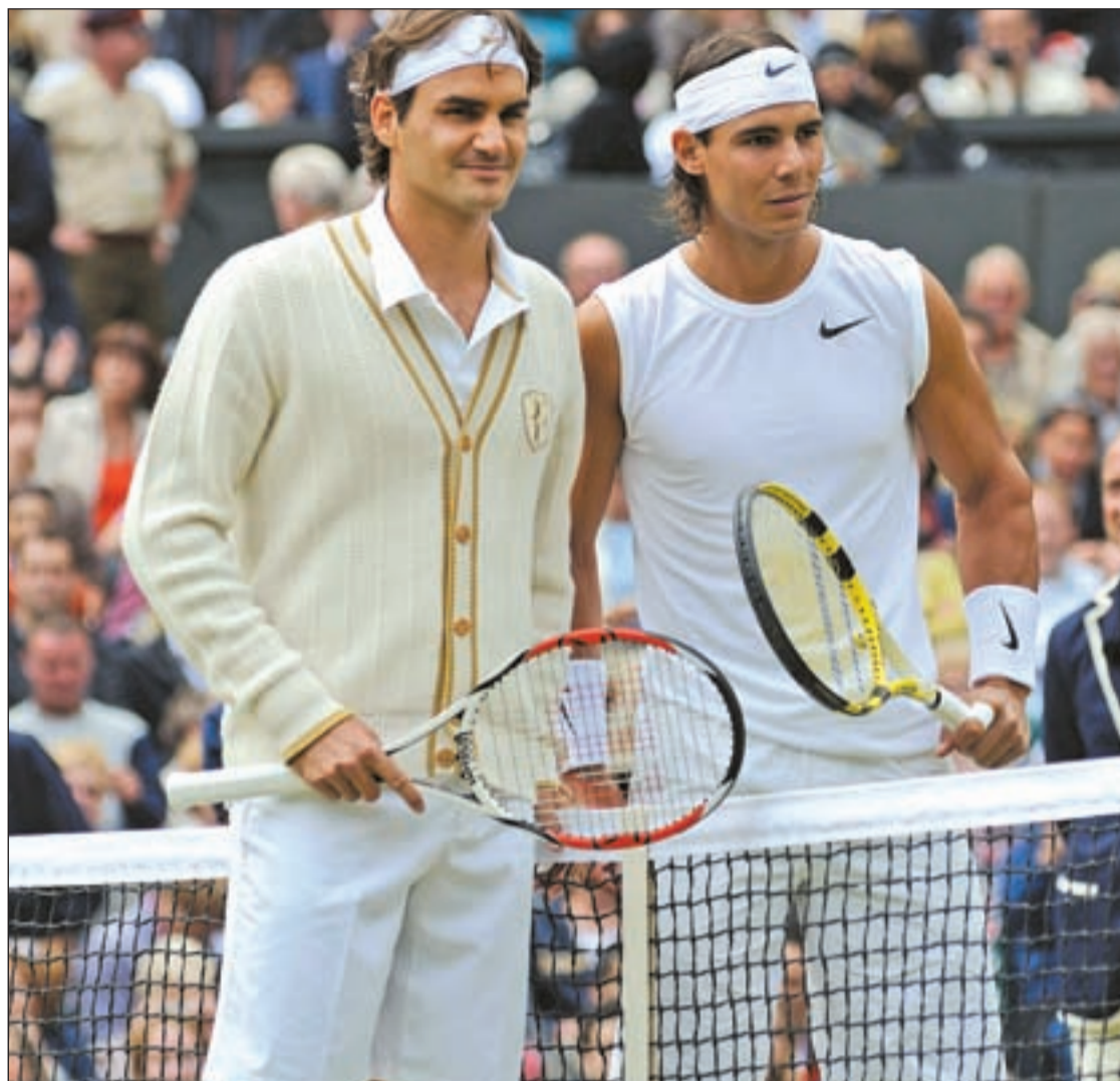
Federer y Nadal han sido los protagonistas de tres finales en los últimos cinco años

aún puede sumar un buen número de puntos si es capaz de acceder a la final. En la pasada edición, el checo Tomas Berdych dejó al balcánico con la miel en los labios tras imponerse en semifinales por 3-0.