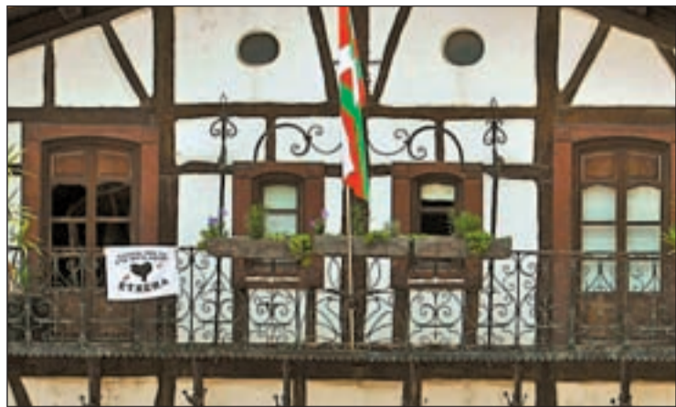
Pancarta a favor de los presos de ETA en Lizartza (Guipúzcoa)

LA IZQUIERDA ABERTZALE GOBIERNA EN 123 MUNICIPIOS