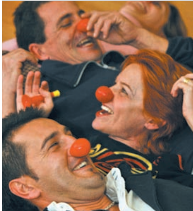
El número de mujeres felices es mayor que el de los hombres

nen mejores relaciones con su familia, amigos y compañeros de trabajo. Y, como características distintivas, les gusta ayudar a otras personas, mostrar su afecto con besos y abrazos, conocer gente nueva, tener invitados en casa, escuchar música y tener tiempo para disfrutar de sus hobbies e intereses. Sobre este tiempo de ocio, el 79 por ciento