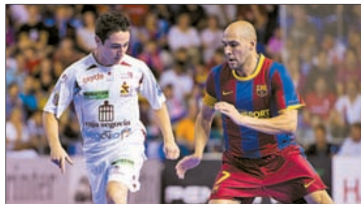
El Palau se llenó en los dos primeros partidos LNF5.ES

de imponerse por 4-2 en un encuentro que llegaron a dominar por 3-0. De este modo, ambos equipos llegan igualados al tercer partido que se juega este viernes (21:30 horas), quedando el cuarto para el domingo (19:00 horas). En caso de llegar al quinto, éste se jugaría en Barcelona el próximo sábado día 25.