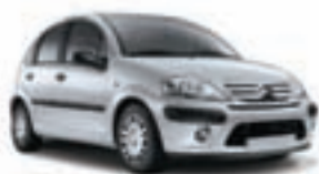
Citroën C3 1.1 Audace. Precio anual orientativo con bonificación.