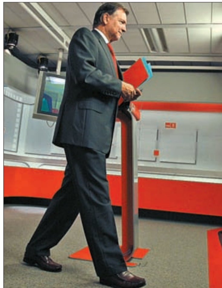
El portavoz del PSOE, Marcelino Camacho, descarta un adelanto EFE

El ministro de la Presidencia sostiene que entre ambos dirigentes existe "unanimidad" sobre este tema y que los comicios han de ser "cuando tocan" porque las legislaturas "tienen que acabar cuando tocan".