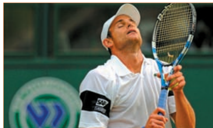
Roddick acarició con los dedos el título en la edición de 2009

El francés Tsonga o el sueco Robin Soderling son otros de los jugadores a evitar sobre una superficie que les es favorable.