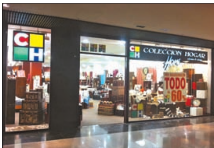
Una de las tiendas de CH Colección Hogar Home

Desde su creación en el año 1980, CH Colección Hogar ha sabido aprovechar las sinergias y tendencias del mercado y seguir creciendo pese a la recesión económica por la que está pasando el país. De esta forma y median-