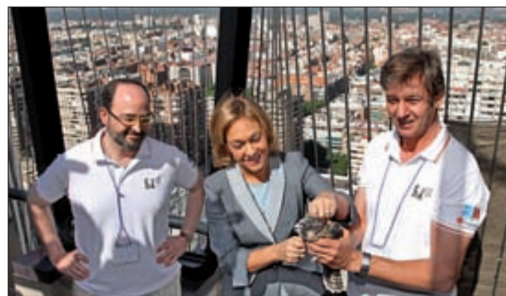
Su tasa de supervivencia en la ciudad es del 76%

Esta reintroducción en núcleos urbanos se realiza a través del 'hacking', técnica pionera en la Comunidad y que con los nuevos polluelos supone un total de 28 halcones más en los cielos de la capital desde el año 2008. La supervivencia de estas aves en la naturaleza oscila entre el 35 y el 40 por ciento, mientras que la de los halcones peregrinos criados en cautividad asciende al 76 por ciento.