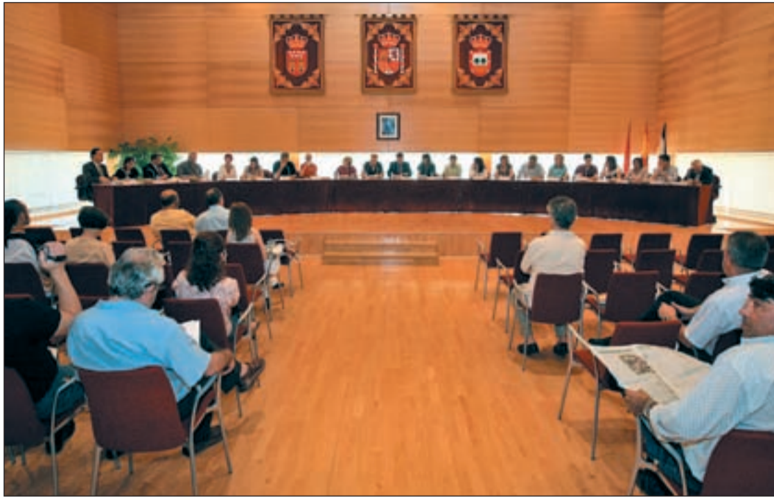
La nueva Corporación Municipal de Tres Cantos el día de su toma de posesión