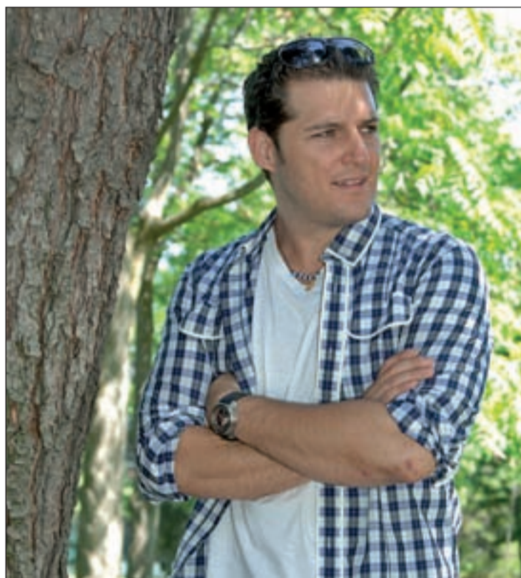
Manu Tenorio actuará el día 1 de julio en La Remonta

El Coro Rociero de La Ventilla se subirá al escenario de La Remonta el viernes a las 21 horas, antes del pregón de Pepe Ruiz y del concierto de Manu Tenorio