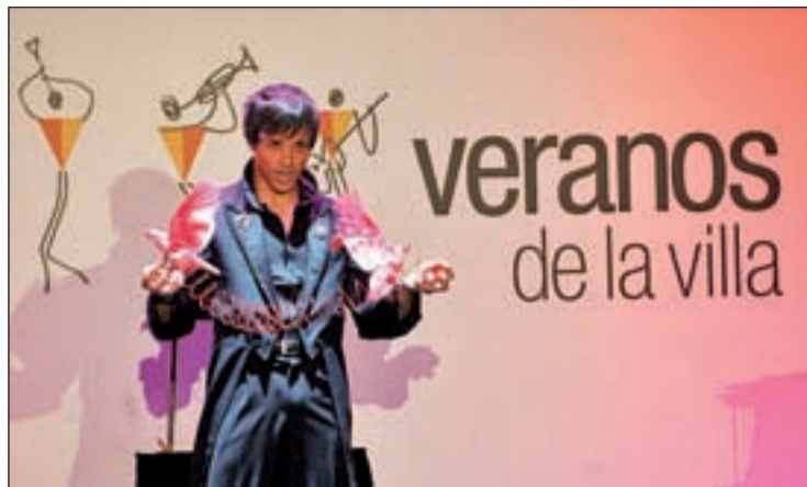
Una actuación en la presentación del festival

PROGRAMACIÓN CULTURAL PARA TODAS LAS SENSIBILIDADES