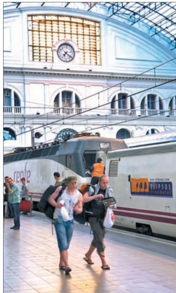
Dos viajeros extranjeros del Interrail en España

Dónde dormir es otra de las cuestiones que el viajero más tradicional cuestionaría de esta forma de viaje. Esterillas, parques, butacas y estaciones de tren eran clásicos aliados de los ‘interraileros’ en el pasado, pero la red de establecimientos como albergues o hostel destinados a este viajero mochilero ha creci-