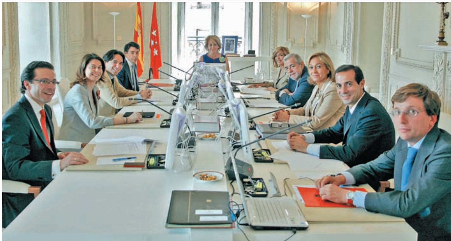
El nuevo Gobierno regional se reunió en el primer Consejo de Gobierno de la legislatura este viernes