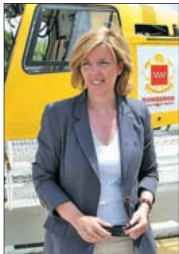
La consejera, en su primer acto