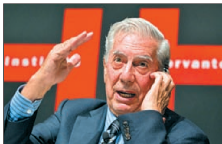
La universidad impartirá un curso sobre la obra de Mario Vargas Llosa