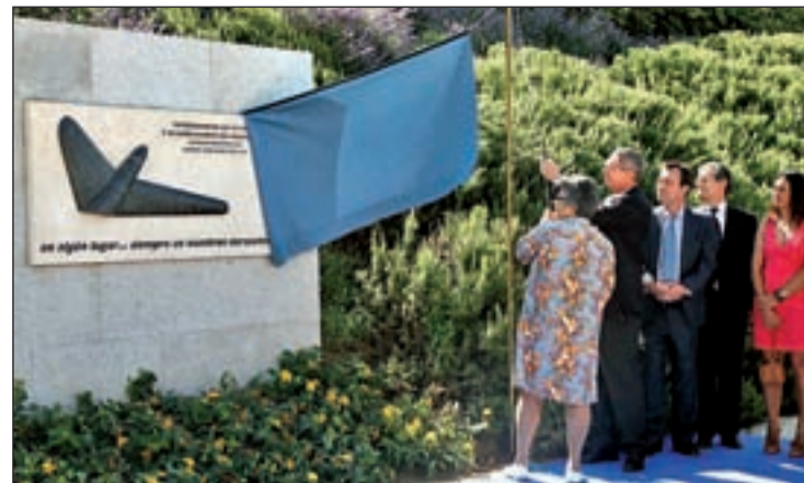
Momento en el que se descubrió la placa conmemorativa

SE INAUGURÓ EL SÁBADO EN EL PARQUE JUAN CARLOS I