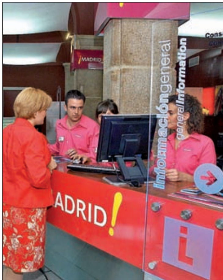
Oficina de Turismo del Patronato, una de las entidades que se fusiona

La oposición, encabezada por el PSOE, asegura que "es un plan de austeridad para la ciudadanía, con subida de impuestos y