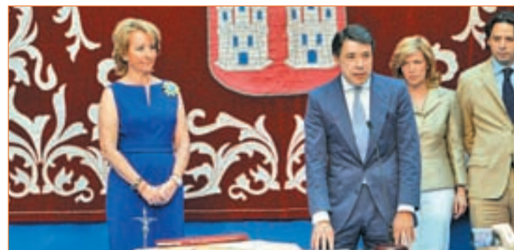
Esperanza Aguirre e Ignacio González, en la toma de posesión

de Transportes e Infraestructuras), Lucía Figar (Educación y Empleo), Ana Isabel Mariño (Ordenación del Territorio y Medio Ambiente), Javier Fernández Lasquetty, que será titular de Sanidad, y Salvador Victoria, consejero de Asuntos Sociales.