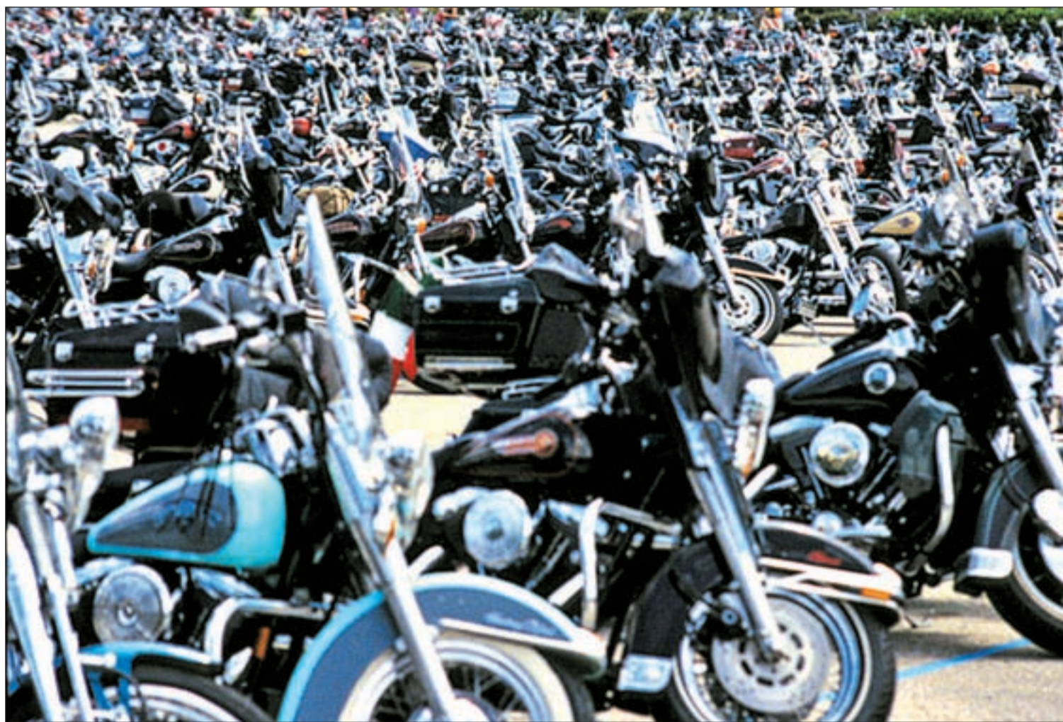
Concentración de Harley