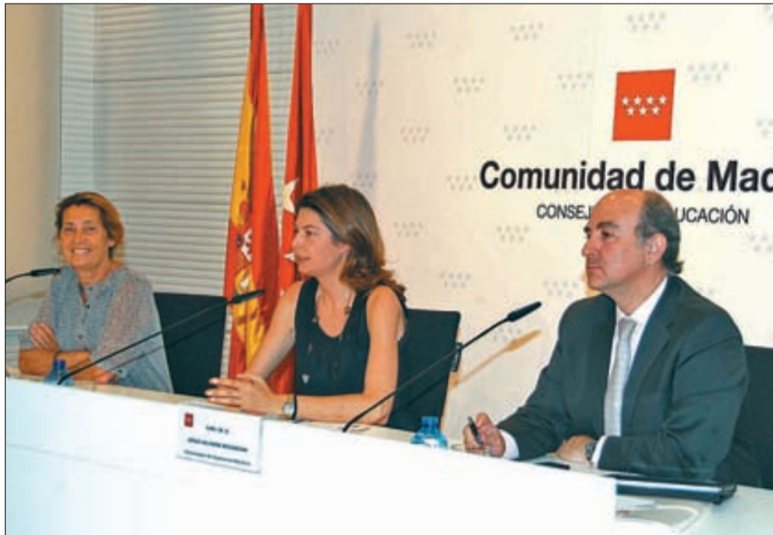
Lucía Figar, consejera de Educación y Empleo, presentó las novedades de las oposiciones

Figar explicó que las modificaciones se hacen con el respaldo de la LOE, después de que el pasado 24 de mayo haya expira-