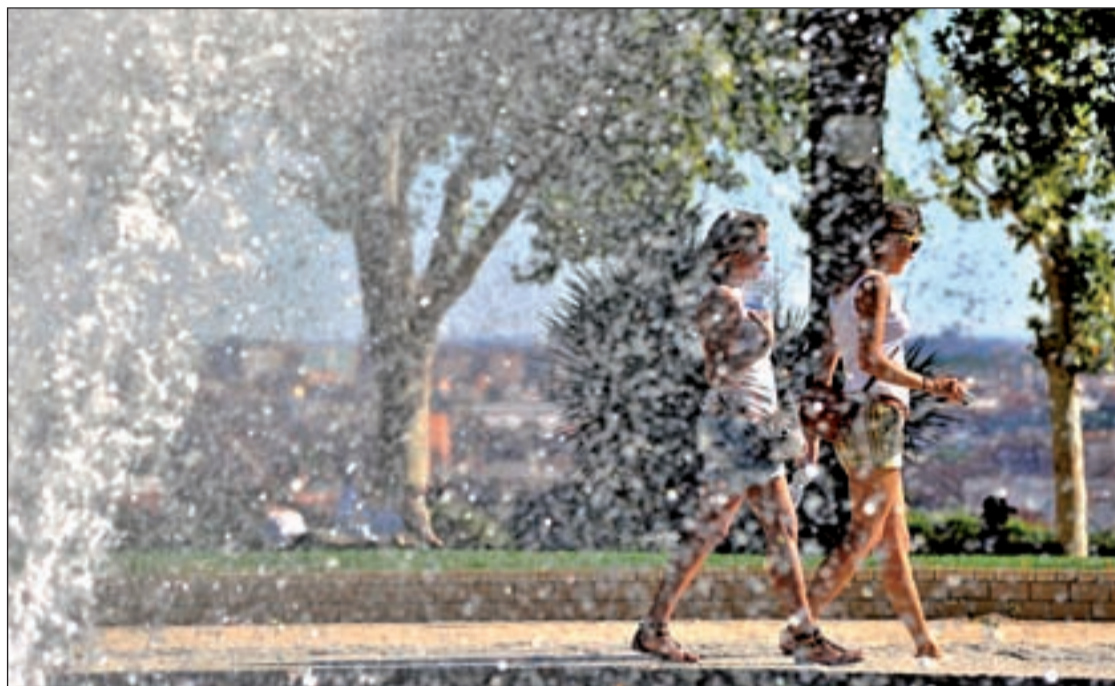
La combinación entre zona verde con sombras y el frescor del agua resulta perfecta en verano