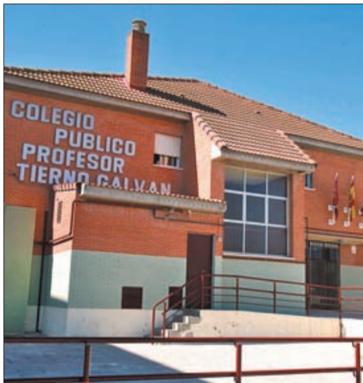
El colegio público Tierno Galván de Alcobendas, afectado por la tiña

Las cifras son confusas ya que mientras el centro habla de 18 casos, 16 alumnos y dos profesores, la Consejería de Sanidad apunta a once casos. De todas formas, esta situación ha provocado el nerviosismo entre los padres del centro que, el pasado miércoles por la mañana, mostraban mucha confusión. "Estoy preocupado porque no sé de