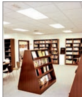
Una imagen del centro

Todos ellos pertenecen a la Asociación de los Artistas Profesionales de Corea (Korean Professional Artists Association). El colectivo está compuesto por artistas veteranos de más de 30 años y dedicados en exclusiva a