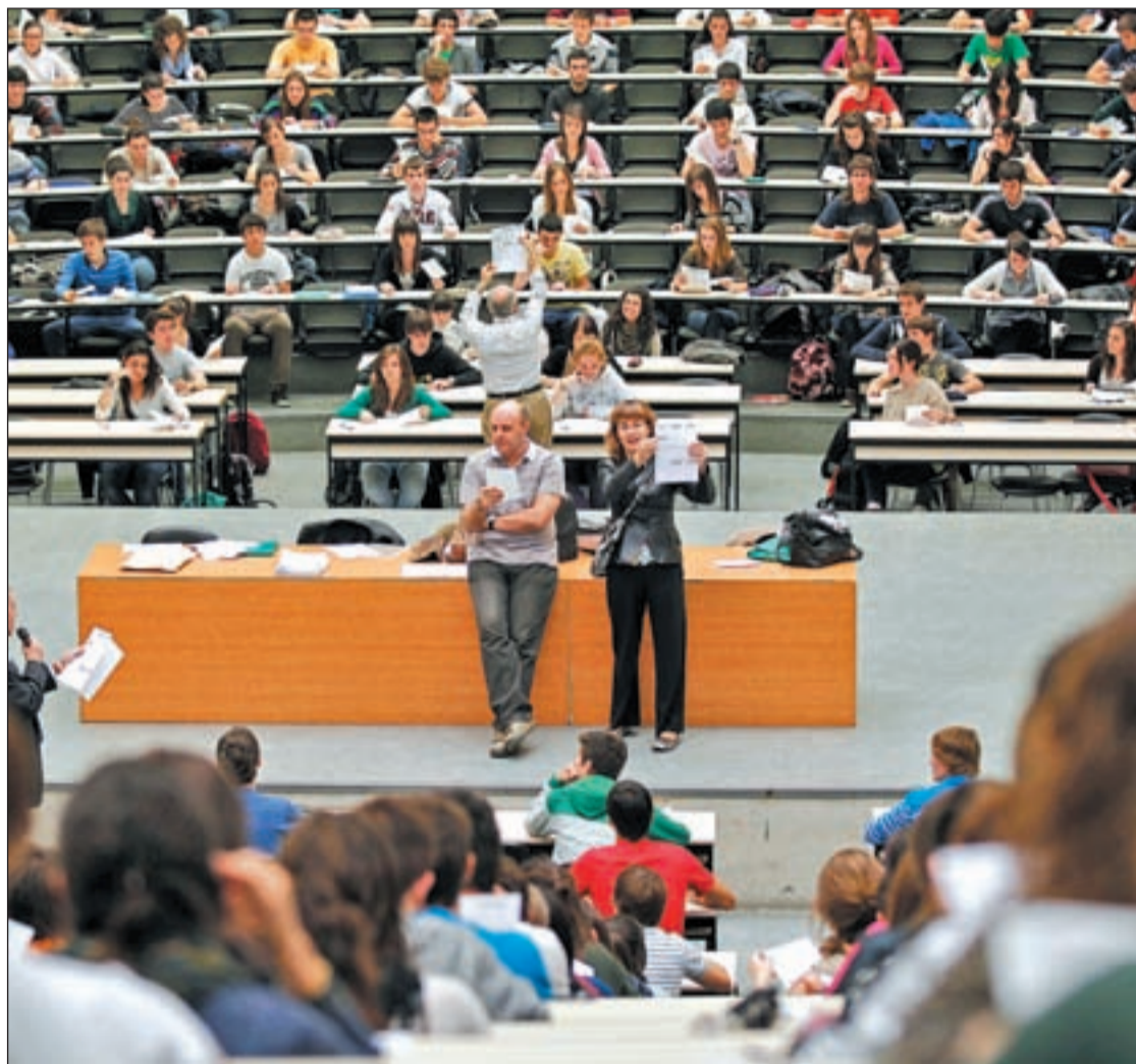
Un grupo de estudiantes se prepara para realizar el examen de Selectividad

Aunque la decisión de la mayoría depende de su nota para poder escoger, sólo el 27 por ciento tiene ya decidido qué grado elegirá. Por comunidades autónomas, los jóvenes de Pamplona son los que lo tienen más claro, ya que el 36 por ciento ha escogido un grado por encima de todos los demás, seguido de los cordobeses (33%), mallorquines y sevillanos (32% cada uno). Por el contrario, los más indecisos son los alumnos de Madrid, ya que sólo un 20 por ciento tiene una opción que pre-