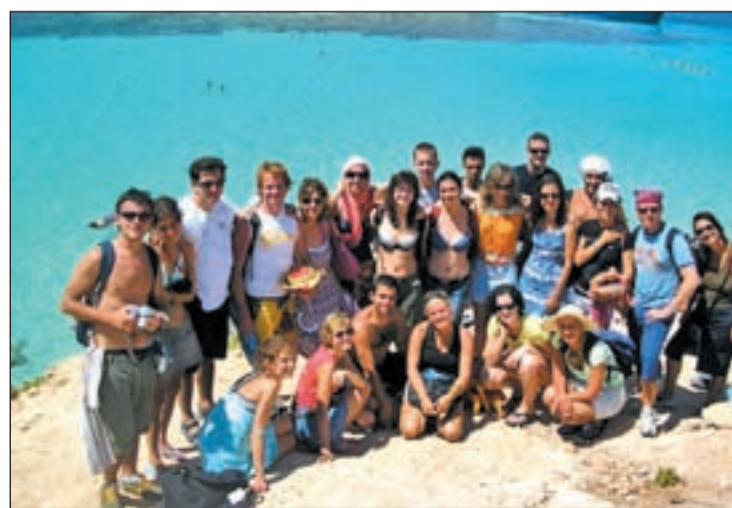
Participantes en el Summer University de Zagreb

Con el objetivo de inculcar un sentimiento de colaboración europeo transfronterizo y multicultural AEGEE oferta programas de educación no formal y visitas culturales de entre dos y cuatro semanas por menos de cien euros cada semana. En total más