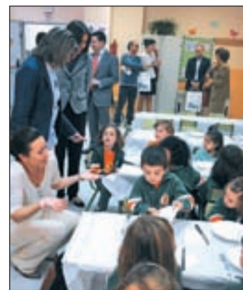
Un taller en un colegio

a los centros. Y es que la Consejería de Educación considera “precedente” establecer los requisitos para que los centros que imparten enseñanzas obligatorias puedan introducir modificaciones en la programación de las áreas o materias, así como su distribución horaria, de acuerdo con su proyecto pedagógico.