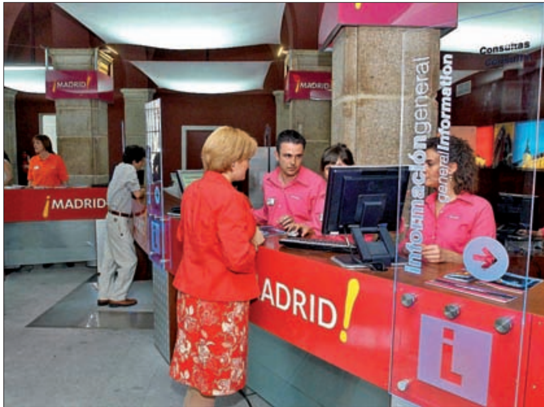
Vista de la Oficina de Turismo, una de las entidades que sufrirá modificaciones. AYO. MADRID

En el mismo ánimo de recortar los costes municipales se enmarca la reestructuración del Gobierno local que se concreta en un área de Gobierno menos, dos entidades municipales fusionadas, tres coordinaciones generales y 14 direcciones gene-