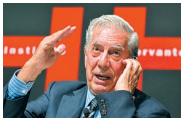
La universidad impartirá un curso sobre la obra de Mario Vargas Llosa