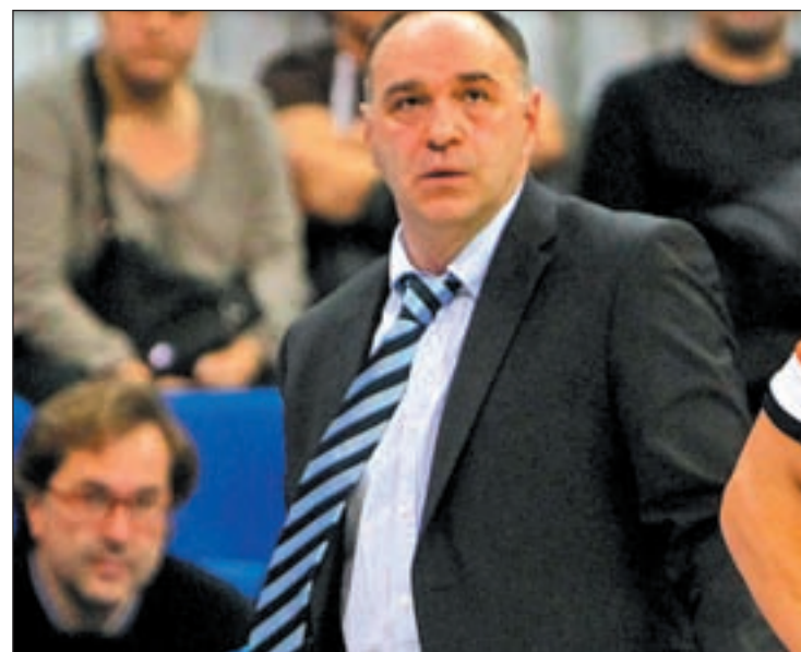
El técnico vitoriano durante un partido de esta temporada

iniciar su andadura como entrenador profesional. En 2004 se hizo cargo del Pamesa Castellón de la Liga LEB-2, para dos años después dar el salto a la Liga LEB de la mano del Alerta Cantabria. El conjunto santanderino fue su trampolín hasta el Lagun Aro GBC, club con el que logró el ascenso a la ACB en la 2007-2008; y en el que ha permanecido hasta hace pocos días.