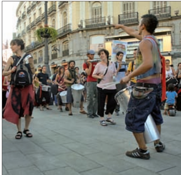
Batucada protesta el Día Europeo de la Música en Sol

En paralelo, la Plataforma de grupos de músicos de calle de Madrid realizó una batucada protesta el pasado 21 de junio en la Puerta del Sol. Decenas de personas siguieron el ritmo de sus cajas y timbales como si la flauta de Hamelín se tratara. Pe-