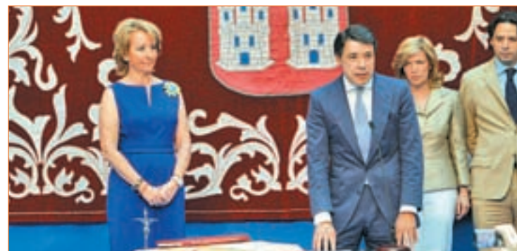
Esperanza Aguirre e Ignacio González, en la toma de posesión