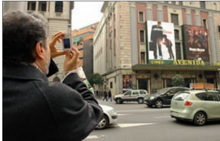
Foto de archivo de uno de los cines de Gran Vía

La Asociación de empresarios de Gran Vía, que aglutina a ochenta