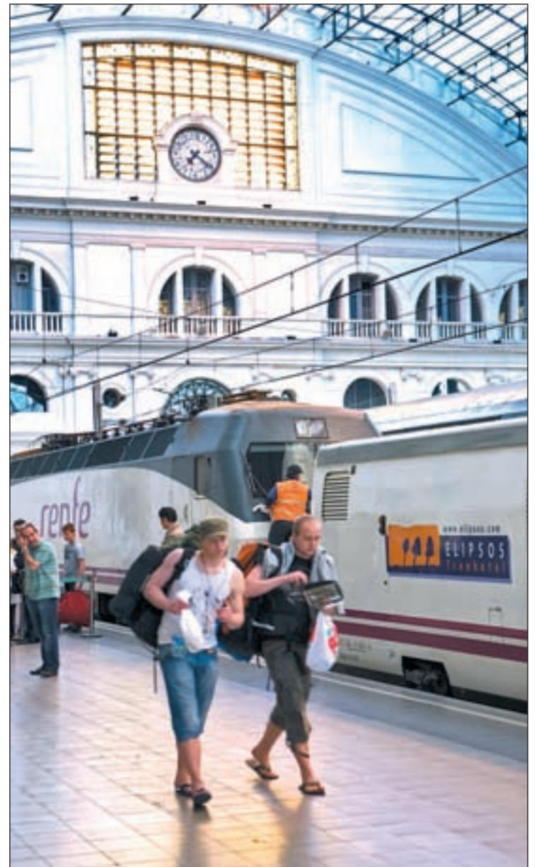
Dos viajeros extranjeros del Interrail en España

Dónde dormir es otra de las cuestiones que el viajero más tradicional cuestionaría de esta forma de viaje. Esterillas, parques, butacas y estaciones de tren eran clásicos aliados de los 'interraileros' en el pasado, pero la red de establecimientos como albergues o hostel destinados a este viajero mochilero ha creci-