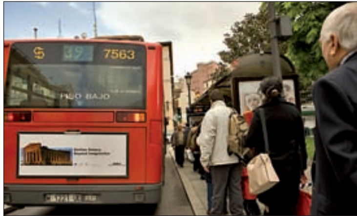
Viajeros esperan en una céntrica parada de autobús

Ecomovilidad señala además que la velocidad media comercial de la EMT, que se sitúa en 13 kilómetros por hora, mejoraría con iniciativas de este tipo, así