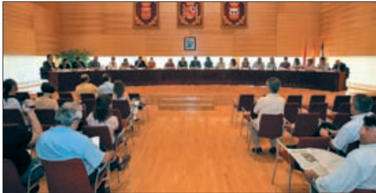
La nueva Corporación Municipal de Tres Cantos en su toma de posesión

No obstante, estas cifras no serán oficiales hasta que no se publiquen en el Boletín Oficial de la Comunidad de Madrid (BO-