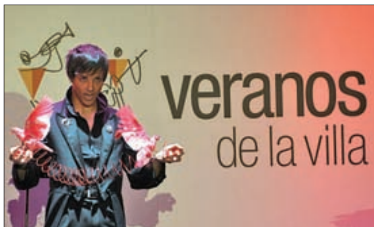
Una actuación en la presentación del Festival AYTO. MADRID

PROGRAMACIÓN CULTURAL PARA TODAS LAS SENSIBILIDADES