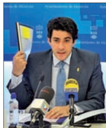
David Pérez OLMO GONZÁLEZ/GENTE

En este sentido, recuerdan que la Ley de Presupuestos Generales del Estado de 2011 limita el endeudamiento financiero permitido a los ayuntamientos al