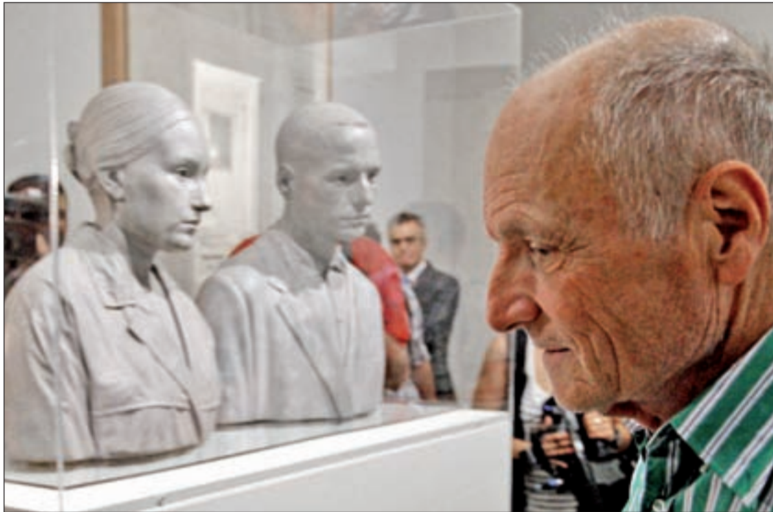
Antonio López asistió a la inauguración de la exposición del Museo Thyssen