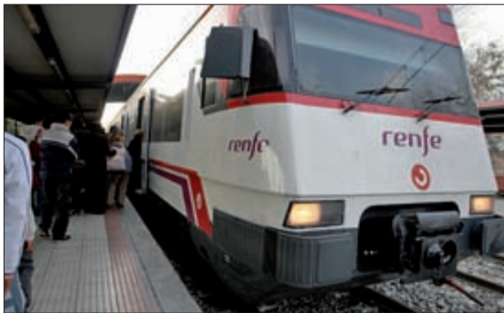
Un vagón de Cercanías como los de Santa Eugenia

2011, que está dotado con 4,9 millones de euros. Las obras se están desarrollando en los andenes y en la vía general de la estación de Santa Eugenia, que da servicio a las líneas C-2 y C-7 de Cercanías. Los trabajos consisten en el recricido de andenes y en el mantenimiento de vía y de los aparatos que permiten su ramificación y cruce con otras vías. Para llevar a cabo estas reformas se están realizando con maquinaria tanto ligera como pesada entre las 22 y las 8 horas. Está previsto que los trabajos concluyan en el plazo aproximado de un mes.