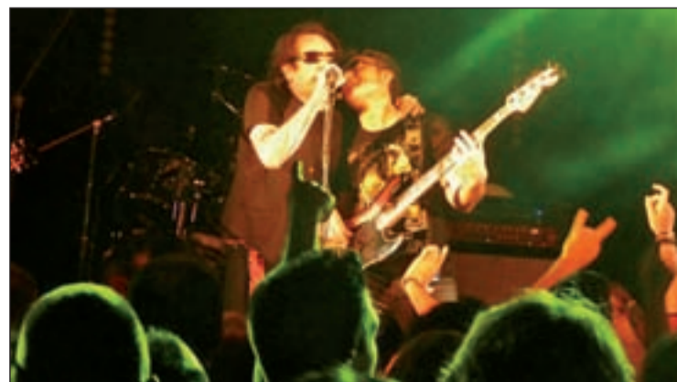
Concierto de Burnig, cuyos miembros son de La Elipa