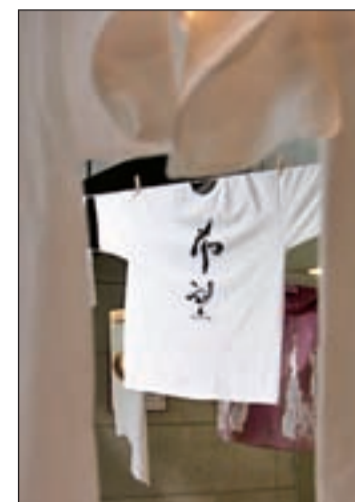
Diseño de Yoko Ono VISIBLES

Todo un icono de los setenta y todo un símbolo del amor y odio de una época. Yoko Ono ha brindado su arte a una exposición que se suma a las setenta actividades del Festival Visibles cuyo objetivo es la lucha contra el VIH, la sensibilización con las personas seropositivas y el fin de su discriminación. La artista japonesa, viuda de John Lennon, ha diseñado una de las camisetas que a través de mensajes e imágenes canaliza un mensaje de solidaridad y trabajo con el colectivo.