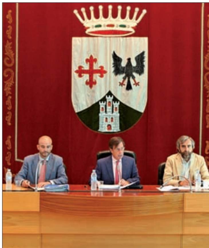
El pleno de Alcobendas aprobó su reingreso en la FEMP