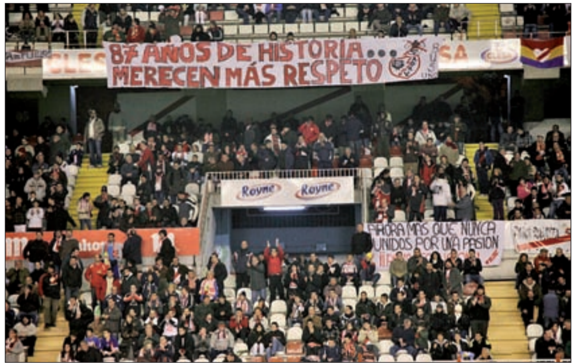
Pancarta reivindicativa en uno de los últimos partidos del Rayo Vallecano en su campo

laran en el interior del parque, la implantación de rutas a caballo, un tren ecológico turístico, un plan de mejora de la calidad del agua en los arroyos y manantiales, labores de limpieza, reforestación y rehabilitación de las instalaciones deportivas ubicadas en la Casa de Campo.