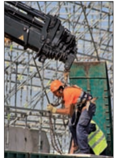
Escenario de Cuatro Vientos