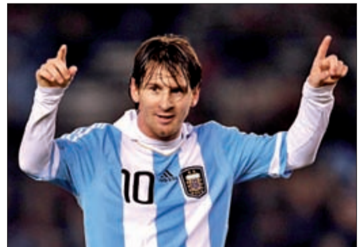
El delantero del Barcelona es una de las grandes atracciones

A miles de kilómetros de los estadios, pero con el mismo sentimiento que los aficionados que presencien los encuentros en directo, la comunidad sudamericana que reside en España tiene en Internet al mejor aliado para seguir con detalle el torneo. Por primera vez en la historia de la Copa América, el portal 'Youtube' emitirá en directo y gratuitamente los encuentros a través de su servicio de 'streaming'. Además de encontrar toda la información estrictamente deportiva, la Red también les ha servido como herramienta para organizar reuniones a través de foros para ver los partidos.