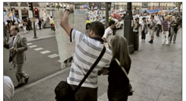
Turistas en el centro de Madrid

millones de turistas visitaron la ciudad en los doce últimos meses. Hay un pequeño descenso de nacionales y más extranjeros. Los 7.984.614 visitantes que ha recibido Madrid en los últimos 12 meses, son casi 530.000 turistas más que los recibidos en el año anterior, lo que implica un aumento del 7,1% interanual.