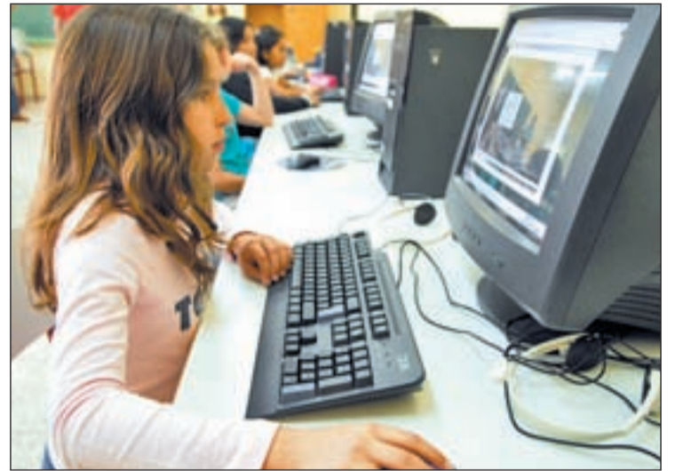
Una menor estudia en un aula de informática de su colegio

En concreto, el 23 por ciento de los alumnos españoles tiene un nivel muy bajo en comprensión lectora digital (nivel 1 e in-