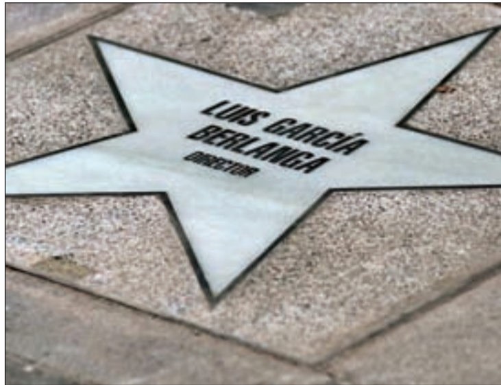
Las veinticinco estrellas ya brillan en la calle Martín de los Heros

Madrid respira cine por todos los poros de sus piel. Diversos datos y actuaciones reivindican su pasión por el séptimo arte. La ciudad concentra el 60 por ciento de la producción audiovisual del país, el 52 por ciento de su facturación, es el mayor mercado nacional y durante el pasado año los cines de la capital sumaron más de 21 millones de espectadores, con doce de las 25 salas entre las más taquilleras de España. El espacio urbano donde se tramitaron 5.000 rodajes durante el 2010 ha estrenado su particular Paseo de la Fama en la calle Martín de los Heros y un ciclo de cine clásico promovido por los Cines Verdi que ejemplifica el apetito cinematográfico de los madrileños, así como la implicación de los empresarios por la divulgación del séptimo arte.