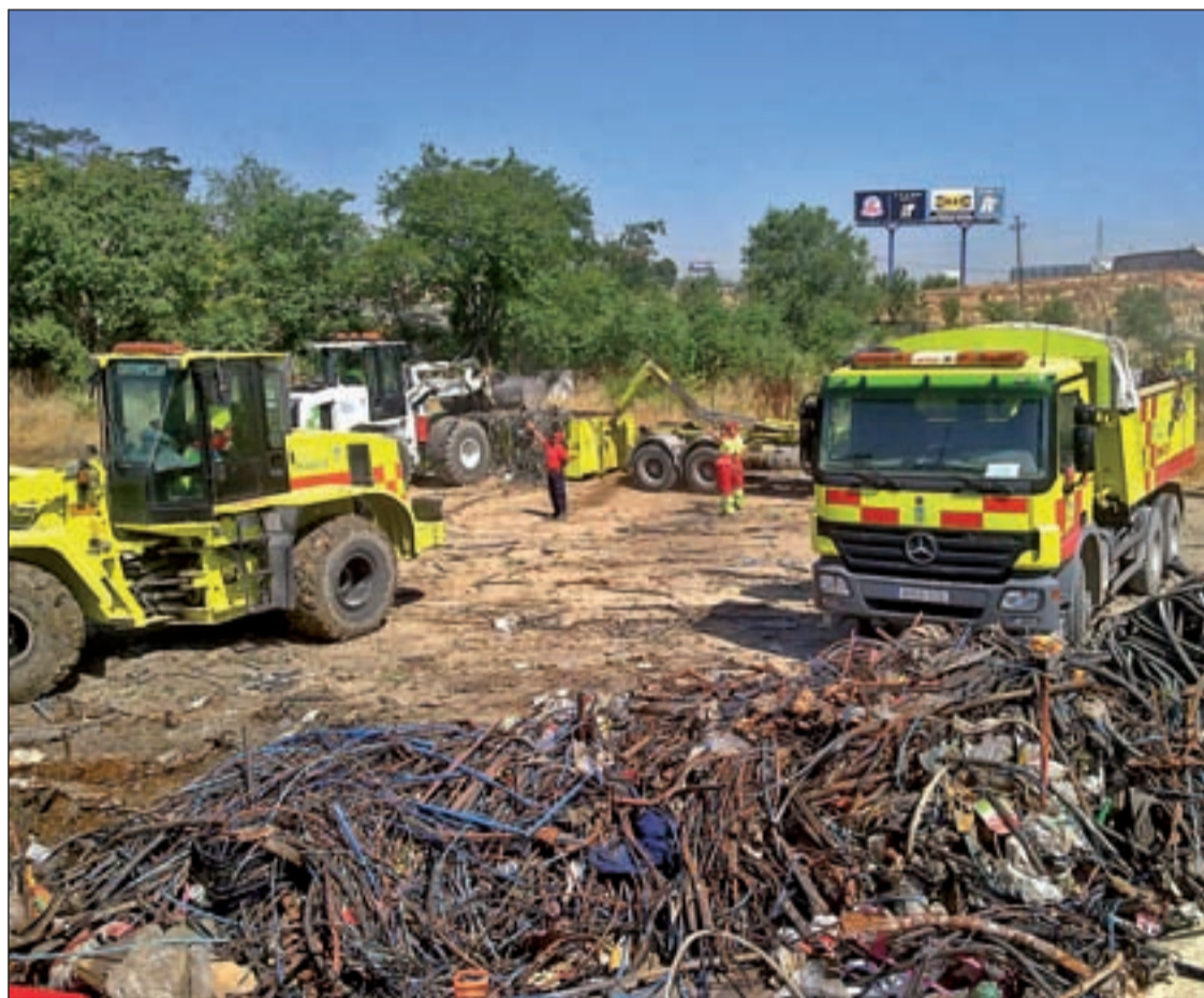
Maquinas y operarios se afanan en la limpieza AMIGOS DE LOS GITANOS RUMANOS DEL GALLINERO

Tras años de denuncias ciudadanas el Ayuntamiento ha comenzado un proceso de desratización e higiene en el poblado de la Cañada Real Pág. 5