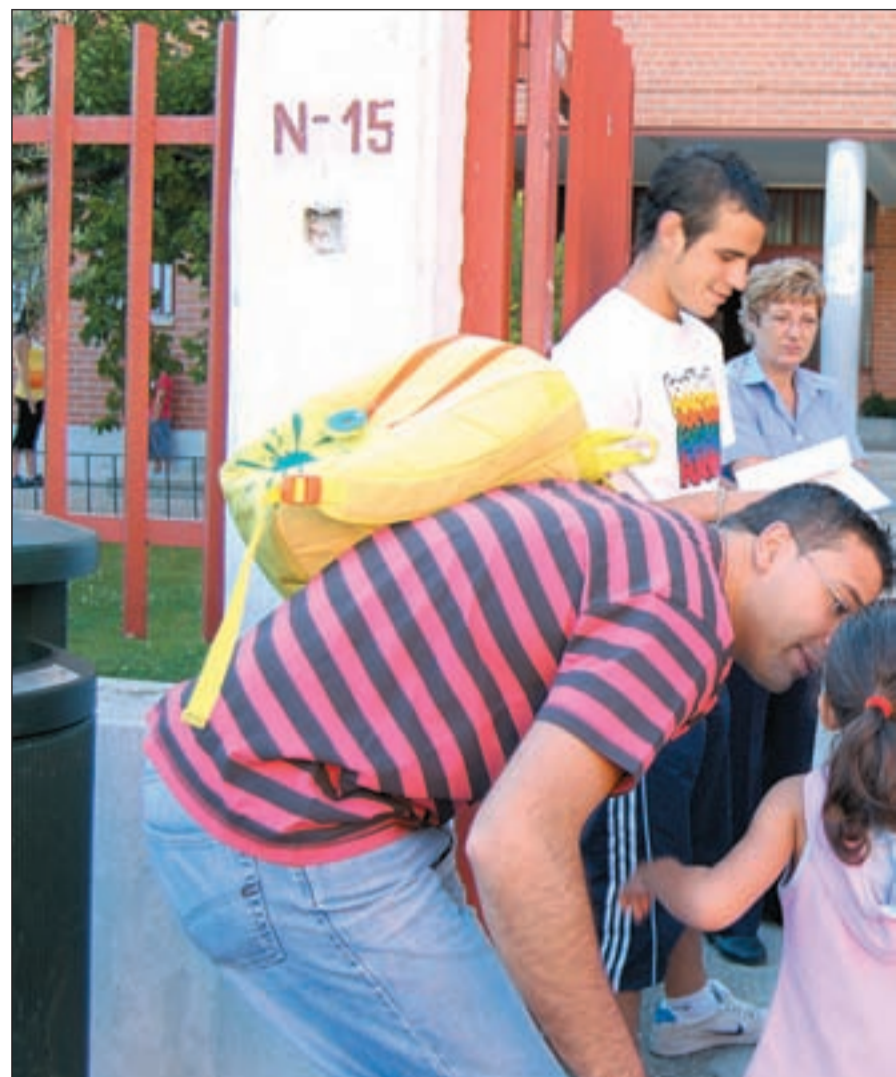
Unos niños entran en un campamento urbano tras acabar su curso lectivo

Si bien la situación económica y las llamadas a la austeridad de la presidenta regional hacen temer que no se verán grandes