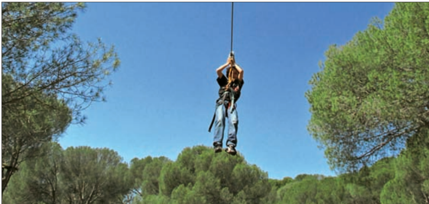
Los más aventureros podrán recorrer los 252 metros que posee

Antoine Saint de Exupéry, autor del libro 'El Principito', nació el 29 de junio de 1900 en Lyon (Francia).