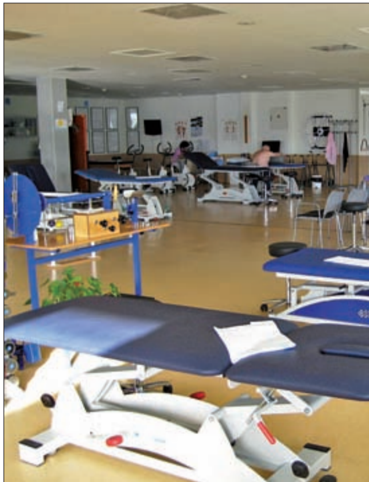
Gimnasio de rehabilitación del Infanta Leonor HOSPITAL INFANTA LEONOR

La tecnología es una constante en nuestras vidas. Pero sus aplicaciones van generando nuevas ventajas para todos. El Hospital público Infanta Leonor de Vallecas ha presentado estos días un curioso informe acerca de la aportación de los videojuegos en el proceso de recuperación de sus pacientes. En concreto, se trata del uso de una videoconsola de última generación, la popular Wi Fit, como material para la rehabilitación de dolencias generalmente de origen traumático. El Servicio de Rehabilitación de este centro sanitario complementa sus tradicionales ejercicios y tratamientos con el uso lúdico de este dispositivo digital. En el desglose se aprecia que el 87,5 por ciento de las patologías tratadas con esta tecnología pertenecen a traumatología, ya sean quirúrgicas como con tratamiento conservador, la mayoría de rodilla, seguidas de articulaciones como la cadera o el tobillo. Mientras, el 6,25 por ciento son de origen neurológico y otro 6,25 por ciento de origen vestibular.