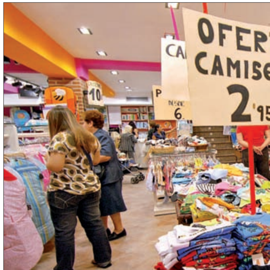
Los consumidores se ven 'bombadeados' por multitud de ofertas durante estas fechas