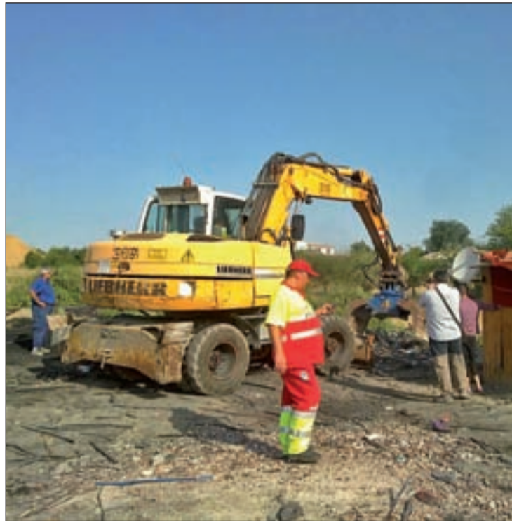
Trabajos de limpieza en el Gallinero AMIGOS DE LOS GITANOS RUMANOS GALLINERO

Del mismo modo, se contempla una triple desratización. La primera fase de esta erradicación de las ratas, que campaban a sus anchas en un lugar donde viven numerosos niños, ya se llevó a cabo el pasado día 20, pero se repetirá una vez concluida la limpieza para volver a ser efectuada varias semanas después con objeto de garantizar que el Galline-