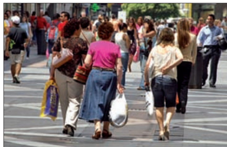
Muchos establecimientos no respetan las reglas

La UCE insiste en que hay que diferenciar las rebajas de aquellas ofertas y promociones que hacen los comercios para incrementar las ventas de temporada, "modalidades de descuento legales y lícitas, pero que no hay que confundir con las rebajas".