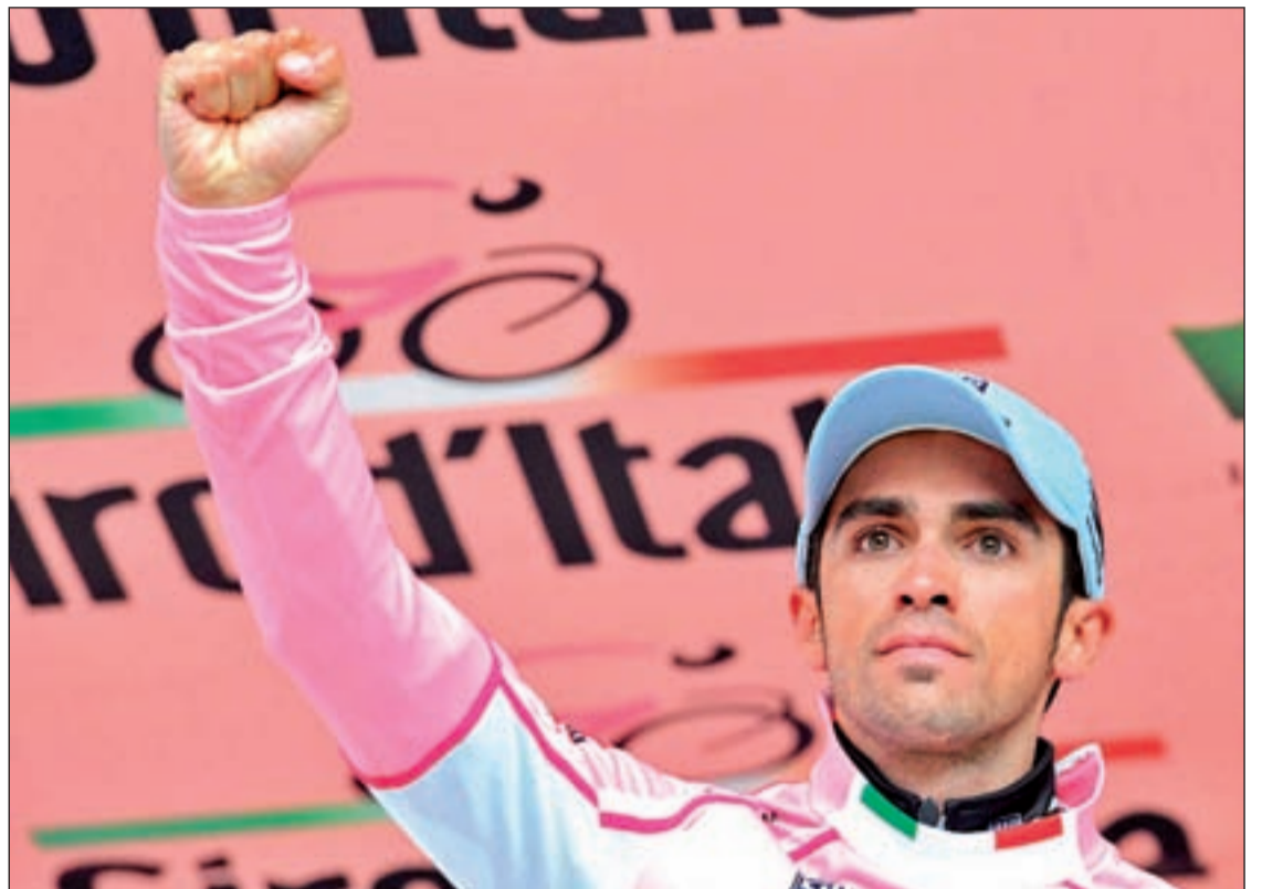
El ciclista madrileño admite que llega algo cansado tras su exitosa participación en el Giro de Italia

'El Terrible' afronta la que puede ser una de sus últimas oportunidades para añadir un Tour a su ya brillante palmarés. Con 33 años, el italiano renunció al Giro para llegar con fuerzas a la ronda gala.