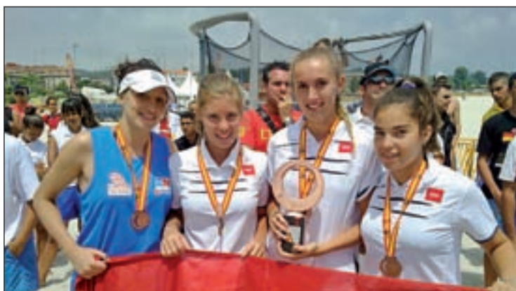
Las representantes madrileñas, con la medalla conquistada

TERCER PUESTO DE LA SELECCIÓN CADETE FEMENINA EN EL CAMPEONATO NACIONAL