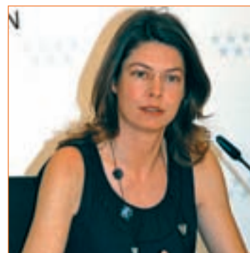
La consejera Lucía Figar

ción y nutrición. Además, este curso ha comenzado el Programa de Salud Integral en 7 colegios, de forma piloto cuyo objetivo es desarrollar hábitos de vida saludable que puedan contribuir a una salud cardiovascular y a una buena calidad de vida.