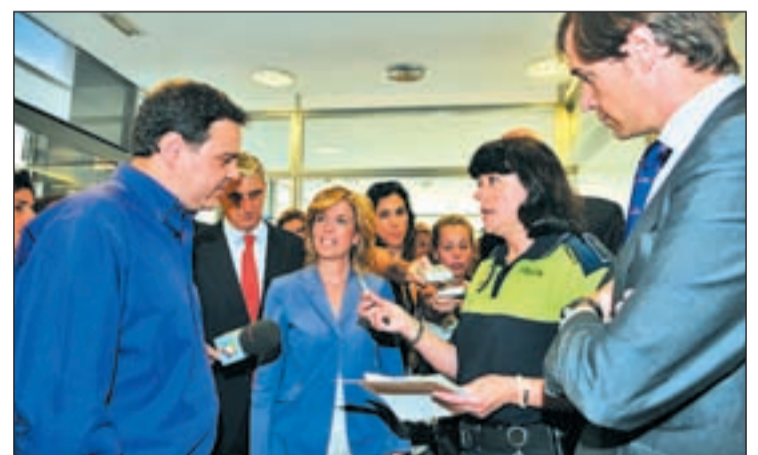
Un vecino entrega sus llaves a la Policía Local

Durante el acto, en el que también se visitó la Comisaría Centro de la localidad, Plañiol hizo hincapié en la necesidad de tomar unas sencillas precauciones de seguridad antes de irse de vacaciones y colaborar con las autoridades municipales en todo momento. Así, pidió a los ciudadanos que ante el inicio