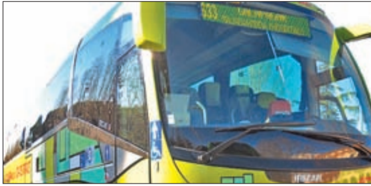
Imagen del autobús que recorrerá el trayecto de la línea 633

ERA UNA DE LAS REIVINDICACIONES HISTÓRICAS DE LOS VECINOS