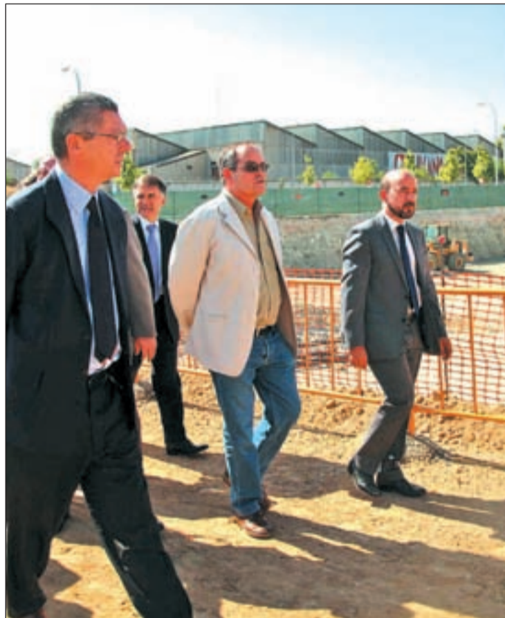
Gallardón en la parcela de Vicálvaro

“Gracias a esta colaboración público-privada, la ciudad dispondrá de un centro de referencia para la necesaria actualización y reciclaje de los profesionales de la construcción”, señaló el alcalde. Ruiz-Gallardón añadió además que este equipamiento docente se suma al esfuerzo que hace la Agencia para