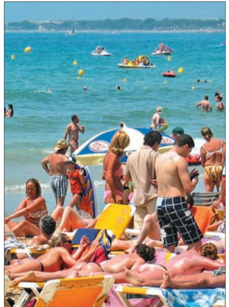
EL TURISMO DE SOL Y PLAYA NO DECAE. Las vacaciones de sol y playa siguen siendo las más demandadas. Las costas e islas españolas son los lugares más solicitados dentro del país, mientras que a nivel internacional destacan los viajes al Caribe.

Blasco destacó el "crecimiento elevado" en la recepción de turistas, que es "lo que nos interesa para el PIB", que irá desde del 5 al 12 por ciento, según las comunidades autónomas, y también de los ingresos, ya que la gente "gasta más". En este sentido, indicó que, debido a la situación que están viviendo países como Túnez, Egipto o Marruecos, "estamos recibiendo un turismo que quizás no hubiera pensado venir", y que hay que cuidar a estos turistas para no perderlos y que vuelvan el año próximo. "Tenemos que aprove-