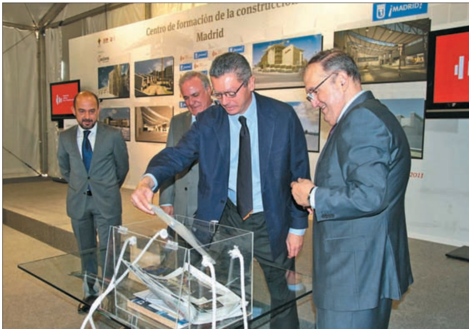
Alberto Ruiz-Gallardón prepara la tradicional 'cápsula del tiempo' durante la colocación de la primera piedra del edificio AYTO. MADRID

Esta escuela, construida sobre una parcela municipal, capacitará a 30.000 alumnos cada año · El edificio contará con talleres de electricidad, fontanería o soldadura y simulación de riesgos Pág. 8