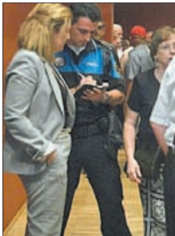
La edil presuntamente agredida

Por su parte, el alcalde del municipio, David Pérez, indicó que la crispación entre la ciudadanía "es creciente según van sa-