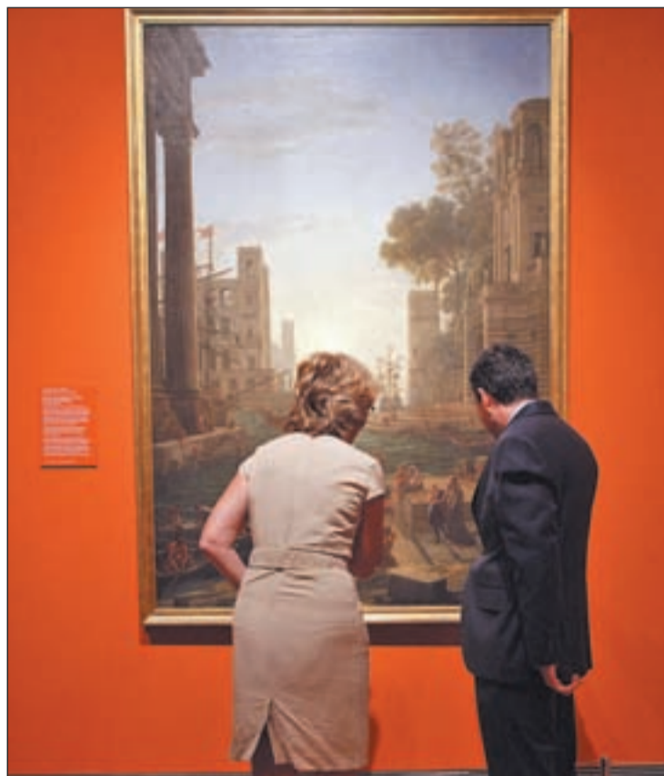
Esperanza Aguirre inauguró la exposición este lunes

La muestra, inaugurada por la presidenta de la Comunidad de Madrid, Esperanza Aguirre, aborda el nacimiento del género del paisaje hasta su desarrollo, con sus protagonistas y con la ciudad de Roma de fondo. Son obras que dan cuenta de todos los temas que trataron figuras de capital importancia: Annibale Carracci, padre del nacimiento del género; Claudio de Lorena y