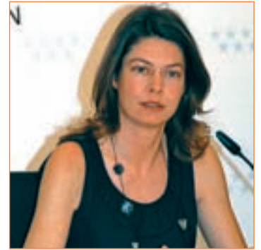
La consejera Lucía Figar

ción y nutrición. Además, este curso ha comenzado el Programa de Salud Integral en 7 colegios, de forma piloto cuyo objetivo es desarrollar hábitos de vida saludable que puedan contribuir a una salud cardiovascular y a una buena calidad de vida.