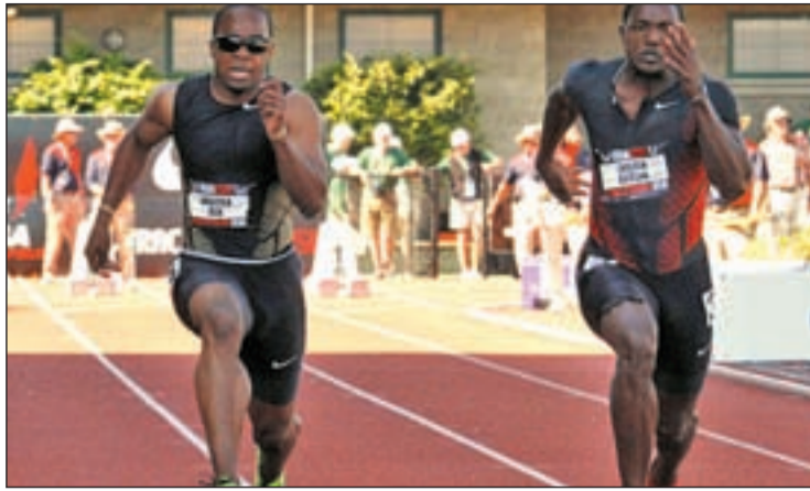
El velocista estadounidense, uno de los favoritos en los 100 metros

ATLETISMO SE CELEBRA ESTE SÁBADO EN MORATALAZ