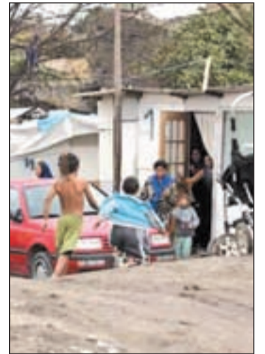
Niños en la Cañada E.P.

"Hay que buscar una solución global a la Cañada, tenemos que sacar a esa gente de ahí porque no se puede vivir como están vi-