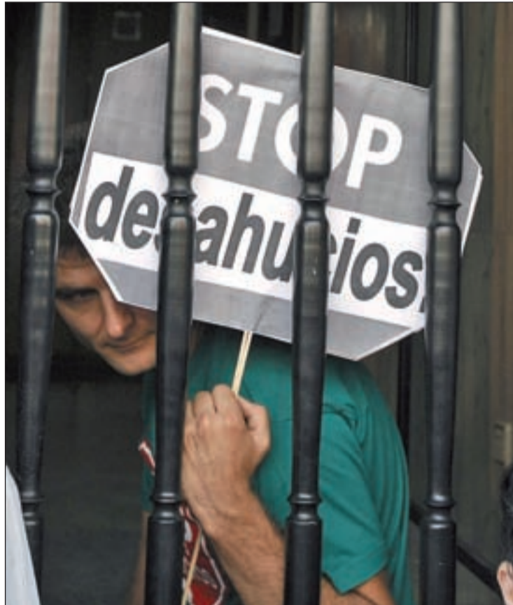
Uno de los ciudadanos que protestaron contra el desahucio

El portavoz de la Plataforma de Afectados por la Hipoteca, Eloi Morte, aseguró que este desahucio es "muy grave" por la situación que atraviesa la familia que, según explicó, "se encuentra en imposibilidad de pagar las cuotas hipotecarias desde 2008". Al no poder hacer frente a la hipoteca, la afectada solicitó ayuda a los Servicios Sociales que, según