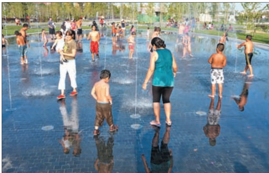
Los niños juegan con el agua en el Parque de Arganzuela

El Auditorio de Entrevías se convertirá el próximo sábado 9 de julio en un festival de solidaridad. Los amigos de Marisol Tituaña han organizado este evento artístico para recaudar fondos que permitan que la familia de esta mujer ecuatoriana asesinada por su pareja pueda repatriar su cuerpo. A partir de las cinco y media de la tarde grupos como Ballet Quitus, grupos Apelo y Yavirak, Danza Raíces de Cayambe o la Banda de pueblo 'Virgen del Quinché' aportarán su colaboración para animar en la recaudación de fondos que permita que Marisol descanse en Ecuador, su país de origen.